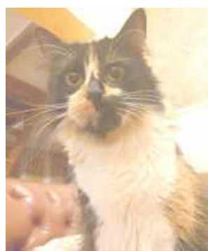
Mira, Izabella Malon