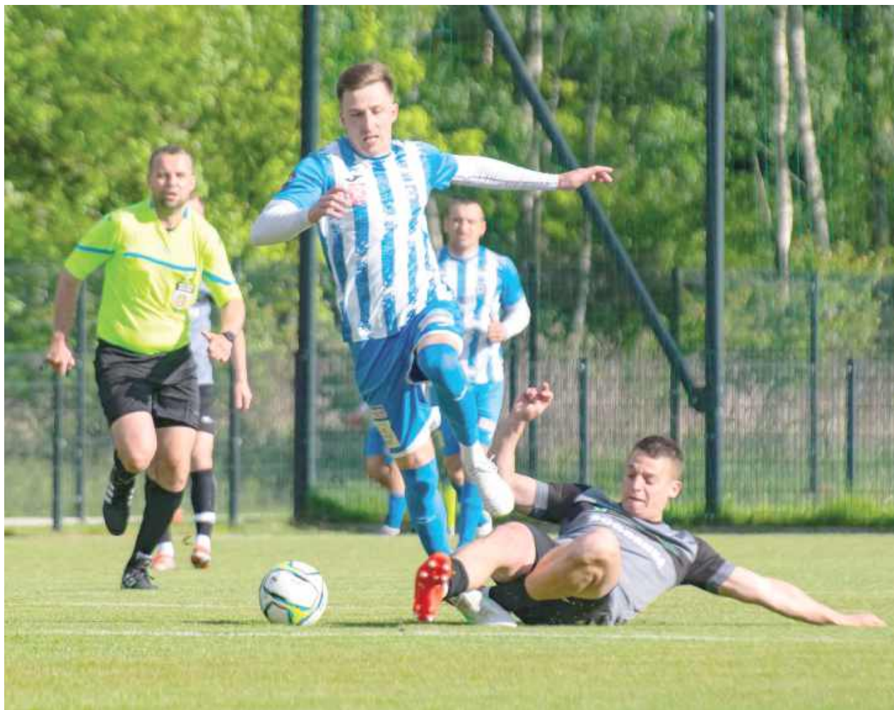
Na boisku w Cycowie nie brakowało walki, a w końcówce także niepotrzebnych nerwów spowodowanych kontrowersyjnymi decyzjami sędziowskiego