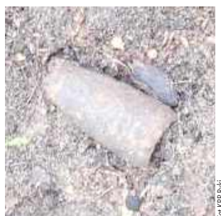
Mieszkaniec powiatu ryckiego podczas spaceru w lesie w pobliżu Osiedla Stawy w Dęblinie zauważył metalowy przedmiot, który przypominał wyglądem granat moździerzowy