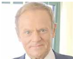
Donald Tusk (PO), premier RP

O bardzo dobrym wyniku może mówić Sławomir Mentzen - według late poll osiągnął wynik 14,5 proc. głosów. Na czwartym miejscu spore zaskoczenie, czyli Grzegorz Braun z rezultatem na poziomie 6,3 proc., a dalej - zdaniem wielu obserwatorów - największy przegrany wyborów Szymon Hołownia z 4,9 proc. głosów. Tuż za nim dwójka lewicowych polityków: Adrian Zandberg - 4,8 proc. oraz Magdalena Biejat - 4,1 proc.