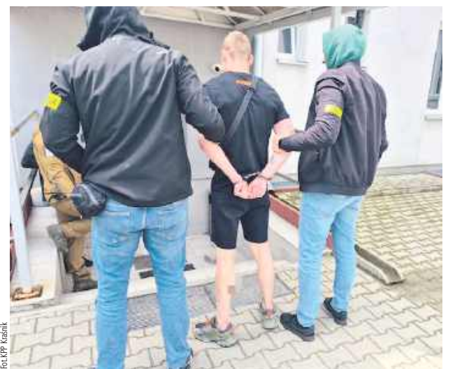
Od pewnego czasu ukrywał się na terenie Lublina, gdzie zmieniał bardzo często miejsce zamieszkania

Kiedy „kraśnicy poszukiwacze” namierzili jego aktualne miejsce pobytu, mężczyzna postanowił nie ułatwiać im zadania. Rzucił się do ucieczki i kontynuował ją po dachach pobliskich budynków. Dzięki