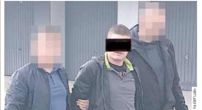
Poszukiwany mężczyzna trafił już za kratki, gdzie odsiedzi zasądzone kary pozbawienia wolności, czyli prawie dwa lata

Lublin: 26-letni mężczyzna poszukiwany był trzema listami gończymi. Lubelscy „łowcy głów” namierzili go na Dzielnicy Bronowice w Lublinie. Do odsiadki ma prawie dwa lata.