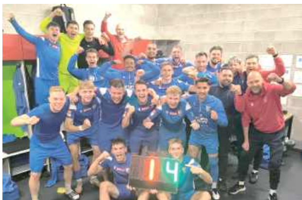
Wisła wywalczyła szalenie ważne punkty w kwestii walki o utrzymanie w II lidze