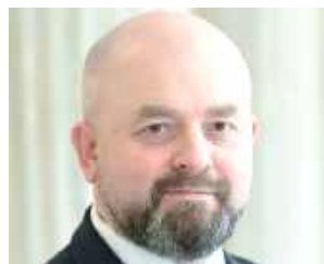
Bartłomiej Pejo (Konfederacja), poseł na Sejm RP