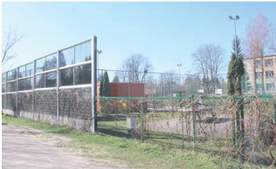
Nawet ustawienie ekranów akustycznych, na które miasto wydało kilkaset tysięcy złotych, nic nie dało. Urzędnicy walczą w sądzie o uchylenie wyroku, by popołudniami obiekt znów zaczął tętnić życiem

Sprawa boiska przy puławskiej podstawówce ciągnie się już od kilku lat. Popołudniami nie mogą korzystać z niego dzieci z osiedla, bo zakazuje tego wyrok sądu, który stanął po stronie małżeństwa mieszkającego w sąsiedztwie szkoły. Małżonkom przeszkadzał hałas i światło z reflektorów oświetlających obiekt, na którym wieczorami trenowała młodzież. Miasto ustawiło ekrany akustyczne z myślą, że to rozwiąże problem, a następnie zezwoliło na użytkowanie boiska. Niestety za złamanie zakazu użytkowania sąd nałożył na miasto 5 tys. zł grzywny, zamiennie na 5 dni aresztu. Prezydent