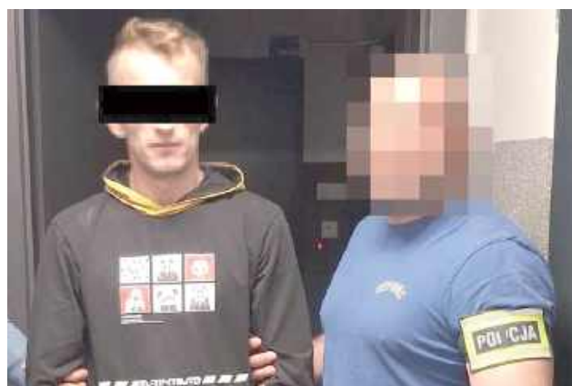
Sąd Rejonowy w Opolu Lubelskim zastosował wobec 30-latka tymczasowy areszt