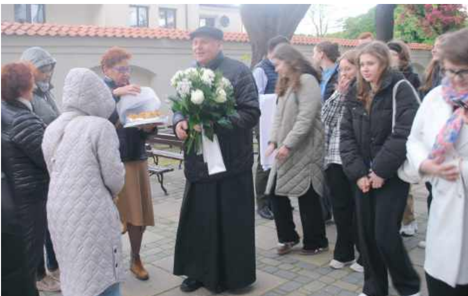
Kwiaty i słodki prezent od parafianek