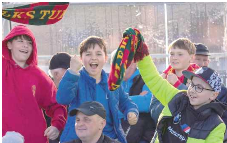
Młodzi kibice Tura mieli wiele powodów do radości. Ich ulubieńcy wygrali pewnie i przekonująco