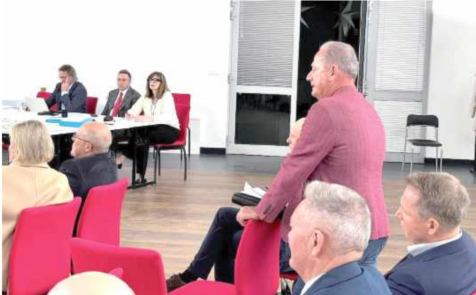
Swoje uwagi wnoszą byli włodarze gminy Niemce