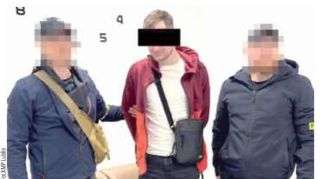
Na wniosek śledczych został tymczasowo aresztowany na trzy miesiące

- Operacyjni od razu postanowili zweryfikować zgłoszenie i zaplanowali zatrzymanie. W czasie obserwacji zauważyli samochód marki Audi, którym miał poruszać się 28-latek. W okolicy miejsca zamieszkania mężczyzny zdecydowali o zatrzymaniu. Mieszkaniec Beżyc był kompletnie zaskoczony. Nie spodziewał się interwencji