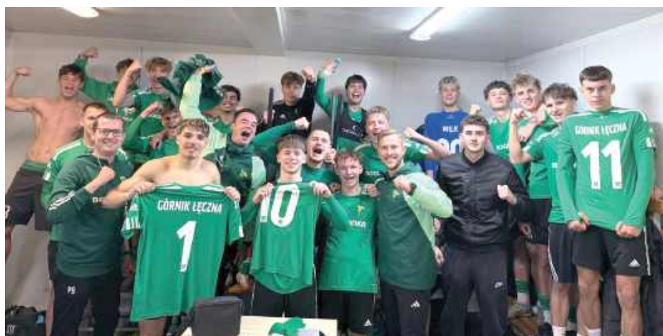
Łęcznianie ograli Orleńka i zrobili duży krok ku utrzymaniu w IV lidze