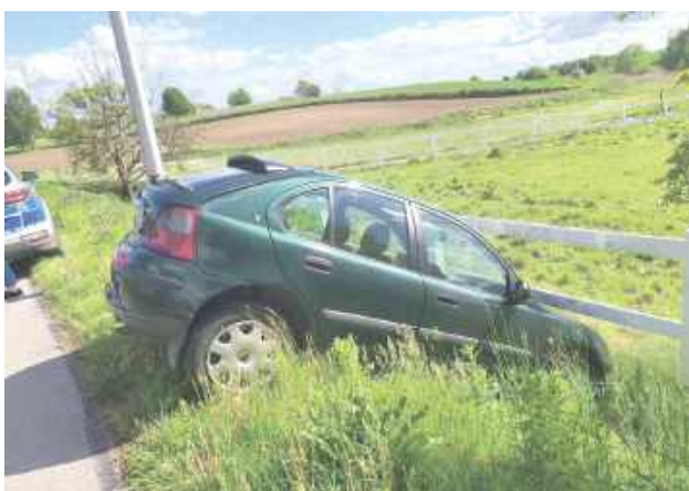
50-latek po tym, jak wjechał do rowu, wysiadł z samochodu i chciał oddalić się z miejsca zdarzenia

Wszystko działo się w czwartek, 15 maja w Sadurkach pod Nałęczowem. Nietrzeźwy kierowca osobówki został ujęty przez policję dzięki zgłoszeniu świadka jego poczynania. Mężczyzna, jadąc Roverem, zjechał z drogi do rowu i uderzył w ogrodzenie. Następnie wysiadł z samochodu i, jak gdyby nic, miał zamiar się oddalić. Na szczęście funkcjonariusze z posterunku w Nałęczowie w porę dotarli na miejsce i ujęli sprawcę kolizji. Okazał się nim 50-letni mieszkaniec gminy Nałęczów. Wydmuchał ponad 3 promile. Mundurowi zatrzymali go. Gdy wytrzeźwieje, usłyszy zarzuty kierowania pojazdem mecha-