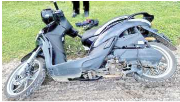
Kierujący jednośladem przewrócił się i wpadł do przydrożnego rowu

Z informacji wynikało, że kierujący fiatem mężczyzna najechał na kierującego motocyklem 62-latkę, który w wyniku uderzenia przewrócił się do przydrożnego rowu. Kierujący fiatem mężczyzna nie zatrzymał się, tylko odjechał z miejsca zdarzenia,