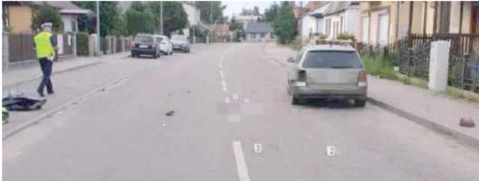
Oględziny na miejscu wypadku. Przed przybyciem służb ktoś zabrak motocykl...

24-latek był pijany, miał ponad 2,5 promila alkoholu w organizmie. Został zatrzy-