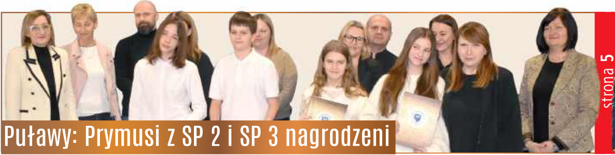
Puławy: Prymusi z SP 2 i SP 3 nagrodzeni