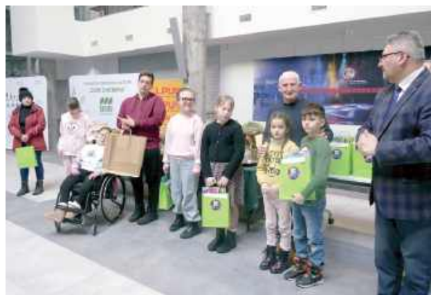
Do tegorocznej edycji konkursu na najładniejszą szopkę zgłoszono 18 prac. Wręczenie nagród zorganizowano w POK „Dom Chemika”