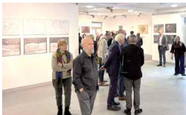
Wystawa będzie dostępna do 8 marca