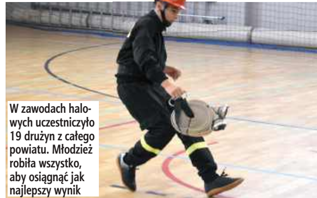
W zawodach halowych uczestniczyło 19 drużyn z całego powiatu. Młodzież robiła wszystko, aby osiągnąć jak najlepszy wynik