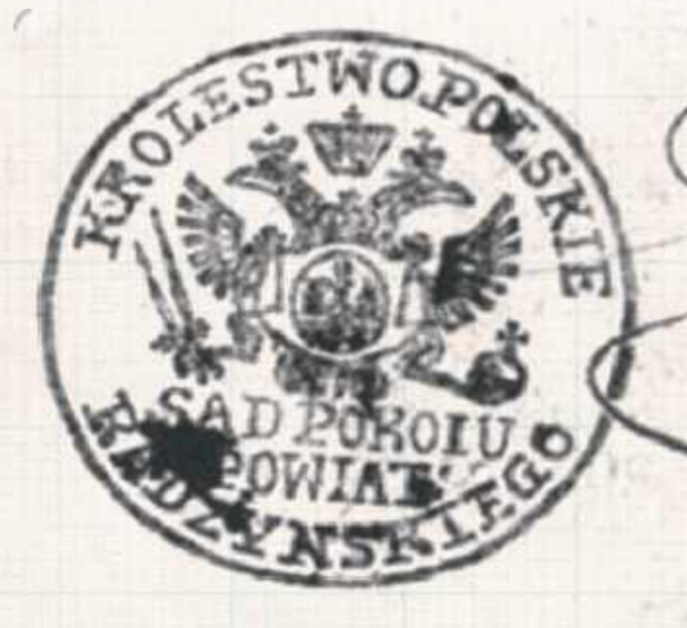
Pieczęć Sądu Pokoju powiatu radzyńskiego z czasów Królestwa Polskiego