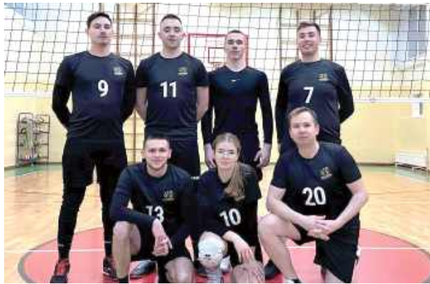
Zespół Czarnych Karmanowice zaczął rozgrywki od porażki z Lacosanostrą, czyli mistrzem ostatniej edycji zmagania pod siatką

Na otwarcie kolejki obrońcy tytułu, Lacosanostra, zmierzili się z CKM Czarnymi Karmanowice. Spotkanie od pierwszych akcji stało na wysokim poziomie i było prawdziwą wizytówką ligi. Czarni rozpoczęli odważnie, wygrywając pierwszego seta i przez długi czas narzucając mistrzom swoje warunki. Ostatecznie jednak doświadczenie Lacosanostry wzięło górę – skuteczna gra w decydujących mo-