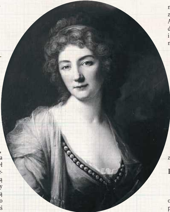
Portret Maryni Czartoryskiej (Marii Wirtemberskiej) pędzla Lampiego

Józef II-gi, będąc w Lwowie, parokrotnie rzekł publicznie do