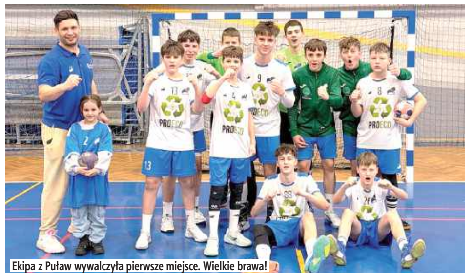
Ekipa z Puław wywalczyła pierwsze miejsce. Wielkie brawa!