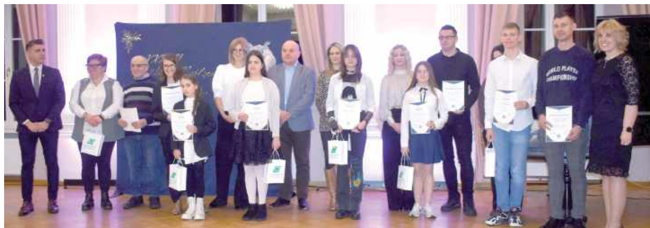
W ubiegłym tygodniu w SP nr 2 i SP nr 3 odbyło się uroczyste wręczenie nagród dla uczniów z najwyższą średnią ocen w pierwszym semestrze pt. Na zdjęciu gala „Nasi Najlepsi” SP 2, zorganizowana w Pałacu Czartoryskich

Uczniowie kl. IV-VIII Szkoły Podstawowej nr 2 i Szkoły Podstawowej nr 3 w Puławach wzięli udział gali „Nasi Najlepsi”. Były dyplomy, podziękowania i gratulacje.