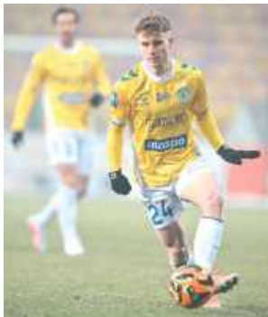
Porażka Motoru przyczyniła się do awansu Jagielloni na pozycję lidera tabeli