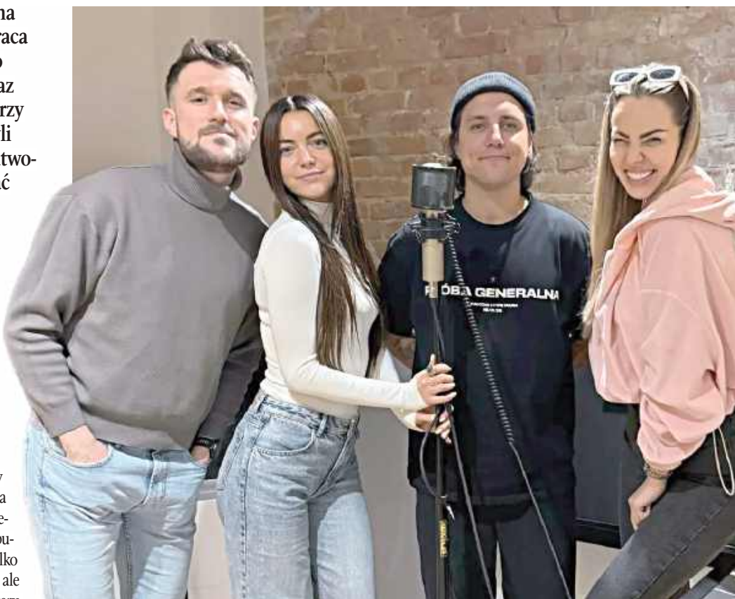
Defis, MiłyPan oraz Topky znowu razem

Ich poprzedni wspólny utwór „Jeden taniec jedna noc” w momencie premiery zdobył ogromną popularność - teledysk nie tylko bijąc rekordy wyświetleń, ale stał się jednym z charakterystycznych brzmień gatunku