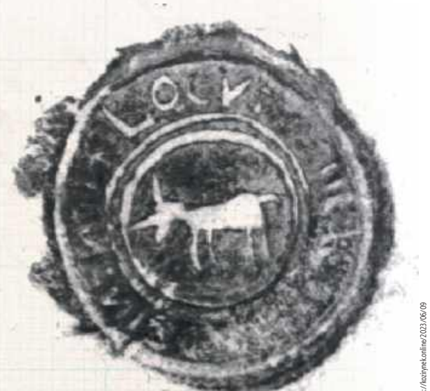
Pieczęć Radzyna z XVIII wieku