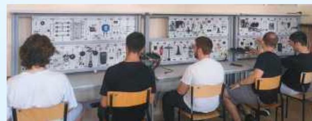
Zamość chce zachęcić młodych ludzi do edukacji w szkołach zawodowych

Zamość staje na głowie, żeby uratować kształcenie zawodowe i zachęcić młodych mieszkańców do tych szkół. Zakończyła się dostawa wyposażenia do pracowni szkolnych, do tego staże zawodowe, a nawet pokrycie kosztów dojazdu do projektu trwa.