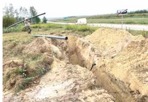
W Gminie Aleksandrów rozpoczęły się prace nad rozbudową sieci wodociągowej na ul. Słonecznej

W Gminie Aleksandrów rozpoczęły się prace nad rozbudową sieci wodociągowej na ul. Słonecznej. Projekt ma na celu poprawę jakości infrastruktury wodociągowej, jednak pełna realizacja inwestycji zależy od porozumienia z właścicielami nieruchomości, przez które ma przebiegać sieć.