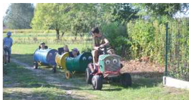
Jedną z największych atrakcji była kolejka dla dzieci