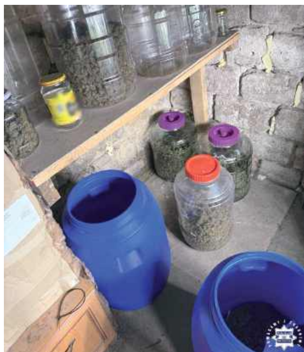
Nielegalne specyfiki oraz rośliny trafiły do laboratoryjnych badań, a mężczyzna został zatrzymany

Z ustaleń wynikało, że mężczyzna w miejscu swojego zamieszkania może posiadać narkotyki i uprawiać nielegalne rośliny. Funkcjonariusze swoje przypuszczenia postanowili sprawdzić w minioną środę. Wtedy to złożyli służbową wizytę na posesji 32-latką. Jak się okazało, ich ustalenia były trafne, bowiem w pomieszczeniach mieszkalnych i gospodarczych zabezpieczyli