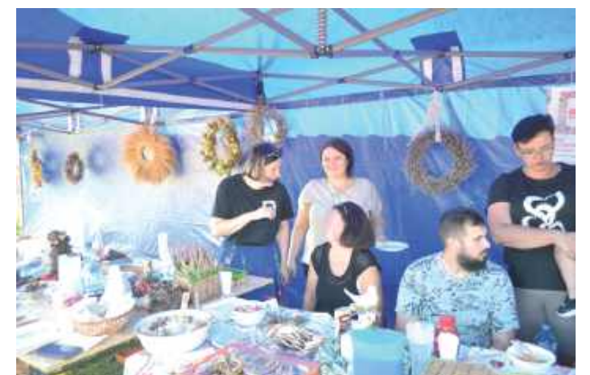
Mieszkańcy wraz z zaproszonymi gośćmi wspólnie biesiadowali przy stołach