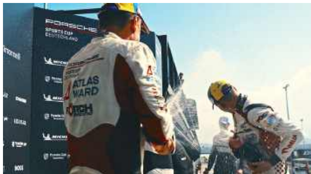
To jedno z ujęć zapowiadających serial z kierowcą z Biłgoraja w roli głównej

„The Community of Speed – Porsche” to sześcioczęściowy dokumentalny serial, który pokazuje, jak jedna marka samochodowa stała się czymś więcej – ruchem kulturowym, estetyką życia i przestrzenią emocji. Porsche to dziś jedna z niewielu marek, która łączy fanów motosportu, mi-