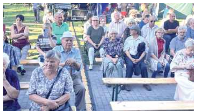
Impreza cieszyła się sporym zainteresowaniem