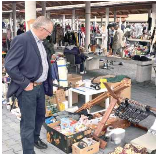
Każdy znalazł coś dla siebie - od książek po drobiazgi, które mogły odmienić wnętrze