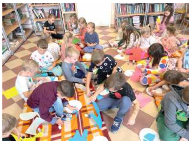
W Aleksandrowie wygrała kreatywność!

Z okazji Dnia Kropki uczniowie Koła Przyjaciół Biblioteki oraz