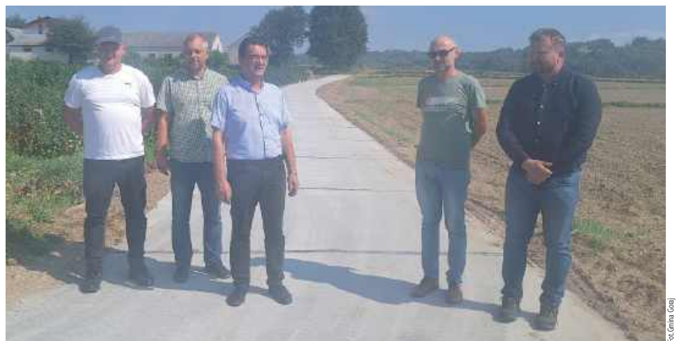
Gmina Goraj zakończyła realizację trzech ważnych inwestycji drogowych, mających na celu poprawę infrastruktury komunikacyjnej w regionie. W ramach prac modernizacyjnych przebudowane zostały drogi w miejscowościach Zastawie oraz Hosznia Ordynacka

Gmina Goraj zakończyła realizację trzech kluczowych inwestycji drogowych, które znacząco poprawią infrastrukturę transportową w regionie.