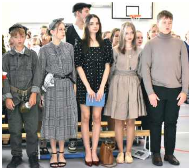
Uczniowie Zespołu Szkół w Turobinie uczcili 86 rocznicę agresji ZSRR na Polskę