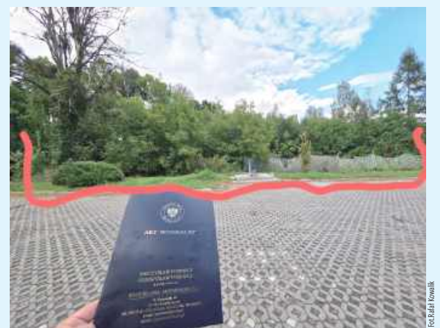
Dzięki zakupionej działce wkrótce ma powiększyć się przycmentarny parking w Szczębrzeszynie

- Podpisałem akt notarialny i dokonaliśmy zakupu działki przy cmentarzu parafialnym. Naszym celem jest stworzenie oraz powiększenie parkingu, aby zapewnić więcej miejsc postojowych i ułatwić odwiedzającym swoich bliskich dostęp do cmentarza. Serdeczne podziękowania kieruję do Radnych,