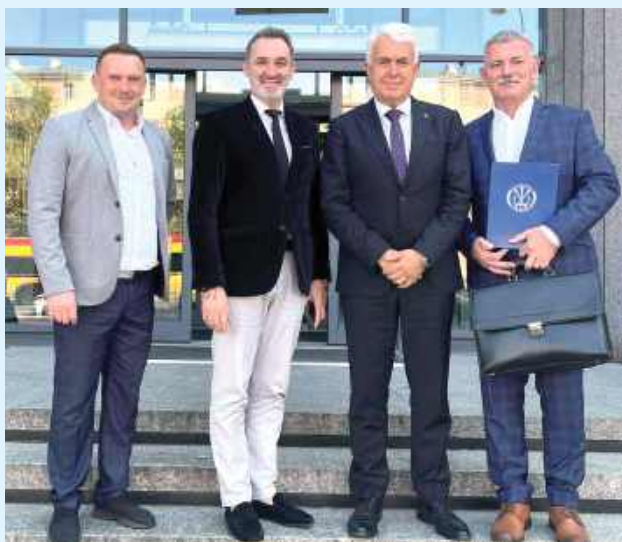
Przedstawiciele Akademii Zamojskiej szukają wsparcia w Ministerstwie Obrony Narodowej

Z inicjatywy posła z Zamościa doszło do spotkania z przedstawicielem kierownictwa Ministerstwa Obrony Narodowej, w celu przedstawienia konkretnej oferty