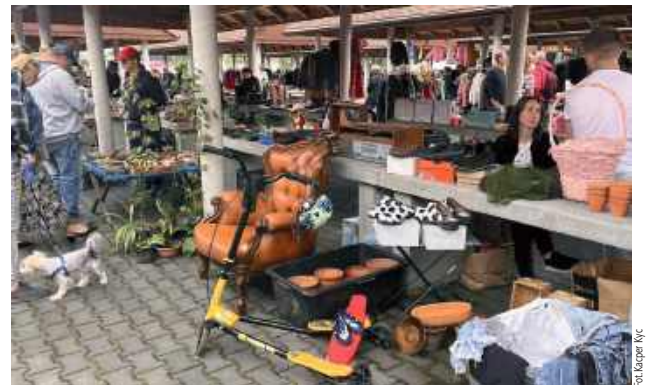
Tłum odwiedzających wypełniał teren garażówki radością i ciekawością