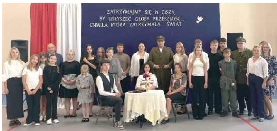
Podczas szkolnej uroczystości społeczność szkoły oddała hołd ofiarom radzieckiej agresji i przypomniała, jak ważna jest pamięć o tamtych wydarzeniach

Uczniowie Zespołu Szkół w Turobinie uczcili 86 rocznicę agresji ZSRR na Polskę.