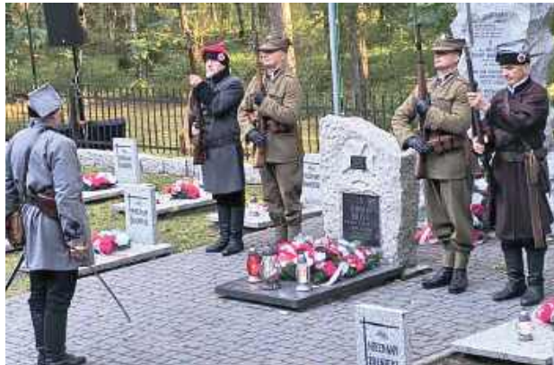
Biłgorajska Grupa Rekonstrukcyjna Powstania Styczniowego 1863 brała udział w obchodach

13 września 1939 roku niemieckie samoloty zaatakowały polskie wojsko w rejonie Banach, w wyniku czego wielu żołnierzy zostało rannych, natomiast 15 września w godzinach przedpołudniowych 11 pułk piechoty z 23 dywizji piechoty zaatakował i rozbił niemiecki oddział kolarzy poruszający się od strony Ha-