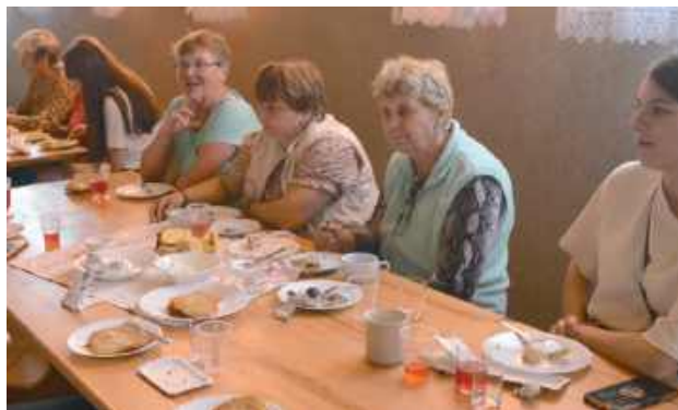
Mieszkańcy Lipin degustowali się w daniach sporządzonych z ziemniaków

20 września br. w Lipinach Górnych - Borowinie odbyło się wydarzenie pt. „Dzień Ziemniaka”