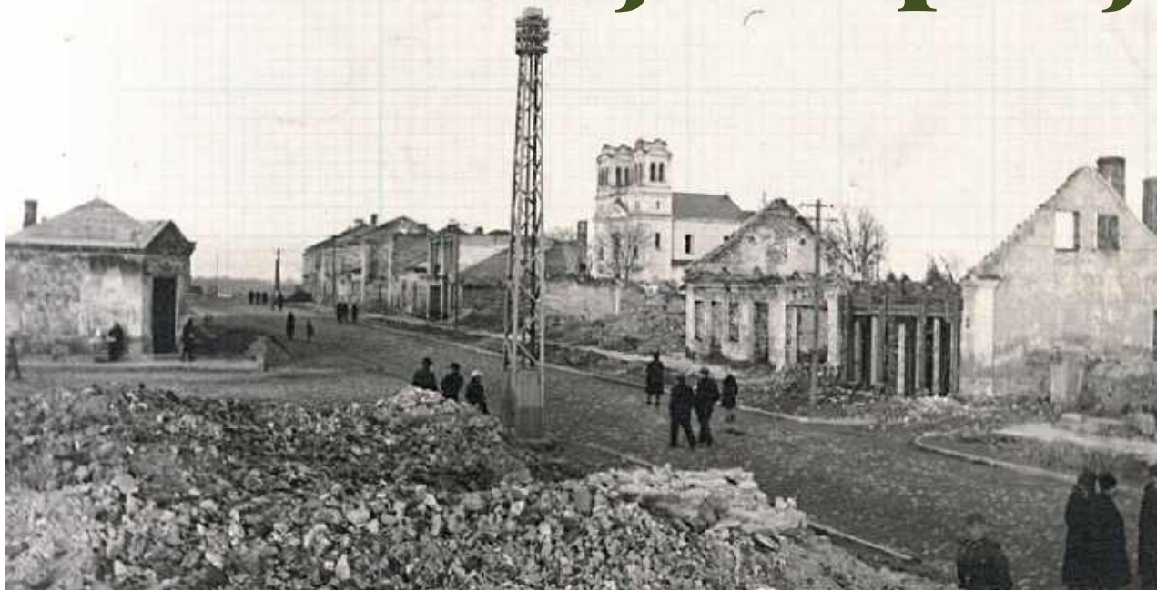
Biłgoraj w 1939 roku obok Janowa Lubelskiego był najbardziej zniszczonym miastem w województwie lubelskim

W dniach 14-17 września 1939 roku w okolicach Biłgoraja toczono ciężkie walki. 14 września miasto zostało zbombardowane przez niemieckie lotnictwo Luftwaffe, mimo obrony polskiej artylerii przeciwlotniczej. W okolicach pojawiały się jednostki Armii „Kraków” i „Lublin”.