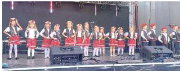
Na scenie w koncercie „Radość i energia” wystąpiły dzieci i młodzież z biłgorajskich szkół oraz soliści z Młodzieżowego Domu Kultury