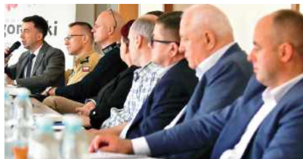
W posiedzeniu u starosty udział wzięli: burmistrz Frampola, wiceburmistrzowie Biłgoraja i Józefowa, a także wójtowie Tereszpoli i Łukowej. To wóldarze tych gmin, którzy nie podpisali się pod skargą na starostę biłgorajskiego

Podczas obrad komendanci służb przedstawili procedury reagowania na zagrożenia powietrzne oraz omówili działania podjęte po ujawnieniu drona w miejscowości Przyłuki (gmina Księżpol). Powiatowe Centrum Zarządzania Kryzysowego zaprezentowało zasady funkcjonowania sys-