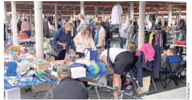
Ludzie z uwagą przeszukiwali stoiska w poszukiwaniu swoich małych skarbów