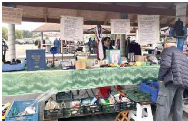
Sprzedający chętnie opowiadali o swoich fantach i dawnej historii przedmiotów