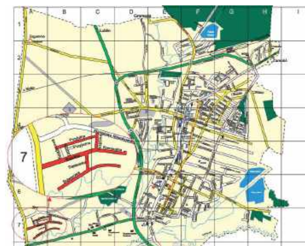
Propozycja nazw nowych ulic w Biłgoraju