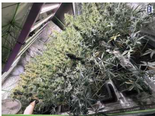
W pomieszczeniach mieszkalnych i gospodarczych na terenie gminy Biłgoraj policjanci zabezpieczyli łącznie sześć kilogramów marihuany oraz 78 krzaków konopi innych niż włókniste

Funkcjonariusze kieleckiej policji zabezpieczyli w gminie Biłgoraj sześć kilogramów marihuany i 78 krzaków konopi. Nielegalny towar wart był 300 tysięcy złotych. W ręce policjantów trafił także właściciel posesji, na której znajdowała się nielegalna plantacja.