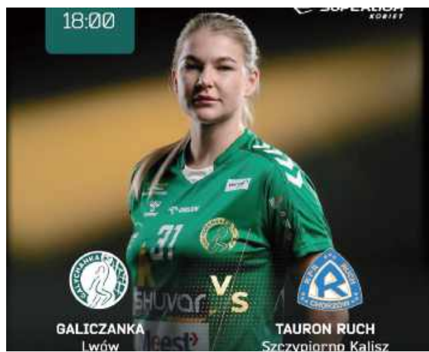
Już w środę w Biłgoraju Orlen Superliga piłkarek ręcznych