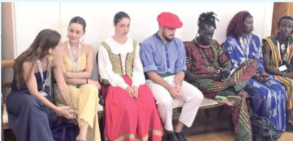
Pod adresem uczestników zamojskiego festiwalu Eurofolk były kierowane wyzwiska