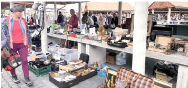
Stoiska pełne były zarówno praktycznych przedmiotów, jak i ciekawych dekoracji