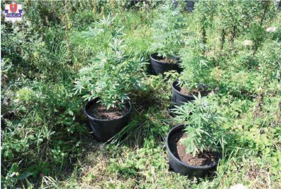
Na posesji, policjanci odnaleźli kilka krzaków roślin konopi innych niż włókniste, które mogłyby dostarczyć znacznej ilości środków odurzających

Odnaleziona susz i substancja zostały przewiezione do komendy. Badanie narkotesterem wykazało, że susz to marihuana, a biała substancja to mefedron. Łącznie z odnalezionego przez policjantów ziela konopi innych niż włókniste można byłoby wykonać ponad 110 dilerskich porcji,