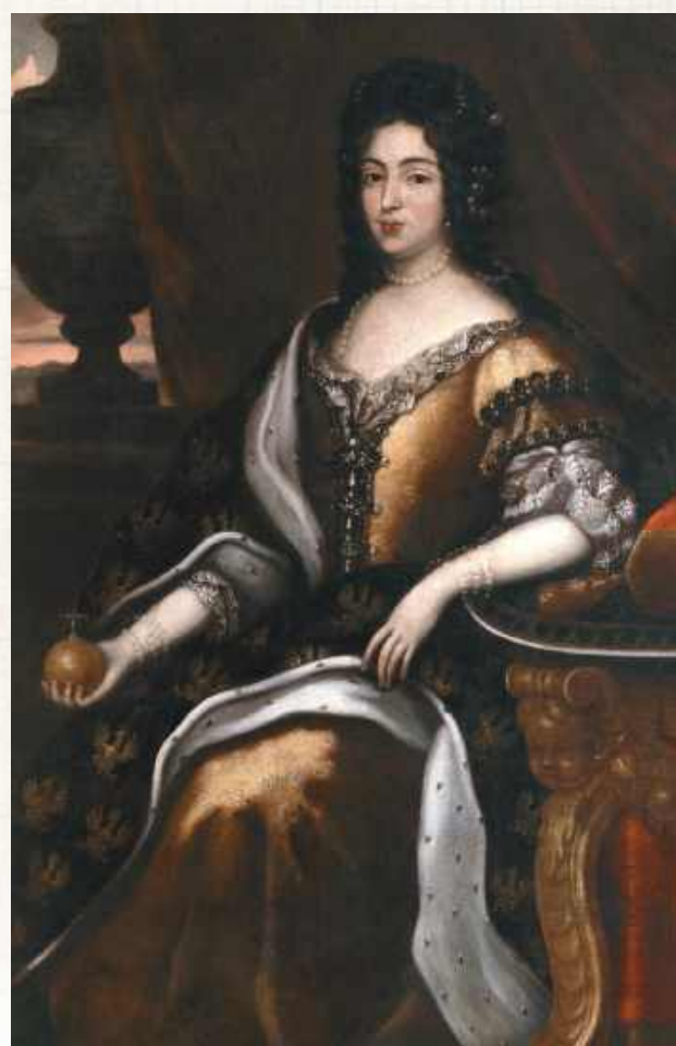
Marysieńka Sobieska mimo paskudnych zębów cieszyła się wyjątkową urodą... (domena publiczna)