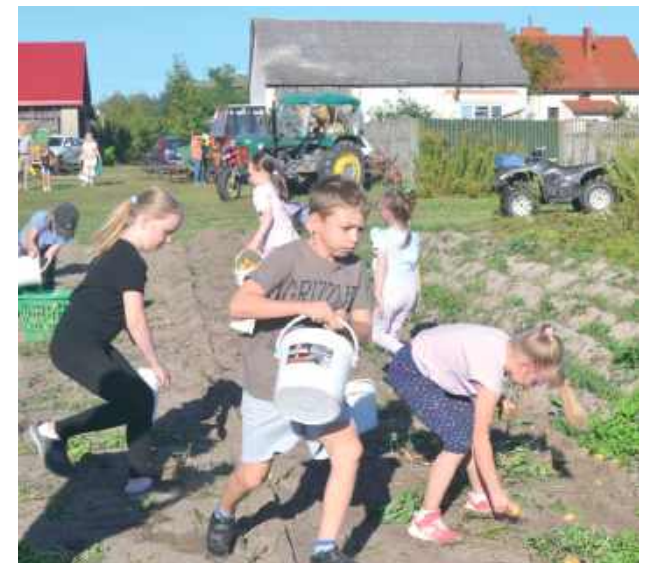
Najmłodszy również świetnie się bawił