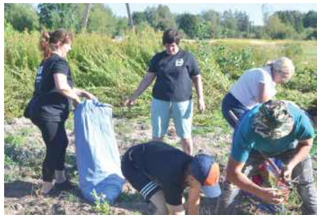
Jedna z konkurencji - wyścig w tradycyjnych wykopkach

20 września br. w miejscowości Dereźnia - Zagrody (gm. Biłgoraj) odbywało się bardzo ciekawe wydarzenie - III Kartoflaki u Dereźnianek.