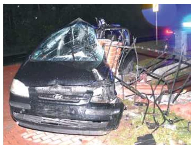
19-letnia kobieta, kierując samochodem osobowym marki Hyundai, na łuku drogi straciła panowanie nad pojazdem

W niedzielę 14 września w nocy w Niemirowie (gm. Frampol) doszło do wypadku drogowego, w wyniku którego 19-letnia kobieta trafiła do szpitala. Policja ustala okoliczności zdarzenia.