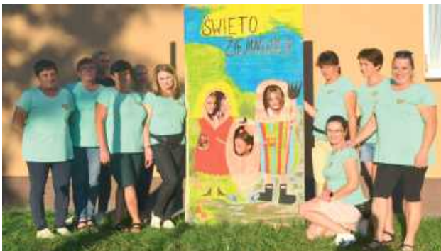
KGW Lipiny Górne - Borowina - organizatorki wydarzenia