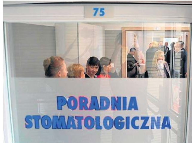
Zawiadomienia w sprawie poradni wpłynęły do NFZ, CBA, a ostatnio do prokuratury

- W jego ocenie mogło dojść do ewentualnego popełnienia przestępstwa polegającego na tym, że lekarze zatrudnieni w Poradni Stomatologicznej przy hospicjum działali w sposób nieprawidłowy. Nieprawidłowości miały pole-