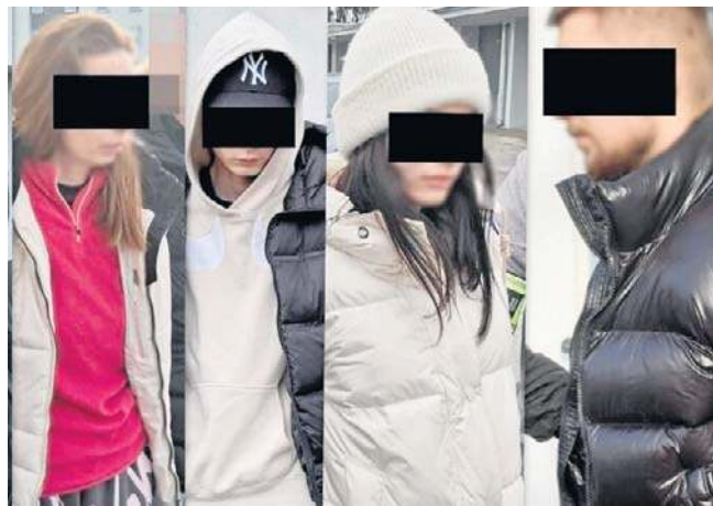
Większość z zatrzymanych Ukraińców to ludzie bardzo młodzi, zaledwie dwudziestoparoletni

Dwie oszustki i trzech oszustów z Ukrainy dokonywało przestępstw na terenie całej Polski. Dzwonili na wybrane numery i podawali się za policjantów, prokuratorów i pracowników banku. Pod fałszywą przykrywką nakłaniali pokrzywdzonych do wykonania przelewu lub zainstalowania zainfekowanej aplikacji do zdalnego pulpitu komputera lub na komórkę.