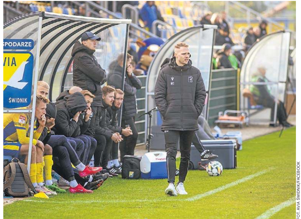
Avia to lider grupy IV w Betclie 3. ligi, a więc jeden z głównych kandydatów do awansu