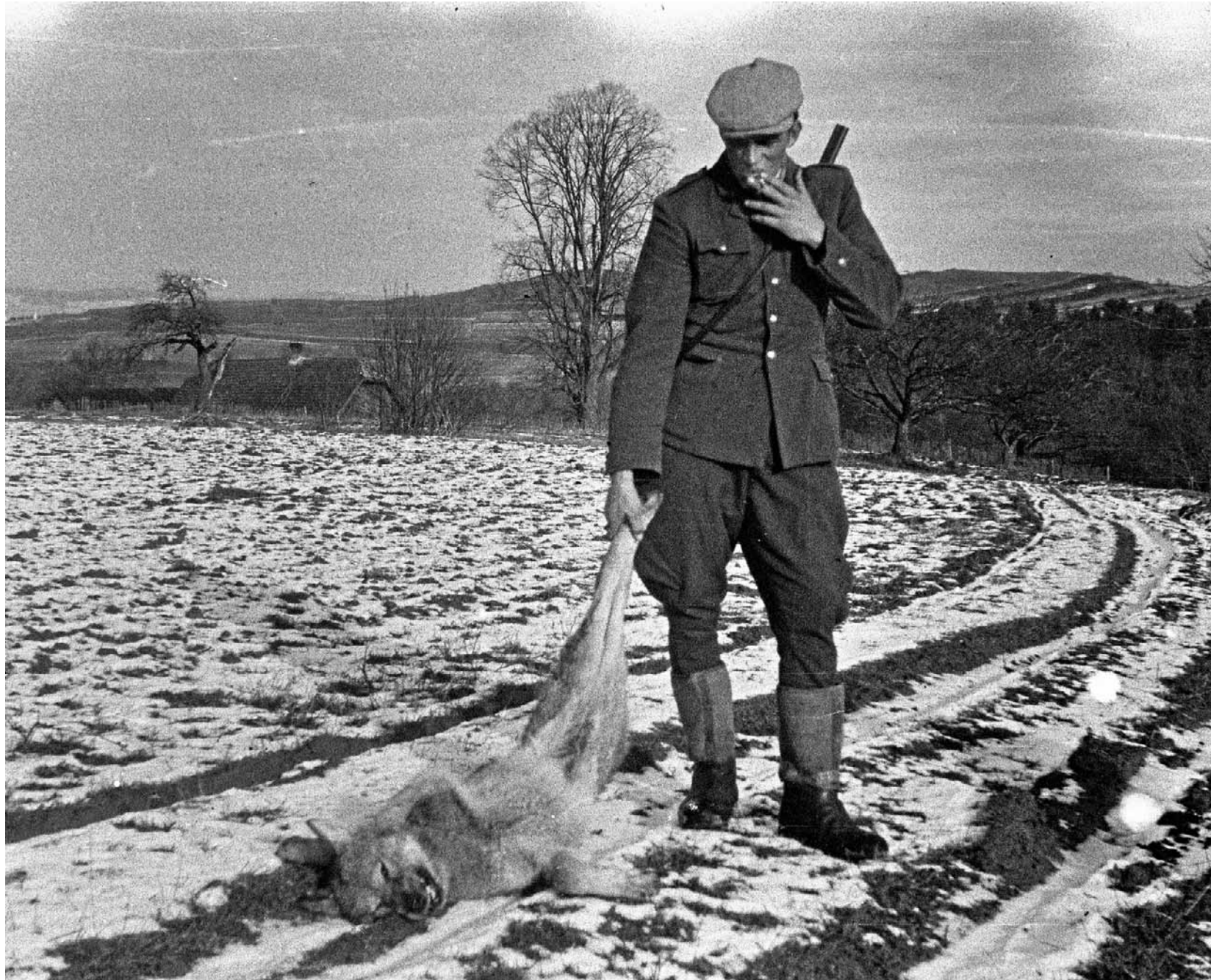
Myśliwy i martwy wilk. Za zabicie szarego drapieżnika państwo wypłacało nagrody (nie tylko myśliwym) w wysokości tysiąca, dwóch, a z czasem nawet trzech tysięcy złotych

Ale czasami któryś z dorosłych wilków zdobywał się na heroizm. Kiedy nadzwyczajnym wysiłkiem własnej psychy forsował nieprzekraczalną dotąd granicę, pozostałe szły za nim jak w dym. I wtedy to one wychodziły zwycięsko