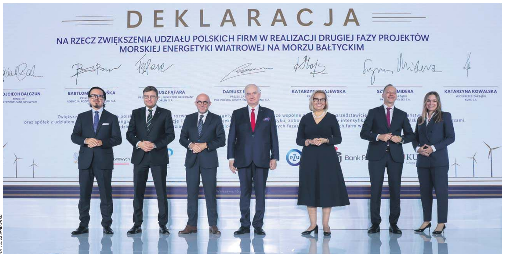
II edycja Forum „Energia z Polski”. Podpisanie deklaracji o udziale polskich firm w budowie morskich farm wiatrowych.

Wydarzenie odbywa się pod hasłem „Wind Factory of Europe” i jest adresowane szczególnie do sektora małych i średnich przedsiębiorstw (MŚP). Dzięki swojej elastyczności i innowacyjności to właśnie one mogą stać się strategicznymi