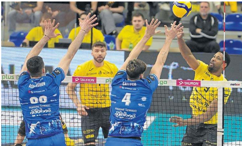
Bogdanka LUK, z bilansem: 13-7, zajmuje czwarte miejsce w stawce