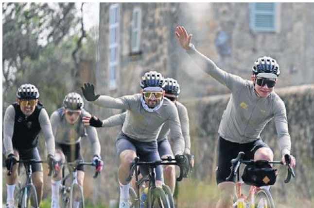
Lublinianie przygotowują się do nowego sezonu, w którym będą chcieli odzyskać stracony we wrześniu tytuł

Rozgrywki 2026 rozpoczną się w weekend 10-12 kwietnia. Na inaugurację Lublinianie podejmą przy Alejach Zygmuntońskich 5 PRES Grupę Dewoloperską Toruń. ©©