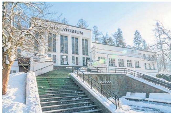
Uzdrowisko Szczawnica. Sprawdź, jakie właściwości mają szczawnickie wody mineralne i jakie zabiegi oferowane są w tamtejszym sanatorium