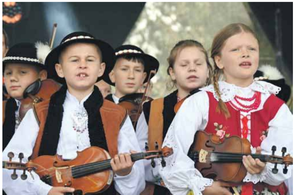
„Cornodunajackie Orły” na dożynkowej scenie w Chochołowie.