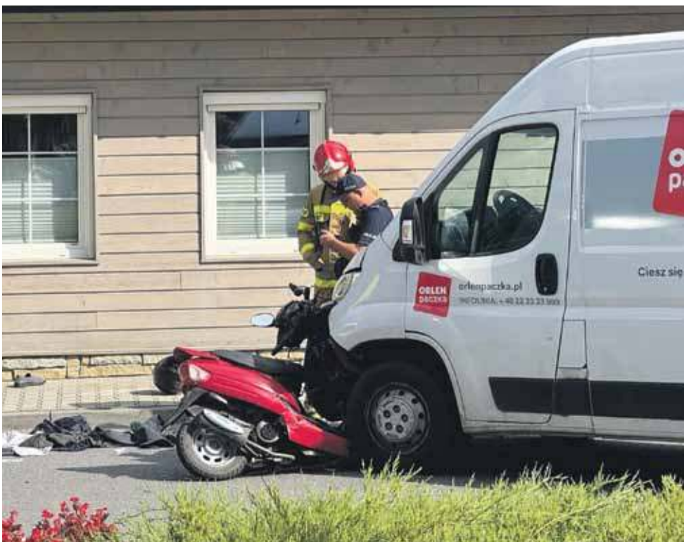
W wypadku ciężko ranny został 69-latek, kierowca jednoślada.

Zderzenie skutera z autem dostawczym - kierowca jednoślada nie przeżył.