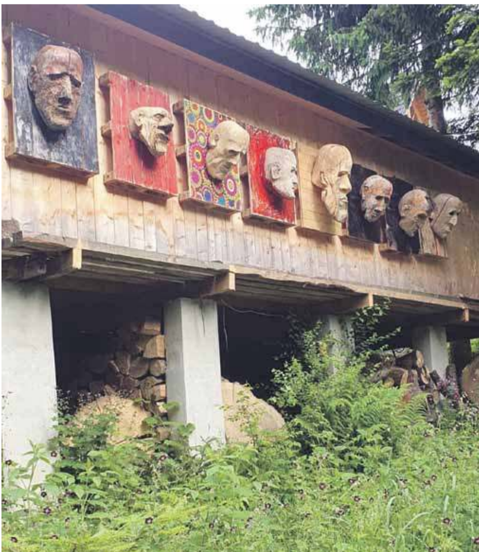
Rząd ludzkich głów, niczym myśliwskie trofea, zdobi ścianę zewnętrzną budynku przy wjeździe na posesję artysty.