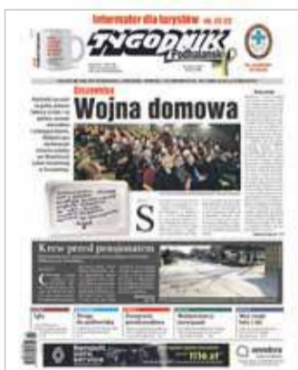
O sprawie napisaliśmy w kwietniu 2023 r.