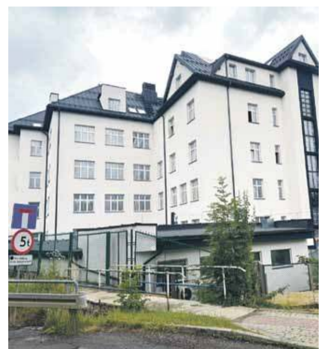
Odbudowa budynku Szpitala Miejskiego po dwóch latach dobiegła końca.