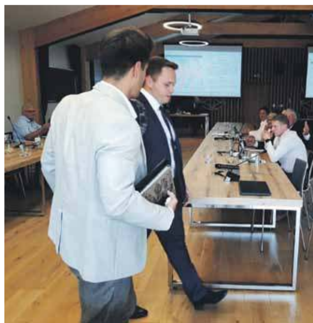
Radni opuszczają salę obrad w Kościelisku, zrywając kworum.