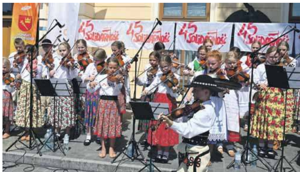
Góralski zespół Dziewięciśił zagrał i zaśpiewał podczas obchodów jubileuszowych Solidarności.