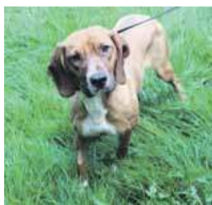
Jeden z psów czekających na was w Nowym Targu.

Jeśli marzysz o wiernym towarzyszu, odwiedź Nowotarskie Schronisko dla Zwierząt przy ul. Kokoszków 101. Być może właśnie tam czeka na Ciebie najlep-