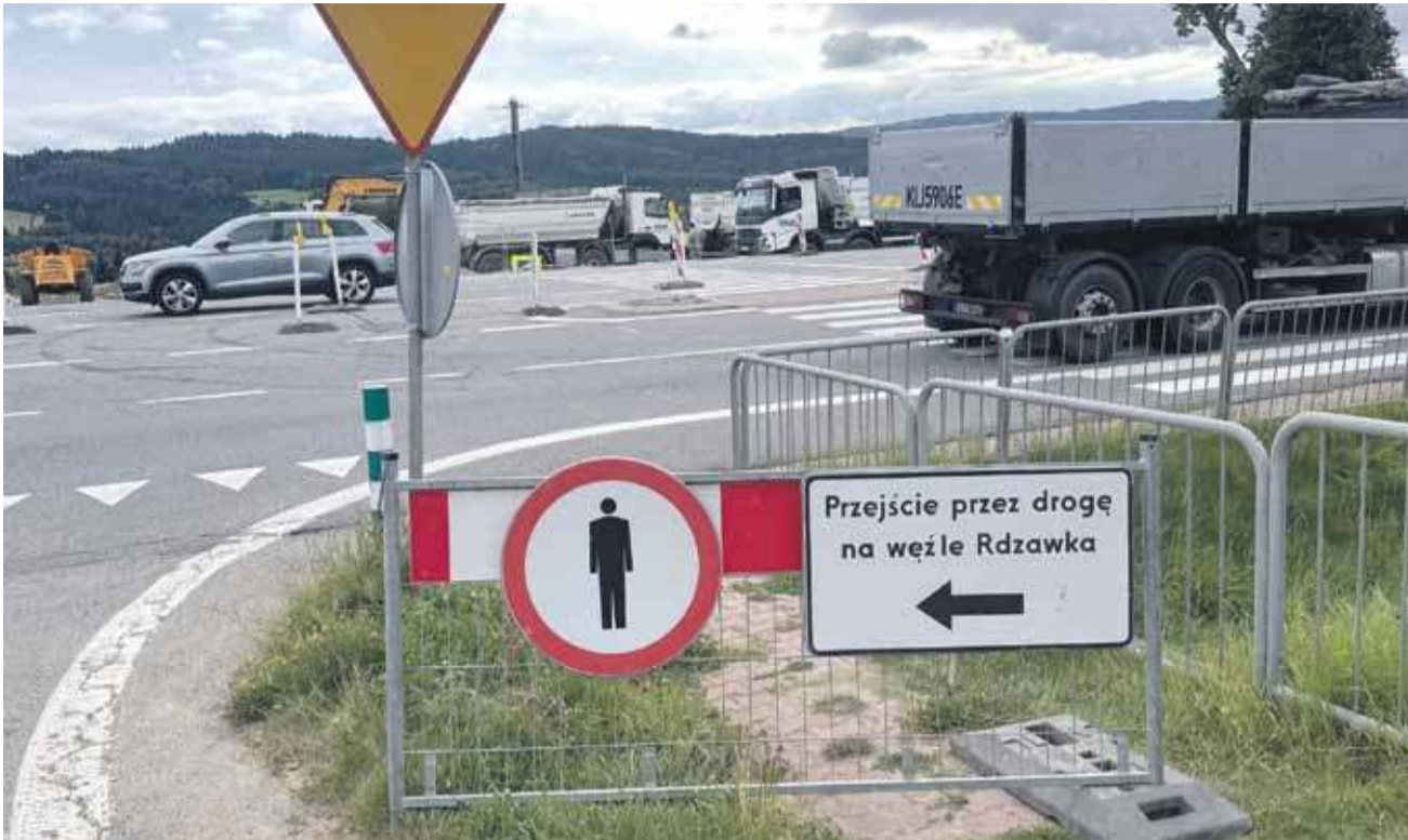
Zlikwidowane przejście dla pieszych na Obidowej.