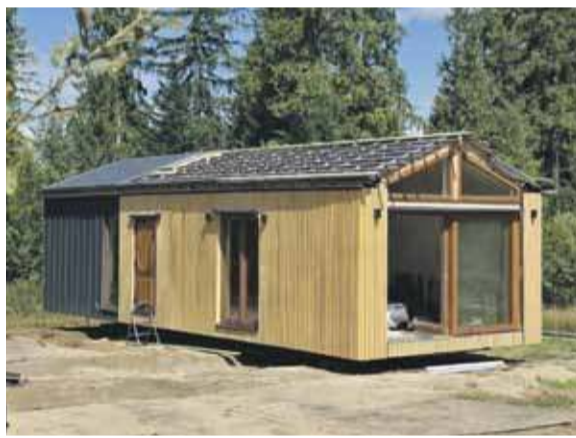
Domek na Wyskówkach stanął w środku nocy z soboty na niedzielę.