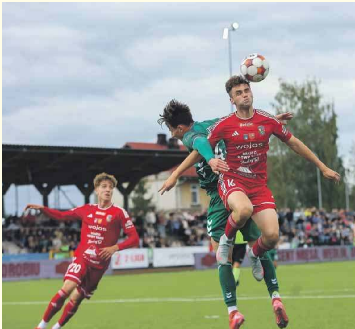
Podhale nie zdołało przechylić szali zwycięstwa na swoją stronę.