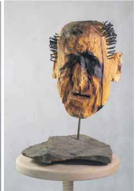
To nie są „ładne”, estetyczne główki, wyczelowane dłutem. Grubo ciosane, zniekształcone głowy, nie nadają się jako ozdoba nowobogackich salonów, chyba raczej jako wyrzut, krzyk, ból.

Artysta uważa, że gdy wybuchła wojna, cały świat powinien się zatrzymać. Politycy powinni się skrzyknąć i wyeliminować potwora, który się narodził. - Zamiast myśleć o nowym systemie ogrzewania, czy gdzie pojedziemy na wakacje, wszyscy powinniśmy się przeciwstawić złu - podkreśla. Tymczasem trzeci rok Ukraińcy bezsensownie giną, ich kraj jest już ruiną, a Trump ogłasza 50 dni dla Rosji - artysta nie kryje wzburzenia.