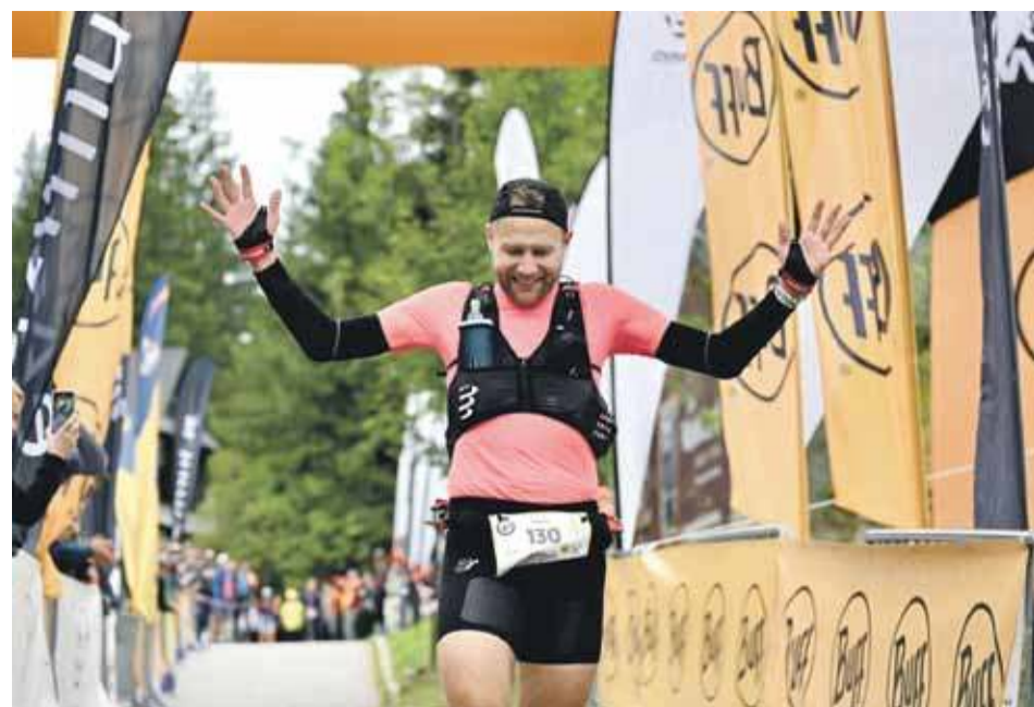
Fot.: Bartłomiej Jurecki