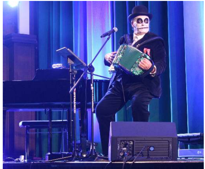
The Tiger Lillies