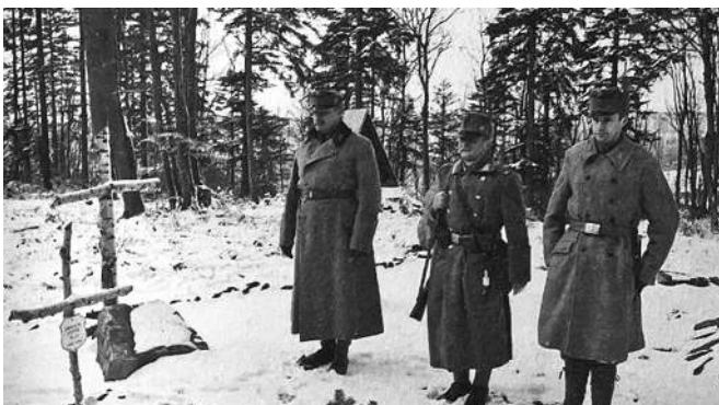
Воякы австро-угорской армії. Реконструкторы

Жебы лекше зрозуміти, як товды было, наведу опис переходу фронта I Сьвітової війны (войска австро-угорскы в осени 1914 р. дакус цофали ся на захід,