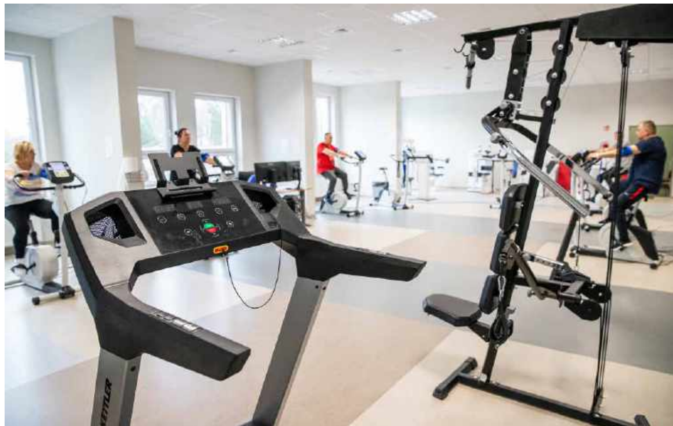
Trzonem leczenia pociwidowego jest rehabilitacja oddechowa, która opiera się o trening wytrzymałościowy.

- Wielu ludzi potrzebuje pomocy, ale nie może sobie pozwolić na stały pobyt w szpitalu. Dlatego jesteśmy na to przygotowani i mamy ok. 50 miejsc na rehabilitację dzienną, tylko czekamy jeszcze na uregulowania prawne - mówi Zbigniew Kasprowicz.