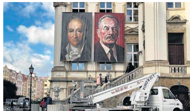
Ekipa filmowa starała się zamienić centrum Legnicy w powojenne, niemieckie miasto

Na początku sierpnia ekipa filmowa pracowała na legnickim Zakacławiu, gdzie przygotowano specjalną scenografię. Obecnie (17 września) zdjęcia