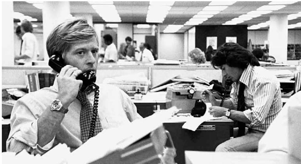
Film „Wszyscy ludzie prezydenta” z 1976 r. potwierdził gwiazdorski status Roberta Redforda. Choć on sam o sobie mówił: „I’m not a Hollywood man”

Takiej pozycji nie zdobywa się jednorazowym popisem, lecz ciężką wieloletnią wspinaczką po szczeblach kariery. Redford swoją drogę rozpoczął na scenie i w telewizji, występując w popularnych serialach lat 50. i 60., takich jak „Mave-