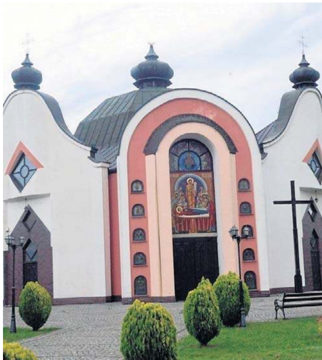
Krzyż został skradziony z centralnej kopuły cerkwi przy ul. Wrocławskiej

- W dniu 17 września 2025 r., po zatrzymaniu dnia poprzedniego przez legnicką policję, sprawcy kradzieży krzyża z budynku cerkwi w Legnicy, Prokurator Rejonowy w Legnicy postawił mężczyźnie zarzuty kradzieży, usiłowania kradzieży oraz obrażenia uczuć religijnych - informuje prokurator Lilianna Łukasiewicz, rzecznik Prokuratury Okręgowej w Legnicy.