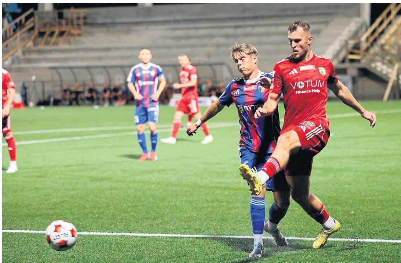
Aż 4:0 przegrała Miedź Legnica z Polonią Bytom. W niedzielę ma szansę się zrehabilitować ze Zniczem Pruszków

PIŁKA NOŻNA MIEDZIANKA MOCNO OBERWAŁA W WYJAZDOWYM MECZU