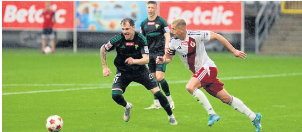
Już w najbliższy czwartek ekkaesiacy (jasne stroje) zmierzą się w Głogowie z Chrobrym