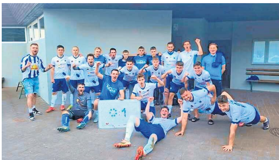
Tak wielka radość tylko po zwycięstwie. Zawisza Pajęczno wygrał w Działoszynie z Wartą 1:0 - były to także derby powiatu pajęczańskiego

W grupie trzeciej na czele Ekolog Wojsławice, który rozbił Prosnę Wieruszów. Na miejscu drugim Warta II Sieradz. Ten zespół pokonał w Zduńskiej Woli Pogoń 5:0. W najbliższą niedzielę mecz sezonu w Sieradzu. Rezerwy