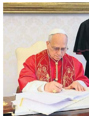
Papież podpisuje encyklikę „Magnifica humanitas”

Dokument otwierają następujące słowa: „Wspaniałe człowieczeństwo stworzone przez Boga staje dziś wobec decydującego wyboru: wnieść nową wieżę Babel albo budować mia-