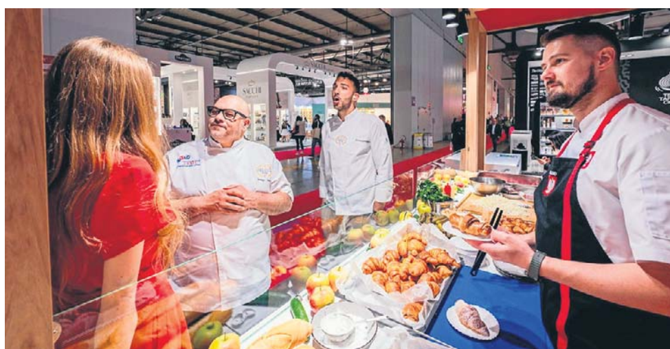
Polskie stoisko na międzynarodowych targach żywności

- Zainteresowanie jest bardzo duże i rok do roku rośnie. W 2025 r. w działaniach KOWR wzięło udział przeszło 500 przedsiębiorców. Przykładowo, na targach Foodex w Tokio prezentowało się aż 38 polskich firm - to liczba naprawdę znacząca, jeżeli weźmiemy pod uwagę odległość geograficzną, złożoność regulacyjną rynku japońskiego oraz wymagania sanitarne, które stawia ten kraj. Z kolei w Montrealu gościliśmy ostatnio 10 firm, ale warto zauważyć, że polski eksport rolno-spożywczy do Kanady opiewa na kwotę blisko 143 milionów euro rocznie. To istotna suma, choć w skali całego polskiego eksportu rolno-spożywczego, który osiągnął poziom 58,4 miliardów euro, wciąż widzimy bardzo duży potencjał wzrostowy. Strategia