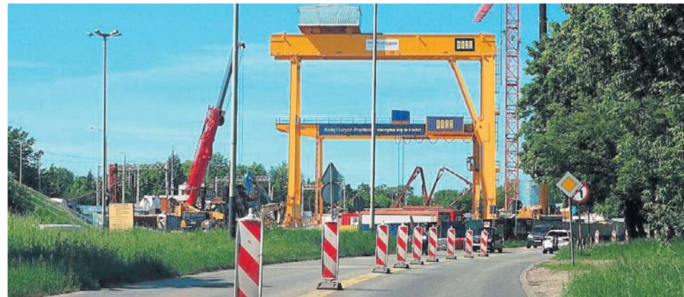
Tak wygląda obecnie miejsce, z którego za kilka miesięcy wystartuje tarcza drażąca tunel KDP

- Na Retkini została ustawiona suwnica, która będzie