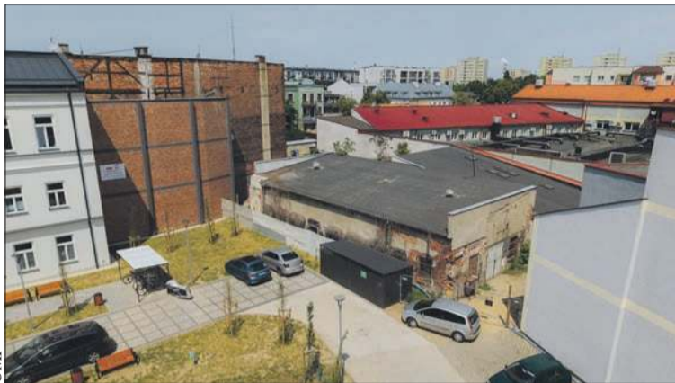
Starą dekoratornię teatralną zastąpi nowy budynek z nowoczesnymi rozwiązaniami konstrukcyjnymi i instalacyjnymi

Na zastosowanie nowoczesnych rozwiązań konstrukcyjnych i instalacyjnych, w tym pompy ciepła i paneli fotowoltaicznych, w obiekcie zwraca uwagę prezes MTBS-u: – Dzięki temu budynek będzie należał do grona obiektów wysoce energooszczędnych. O bezpieczeństwo mieszkańców zadbają nowoczesne radiowe czujki dymu, które bezprzewodowo monitorują stan baterii, pracę sensora, testy sygnalizatora, drożność otworów wlotowych, próby demontażu oraz