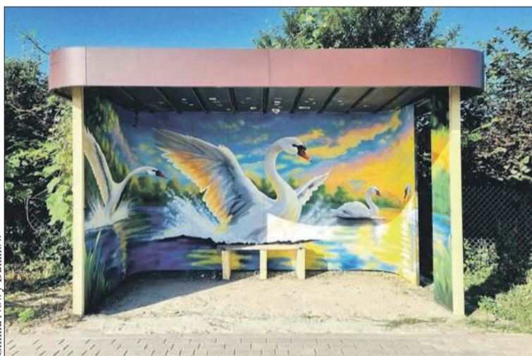
Gmina Nowy Duninów