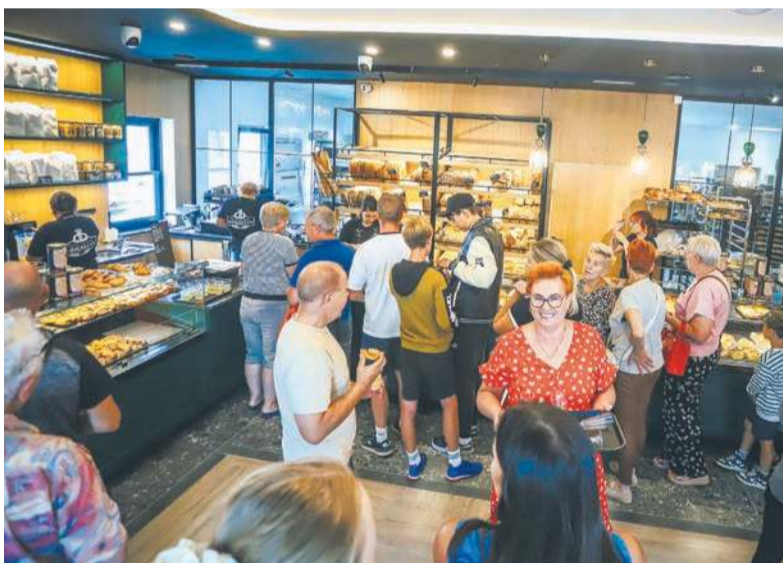
W nowym sklepie od pierwszego dnia nie brakowało kolejek po świeże pieczywo