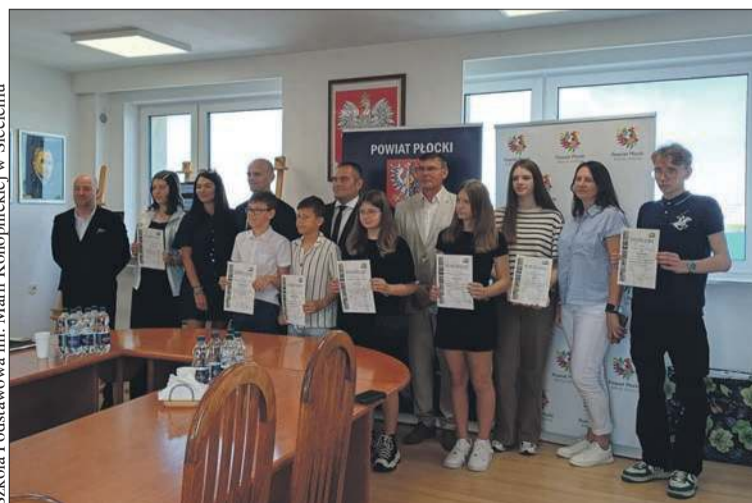
Szkoła Podstawowa im. Marii Konopnickiej w Siecieniu