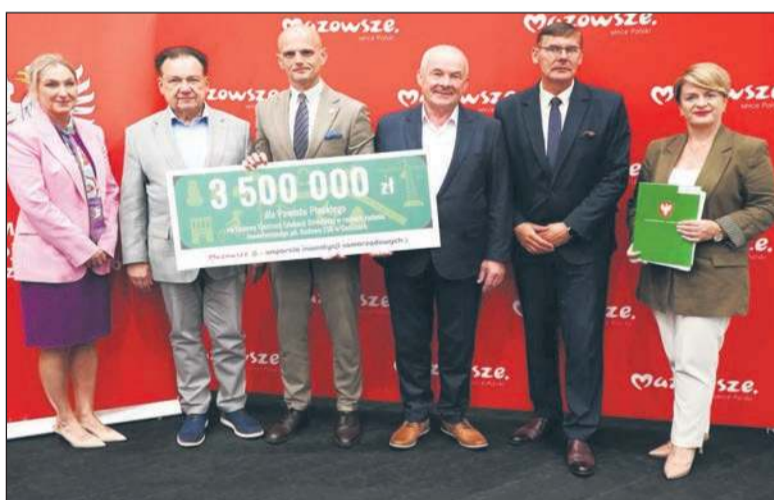
3,5 mln zł trafiło do Powiatu Płockiego na budowę Centrum Edukacji Dziecięcej w Goślicach

Największą część dofinansowania dla Powiatu Płockiego stanowi 3,5 mln zł przeznaczony na budowę