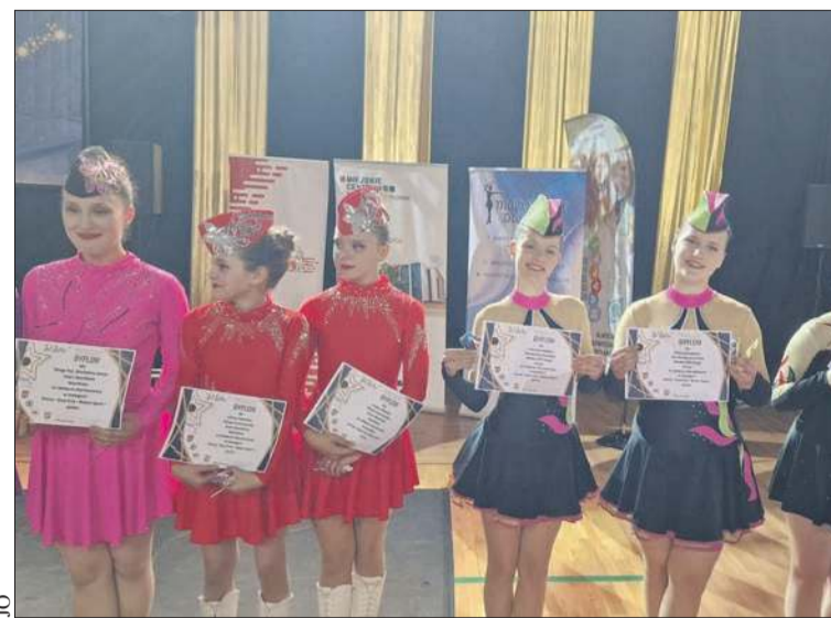
Mażoretki z Sierpca z dyplomami

Mazowieckie Centrum Polityki Społecznej po raz piąty zaprasza osoby z niepełnosprawnościami do udziału w konkursie plastycznym „Odkrywamy talenty”. Tegoroczna edycja, objęta patronatem honorowym Marszałka Województwa Mazowieckiego, odbywa się pod hasłem „Alfabet dostępności”.