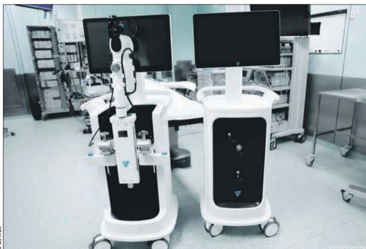
Nowy sprzęt dostępny w Szpitalu św. Trójcy w Płocku

– Pozyskane urządzenie wpisuje się w światowy trend wykorzystywania zaawansowanych technologii w ortopedii, dzięki której nasi chirurdzy mogą wykonywać operacje z jeszcze większą precyzją, co przekłada się na bezpieczeństwo pacjentów i wysoką jakość leczenia. System wspiera proces leczenia pacjenta przed operacją, w trakcie zabiegu oraz podczas monitorowania efektów pooperacyjnych – czytamy na profilu Szpitala św. Trójcy w mediach społecznościowych.