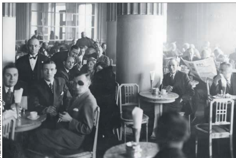
Cukiernia Lourse'a w Hotelu Europejskim w latach 30-tych XX wieku

zaledwie po tysiąc sztuk. Kawiarnia słynęła z nowości przywożonych z Paryża i Londynu. Wśród nich były napoleonki z grylażem – deser z kruchego lub półfrancuskiego ciasta z nadzieniem z orzechowego karmelu – lody formowane w kształty owoców oraz napoje, takie jak mazagran i hiszpańskie grenadino, podawane ze słomką, co było wówczas absolutną nowością w Warszawie.