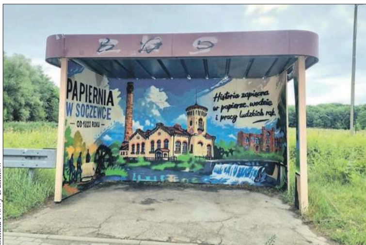
Gmina Nowy Duninów