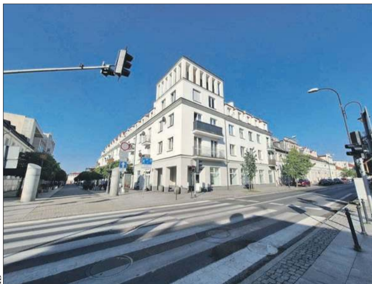
Budynek przy ul. Tumskiej, w którym znajduje się lokal zaproponowany na przyszłą aptekę

ORLEN rozpoczyna sprzedaż HVO100 na Słowacji