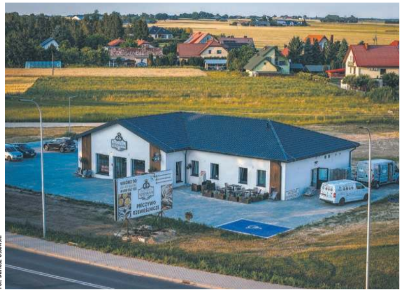
Nowa siedziba Pracowni Rzemieśniczej Kobenhavn – Sikorz 67M