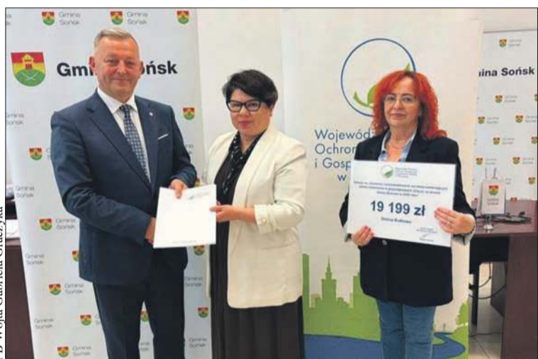
Władze gminy Bulkowo pozyskały środki na dwa osobne projekty związane z usuwaniem wyrobów zawierających azbest