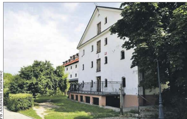
Płocka siedziba Archiwum Państwowego przejdzie modernizację