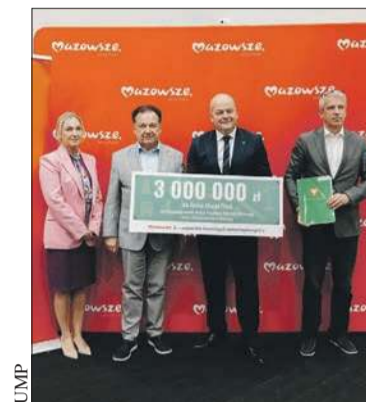
Wręczenie symbolicznego czeku na 3 mln zł z przeznaczeniem na pokrycie części kosztów zagospodarowania drugiej części bulwarów

Zostanie zmodernizowany przeszło półkilometrowy odcinek ul. Kawieckiej-