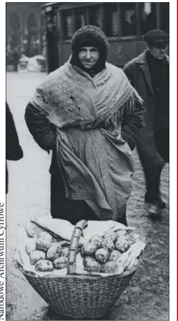
Sprzedaj pączków na warszawskiej ulicy

Dzisiejsze słodkie Mazowsze czerpie zarówno z bogatych tradycji cukierniczych, jak i współczesnych pomysłów na kulinarne symbole regionu. W pamięci mieszkańców wciąż obecni są dawni mistrzowie, tacy jak Giovanni Giacomo Lardelli, który otworzył elegancką cukiernię z sa-