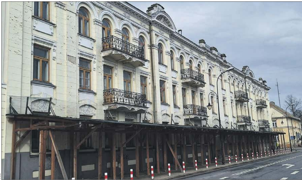
Kamienica przy ul. 1 Maja 3/5 w przyszłości ma służyć studentom Akademii Mazowieckiej

tyzy mykologicznej i zbadanie stopnia zawilgocenia oraz zasolenia ścian na potrzeby prac budowlanych.