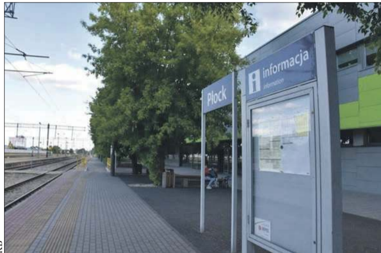
Stacja kolejowa w Płocku

Przejazd pociągiem z Płocka do Torunia ma potrwać 45 minut, do Warszawy – 50 minut, do Bydgoszczy – 65, do Łodzi – 80, do Gdańska – 95, natomiast do Poznania – 120 minut, do Krakowa nieco dłużej, 145 minut. Takie są założenia spółki Centralny Port Komunikacyjny realizującej program Port Polska. Ale nie wszystkie pociągi wjadą do miasta. I wcale nie jest powiedziane, czy wszystkie będą tymi najszybszymi.