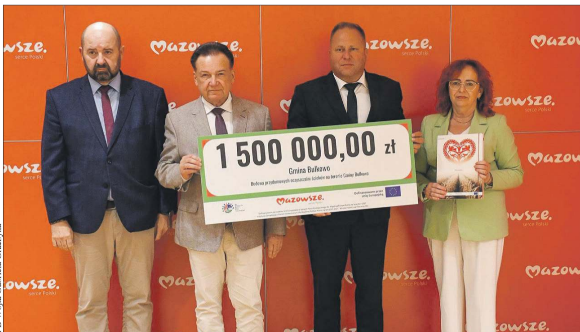
1,5 mln zł dofinansowania z Samorządu Województwa Mazowieckiego trafiły do gminy Bulkowo

Powiat Płocki z 3,5 mln zł na Centrum Edukacji Dziecięcej w Goślicach