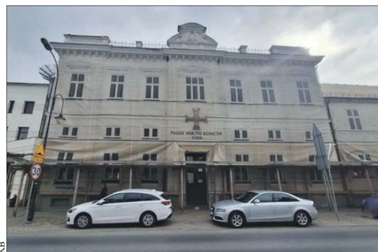
Dawny Hotel Warszawski można kupić za 6 mln zł