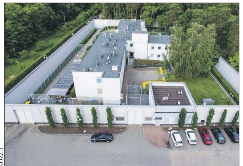
Ośrodek w Gostyninie