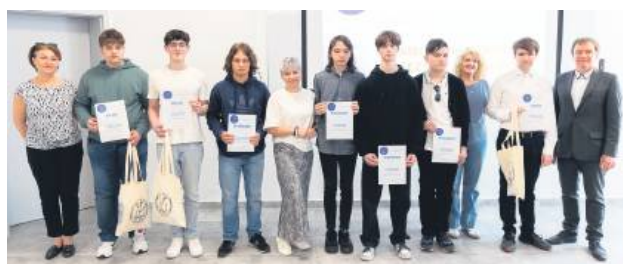
Najlepsi z Dyktanda w Języku Angielskim.

Dyktando składało się z dwóch etapów: szkolnego oraz finałowego. W etapie szkolnym uczestniczyło ok. 150 uczniów