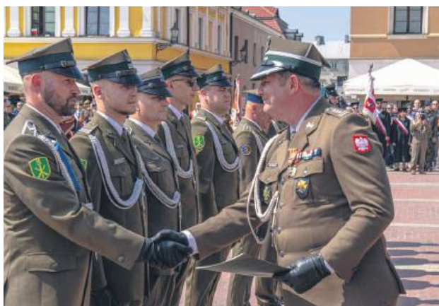
Uroczystości odbywały się z wojskowym ceremoniałem.