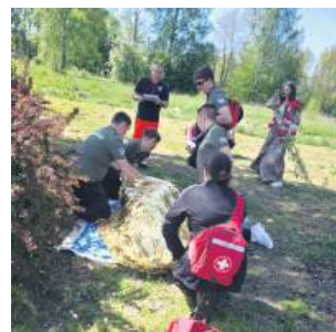
Ratownicy musieli zadbać o bezpieczeństwo poszkodowanych, ale i swoje.

wszystkie niezbędne czynności związane z udzieleniem pierwszej pomocy przedmedycznej, tak aby zapewnić bezpieczeństwo poszkodowanym, ale również sobie. Musieli udzielić pierwszej pomocy przy urazach, omdleniach, zadła-