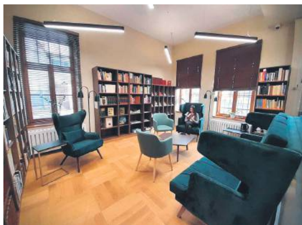
Miejska Biblioteka Publiczna w Hrubieszowie przejmie zadania i księgozbiór zlikwidowanej powiatowej placówki bibliotecznej.

W ubiegłym roku, zaraz po podwójnym jubileuszu Powiatowej Biblioteki Publicznej w Hrubieszowie – 25-lecia działalności oraz 15-lecia nadania jej imienia prof. Wiktora Zina – bibliotekarze tej placówki dowiedzieli się, że kolejnych ju-