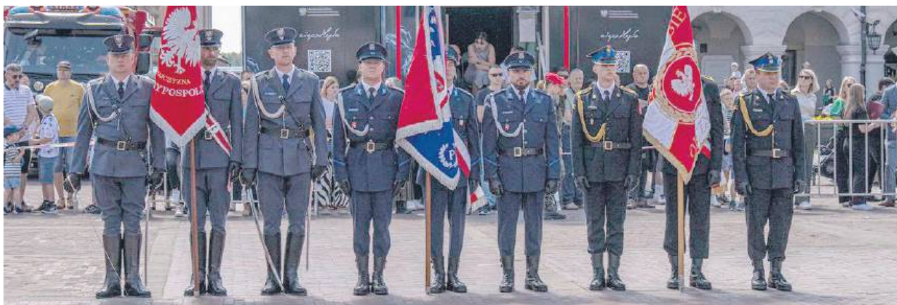
W uroczystych obchodach rocznicy uchwalenia Konstytucji 3 maja brali udział również przedstawiciele policji i straży pożarnej.

Zamość przyciągnął tłumy mieszkańców i turystów na długi weekend majowy, oferując szeroki wachlarz wydarzeń. Na Rynku Wielkim odbyły się uroczyste obchody Dnia Flagi oraz rocznicy uchwalenia Konstytucji 3 maja, a wieczorami rozbrzmiewała muzyka podczas koncertów jazzowych. Tymczasem Rynek Wodny zmienił się w magiczną scenę podczas Majówki ze Sztukmistrzami. Tam kuglarze, akrobaci i artyści uliczni oczarowali publiczność swoimi pokazami. Nie zabrakło także sportowych emocji, w XII Biegu Wokół Twierdzy Zamość wzięło udział 140 zawodników.