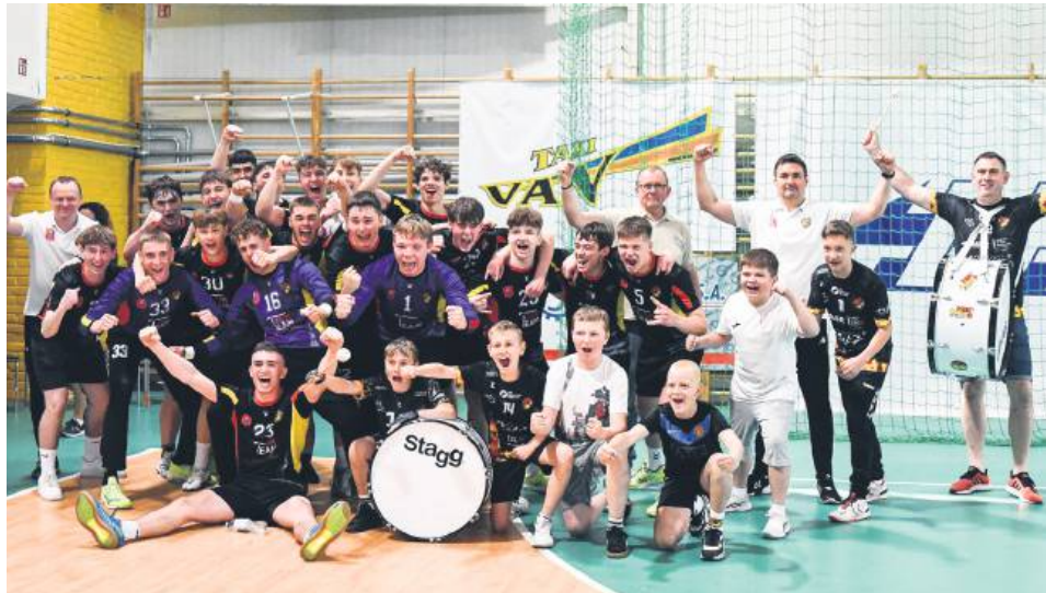
Radość Młodej Padwy Zamość po zwycięstwie nad Wisłą Płock.