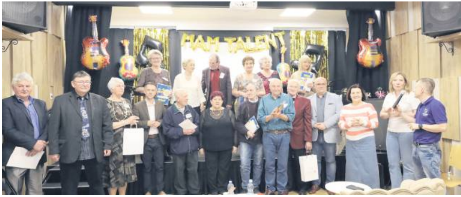
Mam Talent Senior zorganizowano w Tomaszowie Lubelskim po raz pierwszy. Już zapowiedziano kolejną edycję wydarzenia.

Wiek nie jest barierą dla realizowania pasji i bycia kreatywnym. Seniorzy z Tomaszowa Lubelskiego stale to udowadniają. Ostatnio pokazali, jak są utalentowani. Wzięli udział w pierwszej edycji talent show „Mam Talent Senior” dla seniorów.