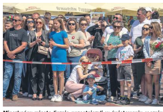
Mieszkańcy miasta licznie uczestniczyli w świętowaniu rocznicy uchwalenia Konstytucji 3 maja.