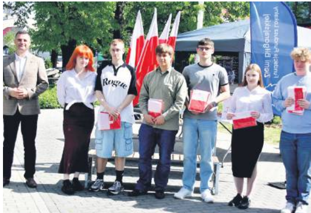
W rozdawanie flag zaangażowała się biłgorajska młodzież.