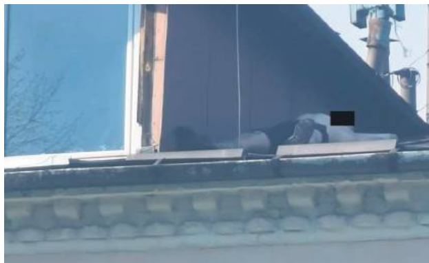
Na dachu leży mężczyzna, który po zatrzymaniu go przez policjantów usłyszał zarzuty kradzieży.