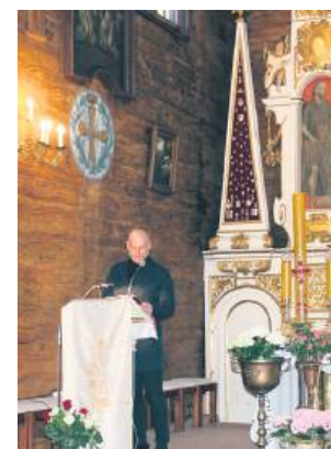
Maraton Biblijny w tomaszowskim Sanktuarium rozpocznie się o godz. 9.

Tomaszowski Maraton Biblijny jest już właściwie tradycją. Do czytania nigdy nie brakuje chętnych. Tak jak w latach poprzednich, tak i teraz do czy-