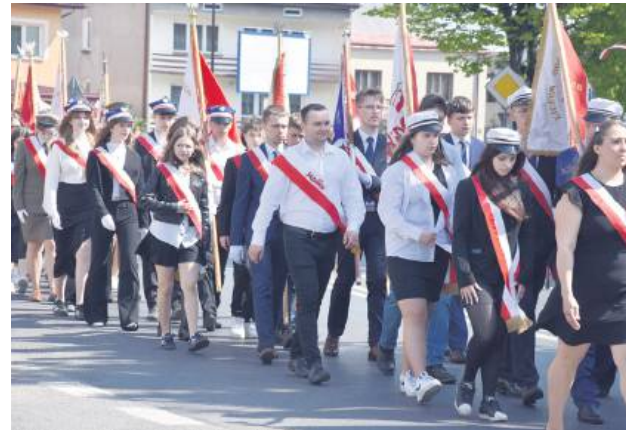
W uroczystościach patriotycznych udział wzięły poczty sztandarowe.