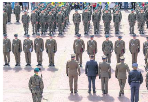
3 maja na Rynku Wielkim w Zamościu.