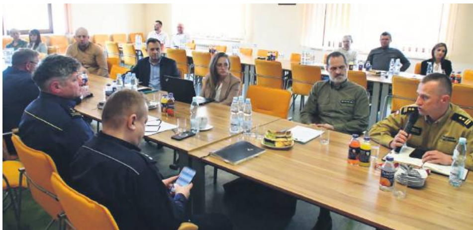
W spotkaniu poruszano kwestie m.in. dotyczące wypadków z dzikim zwierzęciem.

– Celem konferencji było zebranie informacji i przedstawienie kompetencji poszczególnych służb oraz organów, a także obowiązków kierowców i świadków w zakresie pomocy