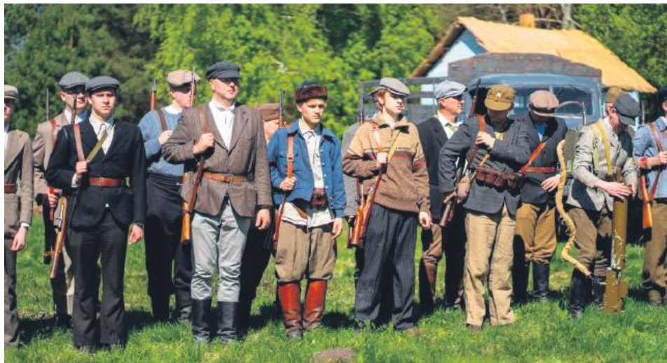
Rekonstruktorzy dali widzom żywą lekcję lokalnej historii.

Obchody rocznicowe Bitwy pod Zaborecznem rozpoczęły się kilka dni wcześniej – 25