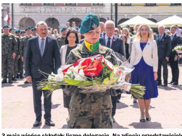
3 maja wieńce składały liczne delegacje. Na zdjęciu przedstawiciele władz powiatu zamojskiego.