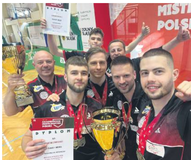
Akademickie Mistrzostwa Polski w tenisie stołowym odbyły się w dniach 25-27 kwietnia we Wrocławiu.