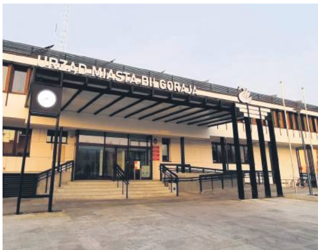
Rada ma doradzać burmistrzowi w sprawie przedsiębiorczości.