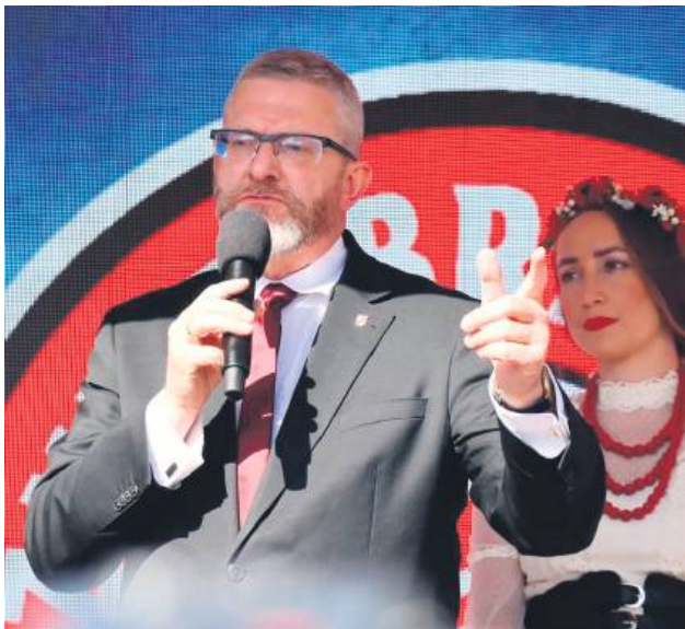
Silne państwo minimum, strażnik na granicy, policjant na ulicy, Wojsko Polskie w granicach Rzeczypospolitej – mówił Grzegorz Braun na spotkaniu z wyborcami w Zamościu.

Podczas wiecu wyborczego na Rynku Wielkim w Zamościu, kandydat na prezydenta RP Grzegorz Braun wzywał do „odzyskania niepodległości”, ostro krytykował Unię Europejską, Zielony Ład, migrację i „eurokołchozowe dyrektywy”. Zapowiedział też likwidację PIT i CIT i „silne państwo minimum”. Zebrani na placu sympatycy odpowiadali skandowaniem: „Tu jest Polska!”.