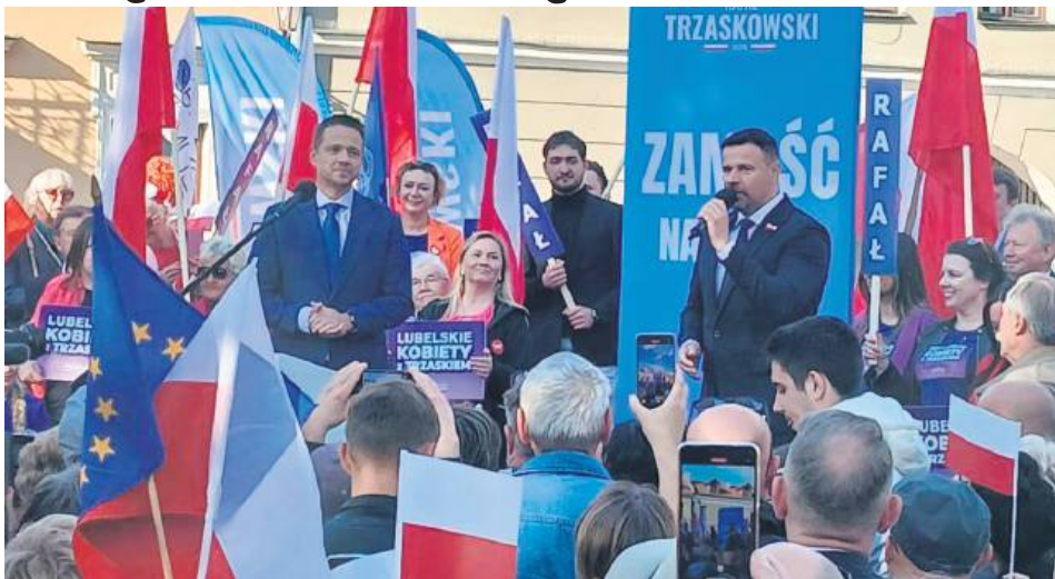
Spotkanie z Rafałem Trzaskowskim w Zamościu.

Wszystko wskazuje na to, że Rafałowi Trzaskowskiemu nie chodziło o poprzednika Rafała