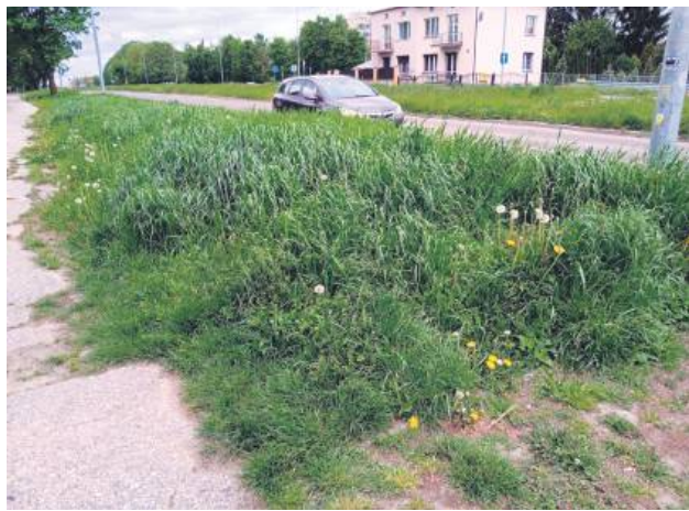
Ul. Wyszyńskiego. Zdjęcie wykonano 4 maja.