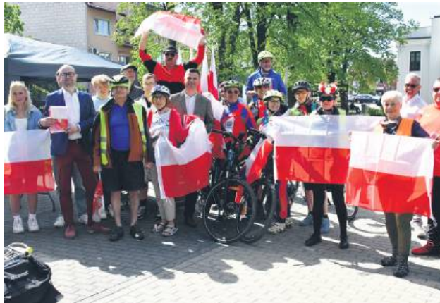
Biłgorajanie obchodzili Święto Flagi.