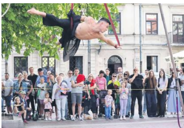
Uliczne akrobacje na Rynku Wodnym.