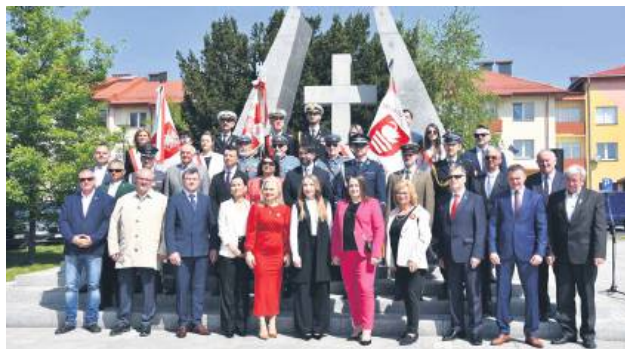
Delegacje składały wiązanki przed Pomnikiem Jubileuszowym.