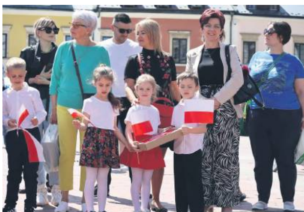
2 maja świętowaliśmy Dzień Flagi Rzeczypospolitej Polskiej.