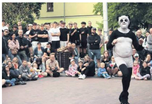
Majówka ze Sztukmistrzami przyciągnęła sporą publiczność.