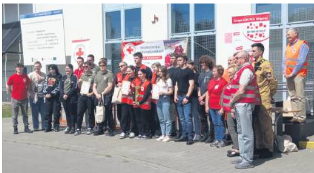
Uczniowie szkół średnich potrafią udzielać pierwszej pomocy.

29 kwietnia na obiektach Ośrodka Sportu i Rekreacji w Biłgoraju odbyły się Rejonowe Mistrzostwa Pierwszej Pomocy Młodzieżowych Drużyn Ratowniczych PCK. Do rywalizacji przystąpiły trzy pięcioosobowe