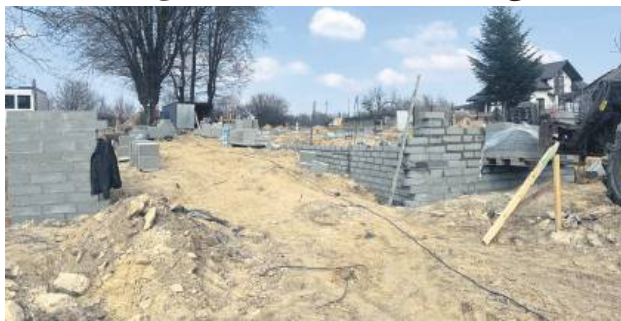
Kluby dziecięce w Rogóźnie i Majdanie Górnym w przyszłym roku będą już otwarte.

Oba zadania będą kosztowały po około 5 milionów złotych,