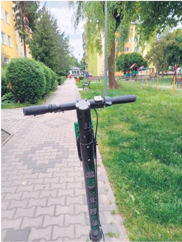
Hulajnogi powinny być parkowane w sposób nieutrudniający ruchu pieszym i innym uczestnikom ruchu.