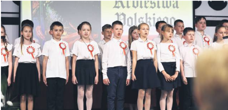
Występ uczniów ze szkoły podstawowej.