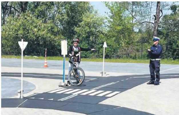
Jedną z konkurencji była jazda rowerem po torze przeszkód.

Konkursowi od lat przyświeca idea propagowania wśród dzieci i młodzieży bez-