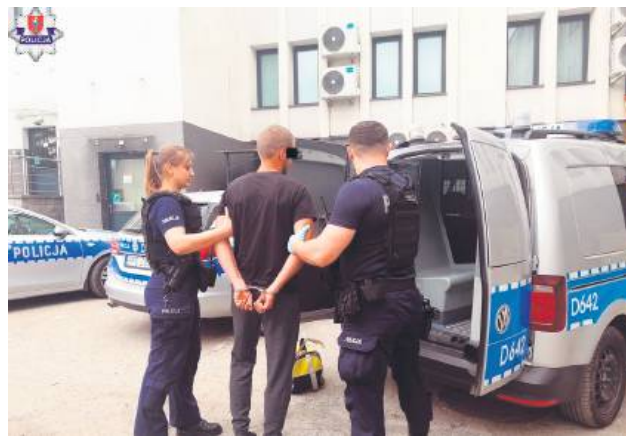
Zamojscy policjanci zatrzymali mężczyznę podejrzanego o usiłowanie zabójstwa.

Do zdarzenia doszło 1 maja. Zamojscy policjanci zostali powiadomieni o tym, że w jednym z mieszkań w Zamościu mężczyzna w wieku 32 lat został kilkakrotnie dźgnięty nożem. Pod wskazany adres błyskawicznie skierowano policyjne patrole.