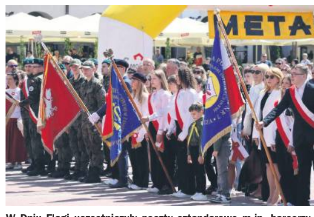
W Dniu Flagi uczestniczyły poczty sztandarowe m.in. harcerzy i zamojskich placówek oświatowych.