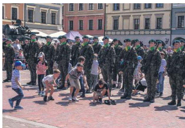
Dzieci tylko czekają na zakończenie salwy honorowej.