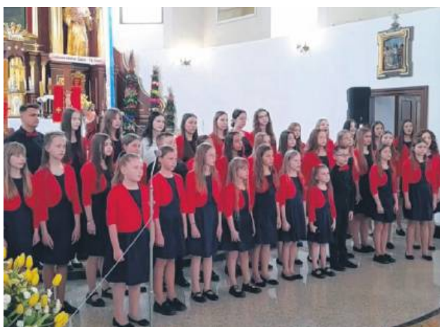
Koncert Chóru „Harmonia”.