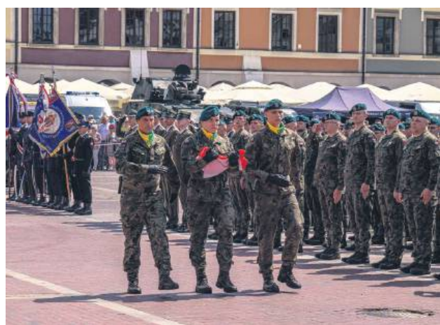
Przed uroczystym podniesieniem flagi.