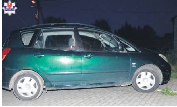
Obaj nieodpowiedzialni kierowcy wkrótce staną przed sądem i odpowiedzą za prowadzenie pojazdu mechanicznego w stanie nietrzeźwości.

Prawie 2 promile alkoholu wydmuchał 26-latek z gminy Szczepieszyn, a 52-letni mieszkaniec gminy Nielisz miał w organizmie ponad 1,7 promila. Obaj panowie po pijanemu kierowali samochodami i obaj wpadli 1 maja. Teraz mogą „posiedzieć” nawet 3 lata.