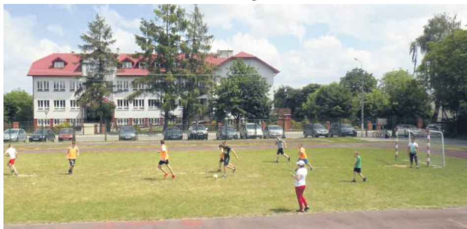
Szkoła Podstawowa w Trzeszczanach.