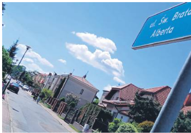
Ul. Św. Brata Alberta: 9 maja o godz. 11 rozpocznie się tu protest.

O ich problemie pisaliśmy na łamach „Kroniki Tygodnia” w zeszłym roku. Przypomnijmy. Ul. Św. Brata Alberta jest boczną ul. Szwedzkiej na os. Powiatowa. Zaczyna się na skrzyżowaniu ze Szwedzką i Kalinową, a kończy na skrzyżowaniu z ul. ks. Jana Borowskiego – w pobliżu kościoła pod wezwaniem Św. Brata Alberta. Po obu stronach ulicy znajduje się około 30 domów jednorodzinnych. – Na początku to była ulica ślepa – opowiadał nam jeden z mieszkańców we wrześniu ubiegłego roku.