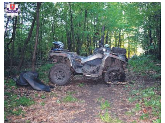
22-latek stracił panowanie nad pojazdem i uderzył w drzewo.

Jechał drogą leśną. Na razie policjanci nie ustalili, jak doszło do tego, że stracił panowanie nad quadem i uderzył nim w drzewo. 22-latek z gminy Adamów trafił do szpitala.