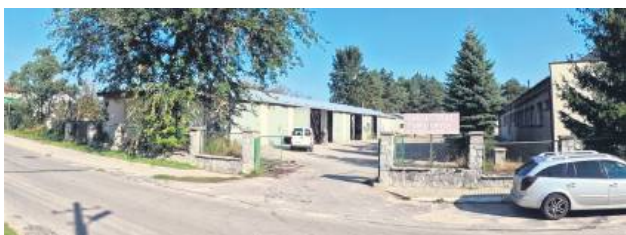
Zarząd Powiatu w Tomaszowie Lubelskim ogłosił trzeci przetarg ustny nieograniczony na sprzedaż nieruchomości, która stanowiła bazę magazynowo-sprzętową ZDP w Tomaszowie Lubelskim.

Porozumienie Zarządu Dróg Powiatowych w Tomaszowie Lubelskim od lat stoją pod chmurką. – W 1991 roku nastąpił podział rejonu dróg publicznych na zarząd dróg. Hale, które przypadły po