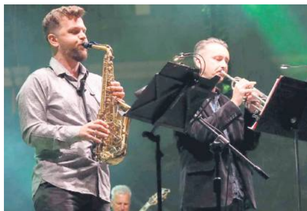
Koncert Jazz Brothers na Rynku Wielkim.