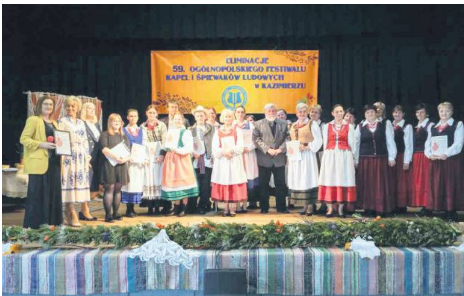
Na eliminacjach międzypowiatowych wyłoniono śpiewaków, zespoły i solistów, którzy przeszli do półfinału.

W obliczu ogłoszonej żałoby narodowej i uroczystości pogrzebowych Papieża Franciszka, które odbywały się w tym samym dniu – 26 kwietnia, eliminacje rozpoczęły od uczczenia pamięci zmarłego Papieża minutą ciszy. Następnie wszystkich