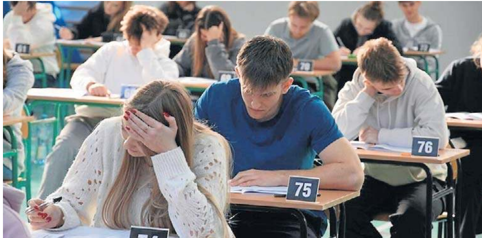
Uczniowie mają za sobą próbne matury oraz testy przedmiotowe. Prawdziwa matura zacznie się 4 maja

- To moment skupienia nad zakończeniem nauki, bo to jest już koniec pewnego etapu. Do matury zostało kilkanaście dni i młodzież bardzo to przeżywa - mówi dyrektorka. Jak zaznacza, obecnie trudno mówić o klasycznych przygotowaniach. - To już nie są przygotowania, tylko raczej usystematyzowanie wiedzy z tych lat nauki. Ostatnie szlify, powtórki, dodatkowe zajęcia z matematyki czy przyporządkowywanie epok do lektur - wylicza.