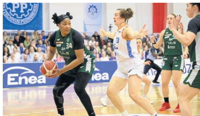
Sprawozdanie z czwartego meczu finału ORLEN Basket Ligi Konie na stronie internetowej Kuriera Lubelskiego