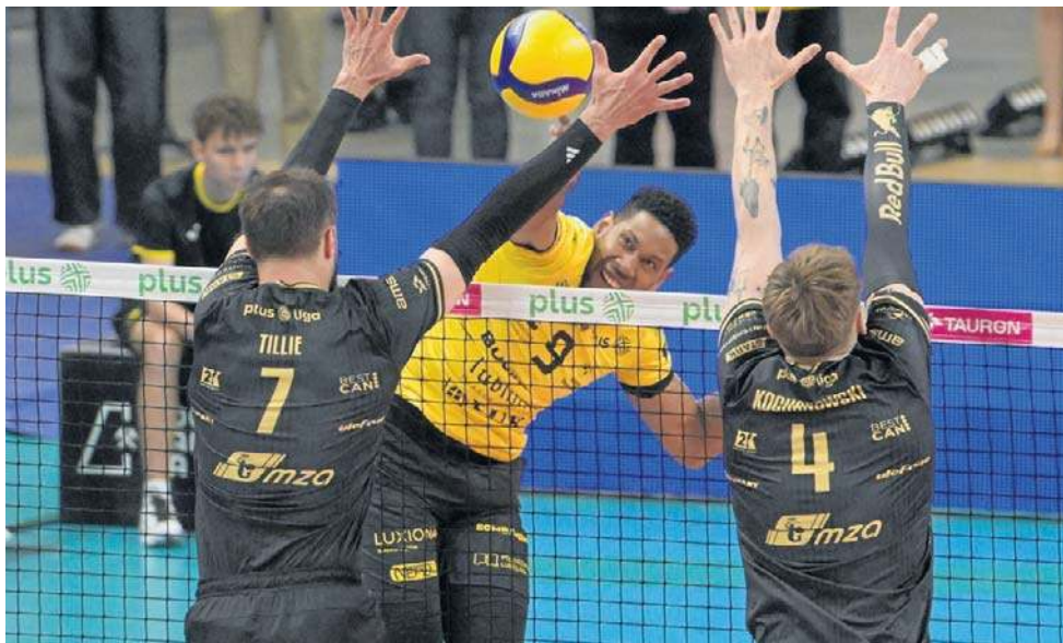
Bogdanka LUK zagra w finale drugi rok z kolei. I znowu z Aluronem CMC Wartą Zawiercie

Premierowa odsłona przebiegała pod zdecydowane dyktando Bogdanki LUK, która zdominowała rywali w każdym elemen-