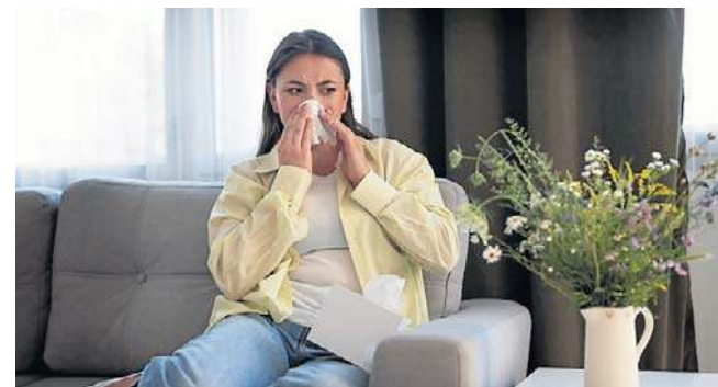
Wyniki badań są istotne dla codziennego życia alergików, szczególnie w zanieczyszczonych miastach

Kluczowym elementem badań była analiza stężenia pyłku