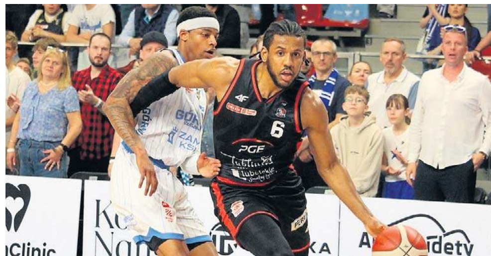
W następnej serii gier PGE Start Lublin podejmie Tauron GTK Gliwice (26 kwietnia, godz. 17.30). Do końca sezonu zasadniczego zostały trzy kolejki

- Gratuluję swoim zawodnikom i sztabowi zwycięstwa, bo przed meczem byłem pytany, jak to jest pracować, kiedy już wiesz, że ten sezon jest taki jaki jest... Natomiast my w ostatnim tygodniu nie odczuliśmy w ogóle tego, że coś się zmieniło. Po prostu pracujemy, walczymy w każdym meczu i to na pewno cieszy - mówił