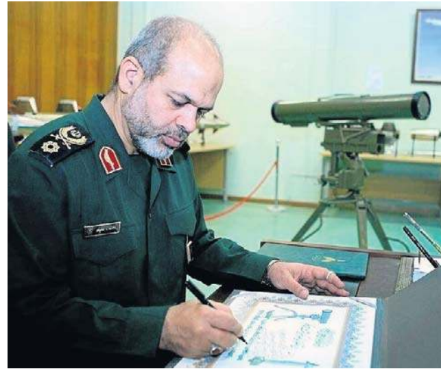
Generał Vahidi, dowódca Korpusu Strażników Rewolucji Islamskiej, rządzi dziś de facto Iranem

Media powiązane z IRGC ogłosiły również w sobotę, że Iran nie zgodził się na udział w kolejnej rundzie negocjacji ze Stanami Zjednoczonymi z powodu „nadmierzonych” żądań USA.