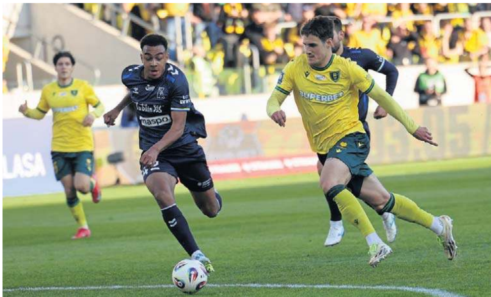
Motor (9-12-8) na pięć kolejek przed końcem oddalił się od gry o europejskie puchary

Chorwacki bramkarz Motoru w 23. minucie został zniesiony