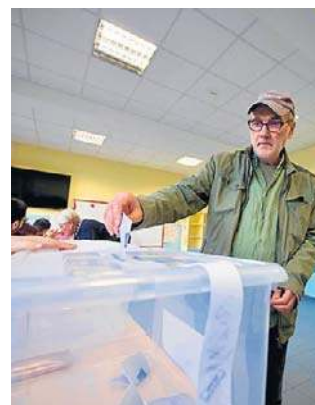
Od kwietnia 2021 roku Bułgarzy głosują ósmy raz

Próg wyborczy w wyborach parlamentarnych w Bułgarii wynosi 4 proc. dla partii i koalicji. Kadencja posła w jednoizbowym parlamencie trwa cztery lata. Uprawnionych do głosowania jest 6 575 151 wyborców.