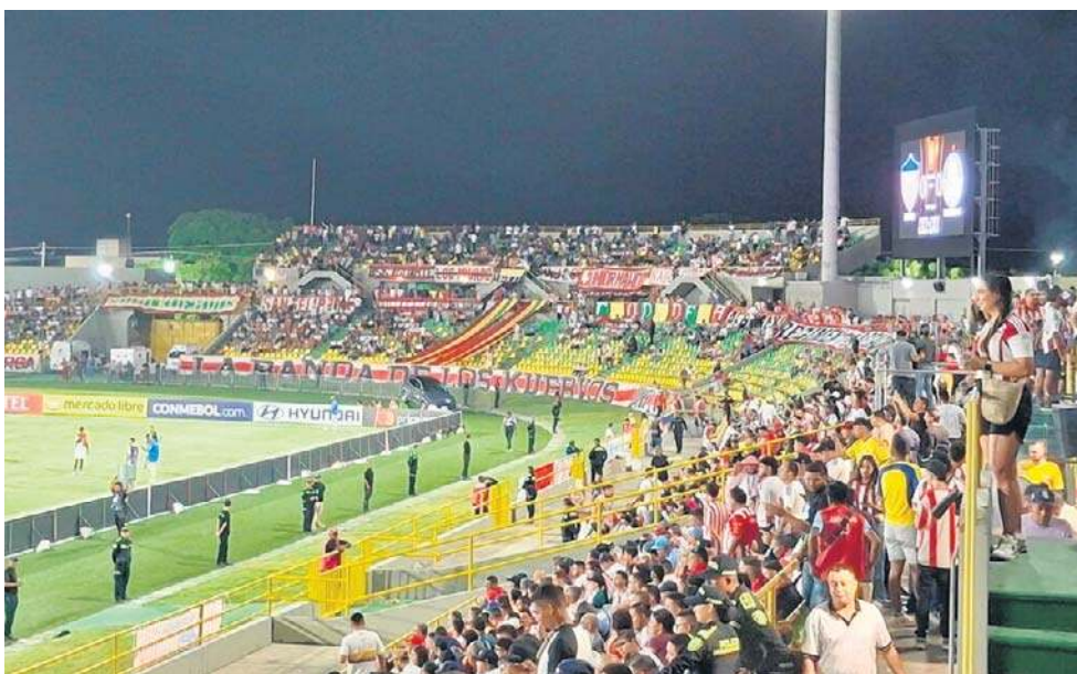
Atmosfera na meczach Copa Libertadores jest niepowtarzalna, inna niż w Europie. Na stadionie trwa istny karnawał! Głośne przyspiewki i fajerwerki niczym w nowy rok

Bilet na spotkanie można było kupić wyłącznie w specjalnej kolumbijskiej aplikacji „W Arena”, w której znajdują się wejściówki na różne mecze piłkarskie w tym kraju. Koszt? Trybuna za bramkami około 50 zł, trybuna wzdłuż boiska około 85 zł, natomiast ta główna, jedyna