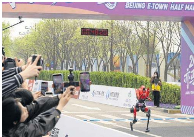
Robot humanoidalny Shandian zdecydowanie pokonał ludzi w pekińskim półmaratonie

W tegorocznej rywalizacji wzięło udział ponad 100 zespołów, pięciokrotnie więcej niż rok wcześniej. Aby wystartować, urzędnicy musieli spełniać rygorystyczne wymogi techniczne, w tym posiadać układ dwunożny i mierzyć od 75 do 180 cm. PAP