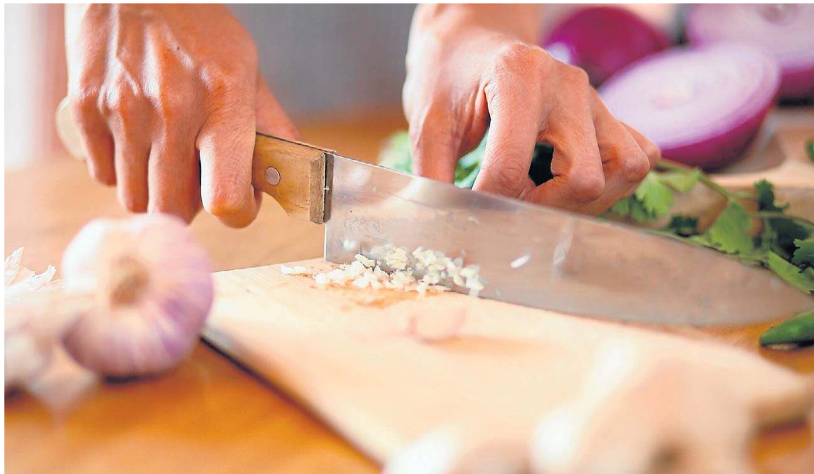
Najzdrowszy, a jednocześnie najbardziej podrażniający jest czosnek surowy

Może zdarzyć się także, że zjedzenie czosnku wywoła nie-