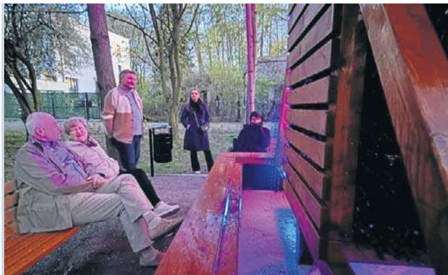
Obiekt działa sezonowo i stanowi pierwszą tego typu instalację plenerową w Lublinie