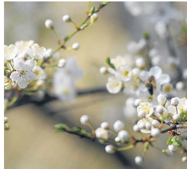
Wiosna jest szczególnie uciążliwa dla alergików. Dodatkowo zanieczyszczenie nasila objawy alergii

Dodatkowo refundacją objęto m.in. docetaksel w raku przełyku oraz paklitaksel w zaawansowanym raku żółci.