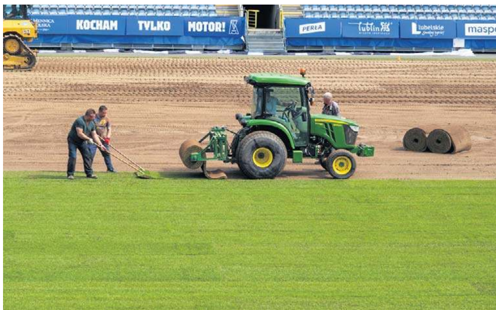
To druga wymiana murawy na Arenie od momentu oddania jej do użytku w 2014 roku. Poprzednio nawierzchnię zmieniono na przełomie lipca i sierpnia 2019 roku

Za całą operację odpowiedzialna jest warszawska firma DROPSERVICE, która najpierw zerwała zużytą nawierzchnię (po jej stronie jest także utylizacja starej murawy), a później przystąpiła do kładzenia nowej - to powinno zakończyć się w ciągu najbliższych godzin. W ra-