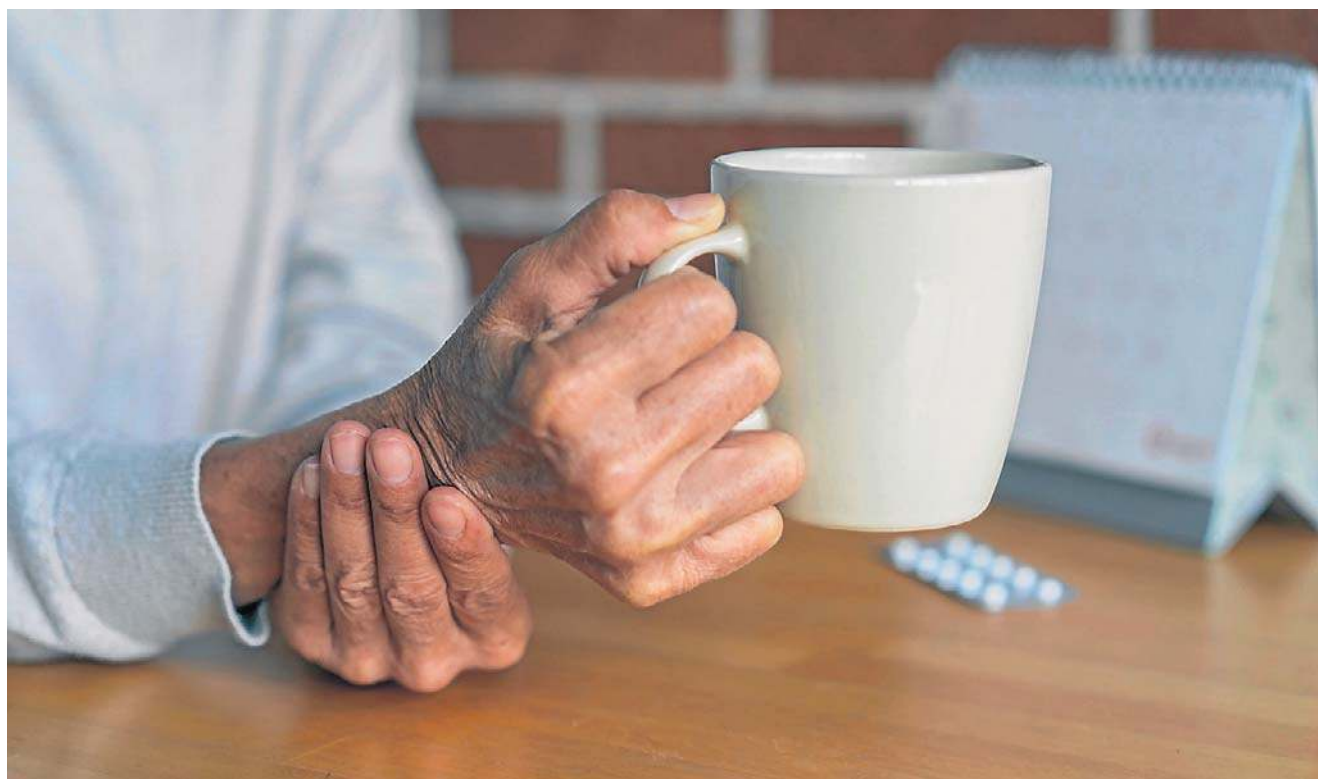
Choroba Parkinsona została nazwana na cześć angielskiego lekarza Jamesa Parkinsona, który w 1817 roku po raz pierwszy opisał główne objawy „drżączki porażnej”