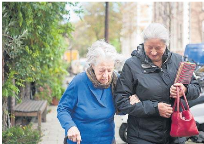
Świadczenie honorowe dla stulatków wynosi 6 938,92 zł brutto miesięcznie