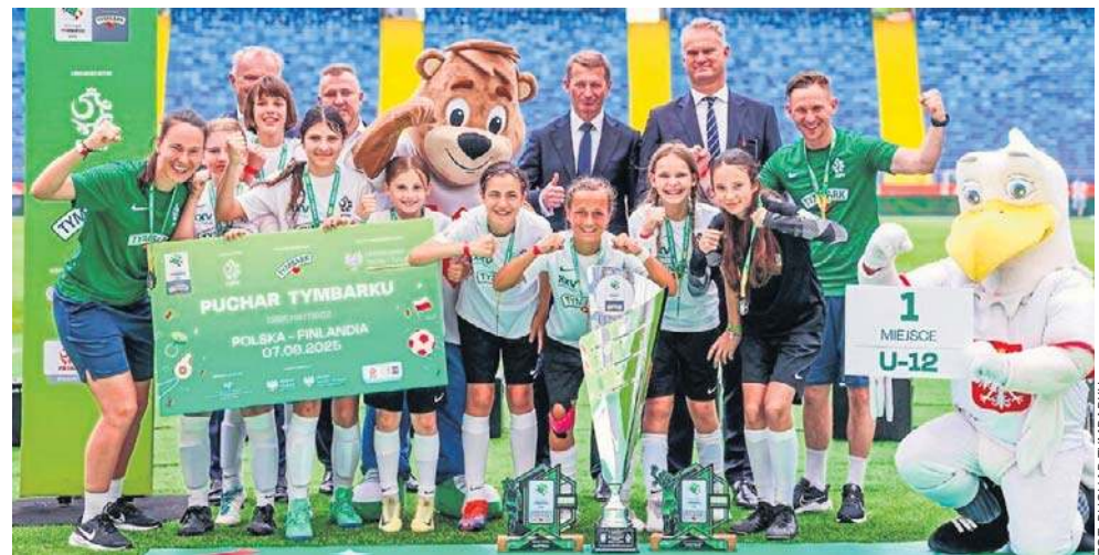
Tak piłkarki z SP w Przeźmierowie cieszyły się z wygranej w Pucharze Tymbark w 2025 r.

Ubiegłoroczny Finał na Stadionie Śląskim oglądała prawie cała szkoła. - Wiem, że kibicowało nam co najmniej 400 osób, a to był dopiero początek świętowania sukcesu, bo po naszym powrocie było królewskie powitanie zespołu z transparentami i licznymi gratulacjami. W promocję naszego osiągnięcia mocno włączył się też Urząd Gminy w Tarnowie Podgór-