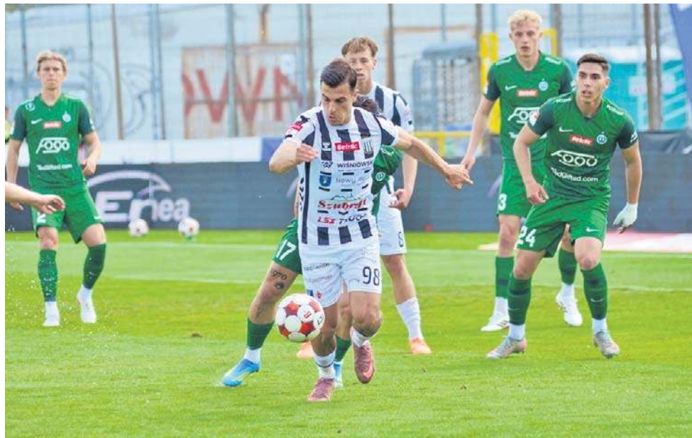
Warta Poznań stoczyła w niedzielne popołudnie twardego bóju z Sandecją