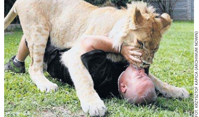
Wrzesień 2010 rok, Simba szybko rośnie, waży już 150 kg. To jednak młody kociak i bardzo lubi się bawić

A skąd wiadomo było, ile waży Simba? Dzięki podstępowi. Specjalna waga była ustawiana na jego wybiegu.