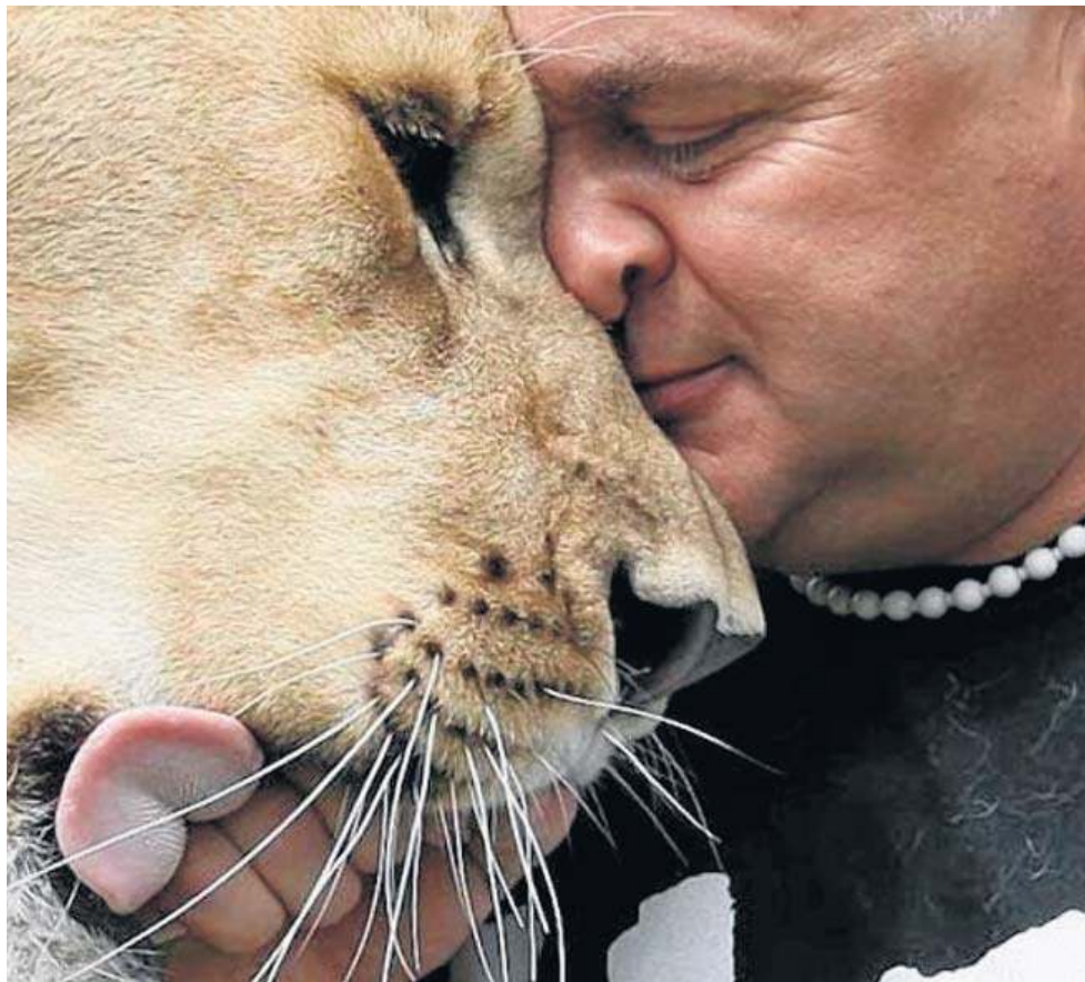
„Nowiny” w odwiedzinach w głogowskim ZOO. Nasi fotoreporterzy uwieczniają obrazy pokazujące niezwykłą więź, jaka łączy dzikiego kota i jego opiekuna

- To byłoby niemożliwe dla mnie i bardzo ciężkie. Nie cho-