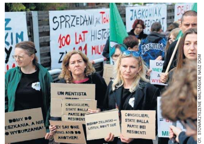
Tak wyglądał protest mieszkańców Os. Maltańskiego, wsparty przez gości z Hiszpanii, Włoch i Ameryki Płd.