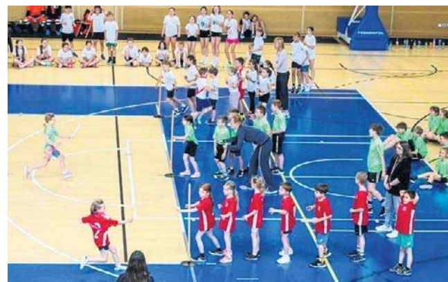
Młodzi sportowcy walczyli z ogromną ambicją

Tak jak się spodziewaliśmy „tor przeszkód” nie był specjalnie skomplikowany dla dzieci. Radziły one sobie z nim wspaniale, wykazując sprawność, zwinność i szybkość. Wszyscy uczestnicy wspaniale się dopinguwali, oglądaliśmy zaciętą walkę do ostatniej konkurencji, okrzyki euforii zwycięzców i niezwykle ambitną postawę tych, którzy musieli uznać wyż-