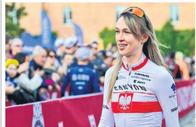
Pojawia się coraz więcej informacji o podpisaniu przez Katarzynę Niewiadomą kontraktu z nową grupą - Lidl-Trek