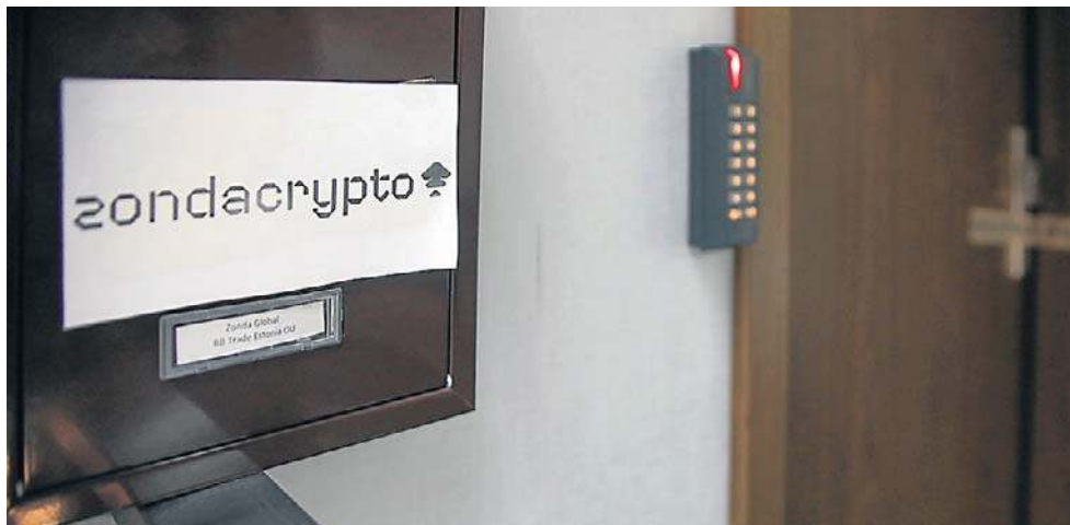
Liczba zawiadomień o możliwości popełnienia przestępstwa w śledztwie w sprawie Zondacrypto jest szacowana na około 1,5 tysiąca

na rzecz prezydenta Nawrockiego. To jest finansowanie bezpośrednie polityków prawicy, w tym byłego ministra Ziobro, za którego czasów, kiedy był prokuratorem generalnym, ta giełda rozhulała się na dobre, mimo że prokuratura dobrze wiedziała, jaka jest geneza tej firmy - powiedział Tusk.