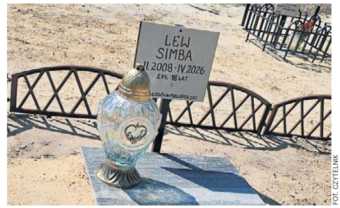
Lew został pochowany na cmentarzu dla zwierząt w Węgliskach koło Rakszawy

A na niej porcja mięsa. Chcąc zaspokoić głód, nieświadomy pomiaru lew wchodził na platformę i ujawniał swoją wagę.