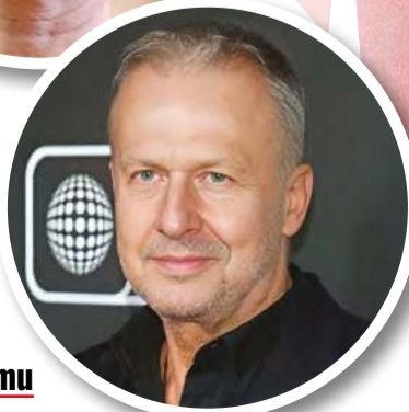
Tata polskiego twardzielizmu