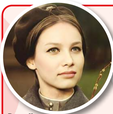
Pomnik narodowej urody