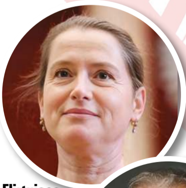
Flirtująca z historią

Mieszanka wybuchowa, genetyczny koktajl Mołotowa. Chłopiec – Gromosław Rewolwer. Z jednej strony dziedzictwo kontrowersyjnego generała, z drugiej – legenda filmowego twardziela. Skazany na życie w cieniu dwóch potężnych figur. Rozdarty między pragnieniem buntu a potrzebą lojalności. Publicznie broniłby dziadka generała, z zadziorną miną rzucając riposty w stylu ojca: „Bo to zła historia była”. Prywatnie zaś zmagalby się z demonami przeszłości, próbując odnaleźć własną tożsamość poza schematami narzucenymi przez rodzinne historie. Czy zostałby aktorem, politykiem, a może rewolucjonistą? Trudno powiedzieć. Byłby jak iskra rzucona na beczkę prochu, gotowa w każdej chwili rozpaść pożar.