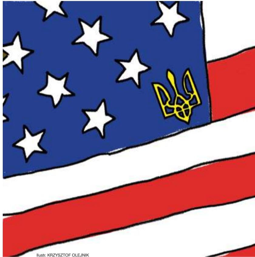
Ilustr. KRZYSZTOF OLEJNIK

Przyjmując Ukrainę do USA, prezydent Trump uwolni też liderów Unii Europejskiej od ukraińskiego kłopotu. Od wieloletnich nieskutecznych negocjacji akcesyjnych bloko-