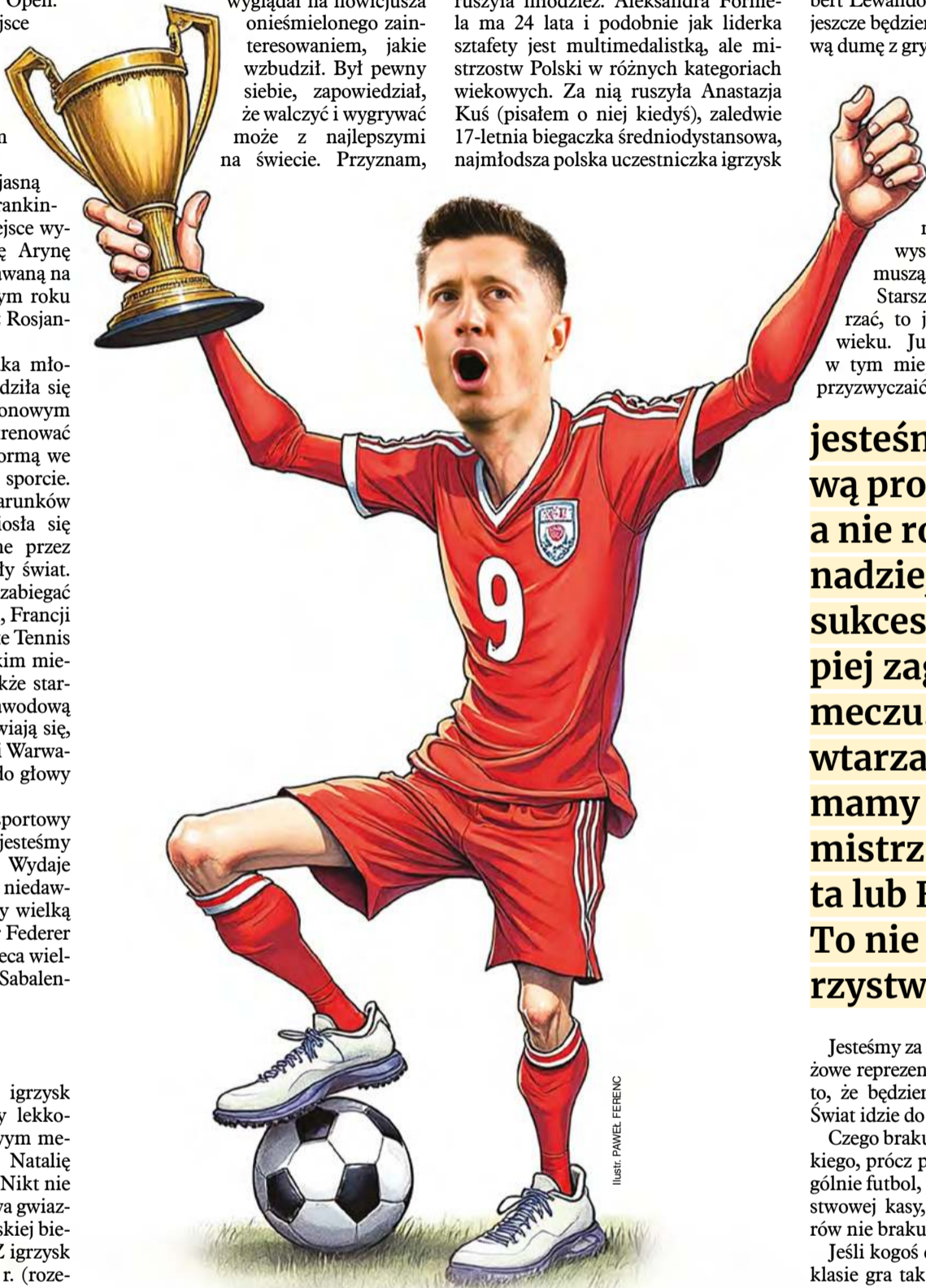
ILLUSTRACJA: PAWEŁ FERENC

WOJCIECH MITTELSTAEDT wojciech.mittelstaedt@interia.pl