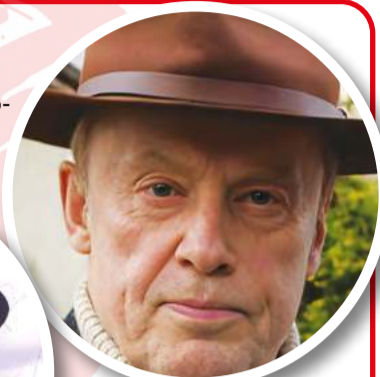
Kmicic z botoksem

Kim byłoby to biedne stworzenie? Koszmar senny każdego psychoanalityka. Z jednej strony geny matki – ostentacyjna wręcz subtelność maskująca wszakże żelazną wolę i nieustępliwość w dążeniu do celu. Z drugiej – ojcowski egocentryzm, pęd do bycia w centrum uwagi i niepomahowana potrzeba ekspresji. Od urodzenia czułby się jak książę w wylansowanym przez matkę królestwie kiczowatego przepychu. Otoczony dworem z plastikowych paproci i pluszowych tygrysków. Na szkolnej akademii deklamowałby Mickiewicza z uniesioną dłonią i łzą w oku. Na lekcjach historii przerywał nauczycielowi, by opowiedzieć o swojej roli w inscenizacji bitwy pod Grunwaldem. Kariera oczywiście artystyczna! Aktor, piosenkarz, a może polityk? Syn Rodowicz i Olbrychskiego to gotowy przepis na rozrywkową katastrofę.