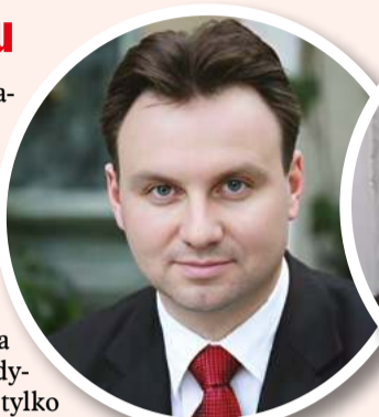
Ojciec narodu za młodu