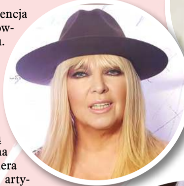
Pierwsza dama piór i lamety