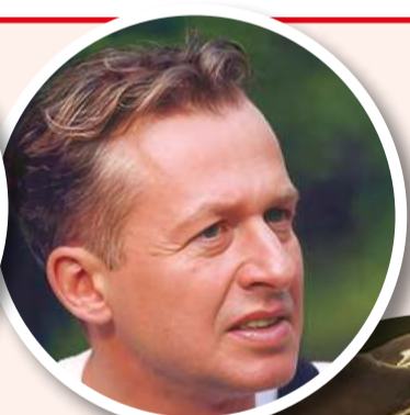
Ostatni prawdziwy mężczyzna