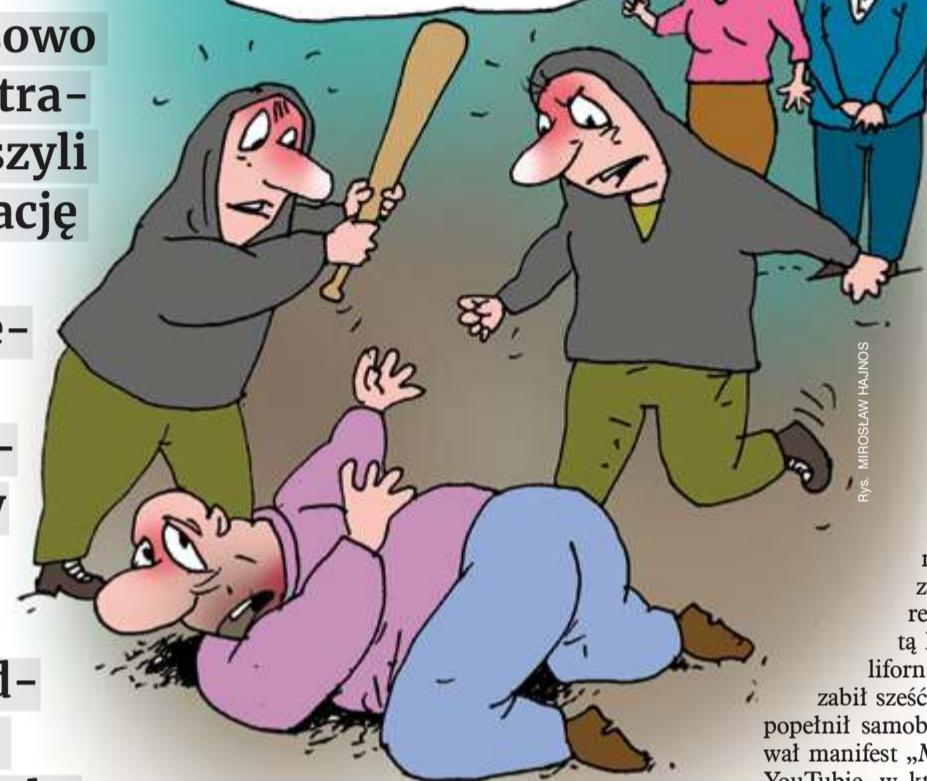
rys. MIROSŁAW HAJNOS