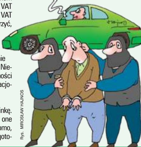
rys. MIROSŁAW HAJNOS

■ Policjanci z Ropczyc zatrzymali o czwartej nad ranem mężczyznę, który – ich zdaniem – jechał autostradą A4 pod prąd. Jednak sprawa nie jest tak jednoznaczna. 87-latek miał inną optykę. Po pierwsze, wracał do domu. Po drugie, według jego relacji nie poruszał się autostradą, lecz pasem zieleni między jezdniami, co w jego oczach oznaczało, że nie korzysta z drogi publicznej. Argument niecodzienny, ale wart rozważenia – w końcu kto z nas, niosąc na grzbiecie tyle lat, nie zasługuje choć na chwilę refleksji? Policjanci nie dali się przekonać. Odebrali seniorowi prawo jazdy.