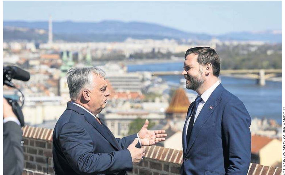
Premier Węgier Viktor Orbán wita wiceprezydenta USA J.D. Vance'a przed swoim biurem, byłym klasztorem karmelitów w Budapeszcie

- Myślę, że premier Orbán jest najbardziej wpływowym przywódcą Europy w kwestiach bezpieczeństwa energetycznego i niezależności. To