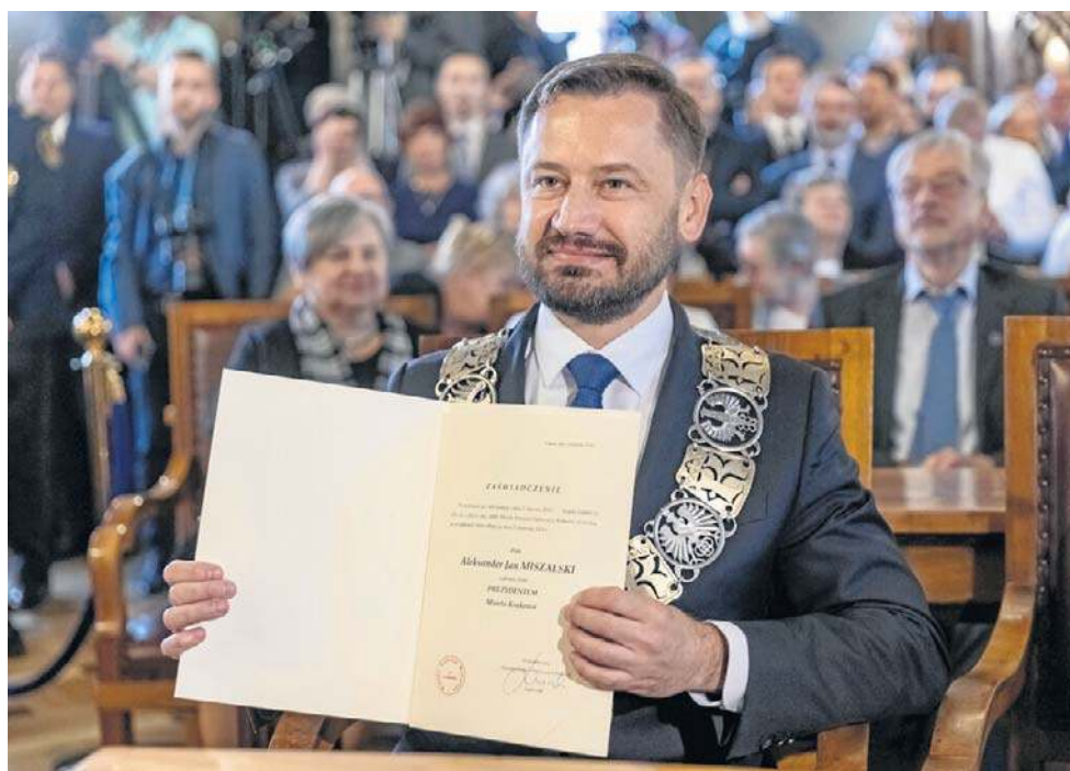
7.05.2024, dzień zaprzysiężenia Aleksandra Miszalskiego. Czy dokończy kadencję?

Zadowolenia nie kryje część internautów: W sieci możemy przeczytać takie komentarze jak: „Brawo krakowianie”, Chwała Bogu. Gonimy z Ojczyzny”, „Každy krakowianin, któremu leży dobro Krakowa na sercu po-