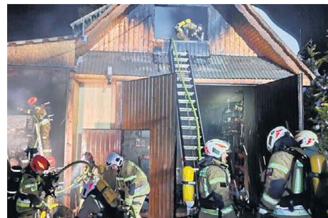
Spalił się warsztat mechaniczny, źródło dochodu rodziny strażaka ochotnika. Trwa zbiórka dla poszkodowanego