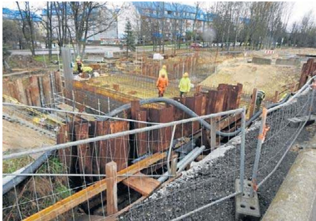
Przebudowa DK 94 w Olkuszu. Prace trwają na dużym odcinku, mają skończyć się we wrześniu

Zgodnie z informacjami inwestora obecnie postęp prac prezentuje się w następujący sposób: ● zaawansowanie finansowe - 59,43 proc. ● postęp robót, branża drogowa - 60,64 proc. ● postęp robót, branża konstrukcyjno-inżynierska - 32,75 proc. ● postęp robót, branża sanitarna - 78,10 proc.