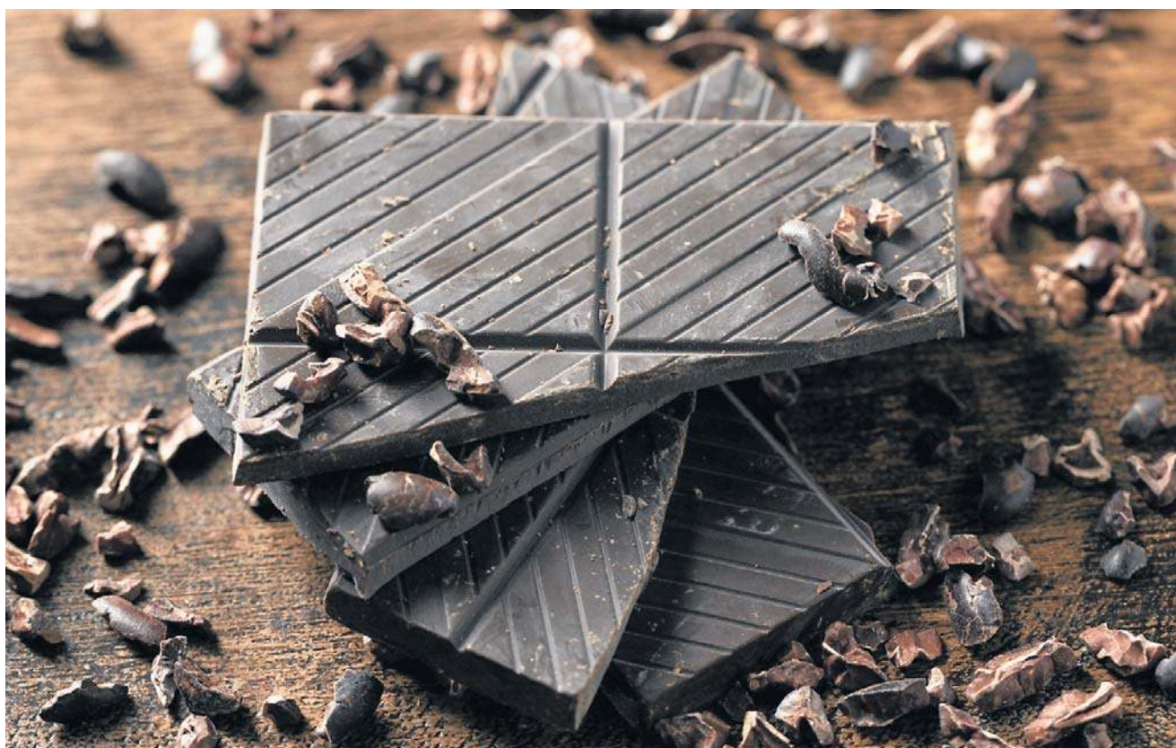
Gorzka czekolada może wpływać na zmniejszenie stężenia insuliny we krwi

Inne badania potwierdziły, że ciemna czekolada może zmniejszyć łaknienie i dawać uczucie sytości, co może być