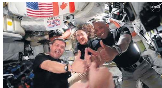
Astronauta misji kosmicznej Artemis II

Podczas przelotu nad niewidoczną stroną Srebrnego Globu, w trakcie którego łączność z NASA była całkowicie niemożliwa, załoga była świadkiem zjawiska wschodu i zachodu Ziemi.