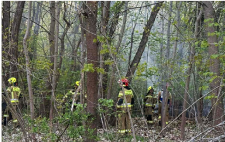
Mieszkańców zaniepokoiło zadymienie w rejonie Rokity.