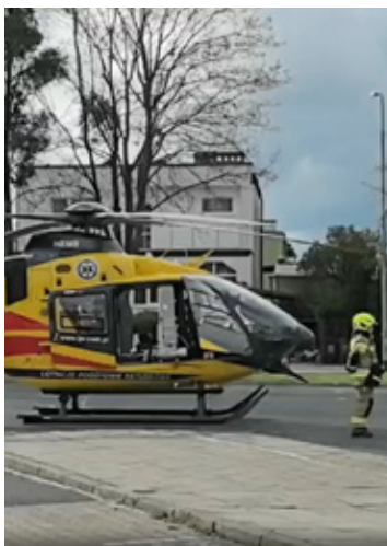
Śmigłowiec Lotniczego Pogotowia Ratunkowego lądował na placu targowym w Brzegu Dolnym.

Gdy dyspozytor medyczny przyjął zgłoszenie, okazało się, że wszystkie okoliczne ambulanse są zajęte w innych akcjach lub transportach. W takich przypadkach procedury są nieubłagane: aby nie tracić czasu na dojazd karetki z odległego powiatu, do akcji wzywane jest Lotnicze Pogotowie Ratunkowe. Z bazy we Wrocławiu natychmiast wystartował śmigłowiec „Ratownik 13”. Na miejscu lądowanie maszyny