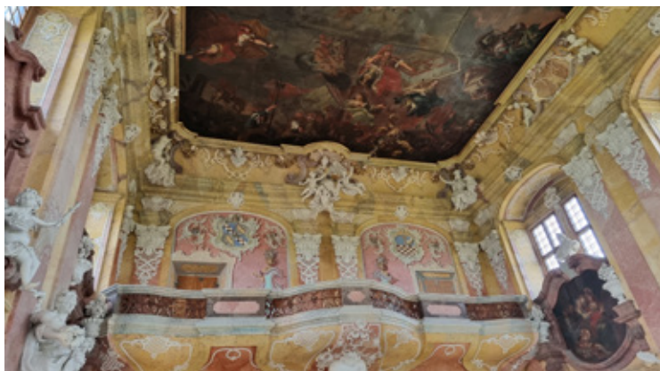
Sala Książęca - jedno z najbardziej imponujących wnętrz barokowych w całym klasztorze.