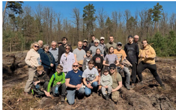
Uczestnicy akcji sadzenia drzew w gminie Wołów.

– Każde takie działanie ma znaczenie dla przyszłości naszych lasów. Cieszę się, że wspólnie z pszczelarzami i ich rodzinami możemy podejmować inicjatywy