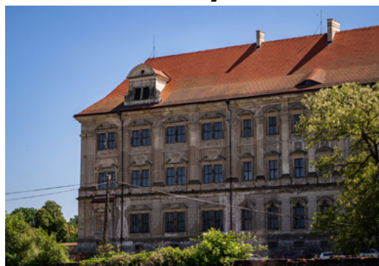
Fasada obiektu przytłacza ogromem.

Początki Lubiąża sięgają XII wieku. Cystersi przybyli do grodu nad Odrą 16 sierpnia 1163 roku, sprowadzeni z turyńskiej Pforty przez księcia Bolesława I Wysokiego. Przez stulecia opactwo stanowiło serce gospodarstwa i literackie Śląska, budując swoją potęgę dzięki licznym darowiznom i ciężkiej pracy mnichów. Choć wojny husyckie i okresy niepokojów przerywały ten rozwój, to po wojnie trzydziestoletniej, za rządów wybitnych opatów Arnolda Freibergera i Jana Re-