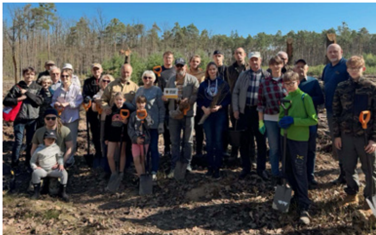
Uczestnicy akcji sadzenia drzew w gminie Wołów.

W wydarzeniu uczestniczyły osoby w różnym wieku. Młodszy i starsi pracowali razem przy sadzeniu drzew. Takie działania mają znaczenie dla środowiska i są formą aktywności