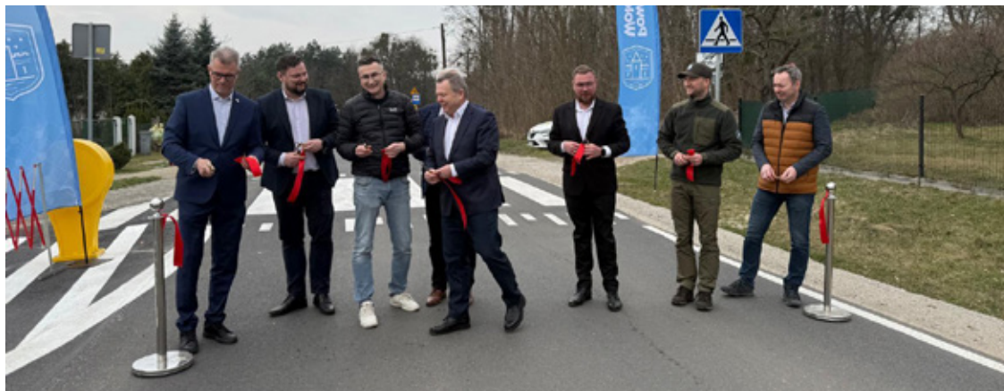
Droga Wołów-Gródek nazywana „drogą wstępu” wyremontowana została z pieniędzy powiatu.

– Tak. Niestety, według danych, które posiadamy, nasza realna zdolność inwestycyjna jako powiatu to około 1,8 mln zł rocznie. Tymczasem realizujemy inwestycje za kilkanaście milionów złotych. Trzeba umieć znaleźć na te działania pieniądze.