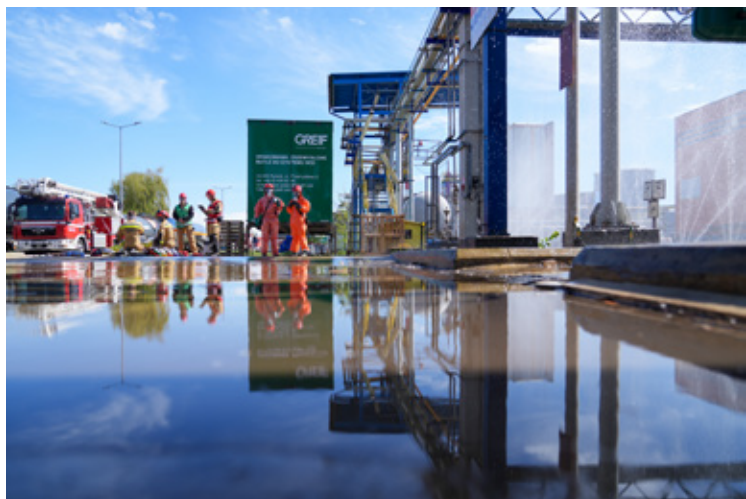
Fot. Dolnośląski Urząd Wojewódzki we Wrocławiu