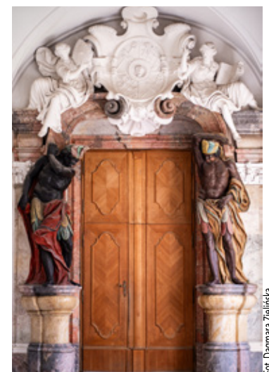
Ikoniczne drzwi prowadzące do Sali Książęcej.