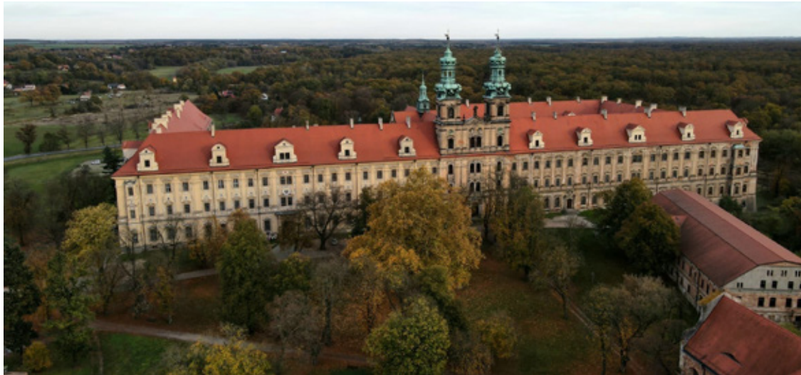
Jeden z największych zespołów klasztornych w Europie - budowla o długości 220 metrów i powierzchni blisko 2,5 ha.

W racam do klasztoru pocysterskiego w Lubiążu. Za każdym razem, kiedy tu wchodzę, widzę to samo, ogrom miejsca, które przetrwało więcej, niż powinno. Między pustką a odnowionymi salami, między ciszą a śladami dawnej potęgi. To nie jest już tylko opowieść o upadku. To także historia tego, co mimo wszystko zostało i tego, co wciąż próbuje się tu ocalić.