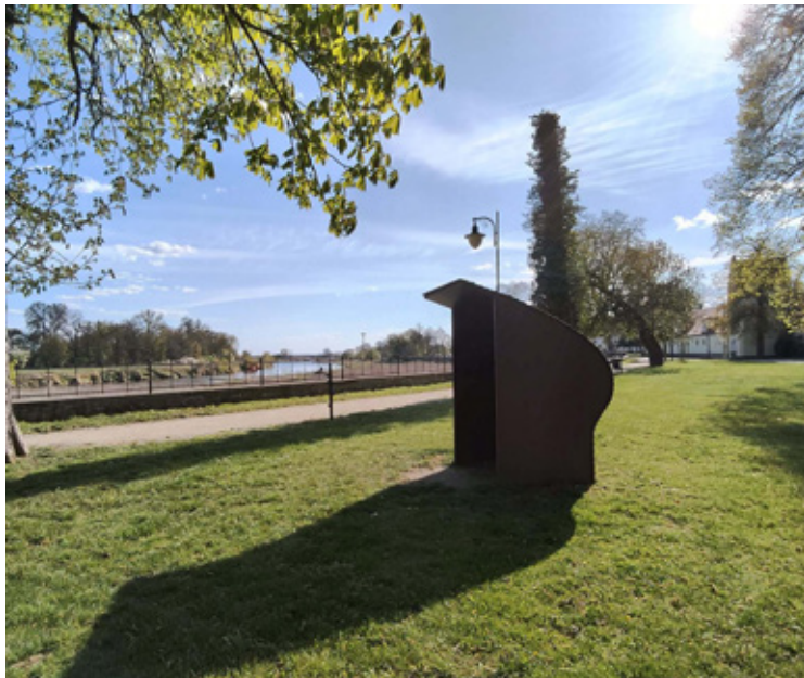
Dźwiękoławka w Brzegu Dolnym.

Od trzech lat bulwar spacerowy za pałacem w Brzegu Dolnym kryje niezwykłą instalację, która pozwala zatrzymać się w codziennym biegu. Dźwiękoławka, będąca częścią Dźwiękowego Szlaku Odry, to nie tylko mebel miejski, ale przede wszystkim brama do świata natury. Sprawdziliśmy, dlaczego ta „soczewka akustyczna” stała się ulubionym punktem odpoczynku mieszkańców i co o jej dźwiękowym potencjale mówi ekspert, Michał Zygmunt.