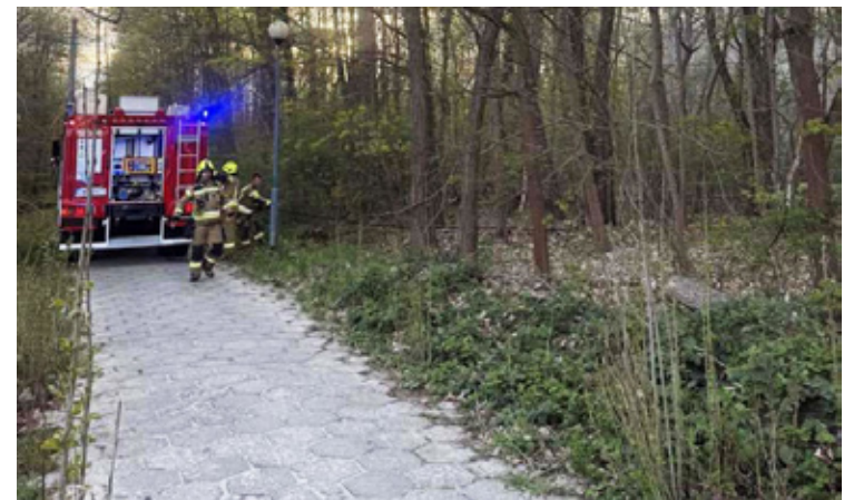
Strażacy podali jeden prąd wody na palącą się ściółkę w dolnobrzeskim parku.