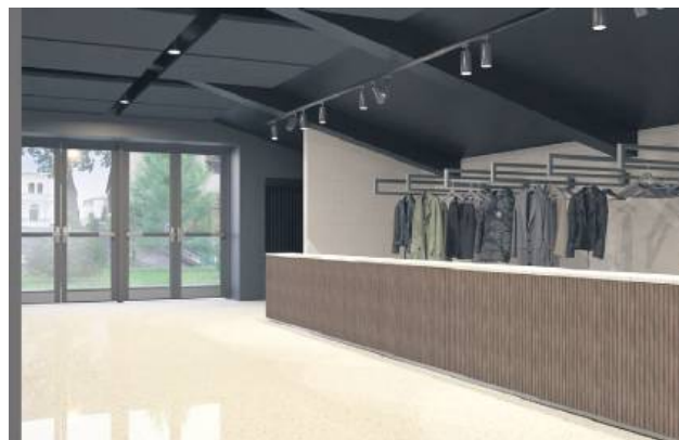
Tak ma wyglądać hol po modernizacji.

Przy dobrych, szybkich decyzjach związanych z uzyskaniem dofinansowań chcielibyśmy jeszcze w tym roku wyłonić wykonawcę robót modernizacyjnych w HDK. Myślę, że będzie to jak