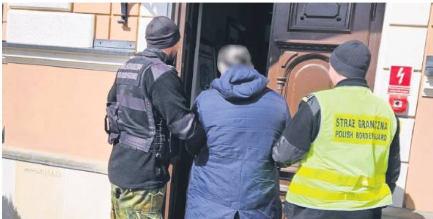
Funkcjonariusze prowadzą poszukiwanego obywatela do zamojskiej prokuratury.

W trakcie kontroli granicznej okazało się, że cudzoziemiec jest poszukiwa-