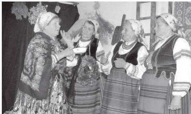
Mieszkańcy części wschodniej Lubelszczyzny mówili i poniekąd wciąż jeszcze mówią polskim dialektem kresowym. W jego ramach dają się wyróżnić gwary Podlasia, Chełmskie i Pobuża.

W języku Lubelszczyzny można wyróżnić trzy zespoły dialektalne, a w ich ramach wydzielić mniejsze gwary. Najgłębszy jest podział pionowy, „południkowy”, na wschód i zachód województwa. Mieszkańcy części wschodniej mówili i poniekąd