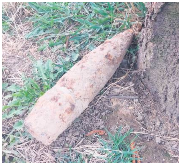
Niebezpieczny przedmiot znajdował się w ogródku.