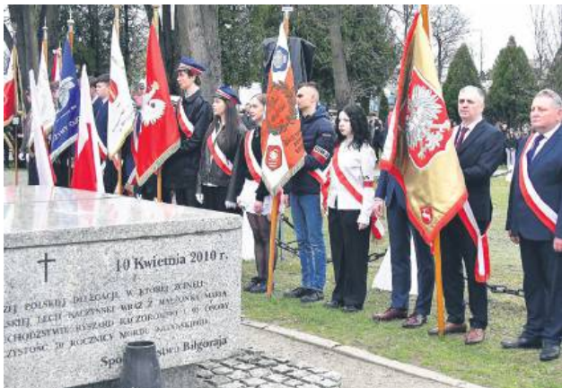
Uroczystości odbyły się przy pomniku katyńskim.

14 kwietnia w Biłgoraju miały miejsce uroczystości upamiętniające 85. rocznicę Zbrodni Katyńskiej. Obchody rozpoczęły się zbiórką pocztów sztandarowych przy Krzyżu Katyńskim na cmentarzu przy ul. Lubelskiej, po czym odprawiona została msza św. w intencji ofiar sowieckiej zbrodni. – Gromadzimy się przy pomniku, aby przypomnieć wszystkie ofiary tej ogromnej rzezi w czasie wojny, ofiary Katynia. Pamiętamy o wszystkich, którzy na przestrzeni wieków oddali swoje życie za ojczyznę. Niech ich imię