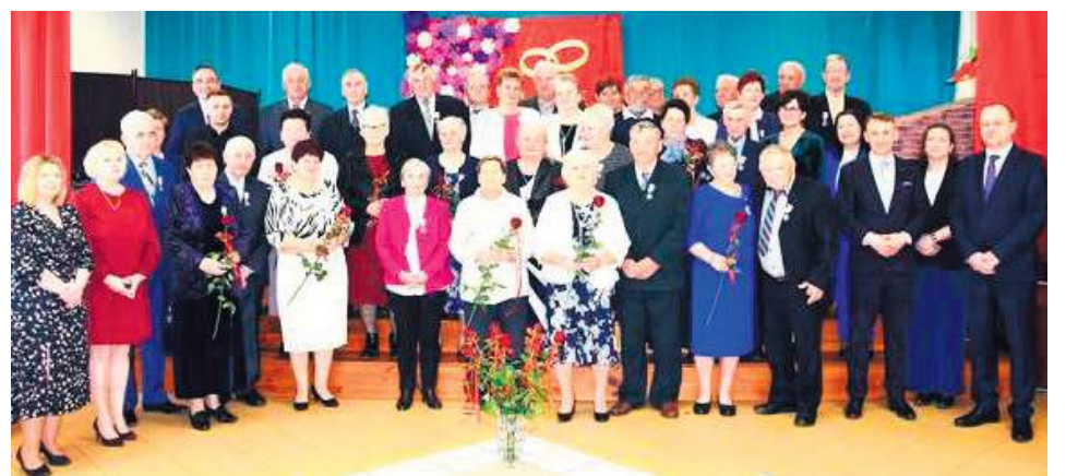
Złote gody odbyły się 9 kwietnia w Sitnie.