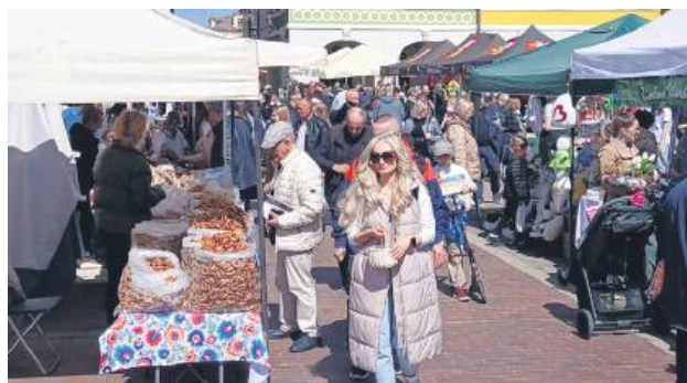
Na stoiskach handlowych można było znaleźć ozdoby, wyroby rękodzielnicze oraz produkty regionalne, zarówno spożywcze, jak i artystyczne.

K iermasz Wielkanocny odbył się w Niedzielę Palmową (13 kwietnia). Wielkanocna atmosfera udzieliła się sprzedawcom i kupującym. W programie wydarzenia było sporo atrakcji. Na stoiskach handlowych można było znaleźć ozdoby, wyroby