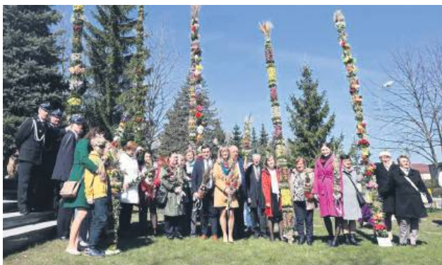
Uczestnicy 13. edycji konkursu powiatowego.

W niedzielę, 13 kwietnia, w Bełżcu po raz trzynasty odbył się Powiatowy Konkurs na Palmę Wielkanocną. Do konkursu zgłoszono 22 palmy przygotowane przez dzieci, młodzież oraz Koła Gospodyń Wiejskich z terenu powiatu tomaszowskiego.