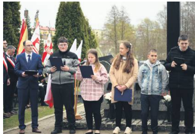
Uczniowie Zespołu Szkół Specjalnych w części artystycznej.

zatajana. Dopiero w 1990 roku, po latach kłamstw i milczenia, przyznano, że Katynь była jedną z najcięższych zbrodni stalinizmu. Zgromadzeni oddali hołd wszystkim tym, którzy zginęli w Katyniu, Charkowie, Twerze, Miednoje i innych miejscach kaźni. – To dzięki nim możemy żyć w wolnym kraju, w którym wartości, za które walczyli, powinny być dla nas fundamentem. Niech ich ofiara będzie dla nas przypomnieniem o tym,