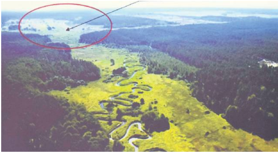
Planowana lokalizacja zbiornika.

Planowane były niezwykle ambitne, jednak nie konkretnego z nich nie wyszło. Jego budowa miała być realizowana w ramach rządowego programu ochrony powodziowej w latach 2012-2015. Wówczas jego koszt szacowano na około 40 mln zł. Zajmować miał powierzchnię 100 ha, a jego szacowana pojemność to 2 500 tys. metrów sześciennych. Oprócz niego w ramach rządowych środków miały powstać dwa inne zbiorniki – w Borowcu (gm. Łukowa) oraz II etap budowy zbiornika Biszcz-Zary.