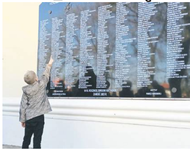
Nowa tablica wygląda okazale, ma wymiary 3 na 2 m i jest eksponowana na zewnętrznej ścianie prezbiterium kościoła Św. Katarzyny.

13 kwietnia to Dzień Pamięci Ofiar Zbrodni