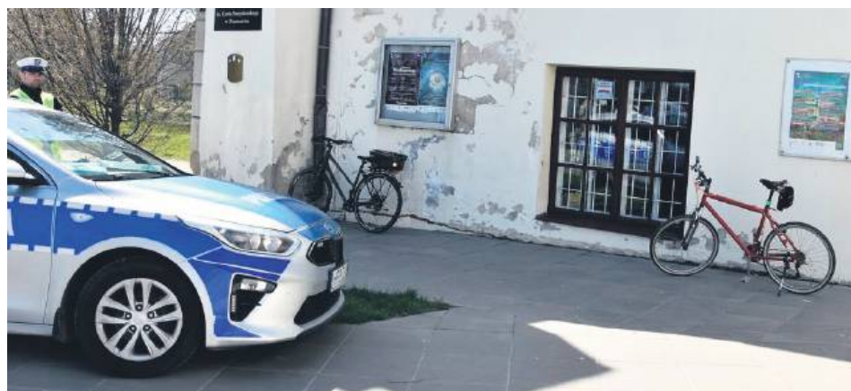
Rowerzyści zderzyli się na chodniku. Mężczyzna był pijany.