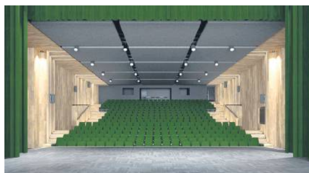
Tak wygląda wizualizacja zmian po modernizacji sali widowiskowej.