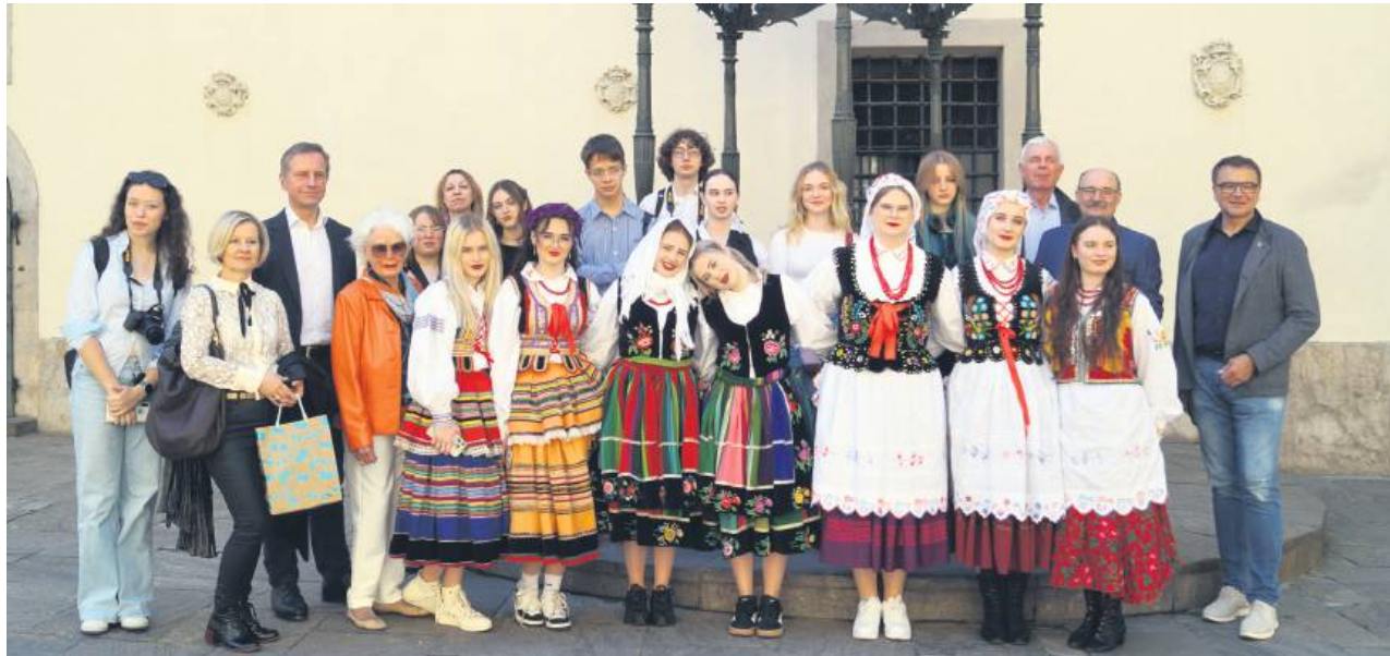
Dziewczęta z Tomaszowa Lubelskiego pięknie promowały naszą rodzimą kulturę.