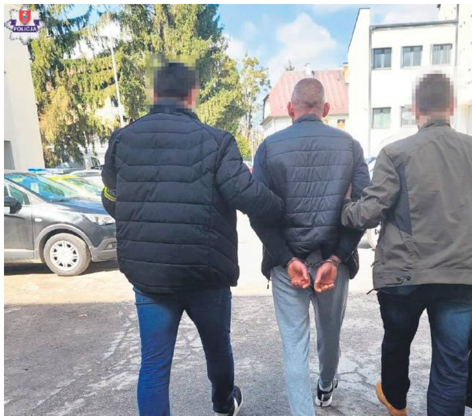
Kryminalni z zamojskiej komendy zatrzymali 38-latka, u którego w mieszkaniu odnaleźli znaczną ilość narkotyków.

– Wstępne badanie zabezpieczonych narkotyków wykazało,