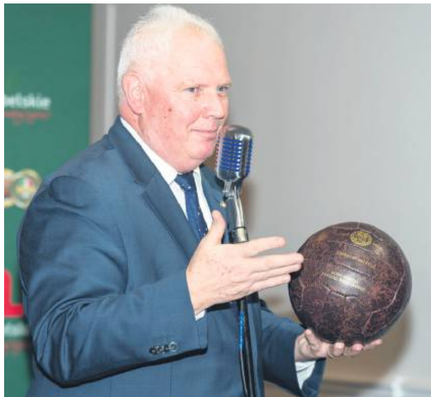
Zbigniew Bartnik będzie się ubiegał o ponowny wybór na prezesa Lubelskiego Związku Piłki Nożnej.

Oddział LZPN w Zamościu będzie miał na jeździe wyborczym LZPN dwudziestu siedmiu przedstawicieli – dwudziestu pięciu delegatów klubowych