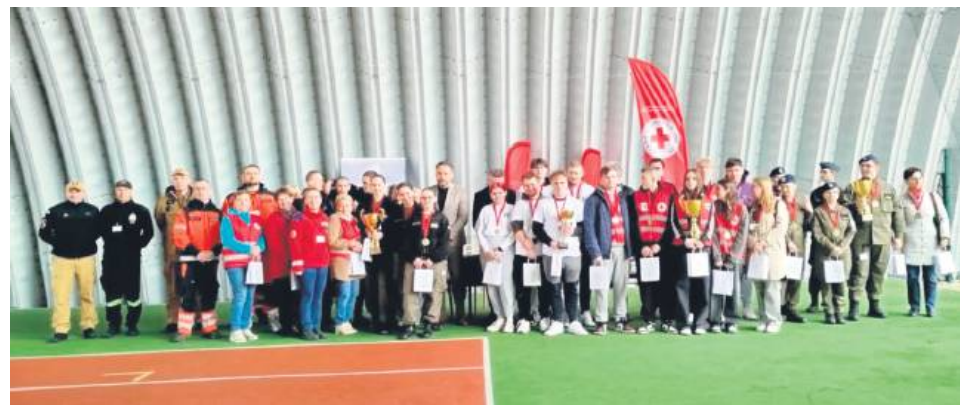
Udział w zawodach brały cztery drużyny.