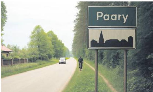
Mężczyzna skarżył się na brak jakiegokolwiek transportu publicznego do Tomaszowa Lubelskiego poza dniami nauki szkolnej.

Punktem wyjścia do interwencji był sygnał od mieszkańca wsi Paary (gm. Susiec) w powiecie tomaszowskim. Mężczyzna skarżył się na brak jakiegokolwiek transportu publicznego do Tomaszowa Lubelskiego poza dniami nauki szkolnej (chodzi nie tylko o weekendy, ale także o ferie, wakacje i inne dni wolne od pracy).