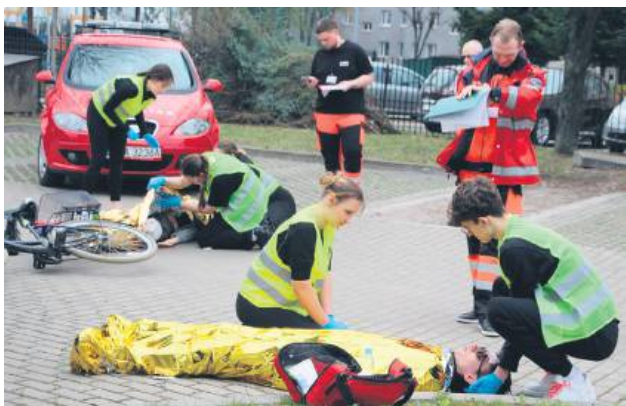
Uczestnicy musieli zaliczyć pięć stacji, które sprawdziły ich umiejętności.