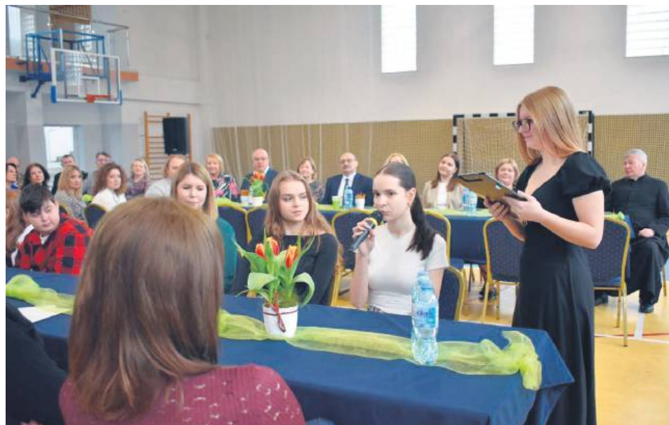
Podczas sejmiku padło wiele inspirujących słów.