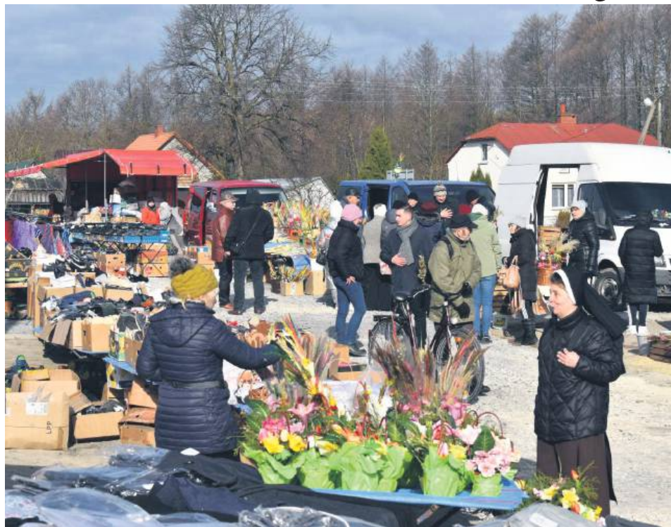
Targowisko w Bełżcu rozpoczęło swoją działalność 7 kwietnia. W każdy poniedziałek na placu targowym będzie można kupić m.in. odzież, tekstylia, świeże warzywa i owoce, miody, wyroby wędliniarskie, karmę dla zwierząt oraz lokalne rękodzieła.

Dodaje, że motywacją, by targ zaczął znów działać, była także chęć wsparcia lokalnego biznesu.