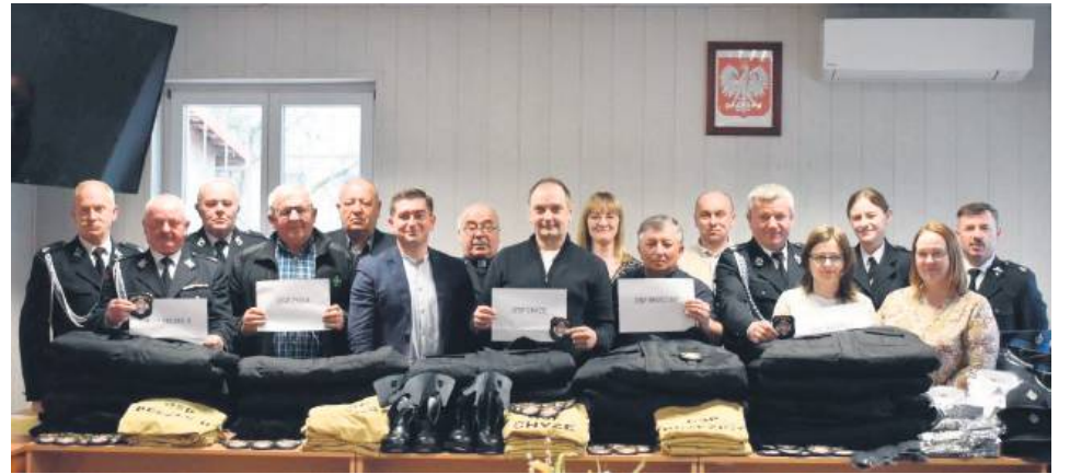
Nowe umundurowanie dla strażaków z gminy Bełzec.