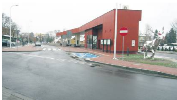
Hrubieszowskie Centrum Komunikacyjne zostanie otwarte 25 kwietnia, ale działa od stycznia tego roku.

Hrubieszowskie Centrum Komunikacyjne (HCK) wybudowano w miejscu przystanku busów przy ul. Piłsud-