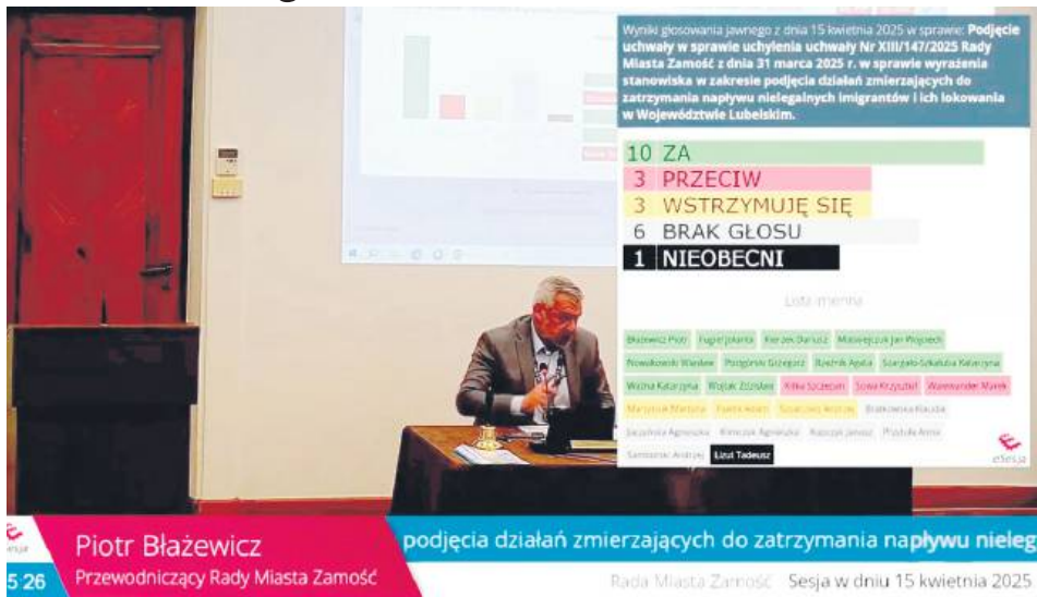
Wyniki głosowania w sprawie uchwały.