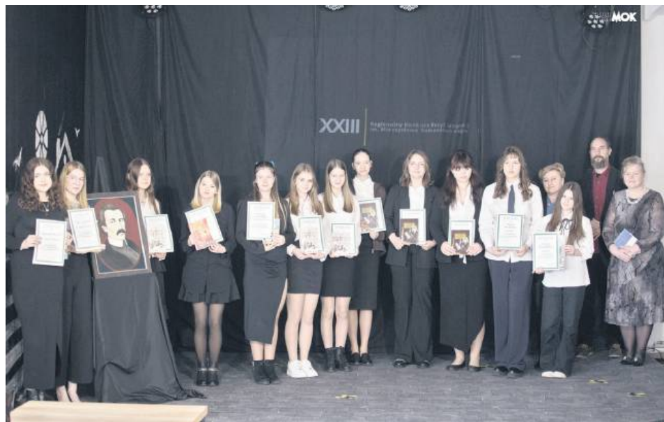
Konkurs ma upamiętnić wydarzenia Powstania Styczniowego.