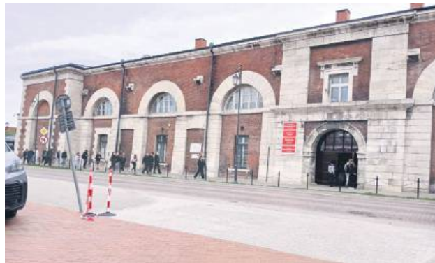
Uczniowie muszą ciut nadrobić drogi, bo miasto nie planuje kolejnego przejścia dla pieszych.

Po drugiej stronie ulicy otwarto niedawno lokal, który oferuje nie tylko kanapki, ale też pizzę, ciasta itd. Na miejscu pieczone są chleby, bułki oraz pizze, które można wziąć na wynos albo zjeść na miejscu. Przystanek Piekarza , bo tak nazywa się lokal, ma już wielu klientów, wśród których nie brakuje uczniów Zespołu Szkół Ponadpodstawowych nr 1 („Ekonomik”), który znajduje się vis-a-vis. – Może byśmy zaprosili panią dyrektora, żeby pouczyła uczniów, że takie prze-