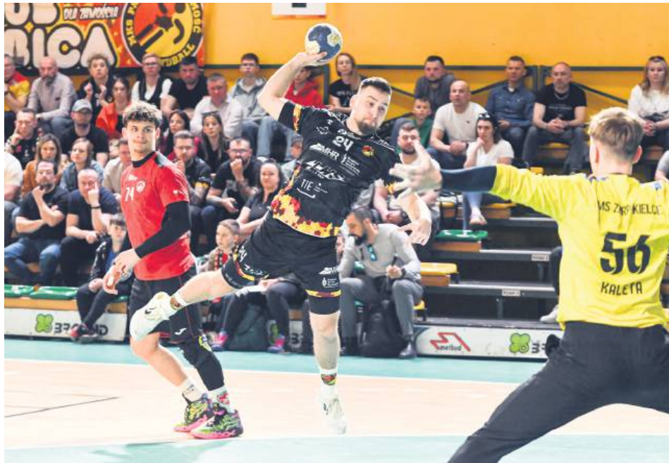
Padwa Zamość pewnie pokonała kielecką młodzież.

Już na rozgrzewce widoczna była różnica w kilogramach i centymetrach. Naprzeciwko zamościan wybiegli juniorzy, którzy nie mogli równać się z miejscowymi pod względem fizycznym. Za to jak najbardziej konkurowali pod względem szybkościowym i wytrzymałościowym. Kielecka młodzież dotrzymywała żółto-czerwonym kroku do 22 minuty. Wtedy po raz ostatni na tablicy pojawił się remis (13:13). Kolejne pięć bra-