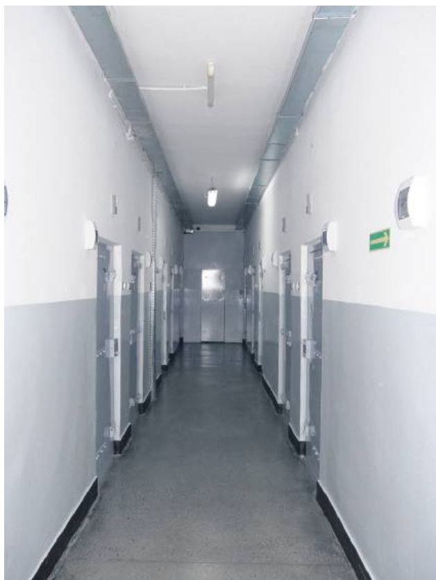
Nauczyciel został tymczasowo aresztowany.

15 kwietnia nauczyciel stawiał się w prokuraturze. – Zgromadzony w sprawie materiał dowodowy