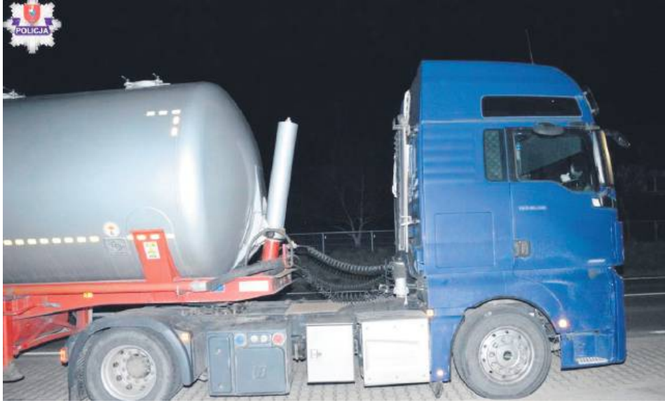
40-latek z powiatu zamojskiego kompletnie pijany kierował cysterną.

Oficer dyżurny zamojskiej komendy w poniedziałkowe popołudnie otrzymał