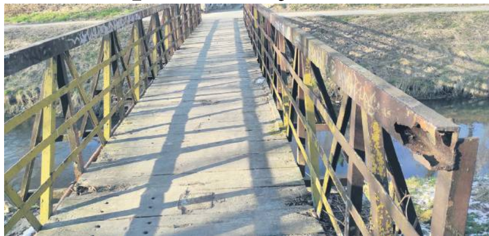
Deski z ubytkami zostaną wymienione, natomiast na większy remont trzeba będzie poczekać.