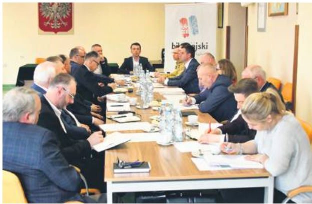
Podczas spotkania dyskutowano o tym, jak przygotować samorządy na sytuację kryzysową.

Wydarzenie zgromadziło przedstawicieli samorządów gminnych, członków Zarządu Powiatu, burmistrzów oraz wójtów, a także przedstawicieli Komendy Powiatowej Państwowej Straży Pożarnej. Do powiatu biłgorajskiego jeszcze w bieżącym roku ma trafić około 8 mln zł oraz 8,5 mln zł