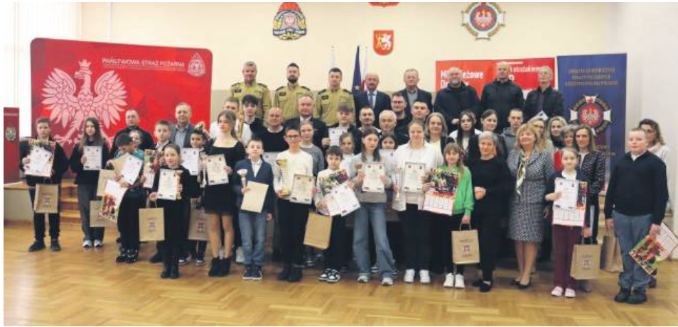
Uczestnicy eliminacji powiatowych Ogólnopolskiego Turnieju Wiedzy Pożarniczej.