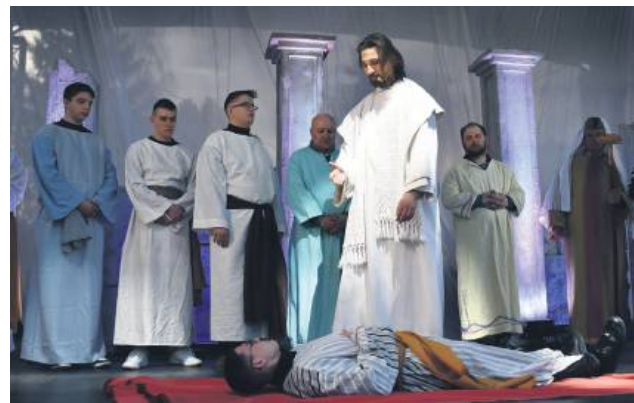
Misterium w Goraju.