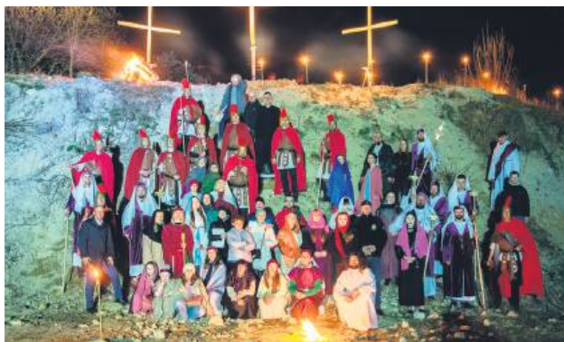
Misterium w Tereszpolu-Zaorendzie.

zostało wiele organizacji, instytucji i firm.