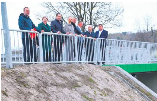
Nowa kładkę oficjalnie odebrano 15 kwietnia.

Jacynka to mała rzeka przepływająca przez Jacnię. 15 kwietnia oficjalnie odebrano tam nową kładkę pieszą nad rzeczką, którą za 521 tys. zł zrealizowały wspólnie samorządy gminy Adamów i powiatu zamojskiego.