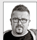
ratuszniak@ol.com.pl tel. 14 670 27 80