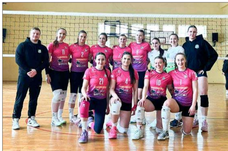
Dla Wisłoki to koniec sezonu zasadniczego, ale nie koniec gry.

Dodaje, że to ogromne osiągnięcie drużyny, która po reaktywacji gra dopiero drugi sezon w seniorskiej siatkówce. A było to możliwe