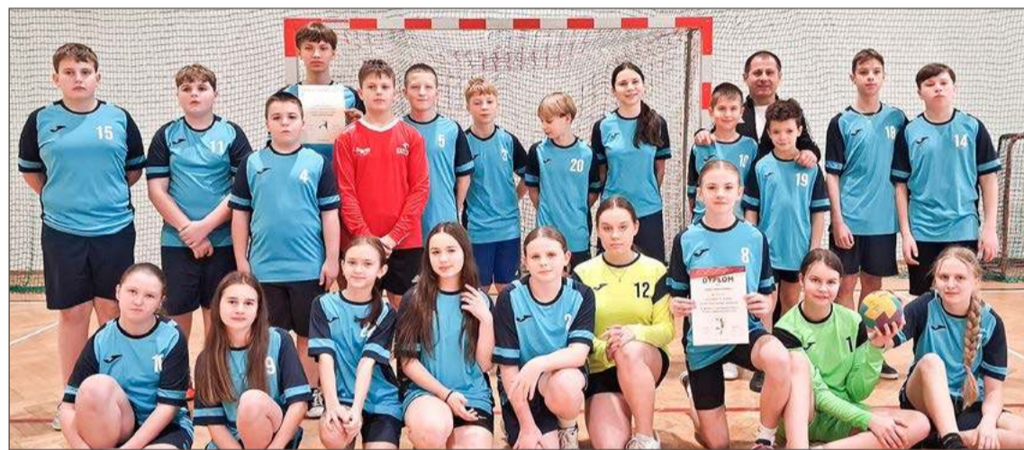
Dziewczęta i chłopcy z Czarnej znakomicie radzą sobie na boiskach siatkarskich i koszykarskich.