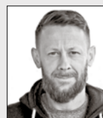
krol@ol.com.pl tel. 14 670 27 87