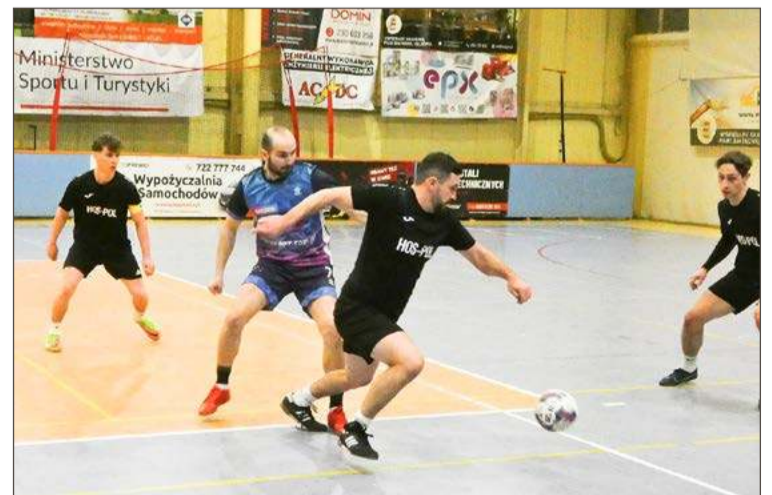
Hos-Pol (czarne stroje) oddalił się od podium po dwóch porażkach.