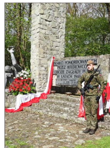
Góra Śmierci jest miejscem pamięci narodowej.

W wydarzeniu nie chodzi tylko o sportową rywalizację, ale i upamiętnienie ofiar nazistowskiej ide-