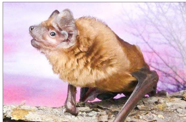
Jeden z borowców wielkich, który kuruje się w Przeczycy.