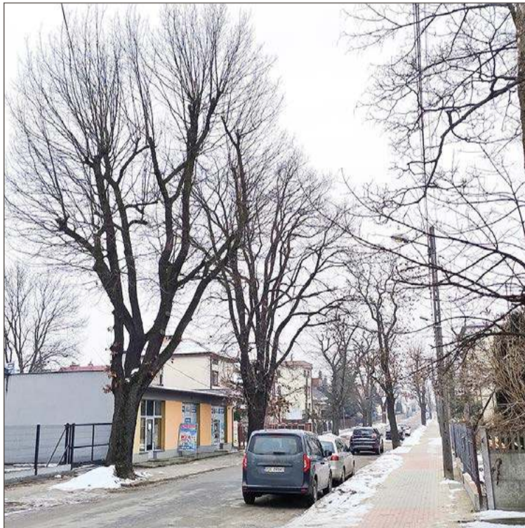
Te dęby trafią do rejestru po zakończeniu prac przy ul. Bojanowskiego.

- Podczas burzy w sierpniu 2023 roku utraciliśmy jeden pomnik przy ul. Piaski. W 2024 roku status pomnika zostały pozbawione dwie lipy przy ul. Głowackiego, a dwie kolejne w 2025 roku, jedna złamała się podczas burzy. Te lipy przy ul.