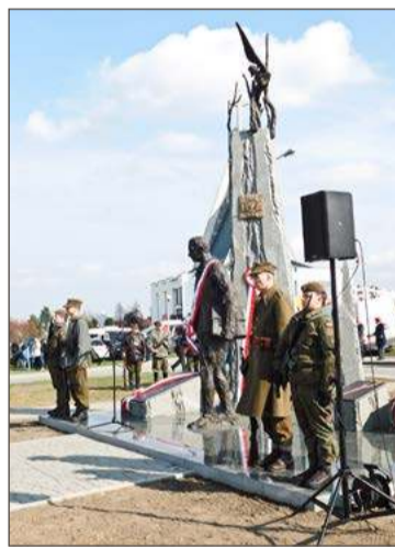
Główne uroczystości odbędą się pod tym pomnikiem.