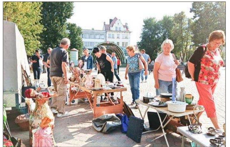
Jarmarki zaplanowano w każdą drugą sobotę miesiąca.