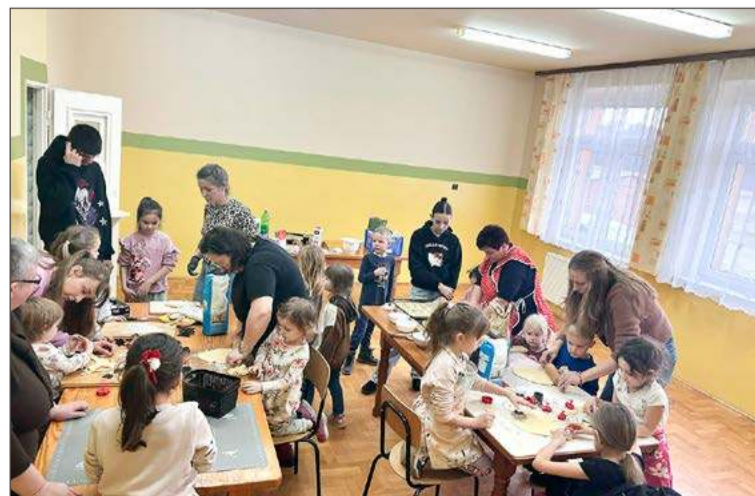
Za pieczenie ciasteczek zabrały się głównie dziewczynki.