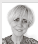
majba@ol.com.pl tel. 14 670 27 87

Nasi dziennikarze czekają na Twoje zgłoszenie