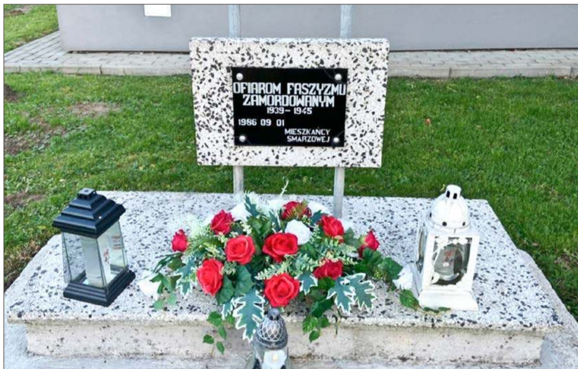
Jednym z pomników, który doczeka się remontu będzie ten stojący przy szkole w Smarżowej.