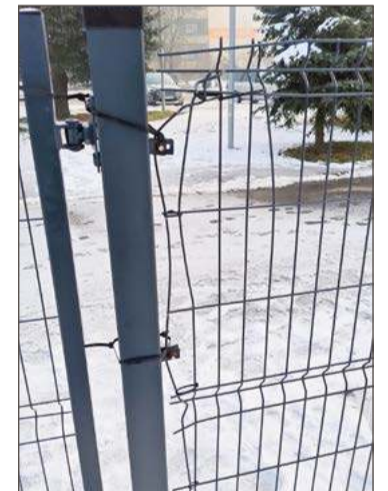
Jedno z przeseł ogrodzenia trzyma się na razie na tzw. trytytkach.

Ma jednak inny pomysł, który do czasu jego uruchomienia może zapobiec takim wybrykom. Będzie wnioskował w Ratuszu, by na placu zamontowane zostały fotopułapki. To według niego powinno skutecznie odstraszyć wszystkich wandalów, a także amatorów cudzej własności.