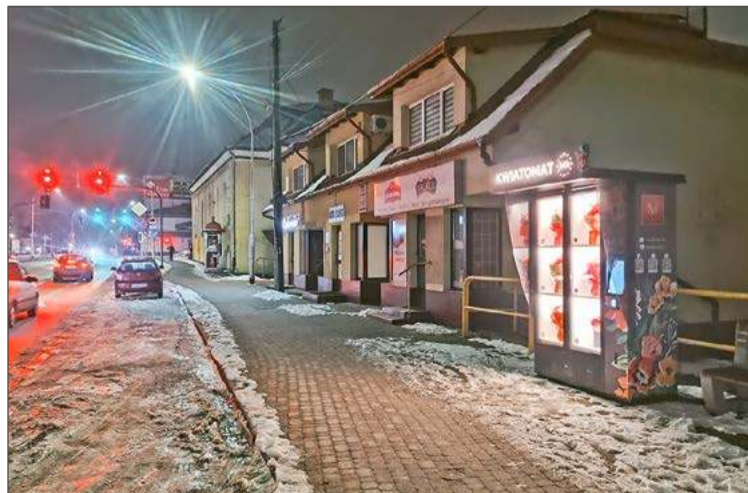
Jeden z kwiatomatów znaleźć można przy ul. Krakowskiej.

Podobnie stało się z automatem, w którym można było kupić soczewki kontaktowe, który stał w tej samej galerii. Trudno powiedzieć czy jego zniknięcie spowodowane było brakiem zainteresowania klientów, czy został zdemontowany z innych powodów. Dziś soczewkomaty można znaleźć wyłącznie w galeriach handlowych usytuowanych w większych miastach, jak np. Rzeszów, czy Tarnów.