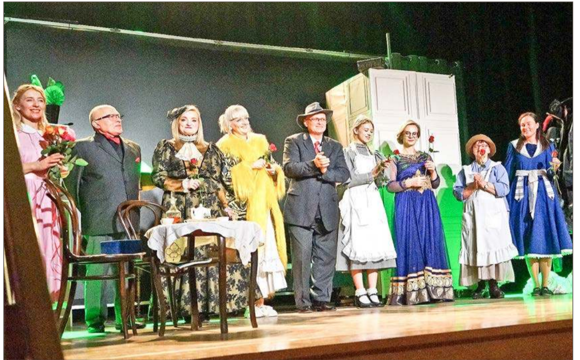
Publiczność przez kilka minut oklaskiwała aktorów, którzy wystąpili w Moralności pani Dulskiej.

Nic dziwnego, że publiczność nagrodziła ich grę kilkuminutową owacją na stojąco. Zarówno aktorzy, jak i ich opiekun, nawet nie próbowali ukryć ogromnej radości i wzruszenia.