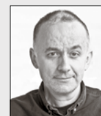
grajcar@ol.com.pl tel. 14 670 27 80