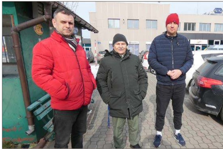
Do kierowców z Taxi Gryf na stary numer telefonu się nie dodzwonisz.

- Odnaleźliśmy faktury i się okazało, że były zapłacone z naddatkiem, bo uregulowaliśmy je za rok z góry. Powiedzili, że od 2023 r.