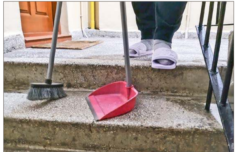
Kiedyś mieszkańcy sami sprząkali klatki. Teraz wolą za to zapłacić.