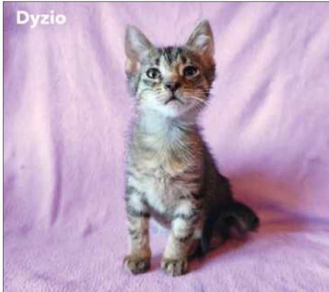
Wiek: 3 miesiące (urodzony pod koniec kwietnia). Trafił do Pu-Chatki z dwoma braciszkami i mamą, która urodziła ich pod zbutwiałym kartonem. Odrobaczony i zaszczepiony.