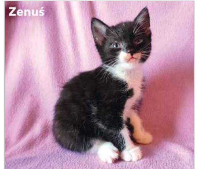
Wiek: 2,5 miesiąca (urodzony pod koniec maja). Trafił do Pu-Chatki z trzema braciszkami i mamą, która urodziła ich na czyjejś posesji. Odrobaczony, a wkrótce zostanie zaszczepiony.