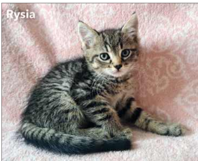
Wiek: 2 miesiące (urodzona pod koniec maja). Trafiła do Pu-Chatki z trójką rodzeństwa po śmierci ich mamy. Odrobaczona, a wkrótce zostanie zaszczepiona.