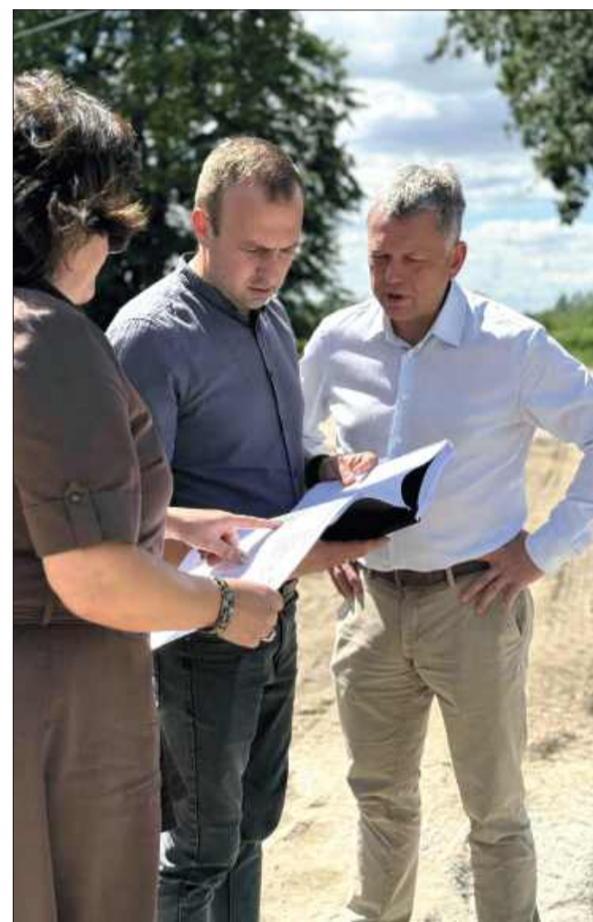
Prace nad nowym obiektem szybko się posuwają.