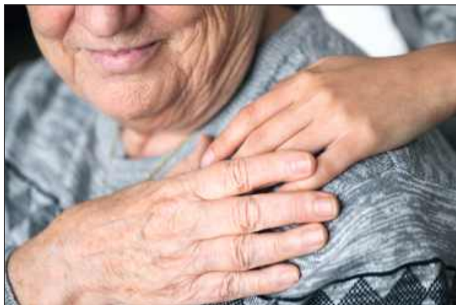
Nowy dodatek dla seniorów już od stycznia 2026! Nawet 2150 zł co miesiąc.

Już od 1 stycznia 2026 roku w życie wejdzie bon senioralny – nowe świadczenie przeznaczone dla osób w wieku 75 lat i więcej. Jego maksymalna wartość wyniesie 2150 zł miesięcznie, a celem jest wsparcie seniorów w codziennym funkcjonowaniu. To odpowiedź państwa na problemy związane z brakiem wystarczających usług opiekuńczych oraz trudnościami, z jakimi mierzą się osoby aktywne zawodowo, próbujące pogodzić pracę z opieką nad starszymi członkami rodziny.