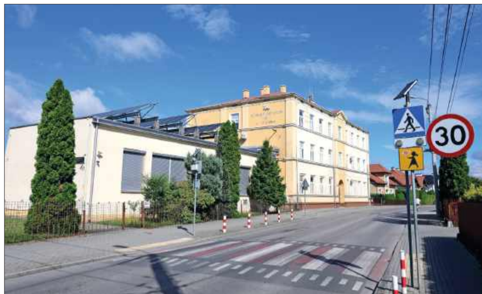
Kontrowersyjny maszt zniknął z SP nr 1 w Mielcu.

Po wielu miesiącach dyskusji, emocji i niepokoju – sprawa masztu na dachu Szkoły Podstawowej nr 1 w Mielcu została definitywnie zakończona. W ostatnich dniach instalacja została usunięta, co kończy spór o jej obecność w tym miejscu