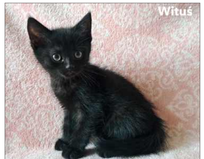
Wiek: 2 miesiące (urodzony pod koniec maja). Trafił do Pu-Chatki z trójką rodzeństwa po śmierci ich mamy. Odrobaczony, a wkrótce zostanie zaszczepiony.