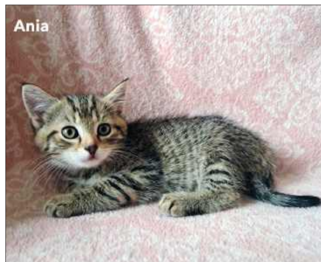
Wiek: 2 miesiące (urodzona pod koniec maja). Trafiła do Pu-Chatki z trójką rodzeństwa po śmierci ich mamy. Odrobaczona, a wkrótce zostanie zaszczepiona.