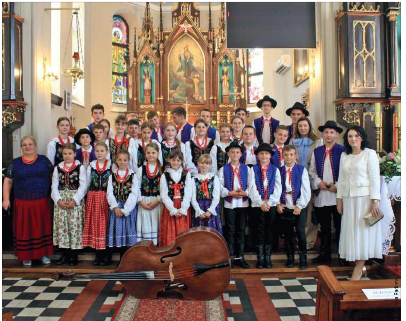
Dzieci zaprezentowały przygotowany specjalnie na tę okazję program artystyczny.