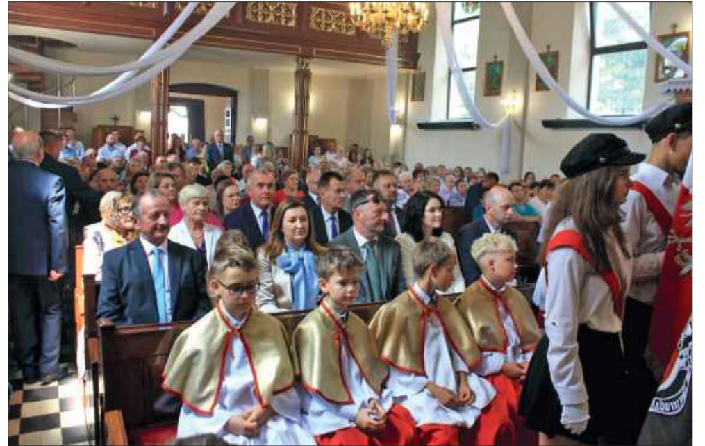
W uroczystościach wzięli udział przedstawiciele władz samorządowych.