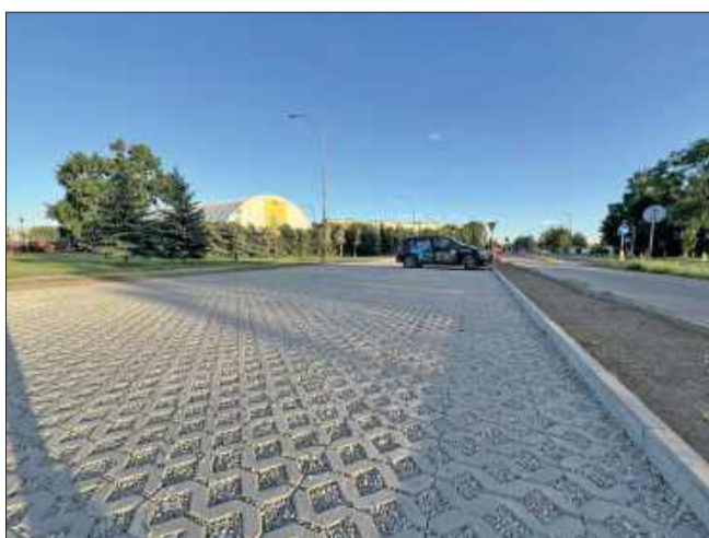
Nowe rozwiązanie ma przede wszystkim ułatwić parkowanie w tej części miasta.

Docelowo przestrzeń parkingowa ma pomieścić 35 pojazdów – to znacznie więcej niż do-