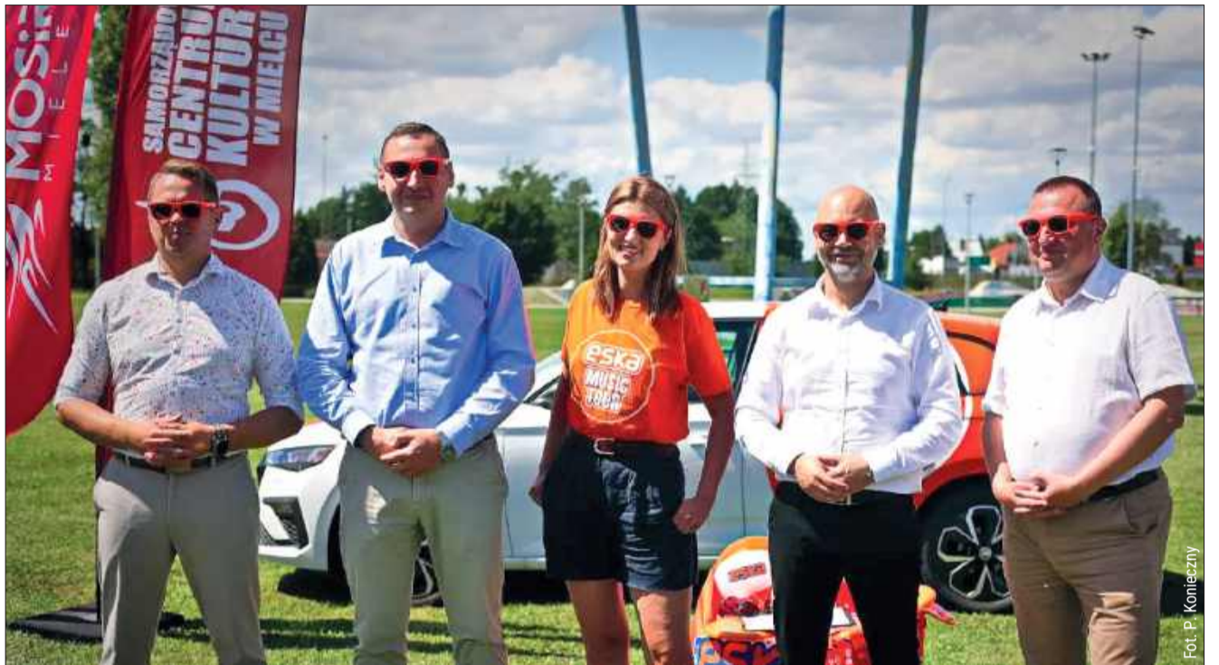
Wydarzenie zakończy koncert zespołu Lady Pank. To oczywiście legenda polskiego rocka, której nie trzeba nikomu przedstawiać.

— Scena zostanie przeniesiona w nowe, bardziej optymalne