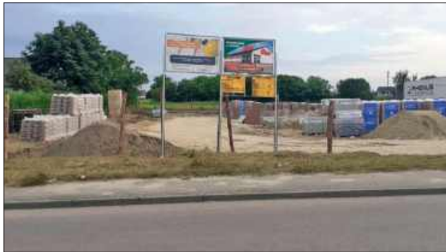
W Wilanowie nie chcą Dino, w powiecie mieleckim powstaje kolejny sklep sieci.

Podczas gdy w Warszawie budowa pierwszego sklepu Dino wywołuje burzliwą dyskusję i protesty części mieszkańców Wilanowa, w Radomyślu Wielkim w powiecie mieleckim powstaje kolejny market tej ogólnopolskiej sieci. Prace budowlane trwają przy ulicy Armii Krajowej.