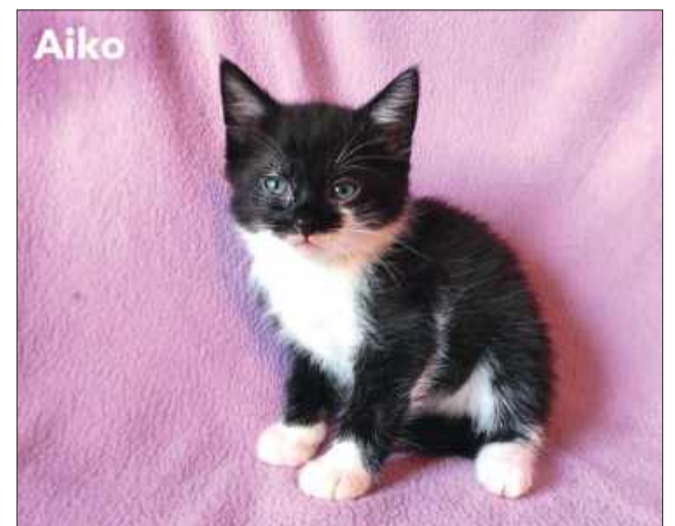
Wiek: 2,5 miesiąca (urodzony pod koniec maja). Trafił do Pu-Chatki z trzema braciszkami i mamą, która urodziła ich na czyjejś posesji. Odrobaczony, a wkrótce zostanie zaszczepiony.