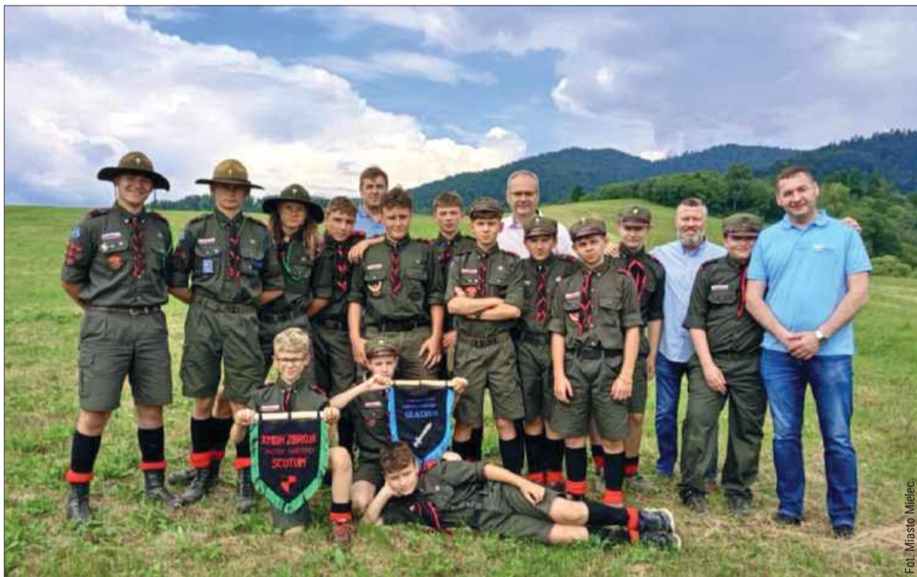
Most pokoleń w sercu Bieszczad - Dzień Otwarty Obozu Harcerskiego ZHR Mielec w Procisnem.