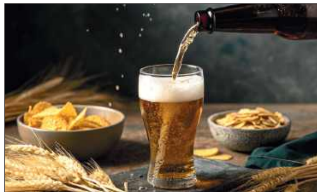
Bardzo ważną kwestią jest odpowiednia temperatura podawanego piwa.

W specjalnie do tego przeznaczonym miejscu (warzelnia), rozdrobniony słód miesza się z ciepłą wodą, czasem z dodatkiem innych surowców skrobiowych i enzymów. Uzyskuje się w ten sposób brzeczka słodową. Ekstrakt ten