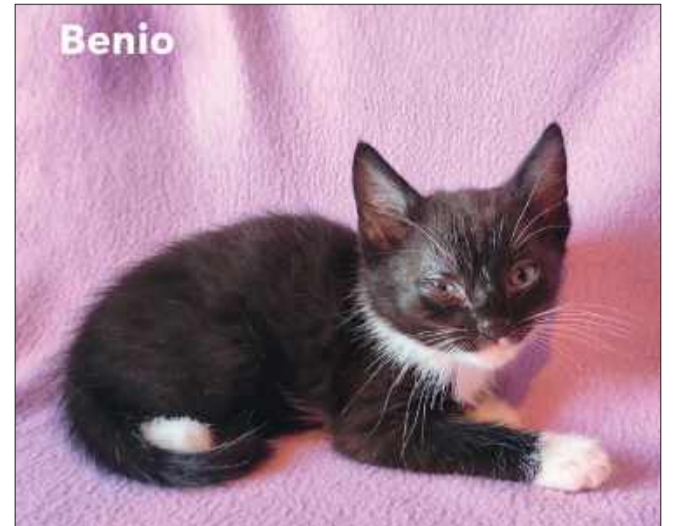
Wiek: 2,5 miesiąca (urodzony pod koniec maja). Trafił do Pu-Chatki z trzema braciszkami i mamą, która urodziła ich na czyjejś posesji. Odrobaczony, a wkrótce zostanie zaszczepiony.