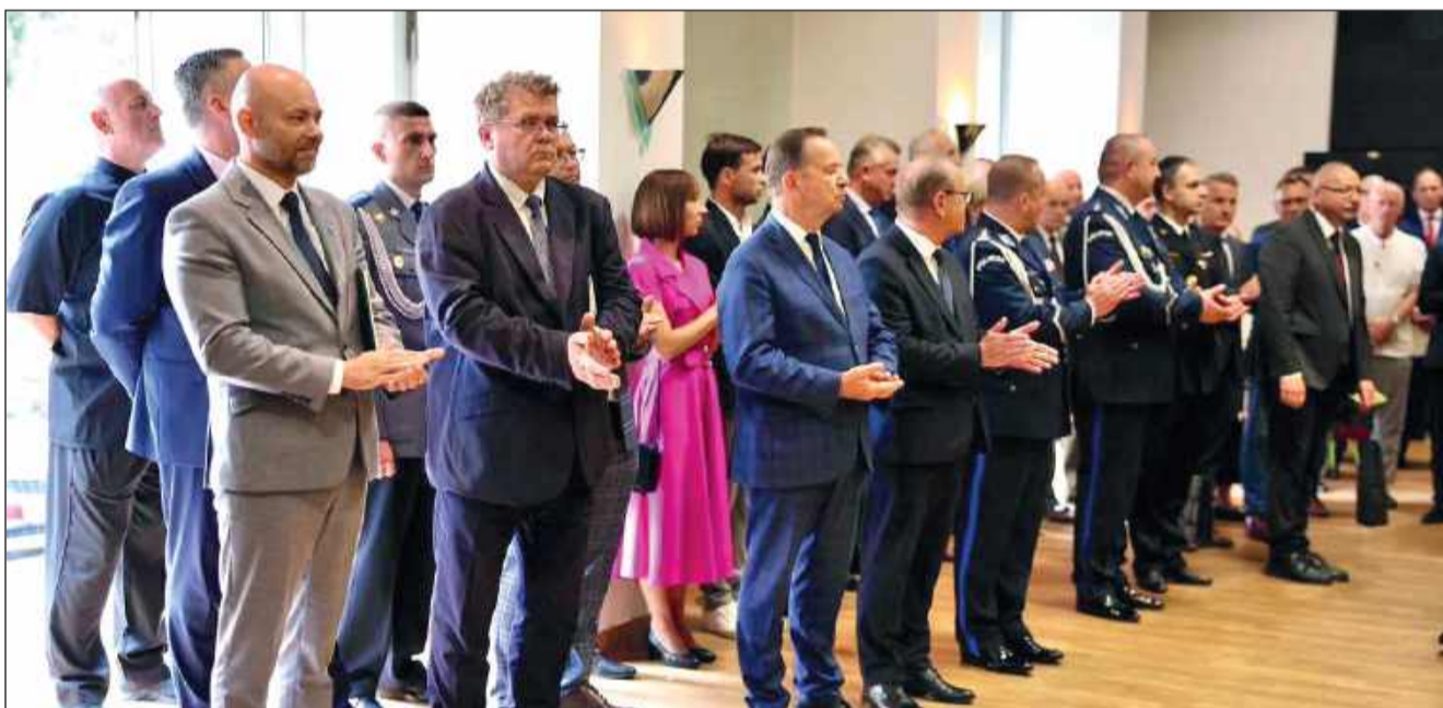
W uroczystości uczestniczyli także przedstawiciele lokalnych władz.