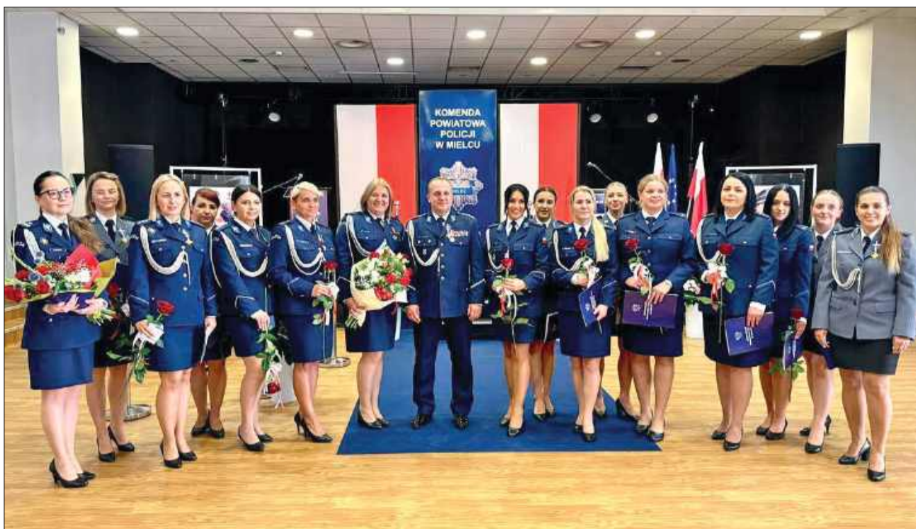
Piękniejsza strona mieleckiej policji.