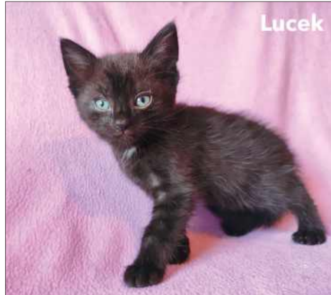
Wiek: 2,5 miesiąca (urodzony pod koniec maja). Trafił do Pu-Chatki z trzema braciszkami i mamą, która urodziła ich na czyjejś posesji. Odrobaczony, a wkrótce zostanie zaszczepiony.