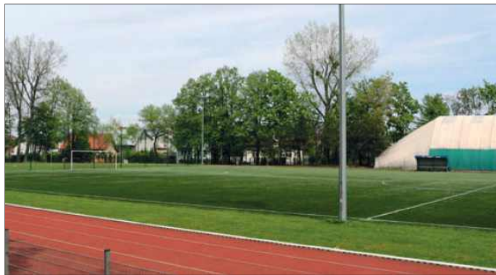
Zmodernizowane zostanie m.in. boisko piłkarskie.

Wartość całego projektu to 4 317 768,09 zł, z czego 1 404 100,00 zł pochodzi z dotacji Funduszu Rozwoju Kultury Fizycznej. Na ten moment nie została jeszcze ustalona dokładna data rozpoczęcia prac budowlanych. jb