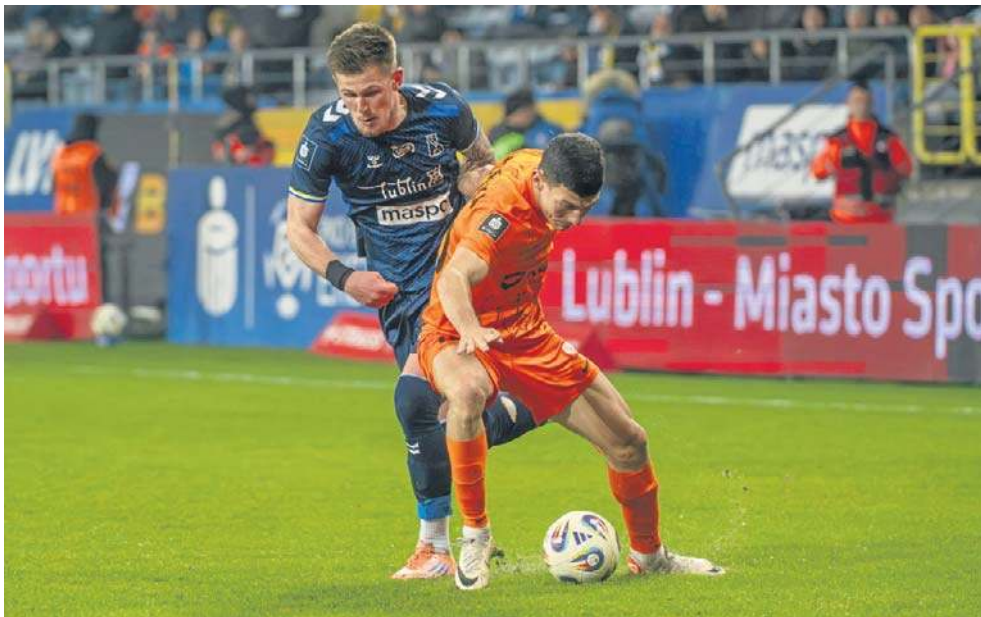
Kibice oklaskiwali zespół Motoru po wygranej nad liderującym dotąd Zagłębiem Lubin