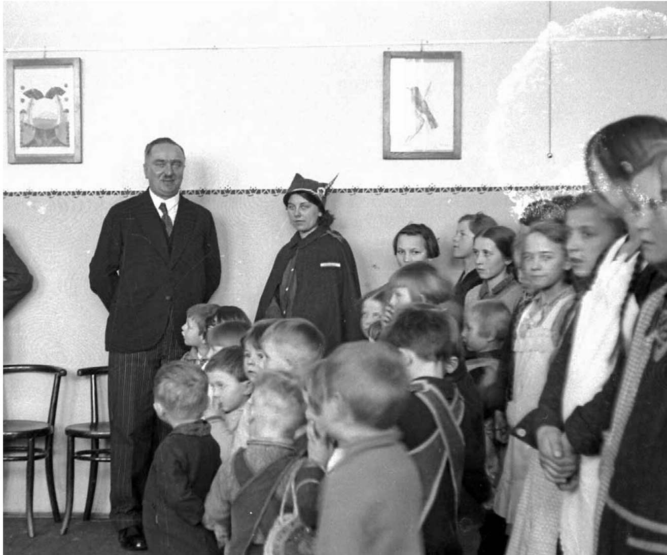
W okresie międzywojennym na Śląsku obowiązywało prawo zabraniające pracy w szkołach nauczycielkom mężatom. Kobiety przy tablicy były niemiłe widziane

Już w marcu 1926 roku Sejm Śląski, do którego wyłącznej kompetencji na mocy ustawy autonomicznej należało m.in. ustawodawstwo w zakresie szkolnictwa, uchwalił prawo nakazujące zwalnianie z pracy nauczycielek, które wstąpiły w związek małżeński. Co takiego tu się zadziało? Skąd takie rygory wobec kobiet?