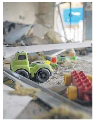
Irańskie pociski spadły na izraelskie przedszkole

Niedzielną operacją odwetową nastąpiła niespełna dobę po uderzeniu irańskiego pocisku balistycznego w miasto Arad na południu Izraela.