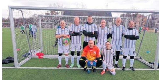
Oldboje Słupsk na turnieju w Szczecinie

Pechowo przegrali dwa mecze ze Stalą Szczecin, wcześniej prowadząc, oraz z Chemikiem Police, także prowadząc przez większość gry. O niepowodzeniu zadecydowało niewykorzy-