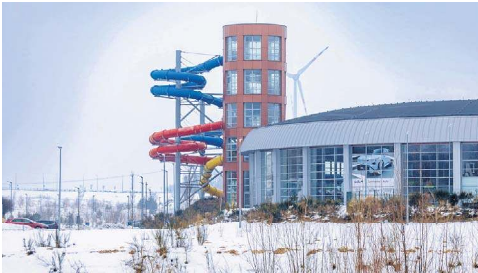
Nowa hala w Słupsku miałaby stanąć w pobliżu Parku Wodnego „Trzy Fale”

- Pozyskanie dodatkowego terenu jest podstawowym krokiem milowym, gdyż zgodnie z ustaleniami prac Komisji doraźnej Rady Miejskiej zakłada się, że hala powinna zostać zaprojektowana jako obiekt wielofunkcyjny, a działka którą posiada miasto jest zbyt mała do osadze-