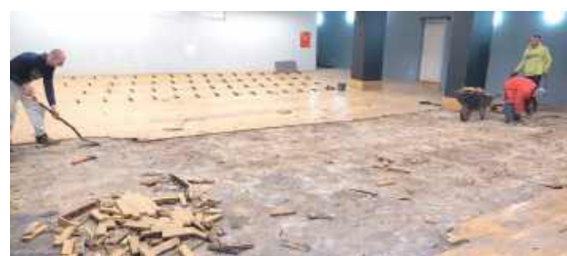
Prace powinny zakończyć się jesienią br.

- Szanowni melomani! Z żalem informujemy, iż w bieżącym roku nie odbędzie się 10.