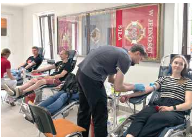
Druhowie z Końskowoli już teraz zapraszają na kolejną akcję krwiodawstwa, którą zaplanowali na niedzielę 14 września

OSP w Końskowoli to jedna z kilku jednostek na terenie powiatu, która regularnie organizuje u siebie zbiórki krwi. Świąteczną okazją ku temu była kolejna edycja Święta Róż, odbywająca się w weekend 12 i 13 lipca. I o właśnie tego drugiego dnia wielkie świętowania w gminie, w miejscowej remizie można