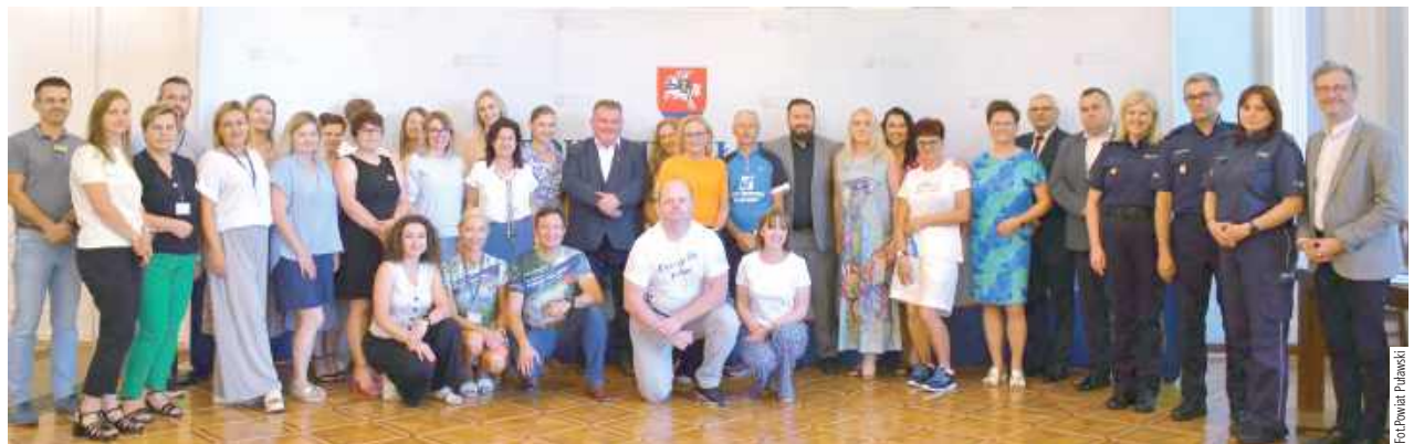
Spotkanie w starostwie było okazją do podsumowania wspólnego wysiłku cyklistów w tegoroczne zwycięstwo Puław w walce o Rowerową Stolicę Polski

W Starostwie Powiatowym w Puławach podsumowano zmagania uczestników ogólnopolskiej Rywalizacji o Puchar Rowerowej Stolicy Polski oraz Rodzinnego Rajdu Rowerowego Puławy-Borowa-Puławy. Najaktywniejsi cykliści zostali uhonorowani za wytrwałość, sportowego ducha i promocję zdrowego stylu życia.