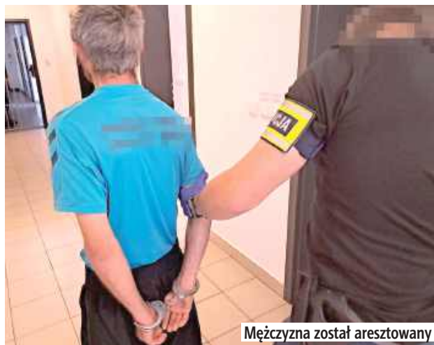
Mężczyzna został aresztowany

- Jednak w toku prowadzonego postępowania okazało się, że