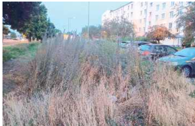
A tak łąka kwietna wygląda w tym roku. Obecnie w tym miejscu została wykoszona

Łąki kwietne to popularny sposób zagospodarowywania miejskiej przestrzeni. Stanowi alternatywę dla tradycyjnych nasadzeń kwiatów na rabatach. W Puławach również jest stosowany. W ubiegłym roku w ten właśnie sposób urządzony pas zieleni cieszył oko wzdłuż parkingu między ul. Batalionów