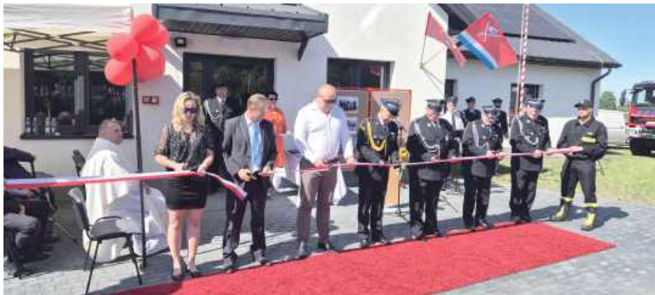
Modernizacja remizy w Skrudkach kosztowała blisko 1,5 mln zł. Realizacja inwestycji była możliwa dzięki dotacji z „Polskiego Ładu”

Nowy budynek to efekt skutecznie przeprowadzonego projektu inwestycyjnego. W 2023 roku Gmina Żyrzyn pozyskała 90% dofinansowania z Rządowego Programu Inwestycji Strategicznych „Polski Ład”