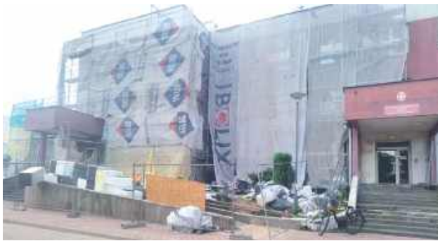
Prace remontowe przy siedzibie ZUS w Puławach powoli dobiegają końca

Trwają prace remontowe przy budynku inspektoratu Zakładu Ubezpieczeń Społecznych w Puławach. Interesanci muszą uzbroić się w cierpliwość - koniec modernizacji i tym samym niedogodności już niebawem.