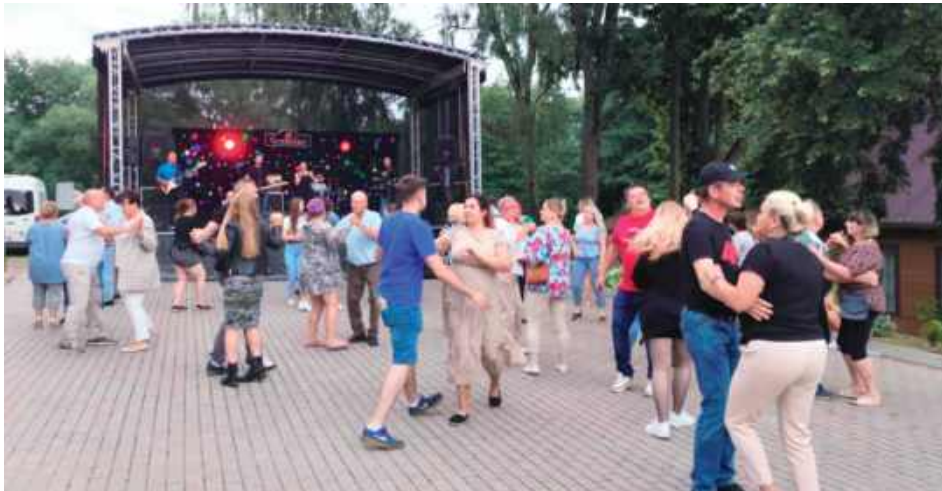
Pogoda, choć w tym roku kapryśna, dopisała i mieszkańcy Klementowic mogli bawić się wspólnie pod chmurką

Organizatorami imprezy są OSP Klementowice oraz Rada Sołecka, a wstęp na wydarzenie jest bezpłatny. Choć pogoda w tym roku kapryśna, ale w niedzielę 13 lipca pozwoliła na zorganizowanie zabawy na świeżym powietrzu. Na placu przy remizie