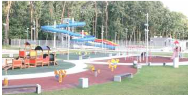
Istniejący obecnie plac zabaw zostanie przesunięty, a w jego miejsce powstanie nowy większy plac wody dla maluchów

Latem miejski park wodny w Puławach przeżywa istne oblężenie. Mieszkańcy miasta i okolic szukają tu ochłody w upalne dni. Przybywają również z dziećmi, dla których w obecnej odsłonie aquapark nie oferuje zbyt wiele miejsca. Problem ten władze Puław zauważyły już jakiś czas temu, dlatego zapadła decyzja o jego rozbudowie parku i powiększeniu miejsca do zabawy dla najmłodszych. W czer-