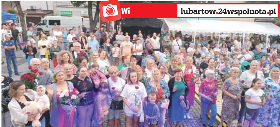
Na Annowaniu przybyły 103 Anny