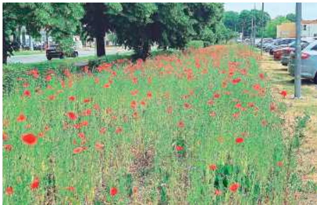
W zeszłym roku łąka kwietna między ul. Batalionów Chłopskich i Sadową prezentowała się tak. Czerwone maki przyciągały wzrok przechodniów

- W zeszłym roku cieszyła oko. Tyle było pięknych maków. A teraz same chwasty - żali się nasz czytelnik na widok łąki kwietnej ciągnącej się wzdłuż ul. Lubelskiej w Puławach. Co na to Zarząd Dróg Miejskich?