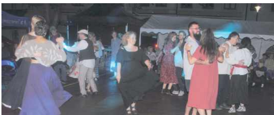
Potańcówka na zakończenie imprezy