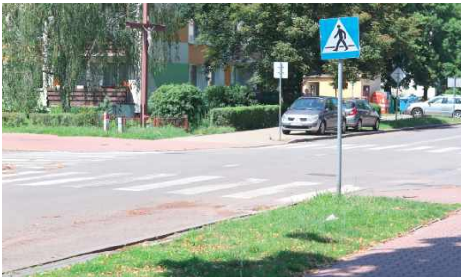
Urzędnicy chcą poznać zdanie mieszkańców osiedla - czy w tym miejscu zrobić rondo czy lepiej wyniesione skrzyżowanie i zmienić pierwszeństwo przejazdu

Po wielu interpelacjach radnych, urzędnicy za cel postawili sobie poprawę bezpieczeństwa na wspomnianym skrzyżowaniu i chcą je przebudować. Obecnie inwestycja jest na etapie projektowania. Pojawiły się dwa pomysły. Jeden zakłada budowę ronda, drugi - budowę wyniesionego skrzyżowania, ale ze zmianą pierwszeństwa - ul. Pusta miałaby być drogą z pierwszeństwem, a Kołłątaja - jako droga wewnętrzna - podporządkowana. Pracownicy Zarządu Dróg