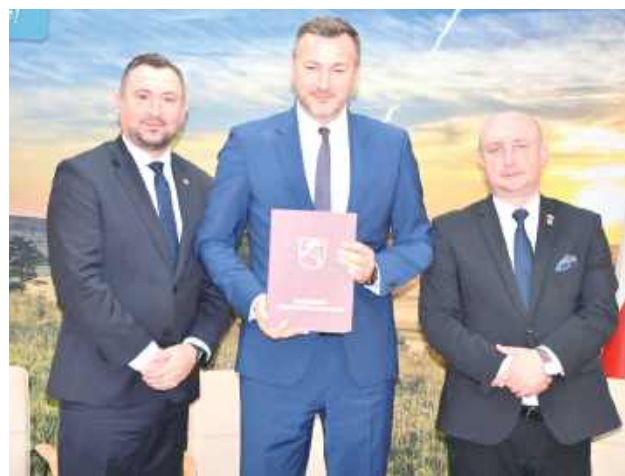
Gmina Nałęczów na modernizację dróg dojazdowych do gruntów rolnych otrzymała dotację w wysokości 100 tys. zł.

– Kontynuujemy poprawę dróg dojazdowych do gruntów rolnych w naszym województwie, dróg tak bardzo potrzebnych rolnikom dojeżdżającym do pól, a także mieszkańcom mniejszych