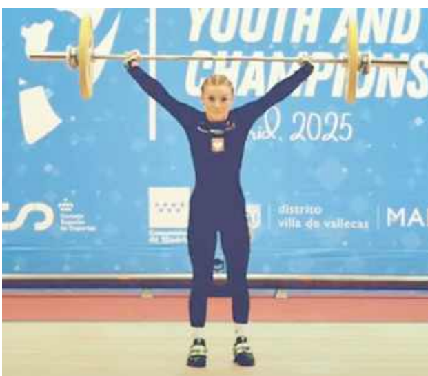
Wiktorja została dziesiątą zawodniczką Starego Kontynentu

Mistrzynią Europy została Kateryna Malashchuk z Ukrainy