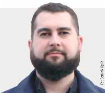
Fot. Dominik Kępcik