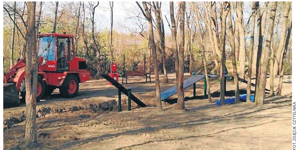
Plac zabaw dla psów na osiedlu Zacisze kosztuje ponad 207 tys. zł.

- W uzasadnieniu projektu wnioskodawca podpierał słuszność zadania brakiem wybiegu dla czworonogów w tej części miasta, aby można było spuścić pupila ze smyczy, by mógł rozładować swoją energię, nie zakłócając przy tym spokoju i bezpieczeństwa przechodniów lub dzieci na placach zabaw - informuje Mirosław Gancarz, pełnomocnik prezy-