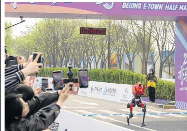
Robot humanoidalny Shandian zdecydowanie pokonał ludzi w pekińskim półmaratonie

W tegorocznej rywalizacji wzięło udział ponad 100 zespołów, pięciokrotnie więcej niż rok wcześniej. Aby wystartować, urządzenia musiały spełniać rygorystyczne wymagania techniczne, w tym posiadać układ dwunożny i mierzyć od 75 do 180 cm. PAP