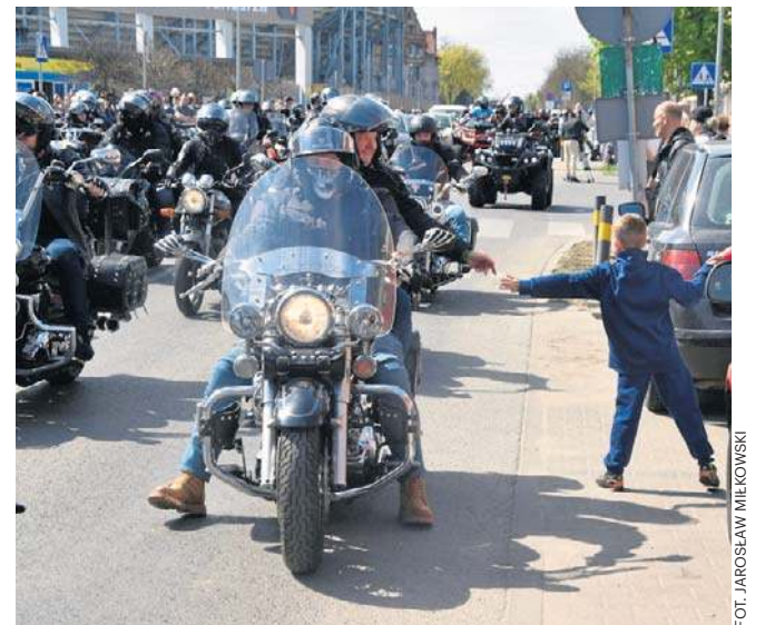
Pogoda w sobotę dopisała, a na miejsce zjechały nieprzebrane rzesze fanów jednośladów

Sezon motocyklowy potrwa pół roku. Jesienią fani dwóch kółek zorganizują analogiczne wydarzenie, by uroczystie podsumować i zakończyć tegoroczne jazdy.