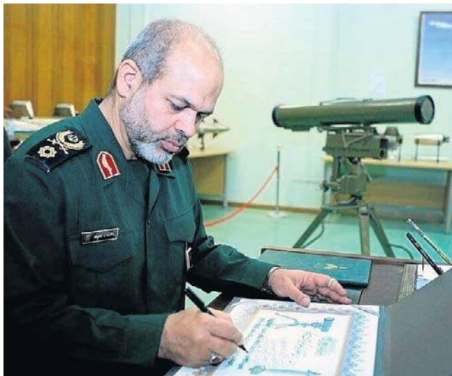
Generał Vahidi, dowódca Korpusu Strażników Rewolucji Islamskiej, rządzi dziś de facto Iranem

Media powiązane z IRGC ogłosiły również w sobotę, że Iran nie zgodził się na udział w kolejnej rundzie negocjacji ze Stanami Zjednoczonymi z powodu „nadmiernych” żądań USA.