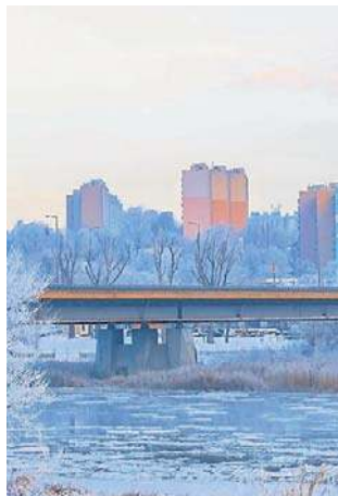
Takiej zimy w Gorzowie nie było od lat

Inne ciekawostki pogodowe? Najniższa temperatura była 2 lu-