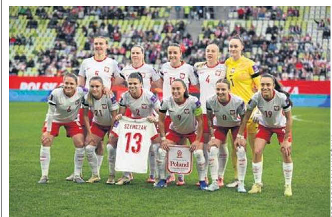
Polskie piłkarki coraz bliżej spadku do Dywizji B Ligi Narodów. W Dublinie nie dały rady reprezentacji Irlandii