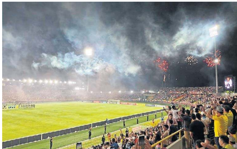
Atmosfera na meczach Copa Libertadores jest niepowtarzalna, inna niż w Europie

Wreszcie przyszedł wyciekany dzień meczu. Jak my-