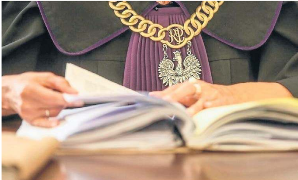
Wyrokiem sądu akt małżeństwa mężczyzn z Berlina ma zostać zatwierdzony w USC w Słubicach

- To problematyczna kwestia w urzędach w całym kraju - wyjaśnia. - Czekamy na jakie-