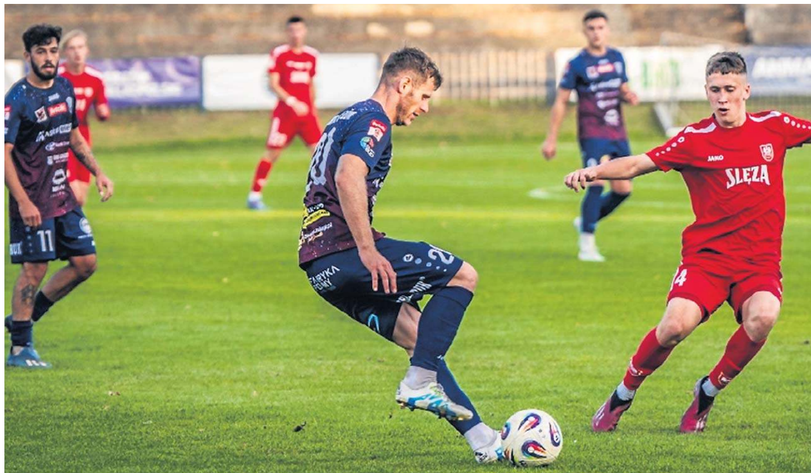
Piłkarze Warty Gorzów (w granatowo-bordowych strojach) zdobyli jeden punkt w wyjazdowym meczu z sąsiadującą w tabeli Śląz Wrocław