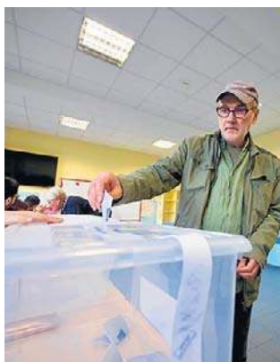
Od kwietnia 2021 roku Bułgarzy głosują ósmy raz

Próg wyborczy w wyborach parlamentarnych w Bułgarii wynosi 4 proc. dla partii i koalicji. Kadencja posła w jednoizbowym parlamencie trwa cztery lata. Uprawnionych do głosowania jest 6 575 151 wyborców.