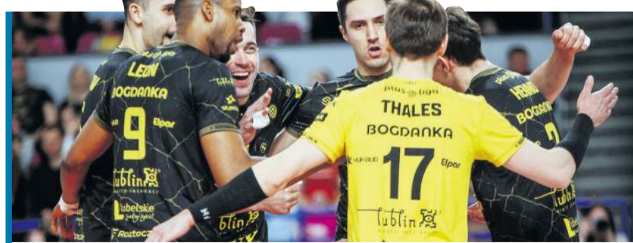
Lublinianie w tym sezonie mają patent na PGE Projekt Warszawa.

secie”. Lublinianie są w nieco bardziej komfortowej sytuacji, bo mieli więcej czasu na odpoczynek. Zajmując pierwsze miejsce w grupie wywalczyli bowiem bezpośredni awans do ćwierćfinału i ominęli baraż. Ich akcje stoją wyżej. W tym sezonie w PlusLidze już dwukrotnie pokonali stołeczny zespół. - Nasze mecze w PlusLidze z Bogdanką nie były złe. W pierwszym z powodu choroby mieliśmy dostępnych tylko siedmiu graczy. W meczu u siebie, który przegraliśmy 1:3, obie drużyny zagrały dobrze, ale popełniliśmy zbyt wiele niewymuszonych błędów. Teraz ćwierćfinały Ligi Mistrzów i to będzie nowa historia - stwierdził na stronie Europejskiej Konfederacji Siat-