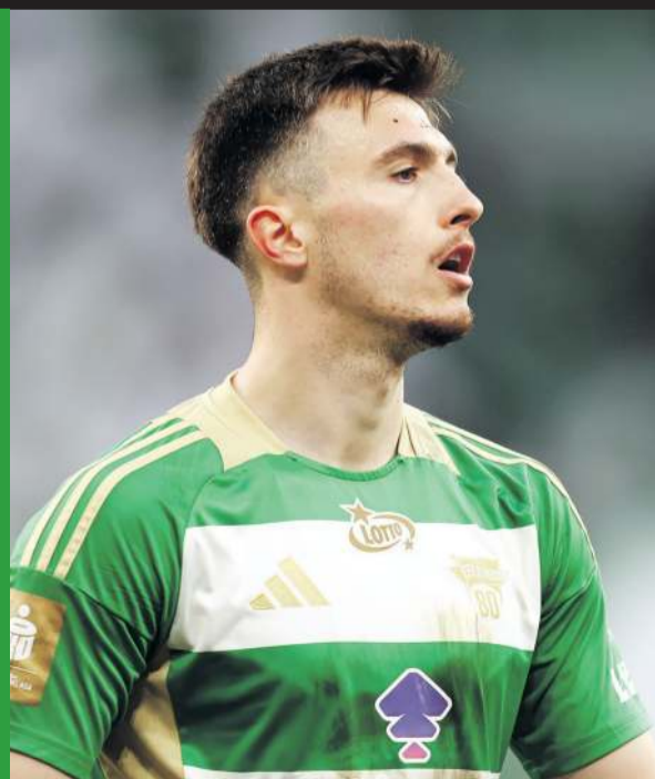
24-letni reprezentant Albanii zagrał dla Lechii 42 razy, zdobywając 2 bramki.