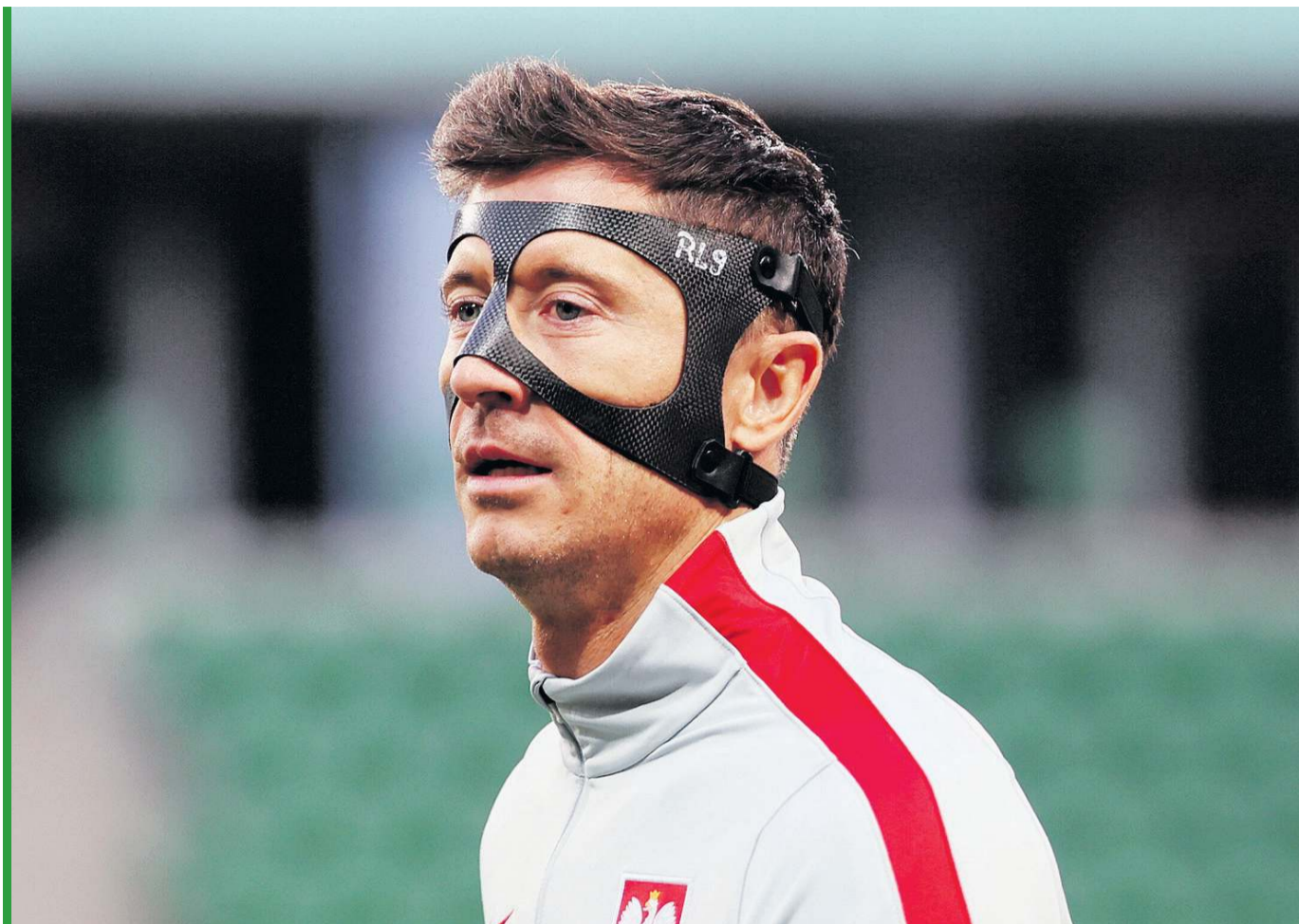
Można się przestraszyć? Nawet trzeba! Człowiek w masce ma poprowadzić Polaków na mundial!

A swoją drogą jeszcze, to niezmierną mam bekę z tego, co wydarzyło się wokół Oskara Pietuszewskiego – i bynajmniej nie o samego chłopaka tu chodzi. Gdy wszyscy piali z zachwytu nad jego wyczynami w Porto, a wcześniej w Jagielonii (stusznie zresztą), trener Urban hamował nastroje. Zbierało mu się za to zresztą srogo od ekspertów i „ekspertów”, znawców i znafucf – bo jak to tak! Gdy Pietuszewski pojawił się na liście powołanych, niektórzy zaczęli triumfować, że to ich presja na selekcjonerze dokonała tego, że Polska - niczym Daenerys Targaryen – ma trzy smoki. Ale nie, Szanowni Państwo, to tak nie działa. Urban głupi nie jest, jego sztab głupi nie jest... oni dobrze wiedzieli, o jakim piłkarzu mowa, ale nie chcieli pompować mu nad głowę kolorowego balonika. Wielu już było takich, co to miało przenosić góry, a byli takim drewnem, że zostawały po nich wióry. Pompka szła w ruch, a balonik pękał – a wraz z nim zaczynała się jazda po piłkarzu. Trener w tym przypadku wziął na siebie część presji i bardzo słusznie, bo akurat jej nadmiar nie jest 17-latkowi w ogóle potrzebny.