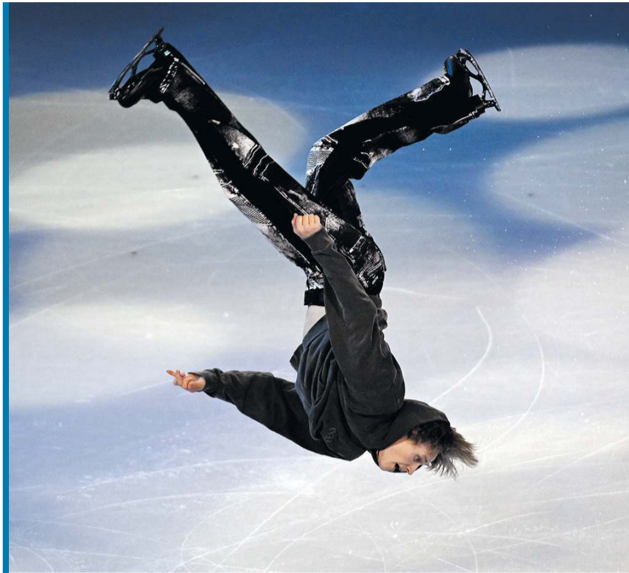
W Pradze zapewne będzie błyszczał Ilija Malinin.

Zgodnie z tradycją poprzednich startów poolimpijskich wielu wybitnych i utytułowanych łyżwiarzy w Czechach zabraknie. Na praskiej tafli nie pojawi się kilkoro mistrzów olimpijskich. W tej grupie są m.in. podwójna złota medalistka z Mediolanu (w konkuren-