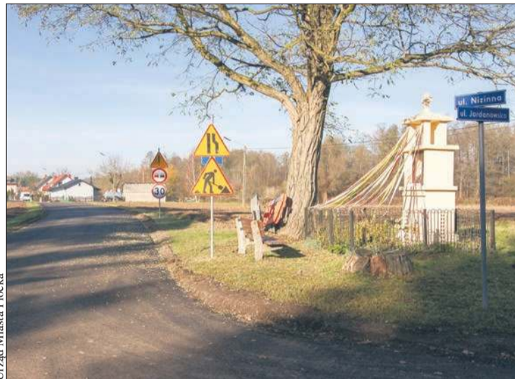
Urząd Miasta Płocka

Ulica została utwardzona destruktem asfaltowym. W ten sam sposób została wyrównana jej nawierzchnia. Destrukt stanowi podbudowę dla układanego asfaltu. To rozwiązanie,