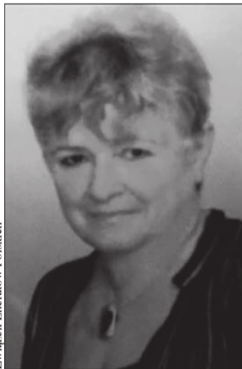
Związek Literatów Polskich