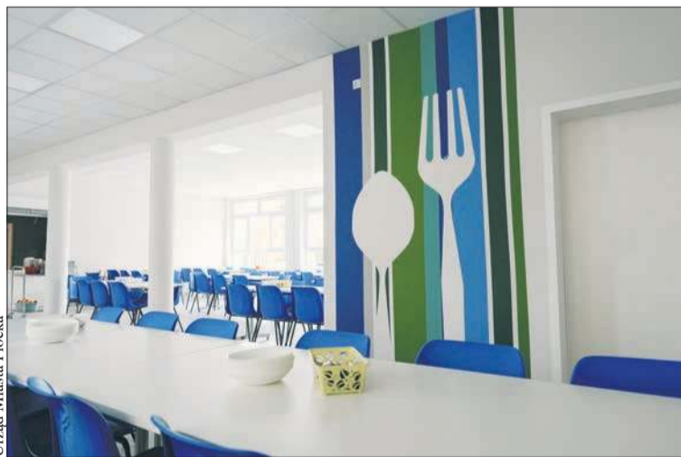
Odnowiona stołówka w Szkole Podstawowej nr 3

Inwestycje zostały przeprowadzone w wakacje. W pracowni komputerowej najpierw wykonany został remont – położone zostały gładzie, pomalowane ściany, wymieniona podłoga i dostosowana istniejąca sieć elektryczna i informatyczna. Zakupione zostały 25 zestawów komputerowych, monitor interaktywny i laserowe urządzenia wielofunkcyjne. Wszystkie te nowoczesne technologie