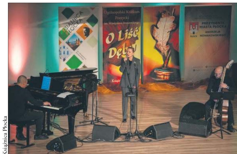
Poetycką galę uświetnił koncert Anny Marii Jopek