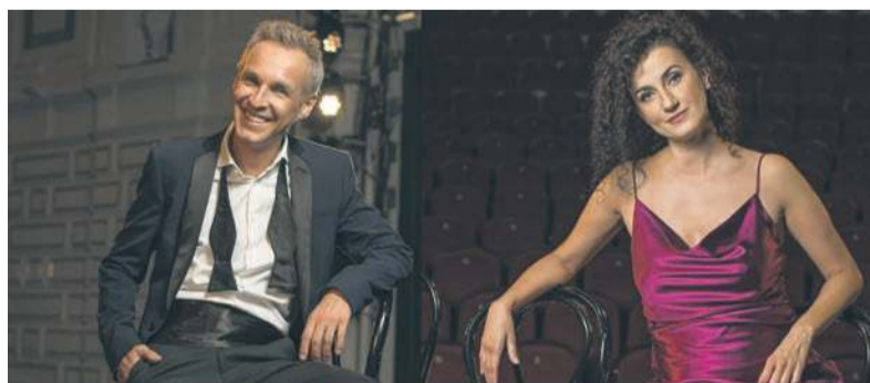
koncert świąteczny „Na zawsze i na wieczność” 06.12.2025 r., godz. 16:00