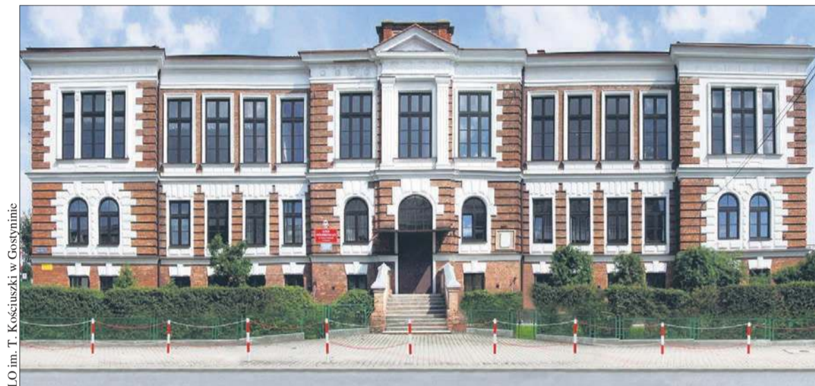
LO im. T. Kościuszki w Gostyninie

re pierwotnie ozdabiała zwieńczenie budynku” – dowiadujemy się z opracowania na stronie liceum.