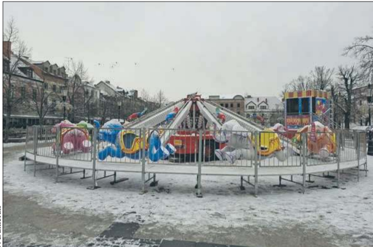
W Płocku trwają przygotowania do Świąt Bożego Narodzenia

Przerwa techniczna zaplanowana jest między godziną 14 a 15. Na taflę można