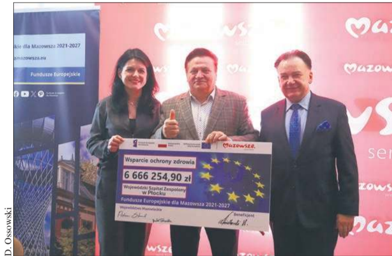
Wojewódzki Szpital Zespolony w Płocku otrzyma ponad 6,6 mln zł unijnego wsparcia na doposażenie przychodni specjalistycznych i jednodniowych oddziałów szpitalnych