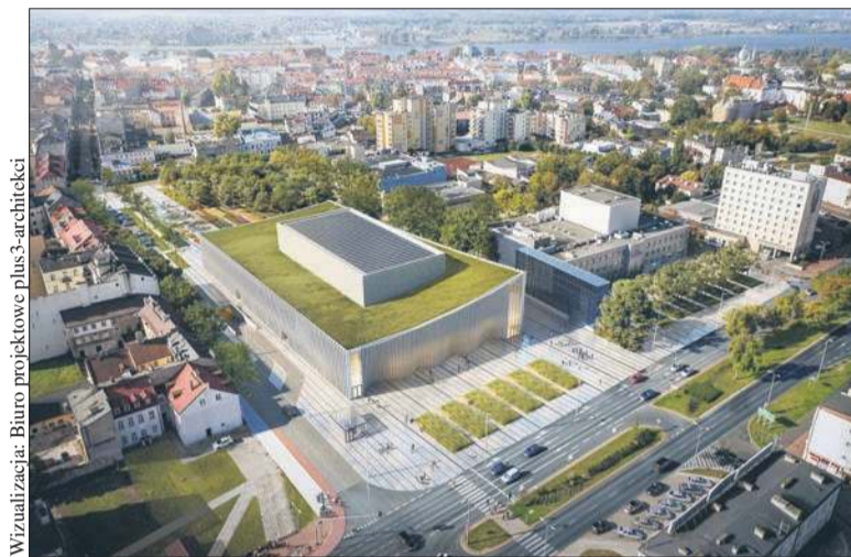
Wizualizacja: Biuro projektowe plus3-architekci

W obiekcie znajdą się dwie sale koncertowe. Główna pomieści 705 widzów. Na widowni sali kameralnej będzie 200 miejsc. W budynku znajdą