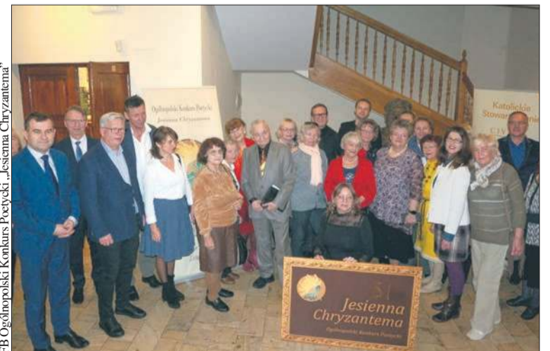
Jurorzy, laureaci i goście „Jesiennej Chryzantemy” w Domu Broniewskiego