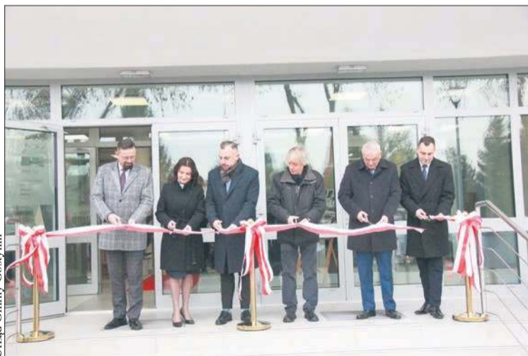
Urząd Gminy Gostynin

Uroczystość rozpoczęła się od najbardziej symbolicznego gestu – przecięcia wstęgi, które otworzyło