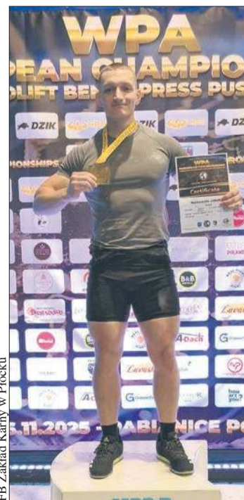
FB Zakład Karny w Płocku