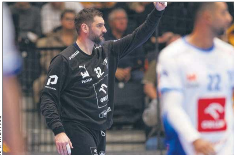
SPR Wisła Płock