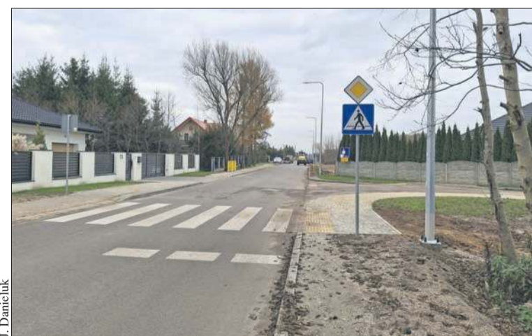
Zakończyła się budowa ulicy Browarnej w Ciechomicach

Wykonawcami prac były – w ramach konsorcjum – firmy Trakt i Hydrobud. – W czasie inwestycji wykonawcy zgodzili się, wspólnie z mieszkańcami, wykonać przyłącza kanalizacji sanitarnej. Tego nie obejmował główny zakres prac. Udało się to zrealizować dzięki często trudnym rozmowom wykonawców z mieszkańcami. Dzięki temu wybudowane już