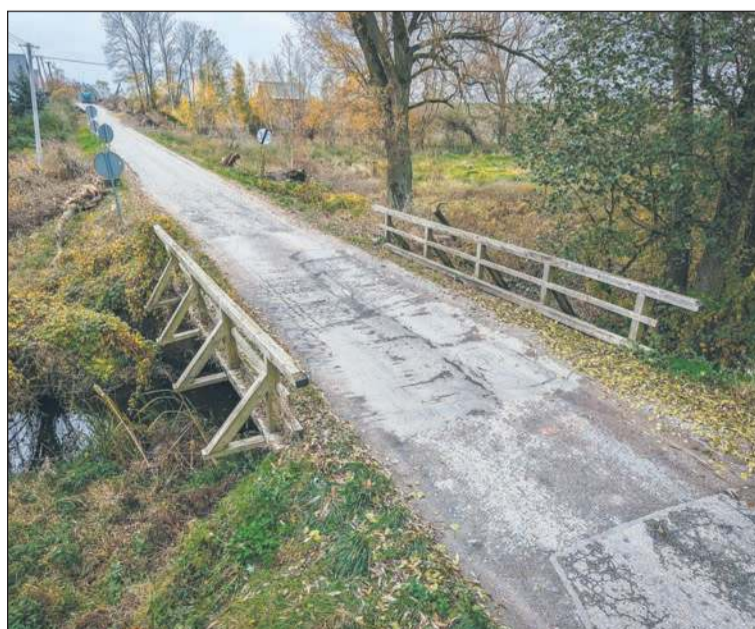
Tak wyglądał jeden z mostów na Mołtawie przed rozpoczęciem remontu