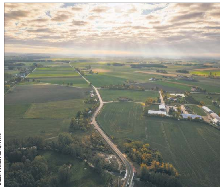
Tak prezentuje się przebudowana droga z lotu ptaka

Materiał przygotowany we współpracy ze Starostwem Powiatowym w Płocku