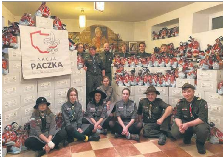
Obwód Płocki ZHR

W dniach 28 i 29 listopada, podczas zbiórek darów, można wesprzeć organizowaną przez płockich harcerzy Płocką „Akcję Paczka”