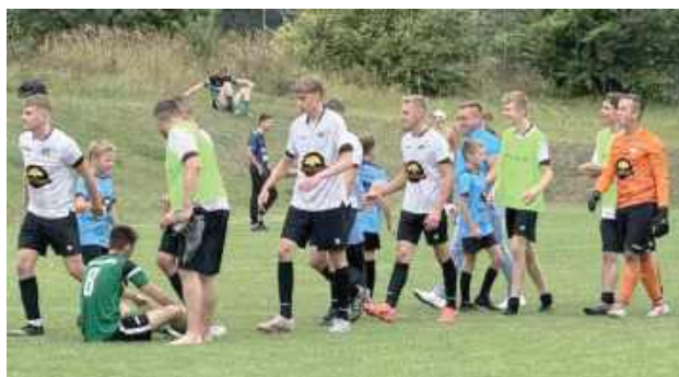
Gracze Orleńta sięgnęli po derbową wygraną. Ich bohaterem został bramkarz, który w doliczonym czasie gry zdołał obronić rzut karny