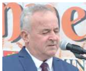
Wójt gminy Stężyca

W trakcie całego dnia na uczestników czekały liczne atrakcje: stoiska z rękodziełem, regionalnymi wyrobami, strefy promocyjne, dmuchańce oraz specjalne animacje i zabawy dla najmłodszych.