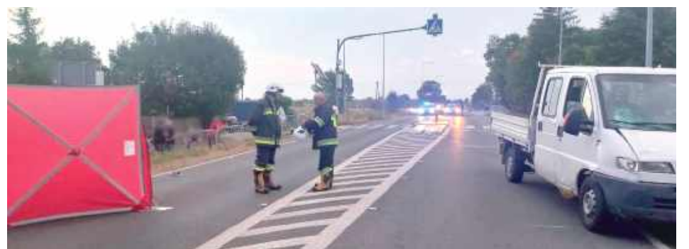
Śmiertelne potrącenie w powiecie lubartowskim

Do zdarzenia doszło około godziny 18:00 w piątek, 5 września, na drodze krajowej nr 48 Kock - Moszczanka. W miejscowości Poizdów, kierujący fiatem ducato 39-latek potrącił pieszego na prostym odcinku drogi. Niestety życia 78-lataka z gminy Kock nie udało się uratować. Mężczyzna zmarł na miejscu zdarzenia. Lubartowscy policjanci dodali,