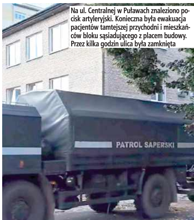
Na ul. Centralnej w Puławach znaleziono pocisk artyleryjski. Konieczna była ewakuacja pacjentów tamtejszej przychodni i mieszkańców bloku sąsiadującego z placem budowy. Przez kilka godzin ulica była zamknięta

Do niebezpiecznego odkrycia doszło tuż za przychodnią zdrowia. Na miejsce wezwano policję, która zabezpieczyła teren i odgrodziła dostęp dla osób postronnych. Do czasu przyjazdu saperów działania