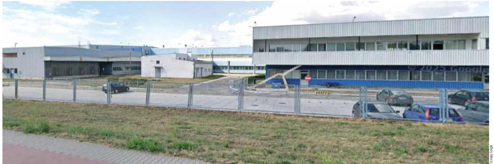
Obecnie trwają poszukiwania nowego nabywcy obu zakładów. Cenę ustalona na 128.774.980,30 zł i obejmuje ona grunty, budynki, budowle, maszyny i urządzenia oraz środki transportu (mienie trwałe). Z kolei wadium wynosi 15 mln zł

W ostatnich latach o przedsiębiorstwie Kampol było głośno za sprawą rolników. Niepłacący za dostawy owoców i warzyw zakład wywołał ich sprzeciw. Zamiast należności dostawcy mieli dostać od ówczesnego właściciela propozycje niekorzystnego układu, który pogarszał ich pozycję względem innych wierzycieli. Do jeszcze większej zapaści,