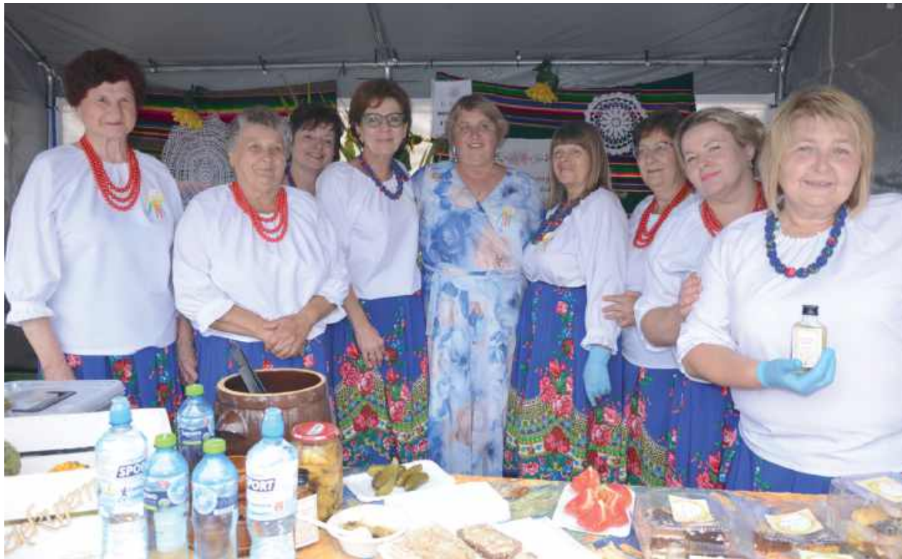
Na zdjęciu KGW Stara Rokitnia. Panie dbały, aby każdy, kto przyszedł do ich stołu, najadł się do syta