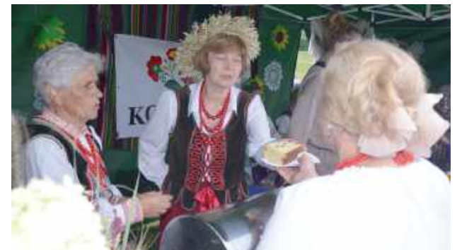
Panie z KGW w Stężycy częstowały rewelacyjnymi pierogami z mięsem i kapustą oraz pysznym ciastem drożdżowym z rodzynkami