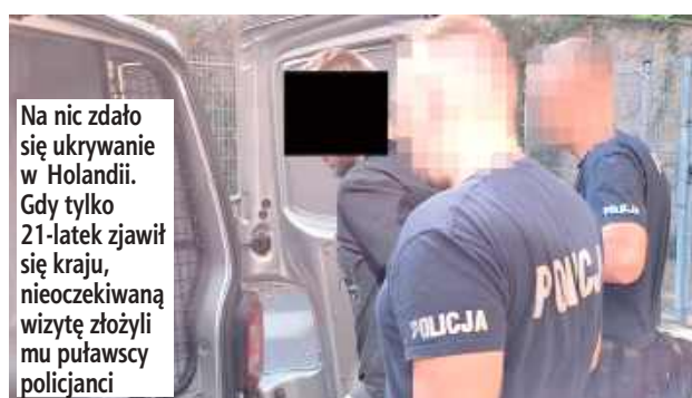
Na nic zdało się ukrywanie w Holandii. Gdy tylko 21-latek zjawił się kraju, nieoczekiwaną wizytę złożyli mu puławscy policjanci

Młody mężczyzna był poszukiwany przez puławski sąd