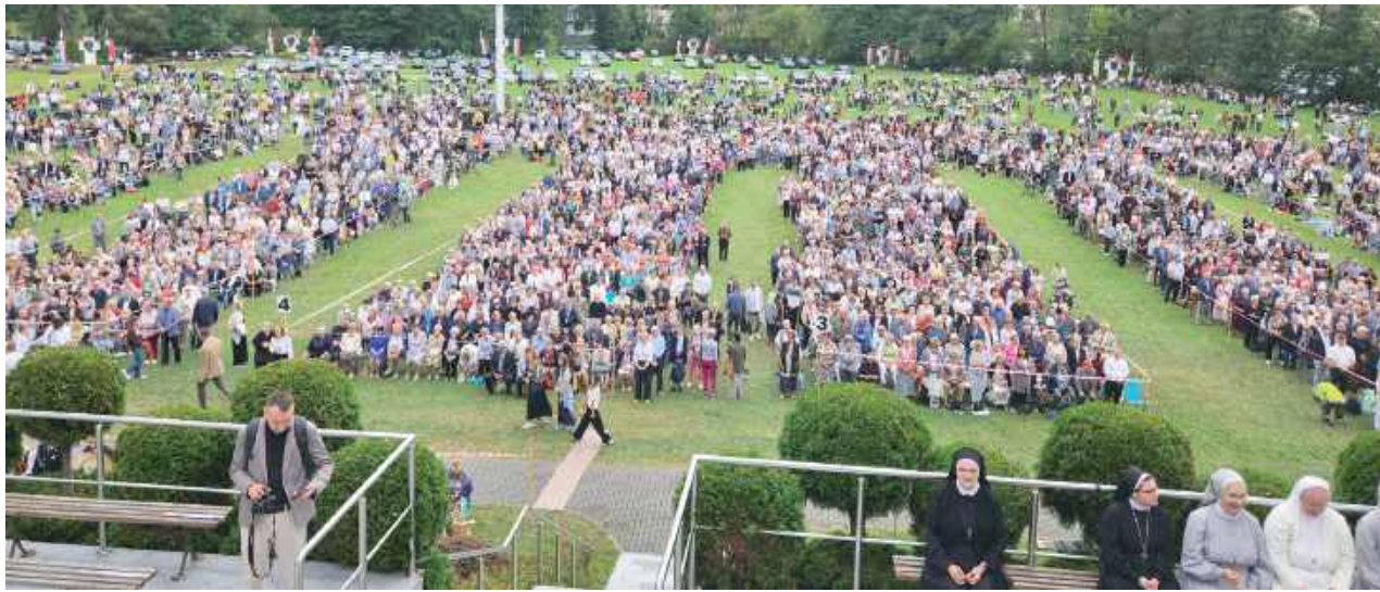
Pielgrzymi jak co roku licznie zgromadzili się na wąwolnickich błoniach