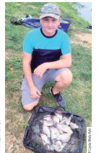
Szczególnie doświadczeni wędkarze mogli się pochwalić naprawdę imponującymi wynikami, bijąc rekordy lokalnego akwenu

Na najlepszych zawodników czekały puchary, dyplomy oraz nagrody rzeczowe, wręczone wśród gromkich braw. Każdy uczestnik otrzymał również torbę pełną sprzętu wędkarskiego, przekazaną osobiście przez przewodniczącego Rady Miasta,