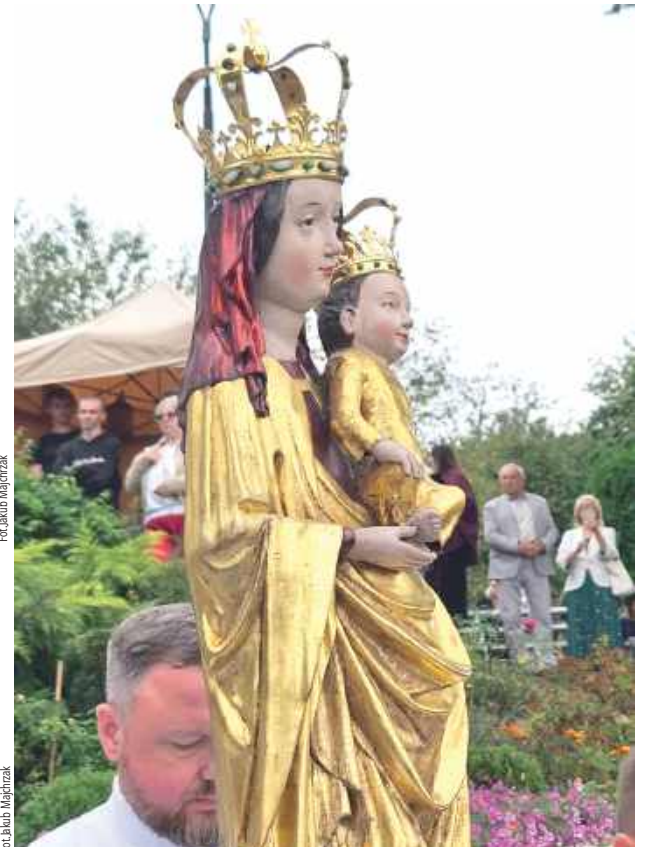
Cudowna figura Matki Bożej Kębelskiej znana jest z wielu cudów. W tym roku w księdze cudów zapisano kolejne cztery