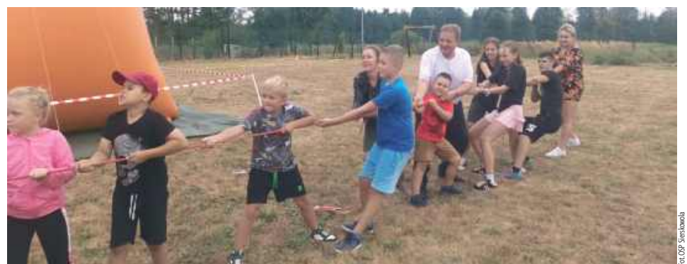
Przeciąganie liny to konkurencja, która przyciąga wielu chętnych do grupowej rywalizacji