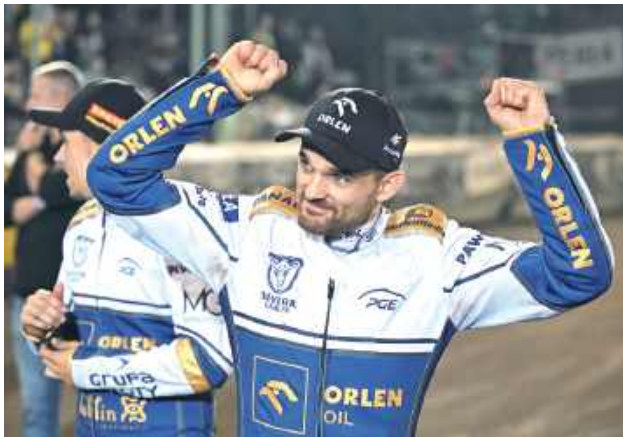
Żuźlowcy z Lublina piąty raz z rzędu pojadą w finale

W meczu wyjazdowym żuźlowcy z Lublina wygrali z rywalami 47:43 i byli bliżej awansu do wielkiego finału. Wystarczyło oczywiście ponownie wygrać z siebie albo chociaż nie roztrwonić przewagi czterech punktów. Pierwsza seria pokazała jednak, że GKM jest zespołem silnym i bardzo zadziornym, bo wynik wskazywał jedynie 14:10 dla Motoru po dwóch wygranych 4:2 i dwóch remisach. Druga seria bez równania okazała się jeszcze bar-