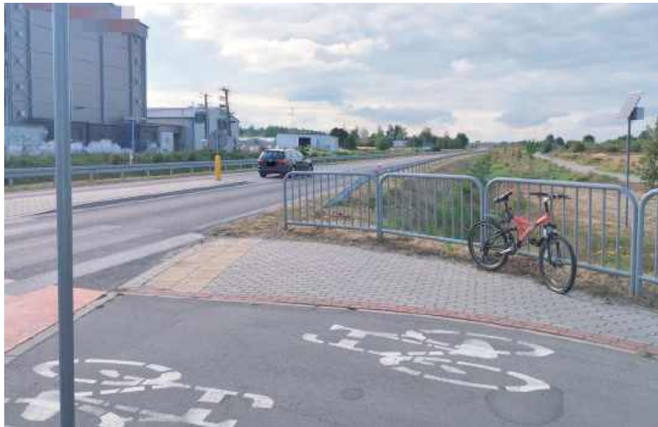
45-letnia mieszkanka powiatu mińskiego kierująca samochodem osobowym nie zachowała należytej ostrożności podczas zbliżania się do przejazdu rowerowego i nie ustąpiła pierwszeństwa przejazdu

- Ze wstępnych ustaleń funkcjonariuszy ryckiej drogówki wynika, że 45-letnia mieszkanka powiatu mińskiego kierująca samochodem osobowym nie zachowała należytej ostrożności podczas zbliżania się do przejazdu rowerowego i nie ustąpiła pierwszeństwa przejazdu 48-letniemu rowerzyście, doprowadzając do zderzenia - informuje aspirant Łukasz