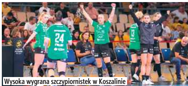
Wysoka wygrana szczypiornistek w Koszalinie

Od przekonującego zwycięstwa rozpoczęły zmagania w kampanii 2025/26 piłkarki ręczne PGE MKS El-Volt Lublin. W premierowym starciu w Orlen Superlidze Kobiet, szczypiornistki lubelskiego klubu pokazały się z fantastycznej strony.