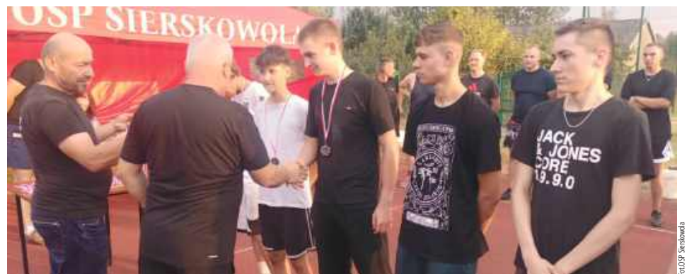
Turniej piłki nożnej rozegrany był w zdrowej rywalizacji i w formie dobrej zabawy