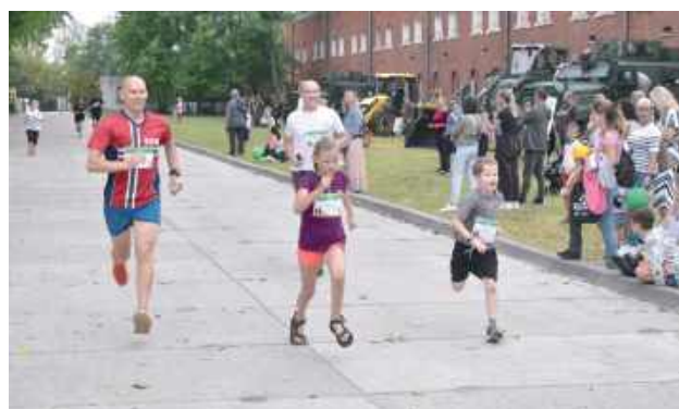
Biegali mali i duzi