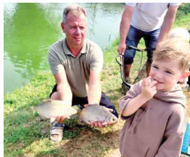
Trzygodzinne zmagania przyniosły mnóstwo emocji, sportowej rywalizacji i oczywiście... ryb

Trzygodzinne zmagania przyniosły mnóstwo emocji, sportowej rywalizacji i oczywiście... ryb! Szczególnie doświadczeni