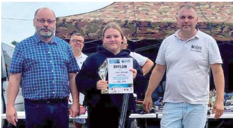
Na najlepszych zawodników czekały puchary, dyplomy oraz nagrody rzeczowe, wręczone wśród gromkich braw

Jak co roku, Koło Wędkarskie „Czysta Woda” Ryki aktywnie włączyło się w obchody Dni Ryk, organizując zawody wędkarskie o Puchar Burmistrza Ryk. Tegoroczna edycja odbyła się nad stawem Skalskim i przyciągnęła aż 48 zawodników, rywalizujących w różnych kategoriach wiekowych.