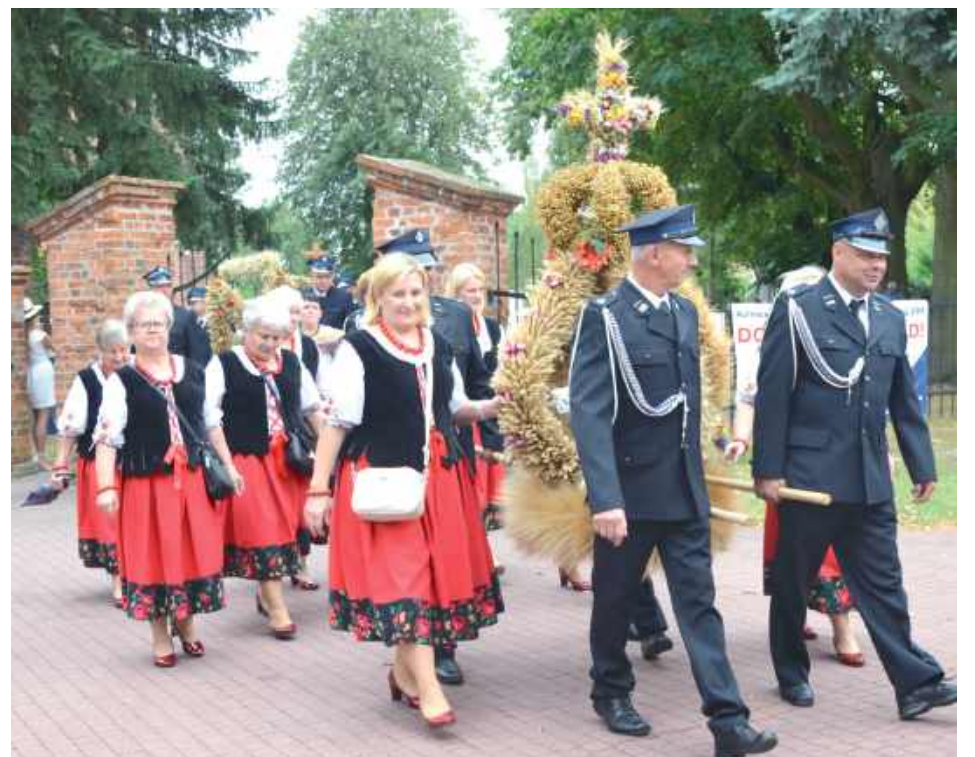
Barwnym korowodem reprezentacji Kół Gospodyń Wiejskich i strażacy niosący wieńce przeszli z kościoła do amfiteatru Wyspy Wiśla. Na zdjęciu strażacy i KGW z Brzezin