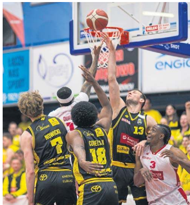
W Słupsku nie brakowało twardej rywalizacji pod koszami, pod którymi było mało miejsca

Dla Energi Czarnych Słupsk to dziesiąta porażka w tym sezonie przed własną publicznością. Łączny bilans 8-20 nie nastraja