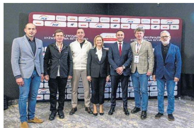
Zarząd PZŁS będzie liczył siedem osób. Znalazł się w nim m.in. mistrz olimpijski z Soczi Zbigniew Bródka