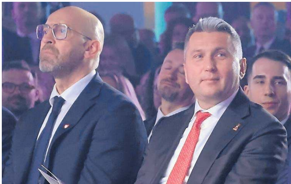
Minister sportu Jakub Rutnicki i prezes PKOl Radosław Piesiewicz spotkają się w sądzie

- Jesteśmy tutaj przede wszystkim, by wyrazić jednoznaczne stanowisko dotyczące ochrony wizerunku polskiego sportowca, który musi być i jest naszym dobrem narodowym, które musimy strzec. Ostatnie tygodnie i gigantyczna afery wizerunkowa dotycząca PKOl najbardziej dotyka polski sport, polskich sportowców i PKOl - powiedział minister Rutnicki.