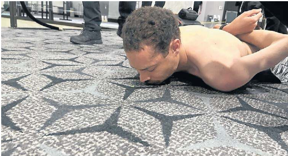
Prezydent opublikował w serwisie Truth Social zdjęcia mężczyzny leżącego na podłodze oraz nagranie, na którym widać, jak przebiega przez kontrolę bezpieczeństwa

Oprócz członków gabinetu, np. sekretarza stanu Marco Rubio i szefa Pentagonu Pete'a Hegsetha, na sali obecne były setki dziennikarzy i politycy. Goście wydarzenia ukrywali się pod stołami w sali balowej.