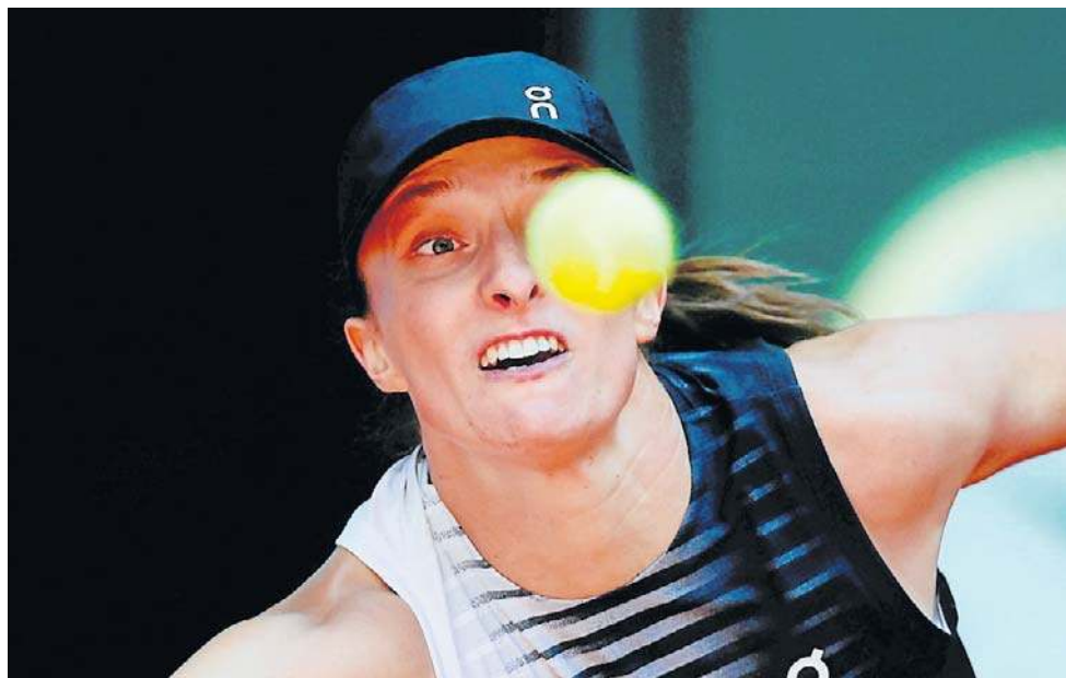
Iga Świątek z powodów zdrowotnych poddała mecz w trzeciej rundzie w Madrycie

- Nie mogłam nawet niczego wypić i nagle poczułam drastyczny spadek energii. Byłam może dwa razy chora w mojej karierze i wciąż byłam w stanie wygrywać mecze, ale tym razem było gorzej niż ostatnio. Dla mnie turniej się jednak tak naprawdę dopiero zaczynał, więc jest to na pewno