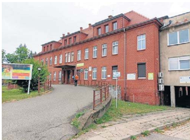
Szpital Miejski w Miastku

Jak podano w ogłoszeniu o rozpoczęciu postępowania konkursowego, Rada Nadzorcza szpitala poszukuje osoby z doświadczeniem w zarządzaniu, która posiada wykształcenie wyższe lub wykształcenie wyższe uzyskane za granicą uznane w Polsce, ma co najmniej 5-letni okres zatrudnienia na podstawie umowy o pracę (powołania, wyboru, mianowania, spółdzielczej umowy o pracę, świadczenia usług na podstawie innej umowy lub wykonywania działalności gospodarczej na własny rachunek) oraz posiada co najmniej 3-letnie doświadczenie na stanowiskach kierowniczych lub samodzielnych albo wynikające z prowadzenia działalności gospodarczej na własny rachunek. Musi ponadto posiadać praktyczną wiedzę o funkcjonowaniu placówek ochrony