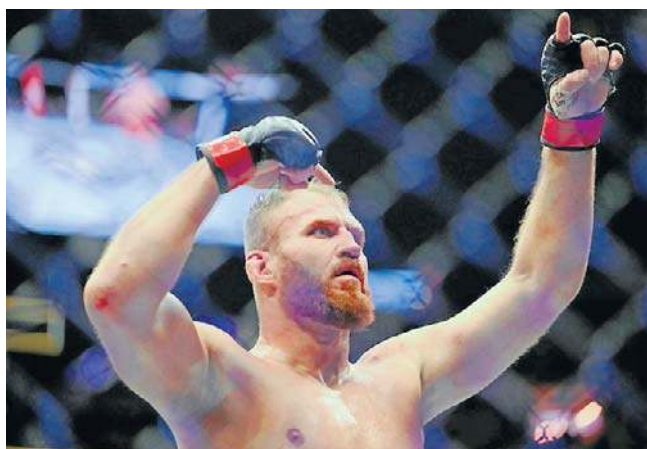
Jedyny polski mistrz UFC w historii - Jan Błachowicz wsparł fundację Cancer Fighters i... zgolił włosy

- Operacja za nami. Teraz czas na rehabilitację i wracam na matę - poinformował Jan