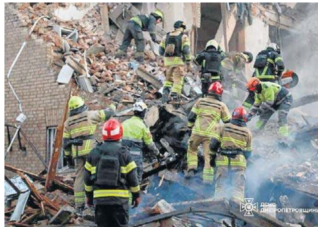
Śłużby ratunkowe na miejscu rosyjskiego ataku na osiedle mieszkaniowe w Dnieprze

Dniepr został ponownie ostrzelany w sobotę wieczorem. Hanża podał, że rannych zostało wówczas 10 osób. Ko-