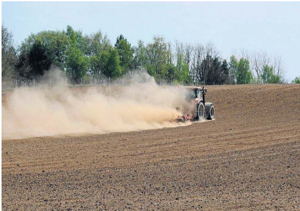
Rolnicy twierdzą, że mamy teraz suszę rolniczą, glebową i meteorologiczną. Oznacza to, że rośliny nie mają dostępu do wody w kluczowych fazach wzrostu.

System ochrony przeciwpożarowej w Lasach Państwowych jest rozbudowany i działa od lat. W każdym nadleśnictwie funkcjonują punkty alarmowo-dyspozycyjne, a na wieżach obserwacyjnych zamontowane są kamery, które monitorują teren.