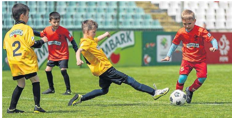
Puchar Tymbark to rozgrywki dla dzieci w trzech kategoriach wiekowych

- Patrząc na poprzednie lata, to w finałach ogólnopolskich znajdowały się w większości te szkoły, które współpracują z klubem lub sekcją piłkarską. One mają większe możliwości do wygrania, a poziom zespołu jest dużo lepszy. Chłopcy z tych szkół dużo trenują i łatwiej im grać o wyższe cele. Bardziej dotyczy to kategorii U-12. Ten turniej jest akurat stricte pod szkołę - dodaje koordynator.