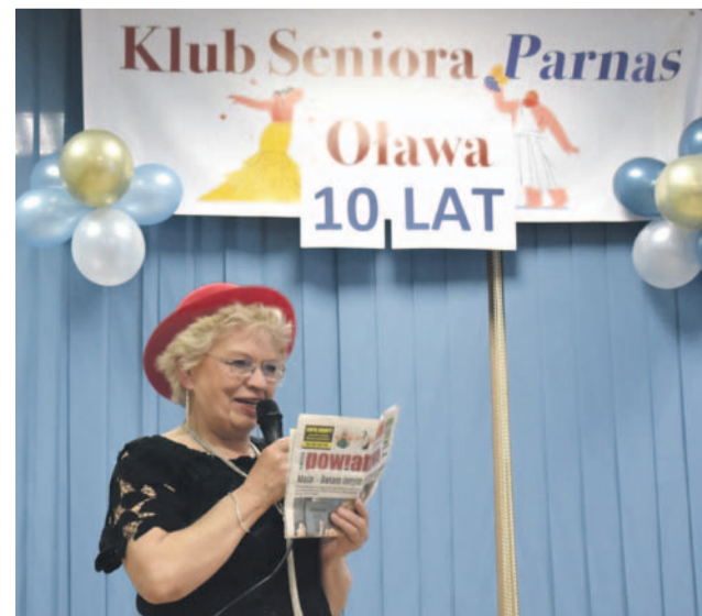
...wciąż gotowi na miłosne przygody