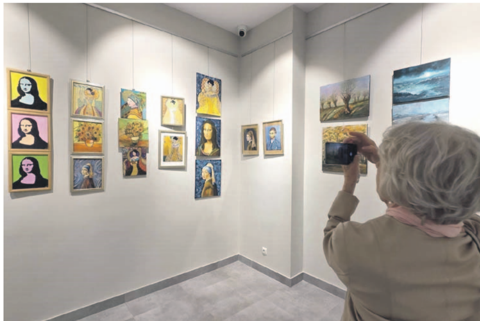
Efekt „rozmów z mistrzami”