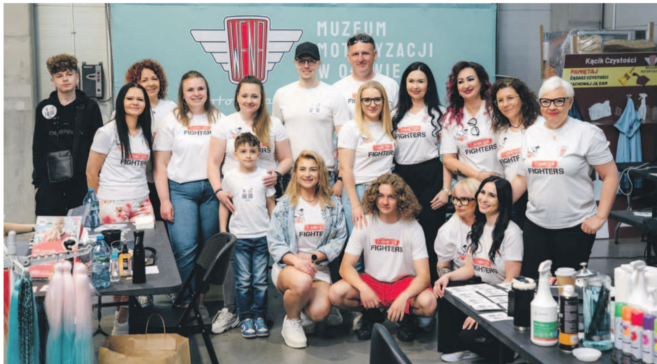
Ekipa wielkich serc