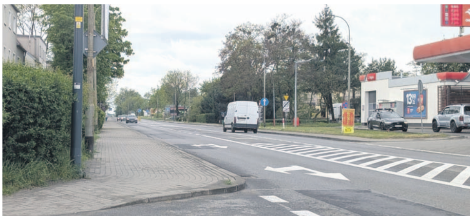
Chodnik szeroki, ale rowerem nie wolno się nim legalnie poruszać.