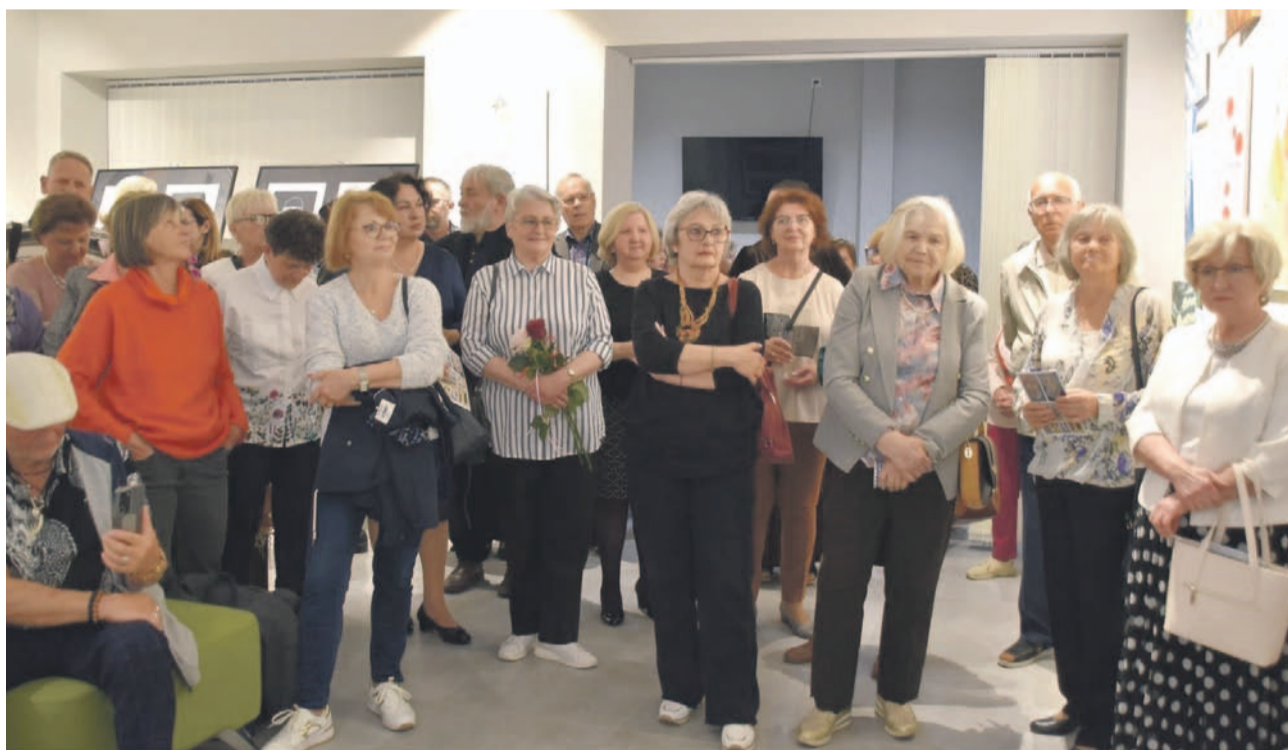
Wernisaż prac malarskich słuchaczy UTW zgromadził artystów i gości

Warhola, którego niektórzy wyjątkowo polubili tworząc na pół abstrakcyjne prace. Drugi nurt to były kolaże. Bardzo wdzięczny temat, bo można zrobić z gazet prawie wszystko, wykombinować fajne kompozycje, tylko musi to być klejenie z przesłaniem i myślę, że możemy się dziś o tym przekonać. Dziewczyny sięgnęły po ciekawe tematy i powstały z tego bardzo interesujące prace. Na nowo odkrywaliśmy też pejzaż. To temat nie do skończenia. Można do niego wracać i odkrywać w nieskończoność, bo okazuje się, że po pewnym czasie malowania tylko akrylem z zainteresowaniem wraca się do olejów czy odwrotnie, więc... Chętnie stosujemy takie powroty. Dziękuję naszym artystom, którzy tutaj są i wciąż chętnie tworzą.