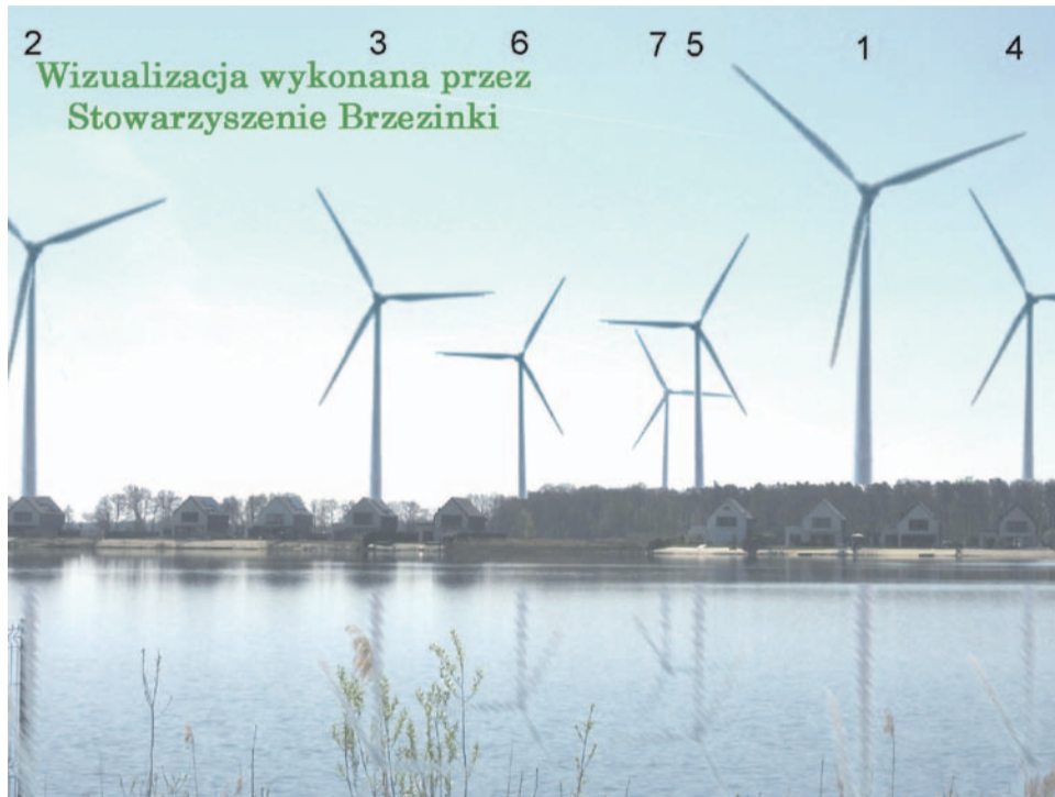
Wizualizacja Stowarzyszenia Brzezinki