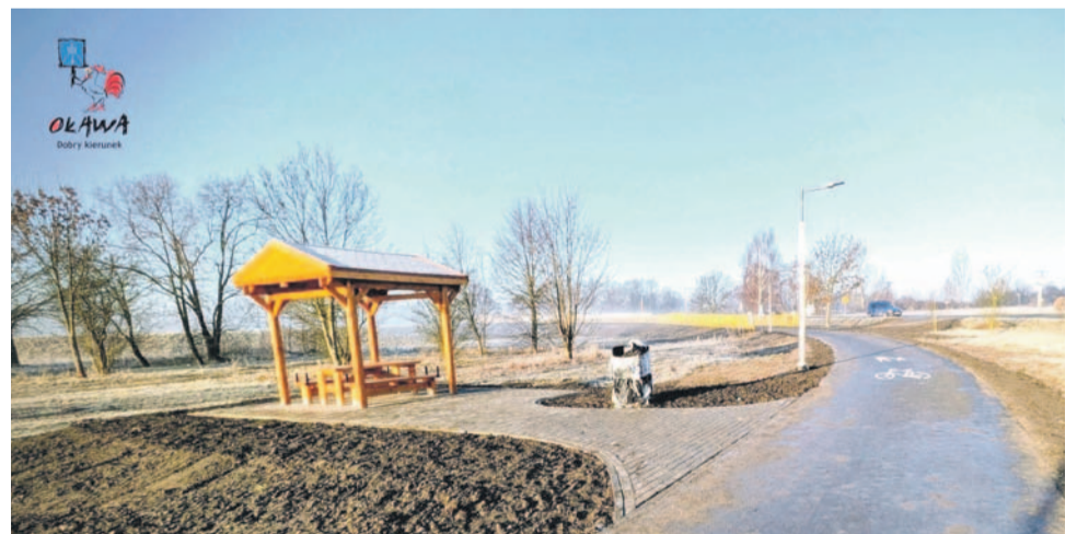
- Wykonano tam Miejsce Odpoczynku Rowerzystów, by nie stawiać ławek, bo ludzie siedzący na nich zabierają miejsca skrajni i to jest problem - tłumaczył burmistrz

Radny dodał, że rozumie, iż jest to inwestycja realizowana we współpracy samorządów i jest na to wyznaczony już teren, ale może warto zainicjować temat i zgłosić taką koncepcję np. do Starostwa