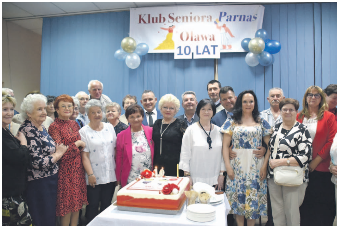
Jak urodziny to koniecznie tort i...