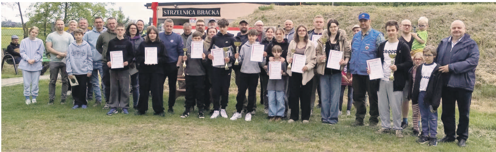
Uczestnicy zawodów wraz z organizatorami

Okolo 45 zawodników wzięło udział w zawodach strzeleckich LOK o puchar burmistrza Jelcza-Laskowic, które odbyły się 9 maja w Parku Strzeleckim „Matczyzna Góra”