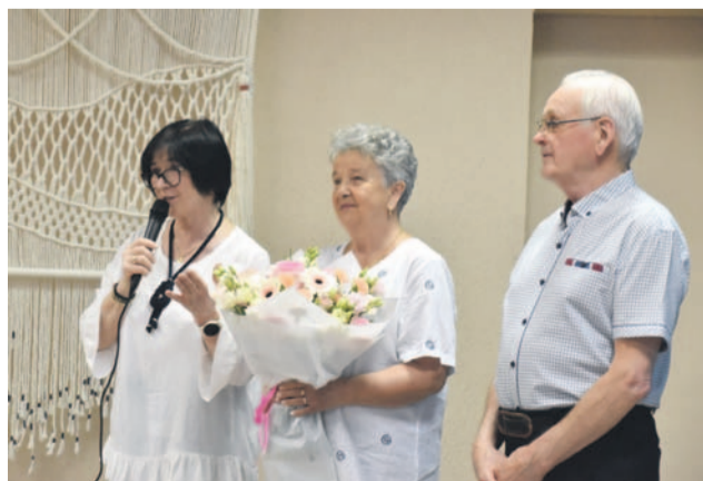
Jubilaci zbierali życzenia i dziękowali