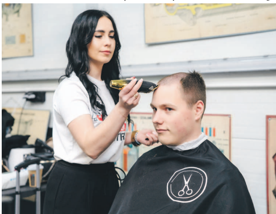
Niektórzy golili się praktycznie „na zero”

TEKST I FOT.: KAMIL TYSA ktyasa@gazeta.olawa.pl