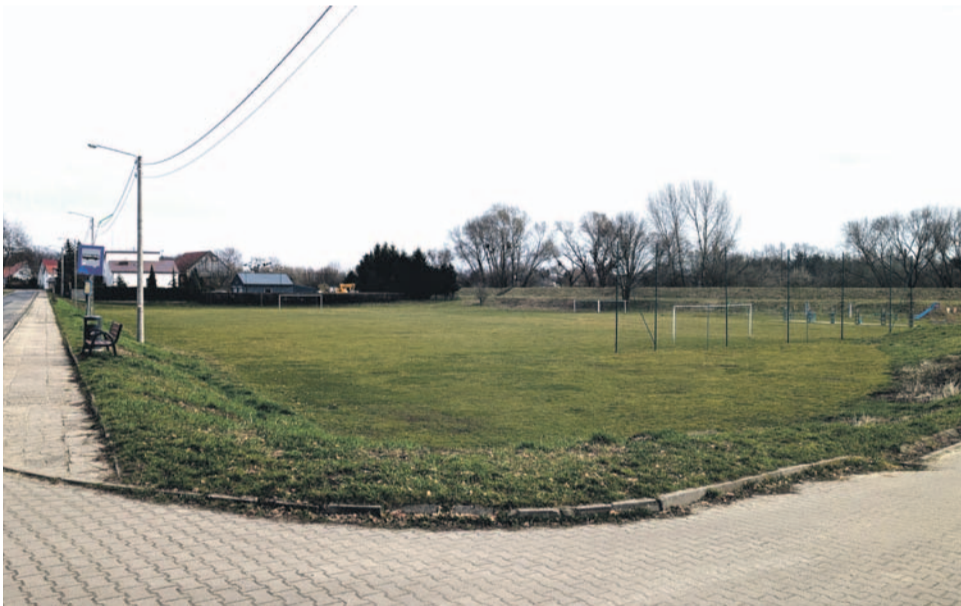
Miasto po raz drugi unieważniło przetarg na remont boiska sportowego przy ul. Bażantowej