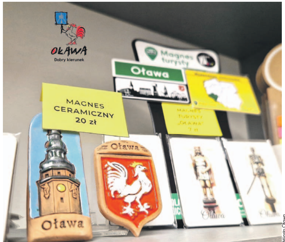
Herb Oławy najczęściej pojawia się na materiałach promocyjnych przygotowanych przez Urząd Miejski. Tym razem chce go wykorzystać firma prywatna

Podobnie jak inni radni był jednocześnie zainteresowany tym, czy w Urzędzie Miasta jest wydział, który będzie nadzorował wykorzystanie herbu, by na wszystkich gadżetach był on jednolity i używany zgodnie z obowiązującym wzorem gra-