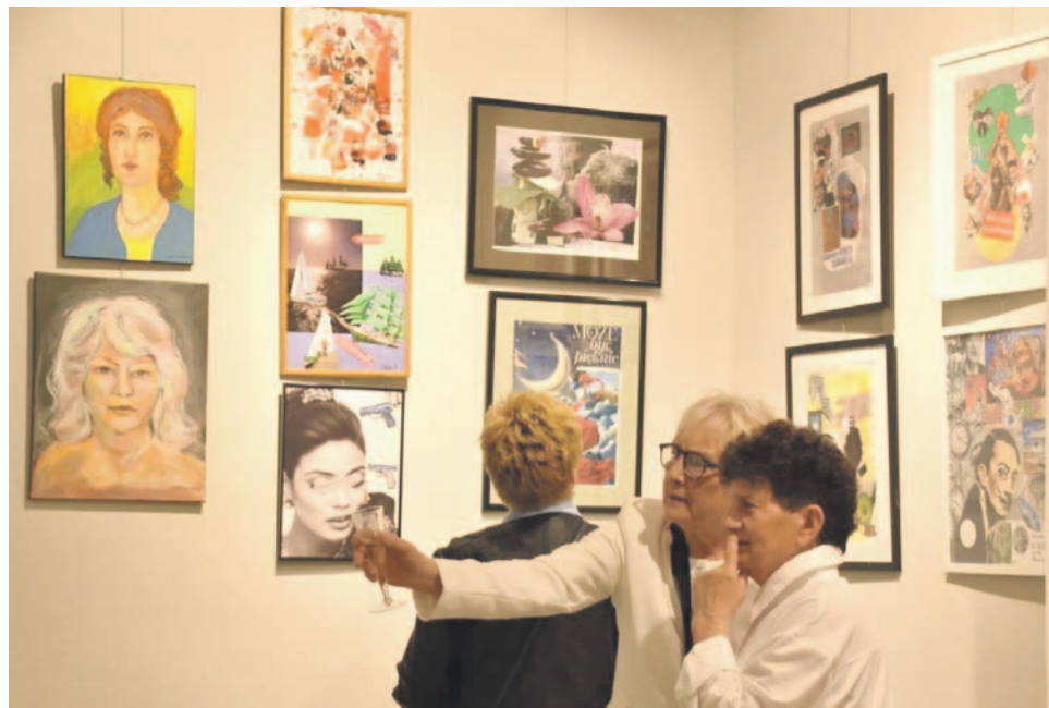
Malarstwo to temat do dyskusji