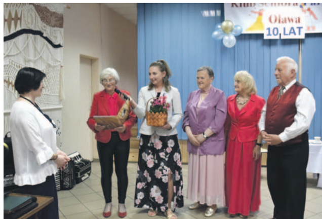
...życzenia, kwiaty oraz prezenty