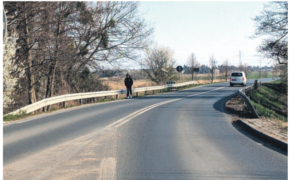
Zadanie obejmuje też budowę ścieżki rowerowej od Lizawic do Marcinkowic wzdłuż drogi powiatowej, którą obecnie mieszkańcy często pokonują rowerem lub nawet piechotą, by dotrzeć do stacji kolejowej.

Ścieżka rowerowa to nie jest jedyny element planowanego przedsięwzięcia. Gmina złożyła też wniosek