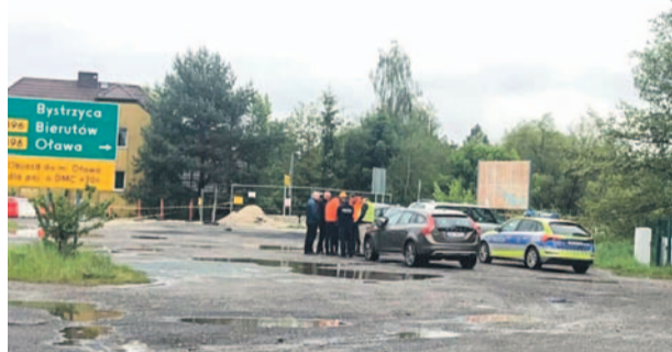
12 maja na trasie objazdu odbyło się spotkanie ze wszystkimi służbami oraz przedstawicielami zaangażowanymi w organizację ruchu na czas remontu dróg wojewódzkich nr 396 i 455