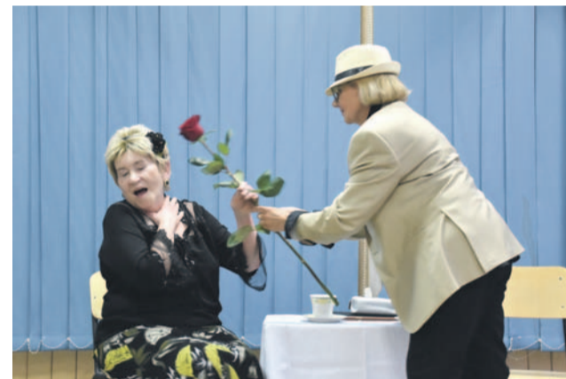
Okazuje się, że seniorzy to świetni aktorzy