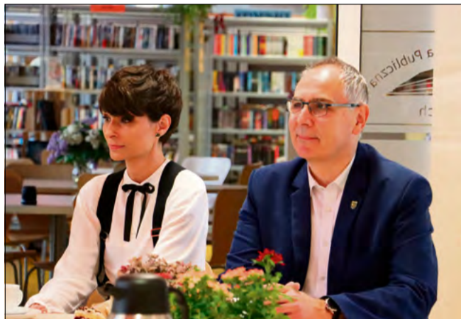
Ciekawe wnętrza sprawiają, że czytelnicy chętnie wracają do naszej biblioteki.

Dzień Bibliotekarza stał się nie tylko okazją do świętowania, ale również do przypomnienia, że biblioteki wciąż pozostawały ważnym miejscem spotkań i budowania więzi międzypokoleniowych.