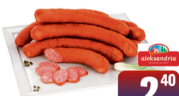
ALEKSANDRIA KIELBASA ALEKSANDRYJSKA