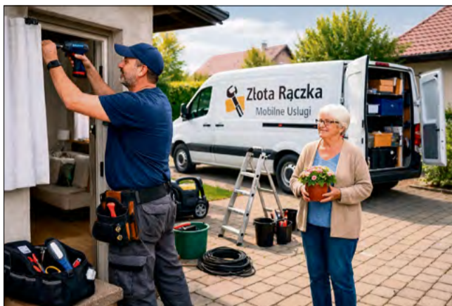
Gmina zapowiada nową pomoc dla mieszkańców.

Jak informuje gmina Walce, „złota rączka” będzie wykonywać przede wszystkim niewielkie naprawy i prace gospodarcze niewymagające specjali-