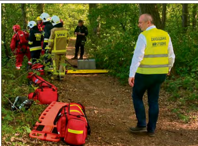
W Krapkowicach i Pietnej odbędą się działania z zakresu ochrony ludności i obrony cywilnej.

W działania zaangażowani zostaną między innymi członkowie Gminnego Zespołu Zarządzania Kryzysowego, pracownicy Urzędu Miasta i Gminy w Krapkowicach, Wodociągów i Kanalizacji, Zakładu Gospodarki Komunalnej i Mieszkaniowej oraz Ośrodka Pomocy Społecznej. W ćwiczeniach uczestniczyć będą również strażacy z Komendy Powiatowej PSP w Krapkowicach oraz jednostki OSP z terenu gminy. W działania włączony zostanie także sołtys Pietnej.