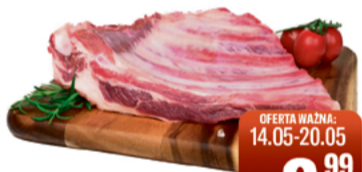
ŻEBERKA WIEPRZOWE TRÓJKĄTY MIĘSNE