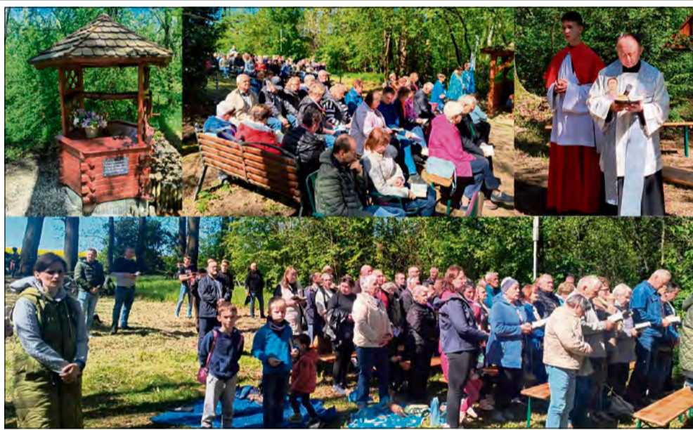
Mimo upływu lat Studzionka na Mosaczu wciąż pozostaje miejscem, do którego mieszkańcy gminy Walce chętnie wracają.

Studzionka na Mosaczu od lat pozostaje miejscem wyjątkowym dla mieszkańców regionu. To właśnie z inicjatywy