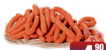
FARMUTIL FRANKFURTERKI PIKANTNE