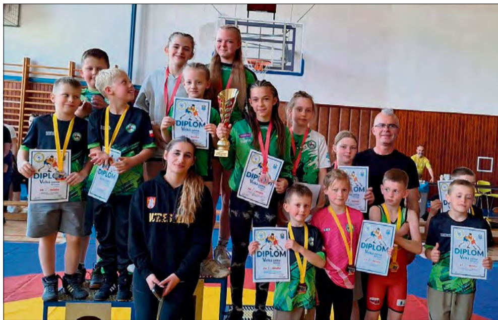
Na zawodach w Czechach klub z Gogolina zaprezentował się wyśmienicie.