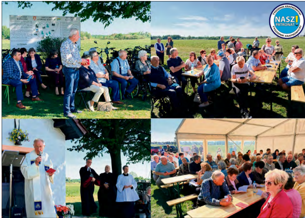
W tym roku pierwsze nabożeństwo majowe przy kapliczce miało wyjątkowy charakter.