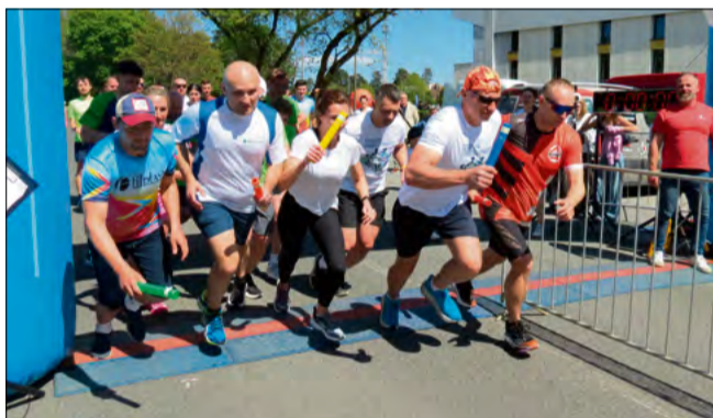
Drużyny Sztafety Dobroczynności w trakcie biegu dały z siebie wszystko, łącząc sportową walkę z ideą pomagania.

00:06:59. Na kolejnych miejscach uplasowali się: miejsce 2. Krapkowickie Centrum Zdrowia Team I – 00:07:24 i miejsce 3. Krapkowickie Centrum Zdrowia Team II – 00:07:43.