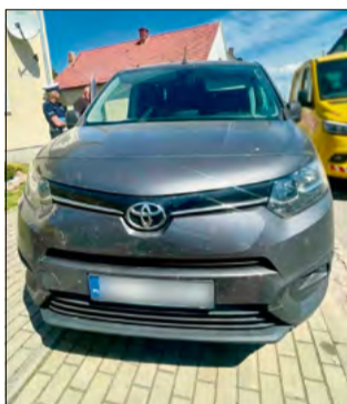
Policjanci zatrzymali samochód prowadzony przez pijanego kierowcę w gminie Strzeleczy po niebezpiecznej jeździe.

Do zdarzenia doszło na terenie gminy Strzeleczy. Policjanci z Krapkowic otrzymali zgłoszenie o toyocie, której kierowca miał poruszać się w sposób skrajnie niebezpieczny – zajmując całą szerokość jezdni i zjeżdżając na przeciwny pas ruchu.