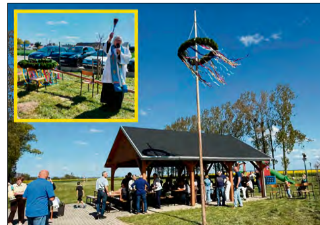
Mieszkańcy Rozkochowa podczas tradycyjnego stawiania moika i wspólnego świętowania 1 maja.

(laba), fot. fot. Fb Koło Gospodyń Wiejskich/Stowarzyszenie Odnowy Wsi/Sołectwo/DFK Rozkochoń