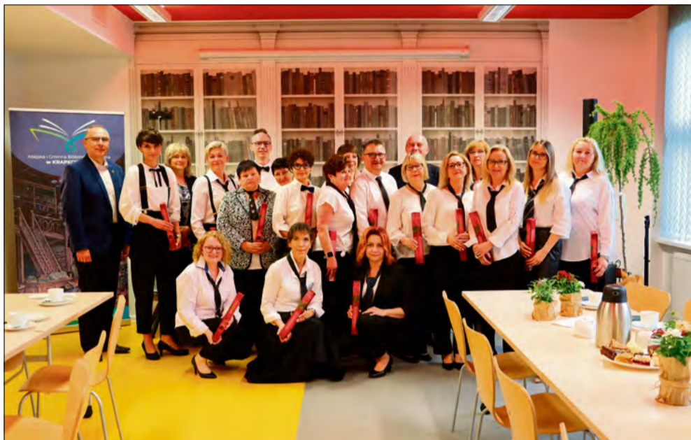
Uroczystość przebiegła w przyjemnej atmosferze.

8 maja obchodzono Ogólnopolski Dzień Bibliotekarza i Bibliotek. Z tej okazji pracowników Miejskiej i Gminnej Biblioteki Publicznej w Krapkowicach przy ul. Mickiewicza odwiedziły władze samorządowe gminy.