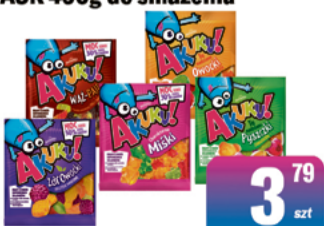
JUTRZENKA ŻELKI AKUKU! 90g wybrane rodzaje