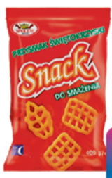
SPOŁEM KIELCE PRZYSMAK ŚWIĘTOKRZYSKI SNACK 400g do smażenia