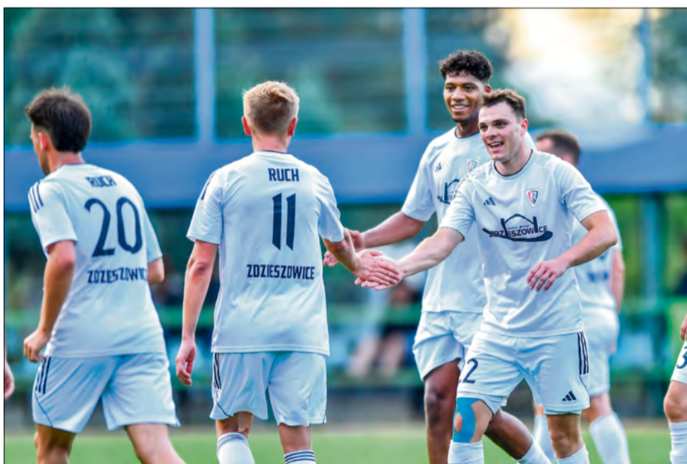
Piłkarze Ruchu Zdzieszowice mieli powody do radości po meczu w Namysławie.

Ruch Zdzieszowice pokonał w delegacji Start Namysłów i utrzymał przewagę ośmiu punktów nad drugim w tabeli Ozimkiem. To była siedemnasta wygrana „Zdzichów” w tym sezonie i zarazem ósma na wyjeździe. Bez punktów z wyjazdu do Brzegu wrócili piłkarze waleckiego LZS-u.