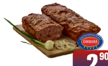
CHABURA BOCZEK PIECZONY Z CEBULKĄ