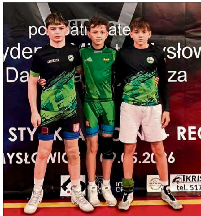
Trzech „wolniaków” ZKS-u Gogolin próbowało swoich sił na turnieju w stylu klasycznym w Mysłowicach.