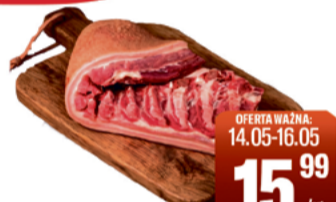
BOCZEK WIEPRZOWY ZE SKÓRĄ