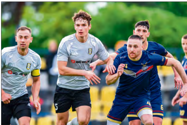
Defensywa gospodarzy dała się zaskoczyć pod koniec meczu.