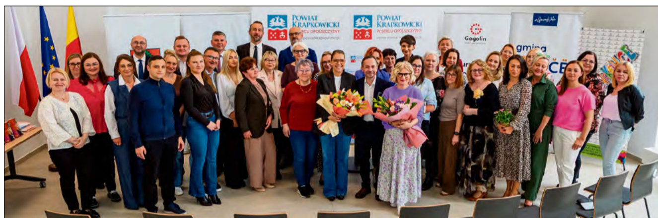
Pracownicy bibliotek z powiatu krapkowickiego otrzymali gratulacje i upominki od wóldarzy gmin oraz starosty krapkowickiego.

Podczas uroczystości przedstawiciele samorządów wręczyli bibliotekarzom gratulacje oraz