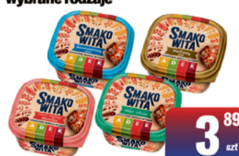
BUNGE MARGARYNA SMAKOWITA 450g wybrane rodzaje

2 SZTUKI PO 5 49 1 szt. 7,32 zł/l *cena za zestaw: 10,88 zł