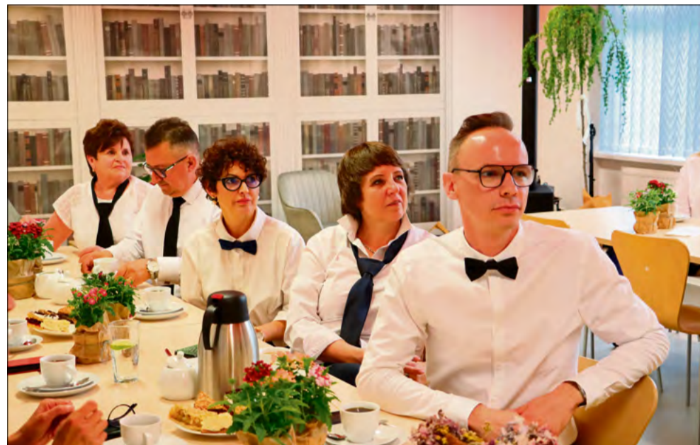
Wspólny poczęstunek był świetną okazją do wymiany ciekawych pomysłów.

Podczas uroczystości podkreślano, że współczesna biblioteka nie jest już wyłącznie miejscem wypożyczania książek. Placówki coraz częściej stają