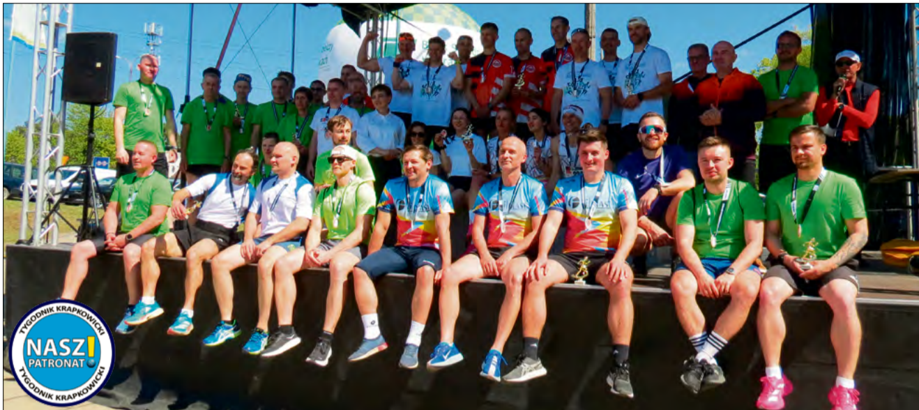
Uczestnicy Sztafety Dobroczynności i organizatorzy po zakończeniu rywalizacji podkreślili wspólny wymiar sportu i solidarności w powiecie krapkowickim.

Jak podkreślają organizatorzy, tegoroczna edycja przyniosła realne efekty. Łącznie udało się zebrać