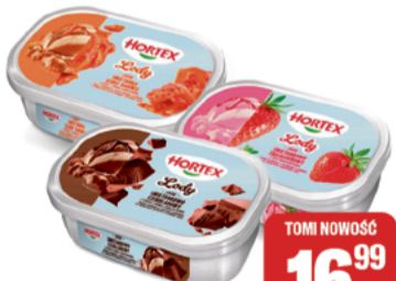
HORTEX LODY 900ml wybrane rodzaje