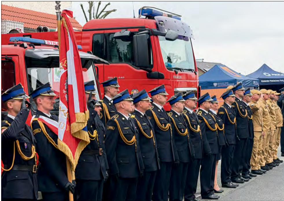
Apel odbył się na placu przy Komendzie Powiatowej Państwowej Straży Pożarnej w Krapkowicach.