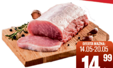
SCHAB WIEPRZOWY BEZ KOŚCI

CENA W OFERCIE OBOWIĄZUJE WE WSZYSTKICH PLACÓWKACH TOMIMARKT