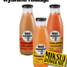
BRACIA SADOWNICY SOK TŁOCZONY 750ml wybrane smaki

2 SZTUKI PO 5 49 1 szt. 7,32 zł/l *cena za zestaw: 10,88 zł