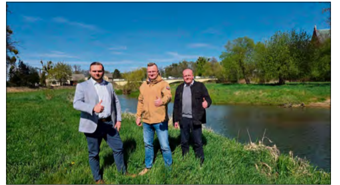
Stabilniejsze brzozy, uporządkowane koryta rzeki i większa ochrona przed kolejnymi żywiołami - właśnie tego potrzebują mieszkańcy terenów położonych wzdłuż Osobłogi.

Powódź w 2024 roku dała się we znaki szczególnie mieszkańcom Łowkovic i Komornik, gdzie woda wyrządziła ogromne szkody