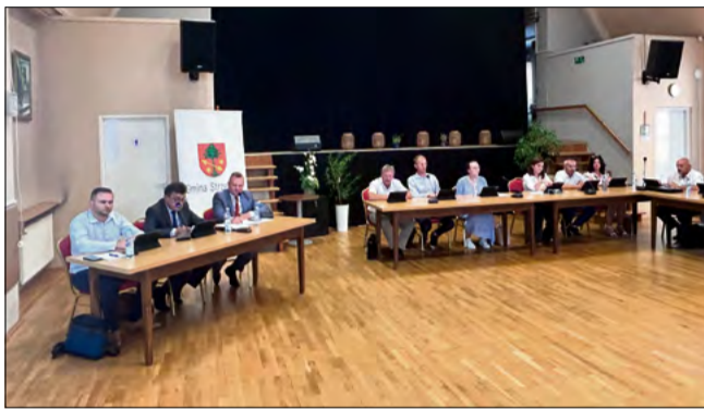
Temat omówiono na ostatniej sesji Rady Miejskiej w Strzeleczy.

Proces starzenia się społeczeństwa może skutkować potrzebą zwiększenia nakładów finansowych na opiekę nad osobami starszymi i wymagającymi wsparcia. Dużym obciążeniem dla gminy jest również zabezpie-