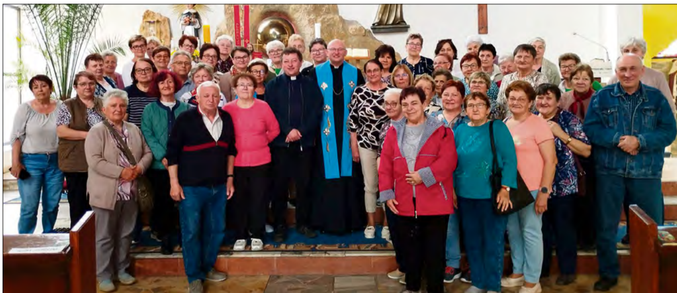
Pokaźna grupa pielgrzymów odwiedziła Górażdże.

Grupa parafian z Walec odbyła pielgrzymkę do parafii pod wezwaniem błogosławionego Czesława w Górażdżach. Wyjazd zorganizowany został dzięki wsparciu Caritas diecezji opolskiej. W środę 6 maja seniorzy odwiedzili kościół, by poznać sylwetkę patrona diecezji i wspólnie się modlić.