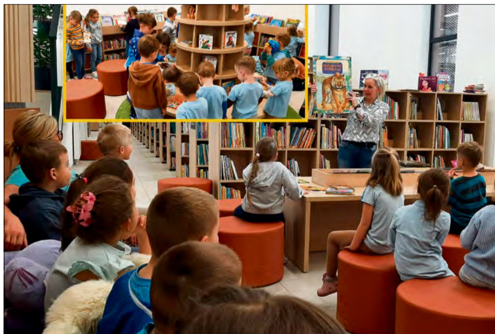
Przedszkolaki po raz pierwszy zobaczyły wnętrza lokalnej biblioteki.

Podczas spotkania zaprezentowano wiersz „Na straganie” Jana Brzechwy. Zadaniem dzieci było wychwycenie nazw warzyw pojawiających się w utworze, a następnie odnalezienie ich na obrazkach. Bibliotekarki zapytały