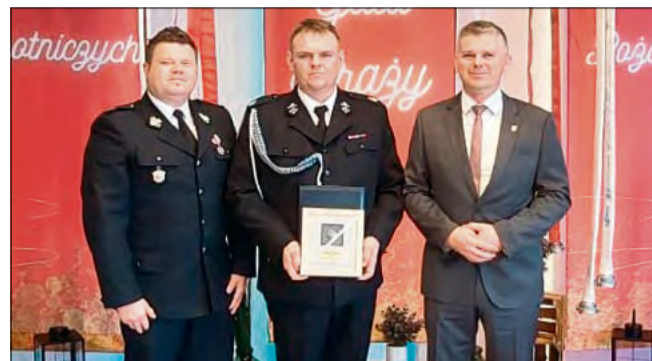
Nagrodę odebrano podczas uroczystej gali w Opolu.

- Dziękujemy za to wyjątkowe wyróżnienie i okazane uznanie dla naszej jednostki - podkreślają druhowie z OSP Obrowiec. - To wyróżnienie dedykujemy wszystkim druhom i druhom OSP Obrowiec - zarówno obecnym, jak i tym, którzy przez ostatnie 100 lat tworzyli historię naszej jednostki swoją pracą, po-