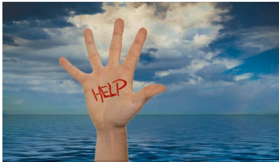
Zaburzenia lekowe, depresja, trudności emocjonalne to tylko kilka czynników depresyjnych.

Rodzice chłopaka na początku sami próbowali rozwiązać problem, rozmawiali z nauczycielami, którzy również potwierdzili jego wycofanie społeczne, zarówno z udziału w za-