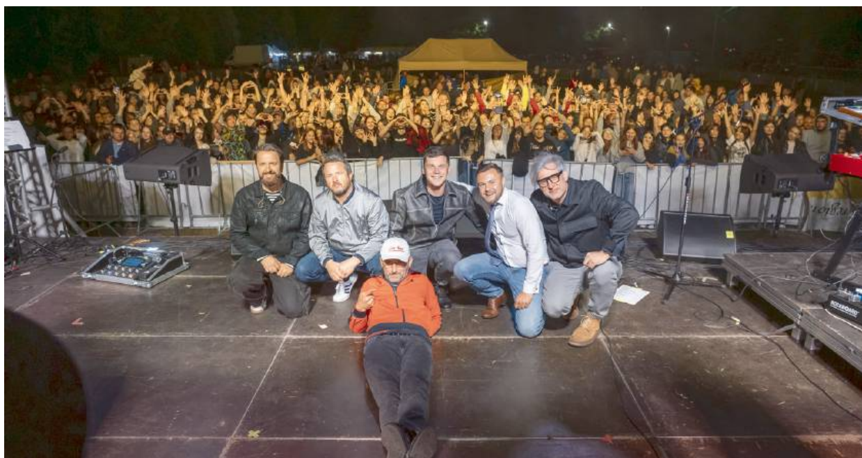
Zespół Myslovitz opanował scenę, a publiczność nie kryła swojego entuzjazmu!