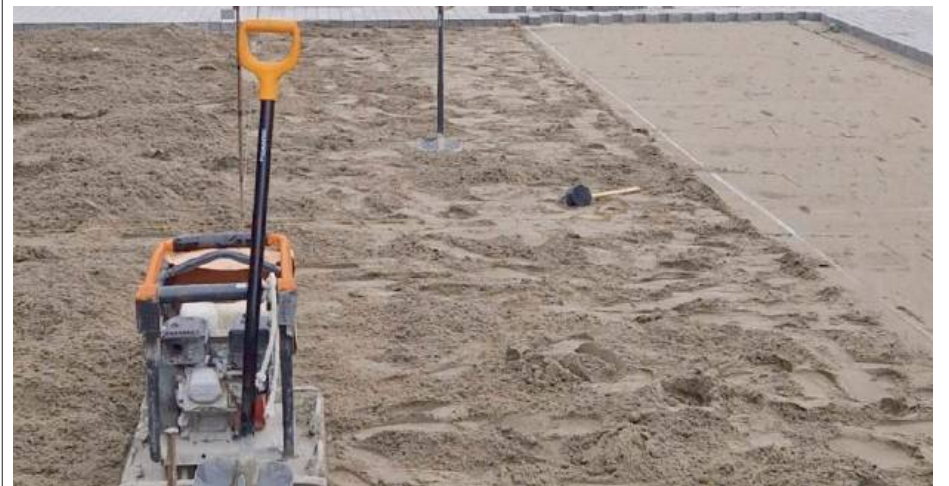
Prace remontowe trwają w kilku miejscach

Koszt całkowity zadania wynosi 950 087,60 zł brutto. Dofinansowanie ze środków Rządowego Funduszu Rozwoju Dróg w kwocie 759 313,04 zł stanowi 80% kosztów kwalifikowanych. Przewidywany termin zakończenia prac to listopad 2024r. MAT.OPRAC.