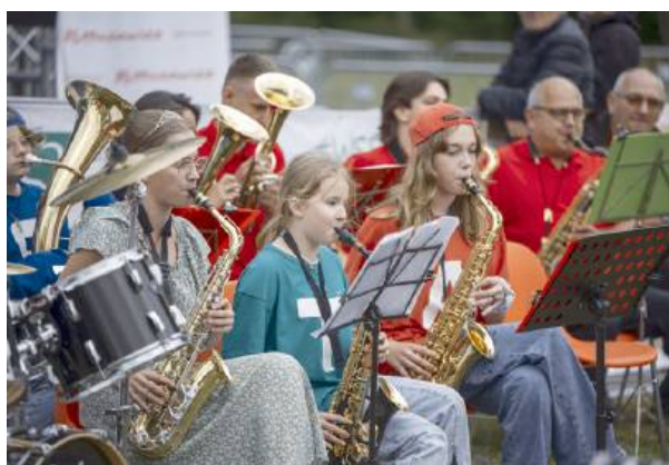
Występ orkiestry dętej Ochotniczej Straży Pożarnej w Mordach