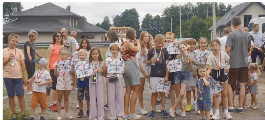
Żaboklicki Bieg to już tradycja w tej miejscowości

Cała impreza cieszyła się dużym zainteresowaniem mieszkańców, którzy licznie przybyli, by wziąć udział w zabawach i spotkać się ze znajomymi. Wszyscy bawili się doskonale i z uśmiechem opuszczali teren placu w Żaboklikach. Tego dnia został również oficjalnie