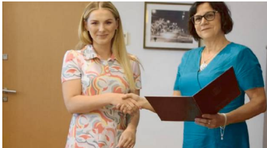
Spotkanie pozwoliło poznać plany młodej artystki