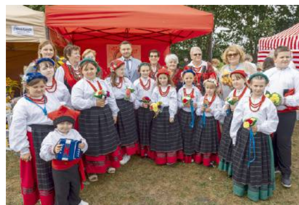
Mali „staškowiacy” ze Stanisławowa skradli serca...

Na scenę burmistrz zaprosił też radnych Rady Miejskiej w Mordach, sołtysów i pracowników Urzędu Miasta. Wszystkim wręczono słoneczniki, które stały się symbolem nie tylko tego wydarzenia, ale też pogody ducha, którą mają Mieszkańcy Miasta i Gminy Mordy!