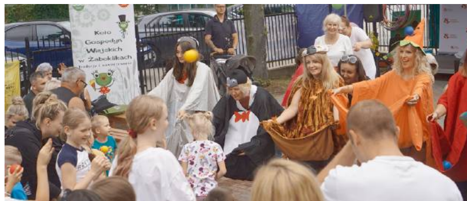
Również rodzice zaprezentowali swoje talenty aktorskie

otwarty plac zabaw. Miejsce przez wielu wyczekiwane, a przez najmłodszych wypragnione. Nowy sprzęt i przestrzeń zaraz po przecięciu wstęgi spotkała się z testowaniem przez najmłodszych.