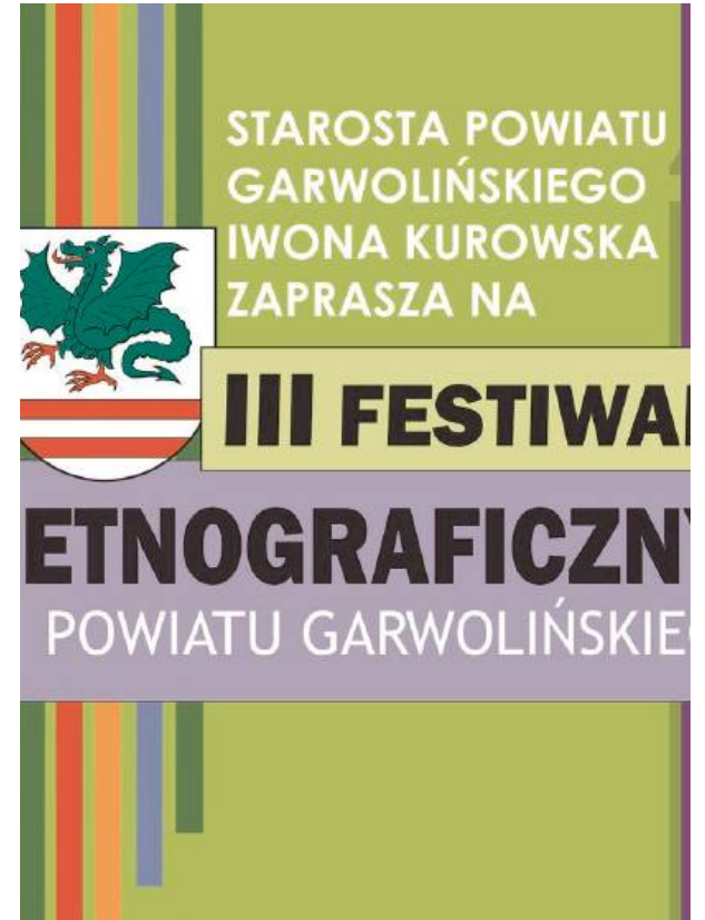
Bogaty program wydarzenia przedstawiono na plakacie

W tym roku wydarzenie przyciągnęło mnóstwo mieszkańców powiatu i regionu garwolińskiego. W tym roku organizatorzy nie zwolnili tempa i wysoko stawiając poprzeczkę organizacyjną również liczą na ogromne zainteresowanie wydarzeniem.