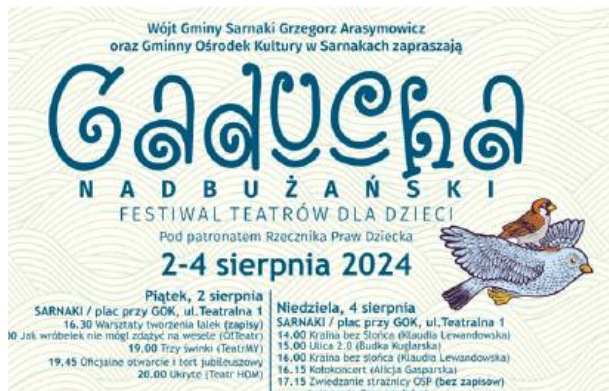
Tegoroczna Gaducha zapowiada się interesująco.

Od piątku do niedzieli spektakle grane będą w Sarnakach na placu przy GOK oraz w sali widowiskowej GOK. Natomiast w sobotę spektakl i warsztaty odbędą się w ramach festiwalu w Mierzvicach, w świetlicy wiejskiej, a w niedzielę w Serpelicach - w filii Gminnej Bi-