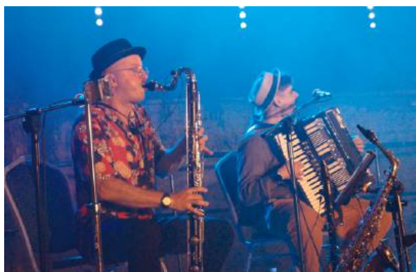
Każdy koncert zespołu jest pełen autentyczności i emocji.