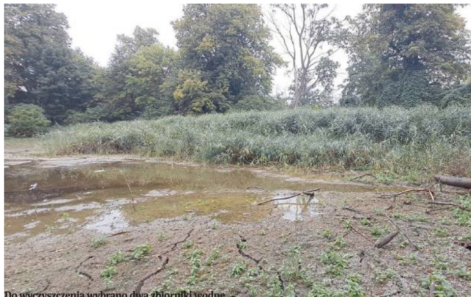
Do wyczyszczenia wybrano dwa zbiorniki wodne.

Gmina Repki wskazała dwa zbiorniki wodne, które w tym rozdaniu zostaną oczyszczone. Do tych zadań należą: oczyszczenie zbiornika wodnego w miejscowości Rogów - 134 316,00 zł; oczyszczenie zbiornika wodnego w miejscowości Szkopy - 198 030,00 zł. MAT.OPRAC.