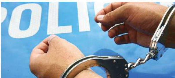
Łosiccy funkcjonariusze dokonali kilku zatrzymań jednego dnia.

To już kolejna tego typu akcja przeprowadzona przez łosicką policję w tym roku. Od początku stycznia 2024 roku funkcjo-