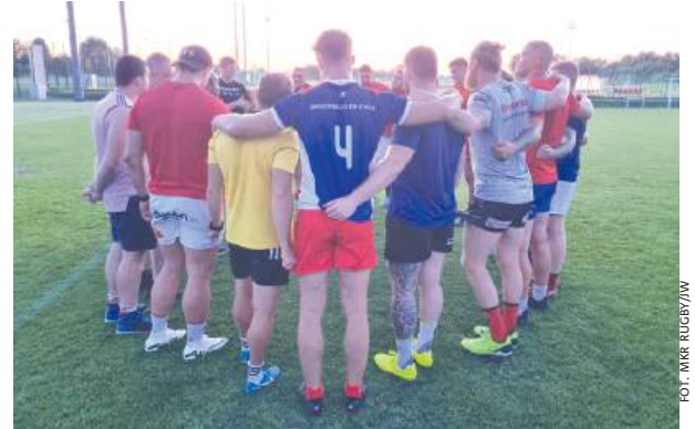
Pogon na pierwszym treningu przed nowym sezonem.

Terminarz rundy jesiennej: I kolejka: 17.08.2024, godz. 16:00, Pogon - KS Budowlani WizjaMed Łódź. II kolejka: 24.08.2024, godz. 16:00, Pogon - Rugby Białystok (zmiana gospodarza). III kolejka: 07-08.09.2024, Orkan Sochaczew - Pogon (zmiana gospodarza). IV kolejka: 14.09.2024, MKS Ogniwo Sopot - Pogon. V kolejka: Pogon pauzuje. VI kolejka: 05.10.2024, godz. 14:00, Po-