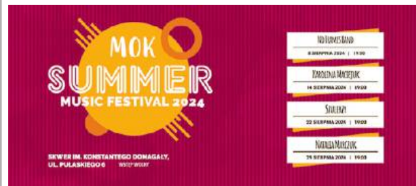
Festiwal zainauguruje występ No Frames Band.

Pełen harmonogram MOK Summer Music Festival 2024: No Frames Band - 8 sierpnia 2024 r. / czwartek / 19:00 Karolina Maciejuk - 14 sierpnia 2024 r. / środa / 19:00 Szulerzy - 22 sierpnia 2024 r. / czwartek / 19:00 Natalia Marczuk - 29 sierpnia 2024 r. / czwartek / 19:00 Koncerty będą odbywały się na skwerze im. Konstantego Domagały. Wstęp wolny. PA