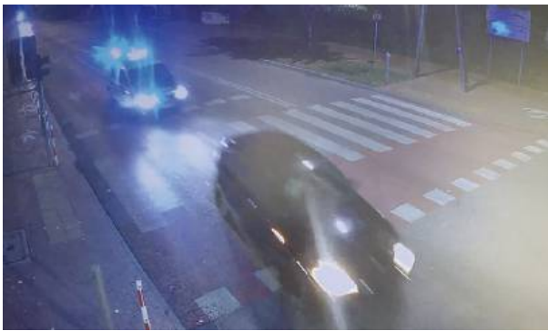
Kierującym okazał się 35-letni mieszkaniec Siedlec.

26 lipca policjanci siedleckiej komendy prowadzili długi i dynamiczny pościg za kierowcą BMW, który jechał bez tablic rejestracyjnych. Całe zajście wyglądało jak scena rodem z filmu akcji.