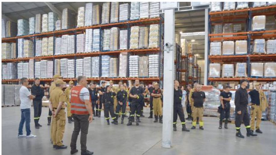
Pod uwagę wzięto trudny, ale możliwy scenariusz

- Dzięki ćwiczeniom strażacy lepiej współpracują w zespole, co jest kluczowe podczas akcji ratunkowych. Każdy trening pozwala na przećwiczenie różnych scenariuszy, co zwiększa pewność siebie i kompetencje strażaków. Ćwiczenia pomagają również w lepszym poznaniu sprzętu i jego obsługi, co jest niezbędne w trakcie realnych interwencji. Strażacy ochotnicy dzięki regularnym ćwiczeniom są w stanie szybciej i skuteczniej reagować na zagrożenia - podają pracownicy Urzędu Gminy Sokołów Podlaski.