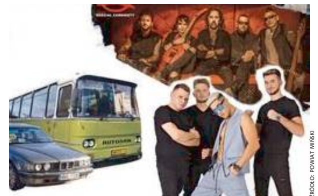
Fragment plakatu promującego wydarzenie

Wśród atrakcji towarzyszących są: stanowiska rekonstrukcyjne oraz zabytkowe wozy bojowe z okresu II Wojny Światowej, stanowiska Wojska Polskiego, stanowiska Ochotniczych Straży Pożarnych, stanowisko Służby Więziennej,