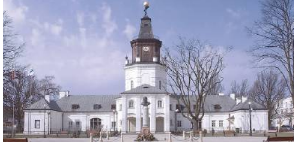
Według najnowszych danych Siedlce zamieszkuje 75,3 tys. osób.

Na początku 2024 roku stopa bezrobocia w Siedlcach wyniosła 3,8%, co jednocześnie jest tendencją malejącą i wskazuje niejako na poprawę sytuacji na rynku pracy. Malejące bezrobocie jest pozytywnym sygnałem dla miasta i jego mieszkańców, ale nie wystarczy, by zatrzymać odpływ młodych ludzi do większych ośrodków miejskich.