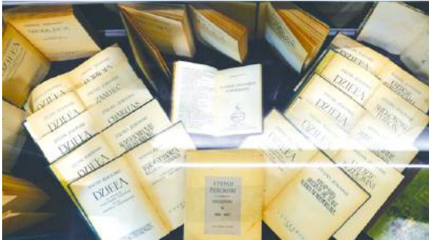
Dzieła Żeromskiego były jednym z tematów konferencji.

W ramach konferencji Dialog Pokoleń 2024, która miała miejsce w Łosicach, odbyły się liczne panele dyskusyjne, wykłady oraz warsztaty. Jednym