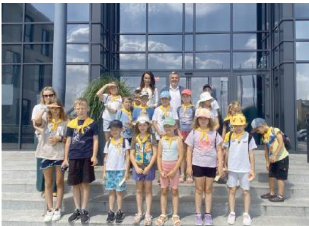
Jak widać wielki budynek zachęca i przyciąga ciekawość