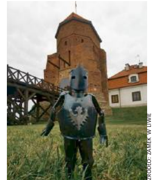
Pan rycerz zaprasza...

14.30 – Turniej miecza długiego 15.30 – Pokaz drapieżnych ptaków 16.00 – Walki pocztów rycerskich - Zdobycie Flagi 17.00 – Pokazy rycerstwa konnego Drużyny Xiążęcej „To właśnie średniowiecze” 19.00 – Bitwa o Zamek oraz oficjalne przekazanie kolekcji broni przez Krzysztofa Szczęgłowa do Muzeum Zbrojowni na Zamku w Liwie 20.00 – Zespół Roderyk – koncert muzyki dawnej 20.30 – Gala Zawodowych Walk Rycerskich – pełnokontaktowe walki najlepszych zawod-