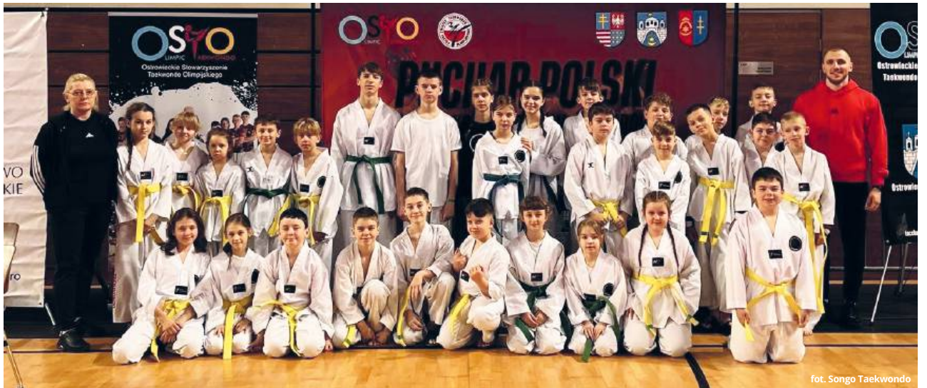
fol. Songo Taekwondo