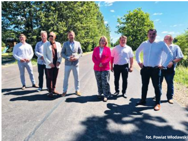
fol. Powiat Włodawski

W Orchówku zrealizowano przebudowę fragmentu drogi prowadzącej od skrzyżowania z drogą wojewódzką do terenu byłej fabryki Sco-Pak. Odcinek o długości ponad 2,1 km został przebudowany kosztem 3 304 177,73 zł. Zadanie obejmowało kompleksową modernizację nawierzchni i dostosowanie parametrów technicznych do obowiązujących standardów. W odbiorze technicznym