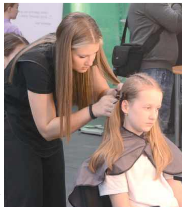
Sportowe fryzury cieszyły się ogromnym zainteresowaniem