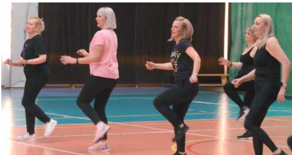
Dzień kobiet można spędzić przy kawie i ciastku. A można też tak!

Panie mogą także odświeżyć swój wygląd dzięki sportowym fryzynom, a wszystko to w przyjaznej i pełnej dobrej energii atmosferze. Biłgorajki zdecydowanie lubią świętować Dzień Kobiet aktywnie, co potwierdziła frekwencja i zaangażowanie w wykonywane zadania.