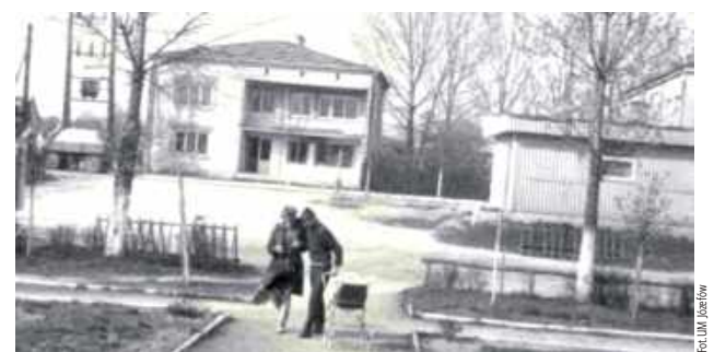
Biblioteka w Józefowie zbiera materiały w celu stworzenia wystawy prezentującej rozwój i życie Józefowa na przestrzeni lat

Z okazji obchodów 300-lecia miasta Józefowa Miejska Biblioteka Publiczna w Józefowie zwraca się z uprzejmą prośbą o udostępnienie starych zdjęć oraz publikacji związanych z historią naszego miasta.