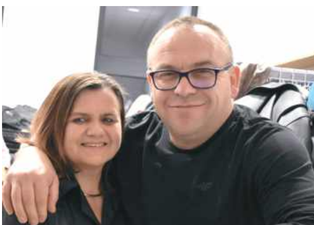
Mieszkańcy chętnie zaglądali na imprezę