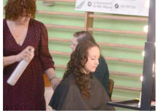
Warsztaty makijażu, konsultacje fryzjerskie i porady stylistki, stylizacja brwi, zabiegi modelujące sylwetkę, pomiary ciśnienia oraz BMI masy ciała, diagnozowanie zmian podologicznych oraz konsultacje to tylko część z przygotowanych atrakcji

8 marca w Medyczne Studium Zawodowe w Biłgoraju tradycyjnie zaprosiło na zorganizowany z rozmachem Dzień Kobiet