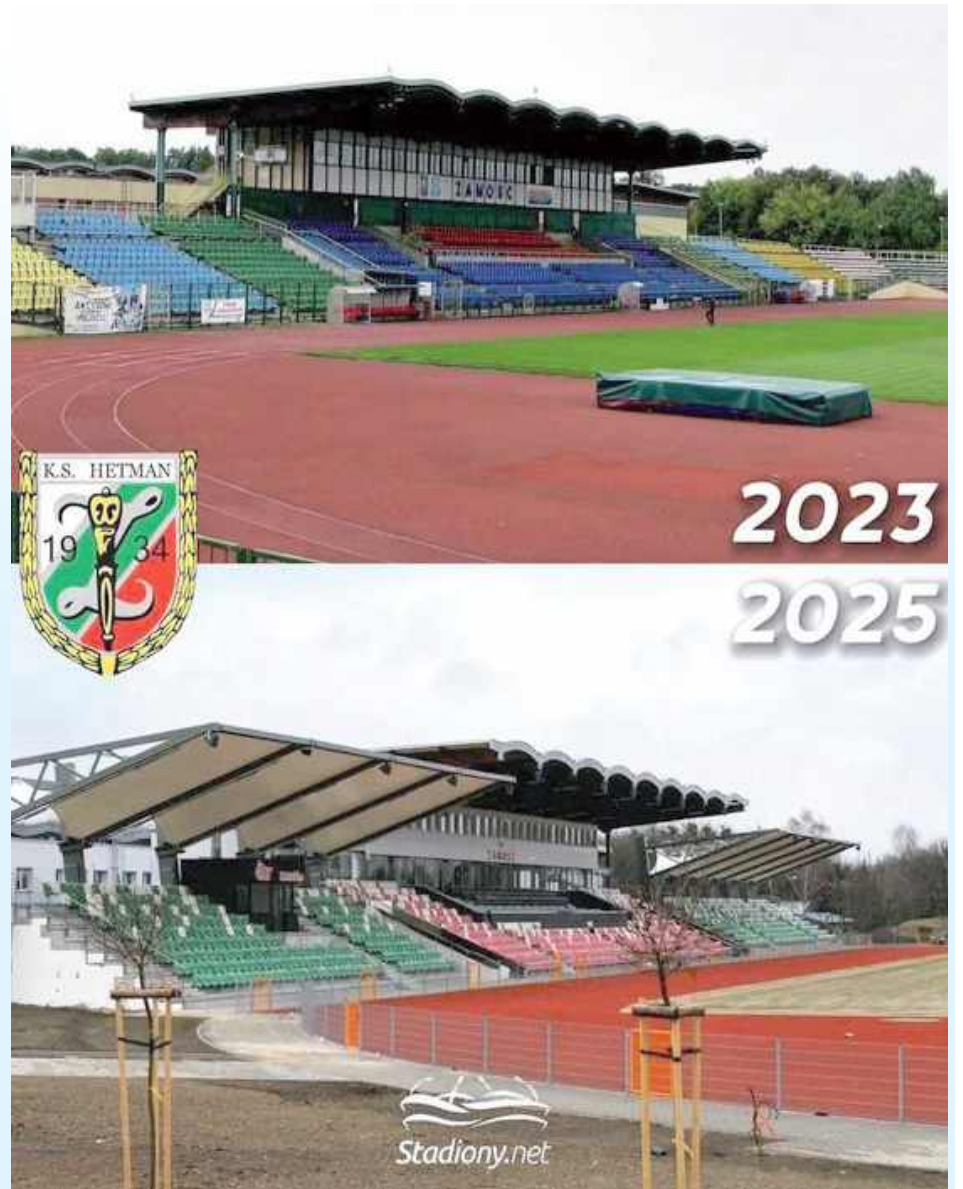
Tak zmienił się zamojski stadion po inwestycji za... blisko 60 milionów złotych