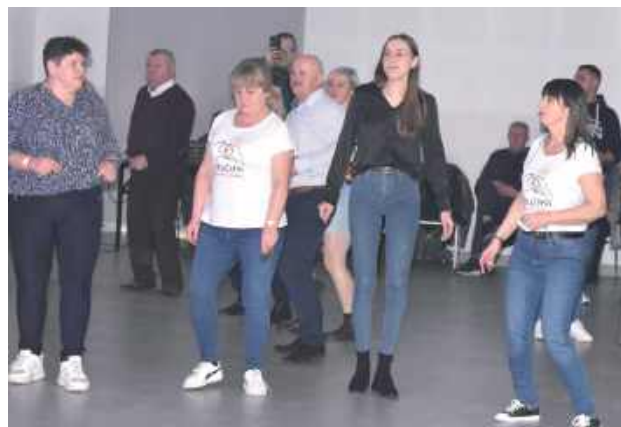
W programie imprezy zaplanowano koncerty zespołów, licytacje i bufet strażaka