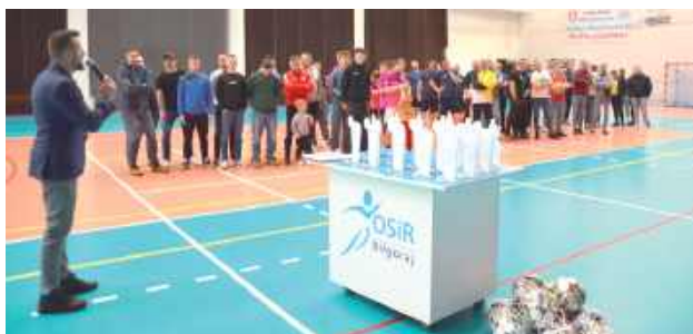
Dwanaście zespołów rywalizowało w Halowej Lidze Piłki Nożnej o Puchar Burmistrza Miasta Biłgoraja w sezonie 2024/2025