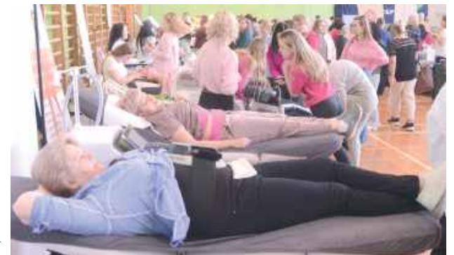
W programie wydarzenia, organizatorzy przygotowali zabiegi pielęgnacyjne i ulepszające. Chętnych nie brakowało