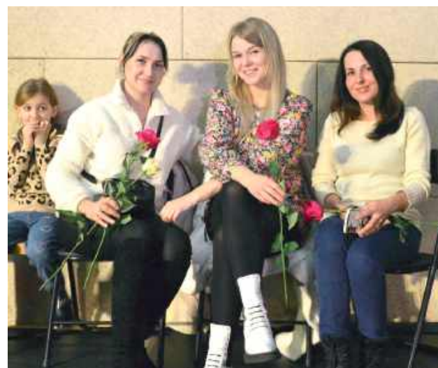
Panie wyglądają na zadowolone