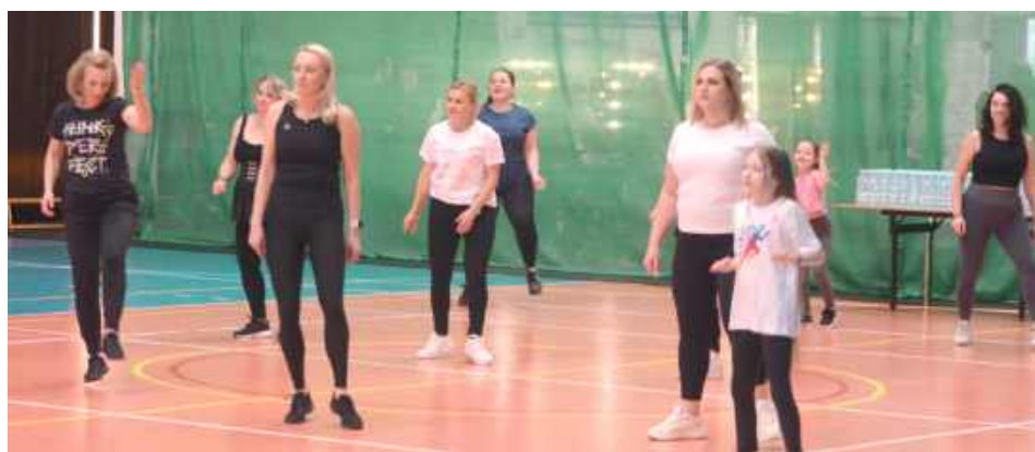
Wspólne ćwiczenia łączą pokolenia