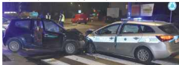
Na rondzie ks. Jana Mroza w Biłgoraju kierowca Citroena z całym impetem uderzył w oznakowany radiowóz, który chciał go zatrzymać, następnie próbował uciekać pieszo

Kierowca Citroena nie reagował na sygnały podawane przez policjantów i kontynuował ucieczkę ulicami miasta