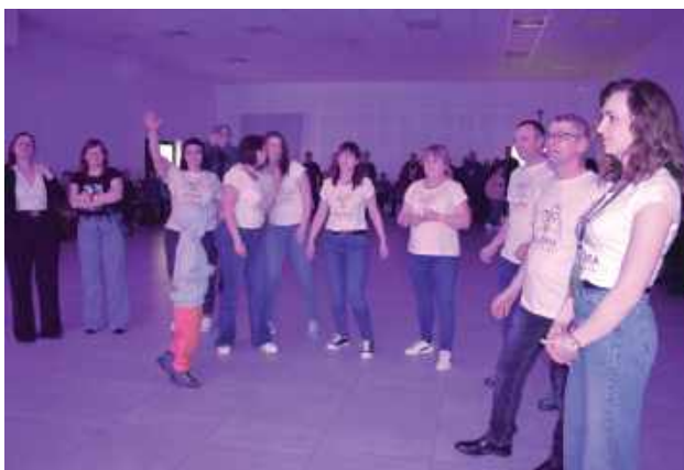
Nie ma dnia, by DRUŻYNA KAROLKA nie działała na rzecz małego mieszkańca gminy