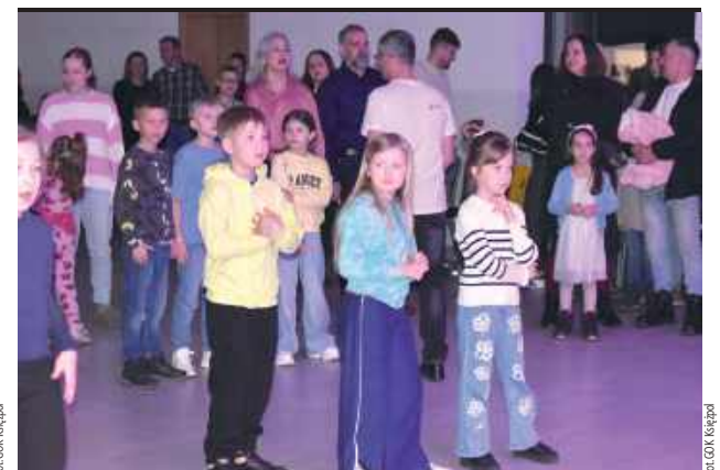
Księżpol bawił się i pomagał