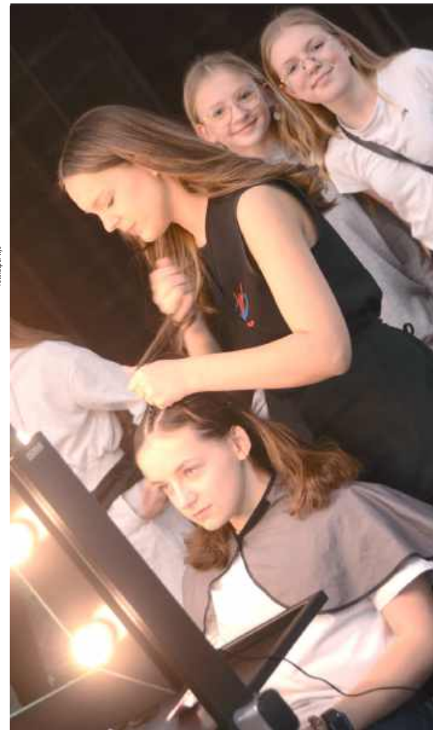
Panie uczyły się jak wykonać idealną sportową fryzurę