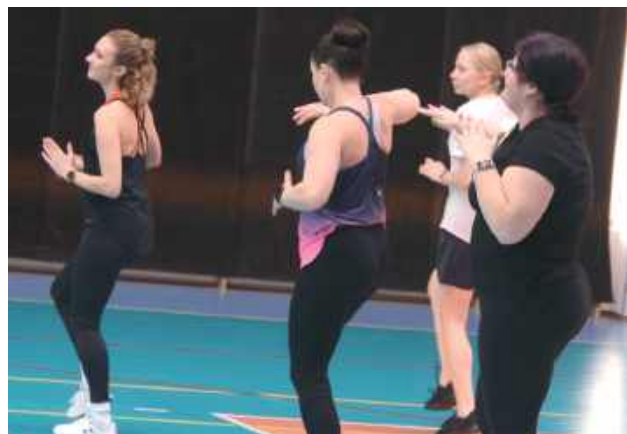
Tak panie ładowały akumulatory