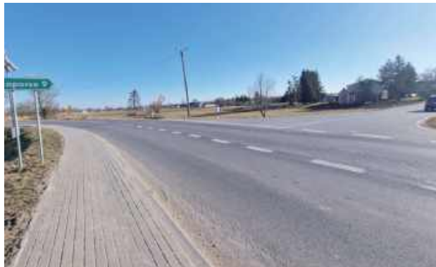
Drugie przejście dla pieszych miałyby się znaleźć w tym miejscu

- Wymagane jest wykonanie dojazdów do przejść wraz ze strefami oczekiwania bez barier architektonicznych, wyposażenie w dedykowane oświetlenie, oznakowanie pionowe i poziome. Ponadto konieczne jest zapewnienie widoczności pieszego z punktu widzenia kierowcy oraz widoczności pojazdu z punktu widzenia