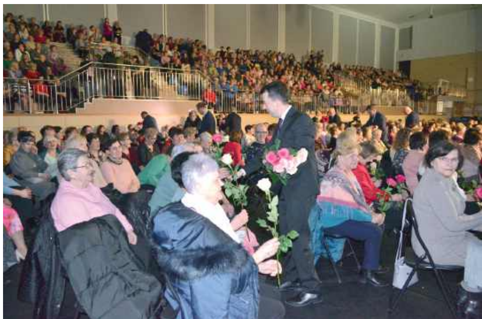
Ogromna hala sportowa Budowlanki wypełniona była po brzegi

Nie przesadzał starosta biłgorajski, gdy mówił, że na powiatowy Dzień Kobiet szykuje coś ekstra! Bo była niezła niespodzianka, gdy na scenie pojawił się znany aktor Jacek Borkowski, czyli serialowy Rafalski z serialu Klan.