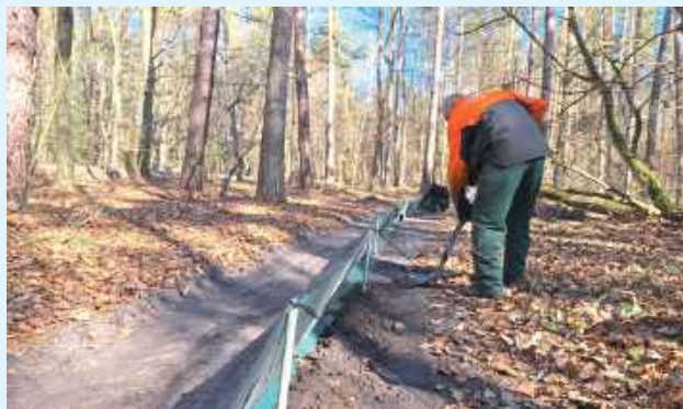
Przenośne bariery naprowadzające płazy, znów pojawiły się w Roztoczańskim Parku Narodowym

Specjalne bariery ochronne wyrastają w Roztoczańskim Parku Narodowym. - Żaby, ropuchy czy traszki nie mają szans w konfrontacji z rozpędzonym na asfalcie pojazdem mechanicznym, dlatego każdego roku wzdłuż ruchliwych dróg przecinających obszar Parku ustawiamy przenośne bariery naprowadzające - wyjaśniają pracownicy.