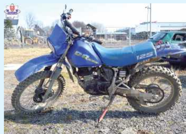
29-latek usłyszał zarzut kierowania motocyklem crossowym w stanie nietrzeźwości

Badanie wykazało w organizmie 29-latka prawie 3 promile. Mundurowi ustalili również, że zatrzymany nie posiada uprawnień do kierowania pojazdami. Stracił je wcześniej za jazdę w stanie nietrzeźwości. 29-latek posiadał też są-