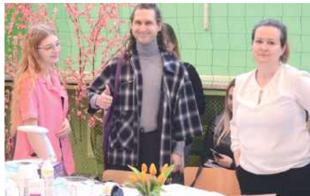
„Medyk” stanął na wysokości zadania przy organizacji wydarzenia