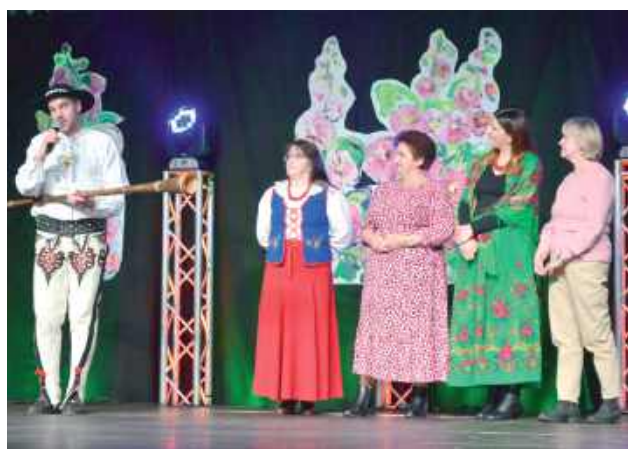
„Góral z Gwiazdami” zaprosił na scenę prawdziwe gwiazdy

- W wypełnionej po brzegi hali sportowej ZSBiO w Biłgoraju czekał na nasze Panie wyjątkowy program. Zaserwowaliśmy smakowity poczęstunek, aromatyczną kawę oraz szwedzki stół z przekąskami. A to nie wszystko! Uczestniczki mogły wysłuchać ciekawych prelekcji, a także cieszyć się koncertem zespołu „Przystań” z gminy Księżpól oraz niezapomnianym show kabaretowym