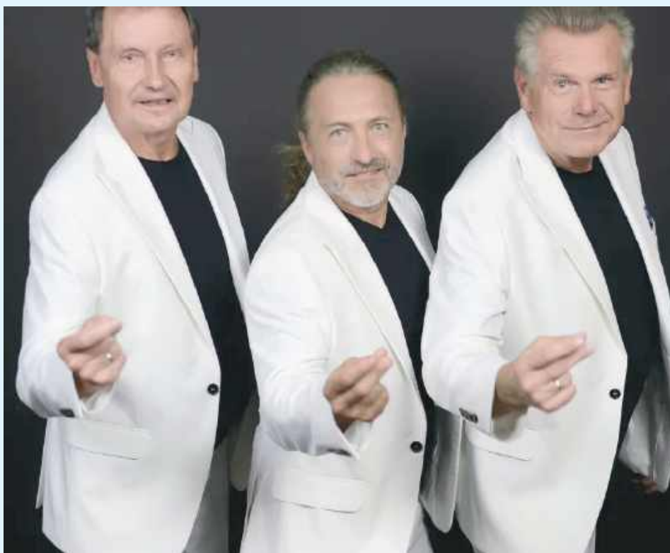
Zespół VOX kończy prace nad pierwszym od 28 lat albumem studyjnym

- Zamknęliśmy całkiem nową płytę, niestety bez Witka i jego charakterystycznego głosu. Oddajemy słuchaczom i dziennikarzom muzycznym tę płytę do całkowitej oceny, chcemy ostrej krytyki. Tam są