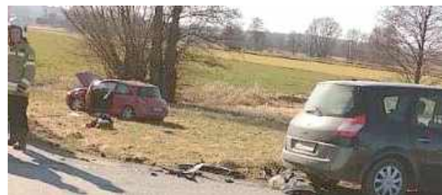
Kierujący samochodem Renault Scenic na skrzyżowaniu dróg nie ustąpił pierwszeństwa przejazdu i doprowadził do zderzenia boczno - czołowego z Renault Megane

Do niebezpiecznego zdarzenia doszło tuż po godzinie 13 na skrzyżowaniu w Czernięcinie w gminie Turobin. Pracujący na miejscu zdarzenia policjanci ustalili, że 53-letni mężczyzna, kierujący samochodem Renault Scenic na skrzyżowaniu dróg nie ustąpił pierwszeństwa przejazdu i doprowadził do zderzenia boczno - czołowego z Renault Megane, którym