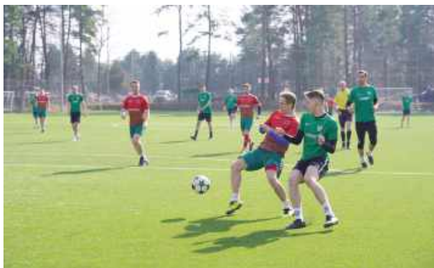
W sparingowym starciu sąsiadów w tabeli, wicelider Tanew przegrał z trzecim na półmetku sezonu w okręgówce Olimpiakosem 1:3