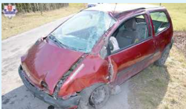
Kierowca Renault z wypadku wyszedł z niegroźnymi potłuczeniami i został wypisany do domu

Zarówno kierowca, jak i 74-letnia pasażerka trafili do szpitala. Po badaniach 71-latek został wypisany do domu,