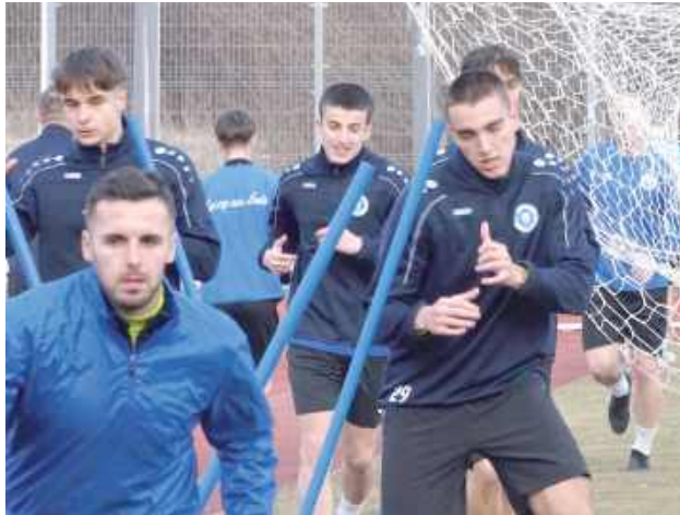
Piłkarzom Łady 1945 Biłgoraj zostały ostatnie treningi przed sobotnim meczem o ligowe punkty w Krasnystawie