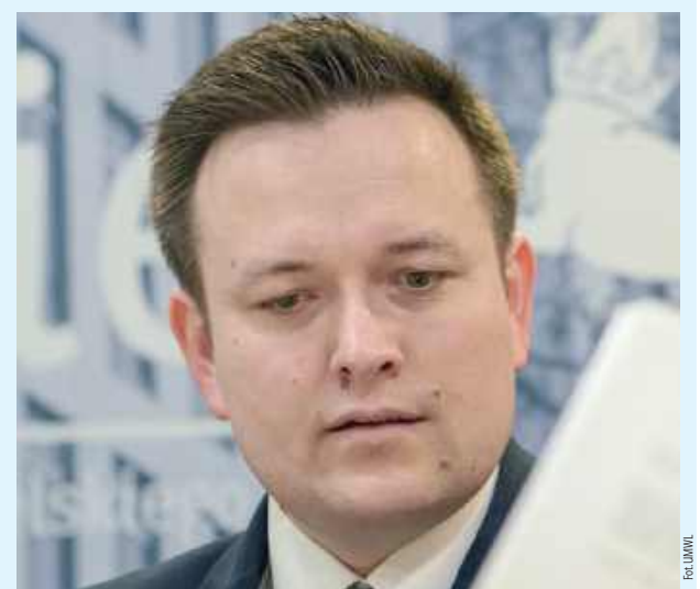
Wójt gminy Sułów przekazał część pensji na pokrycie kosztów inspektora nadzoru rewitalizacji kościoła w Tworczywie

- Dlatego informuję, że 1/10 swojego wynagrodzenia w miesiącu marcu przekazuję na pokrycie kosztów inspektora nadzoru na tej inwestycji. Zachęcam rów-