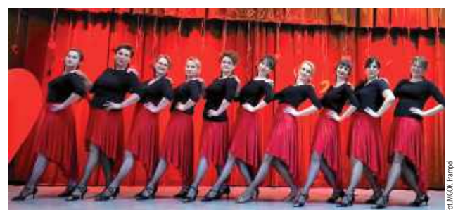
Niezawodne tancerki z Frampola jak zwykle pokazały klasę