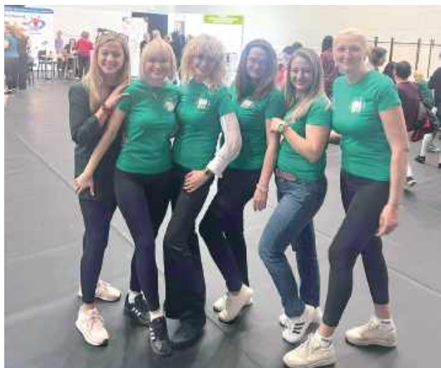
Na wydarzeniu dla kobiet nie mogło zabraknąć Biłgorajskiej Rady Kobiet