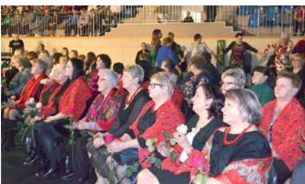
Wydarzenie cieszyło się ogromnym zainteresowaniem