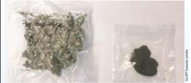
Została zatrzymana, a po przeprowadzonych czynnościach przekazana rodzinie

TOMASZÓW LUBELSKI: Policjanci zatrzymali 15-latkę, która miała przy sobie substancje odurzające. Jej kurtka była wypchana marihuaną i haszyszem.