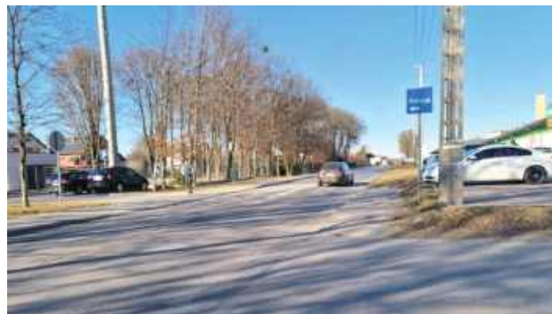
Przy ruchliwej drodze powiatowej w Turobinie znajduje się sklep, szkoła, posterunek policji. Nie ma natomiast przejścia dla pieszych