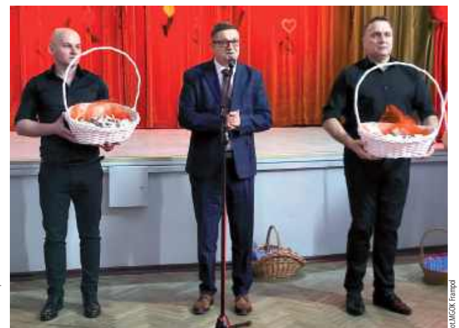
Burmistrz złożył życzenia wszystkim paniom