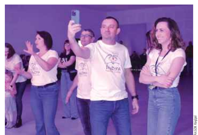
Z takiej imprezy trzeba mieć pamiątkowe zdjęcie