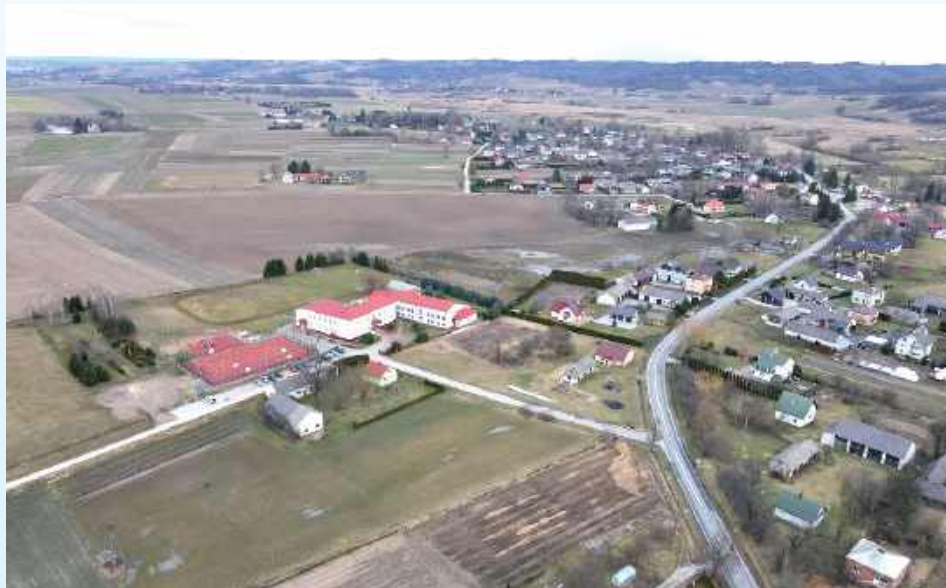
Prace przy budowie obwodnicy Gorajca rozpoczną się w drugim kwartale tego roku

Dla wykonawcy inwestycji uzyskanie decyzji ZRID oznacza możliwość rozpoczęcia realizacji inwestycji, po wcześniejszym przekazaniu placu budowy. Pierwsze prace w terenie rozpoczną się w II kwartale tego roku i polegać będą