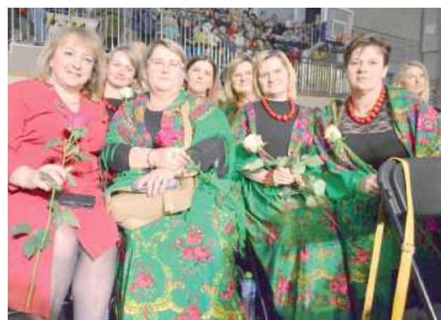
Wszystkie panie z uśmiechem na twarzy uczestniczyły w wydarzeniu. Bez wyjątku, również pani wicestarosta