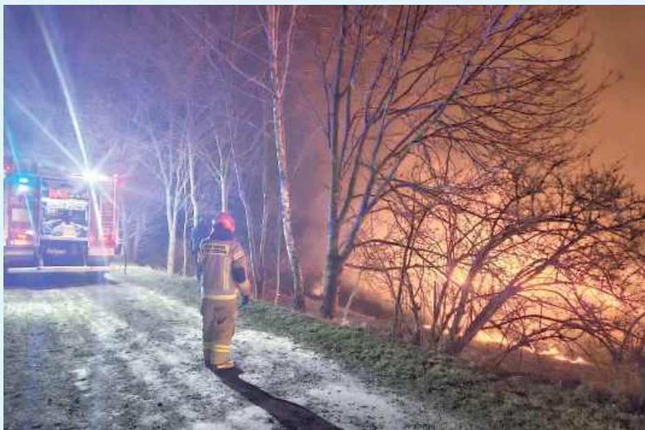
Od początku roku na terenie powiatu zamojskiego odnotowano 17 pożarów traw i nieużytków

Największy pożar miał miejsce w Sułówku, 23 lutego gdzie spłonęło 35 ha nieużytków, a przy akcji gaśniczej trwającej ponad