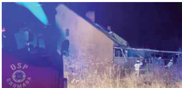
Na miejscu interweniowało sześć zastępów straży pożarnej

Płonęła wiata garażowa z samochodem i quadem. Ogień przetrząsnął się na poddasze budynku mieszkalnego. Na szczę-