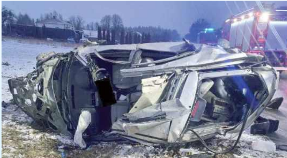
Kierowca miał blisko 1,5 promila w organizmie. Stracił panowanie nad pojazdem, w wyniku czego zjechał z drogi i przebił bariery ochronne, następnie wjechał w nasyp i dachował

- Ze wstępnych ustaleń policjantów wynika, że 34-letni mieszkaniec Tomaszowa Lubelskiego, jadąc Fordem w kierunku Bełża, stracił panowanie nad pojazdem, w wyniku czego zjechał z drogi i przebił bariery ochronne, następnie wjechał