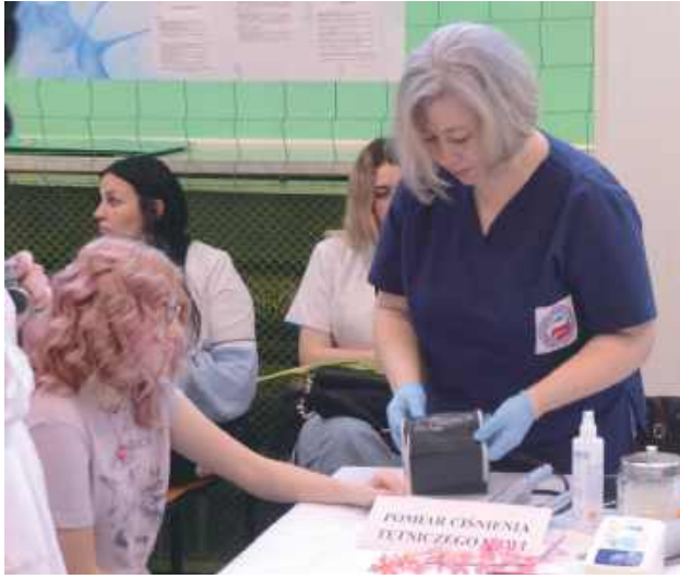
To, co kobiety lubią najbardziej, czyli zabiegi kosmetyczne