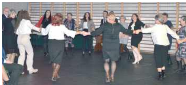
Jest impreza, muszą być tańce. Panie szybko porwały starostę w tany