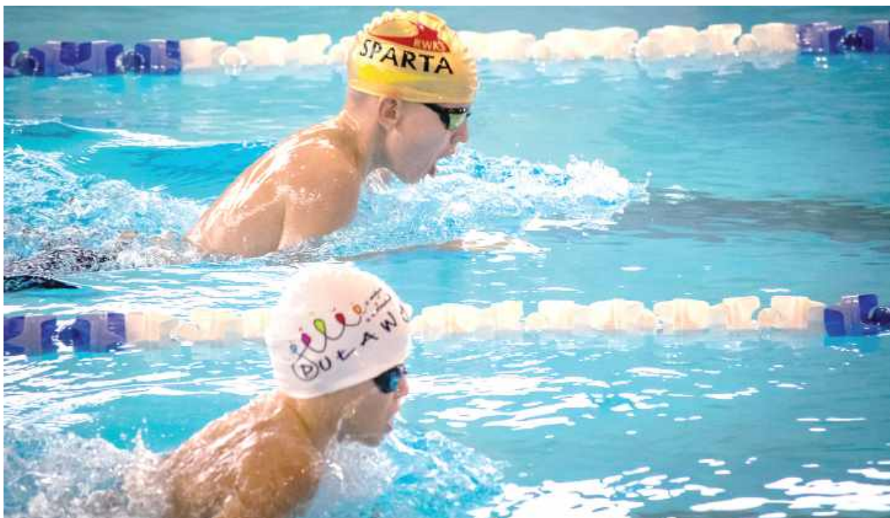
Czepeków z napisem RWKS Sparta może nie było w Lublinie za dużo, ale zdecydowanie liczy się jakość, a nie ilość!

- 1500 m st. dowolnym – 13-15 lat, 16-17 lat, OPEN (13 lat i starsi).