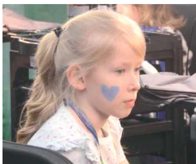
Najmłodsze uczestniczki wydarzenia również wyszły z imprezy zadowolone