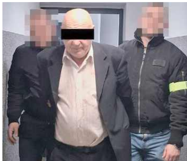
Kierowca, którym okazał się mieszkaniec Janowa Lubelskiego, został doprowadzony do Prokuratury, gdzie usłyszał zarzuty