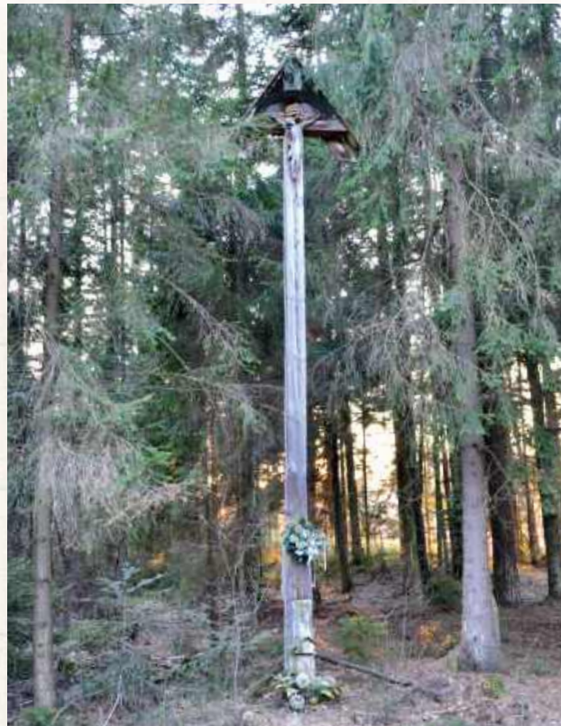
Krzyż z 1853-1856 r. W tym miejscu pierwotnie pochowano powstańców, później ich ciała zostały przeniesione na cmentarz do Huty Krzeszowskiej