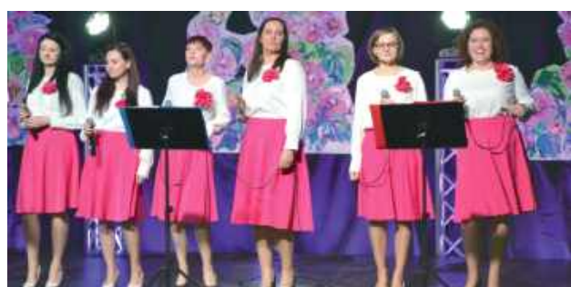
Na scenie wystąpił między innymi zespół „Przystań”