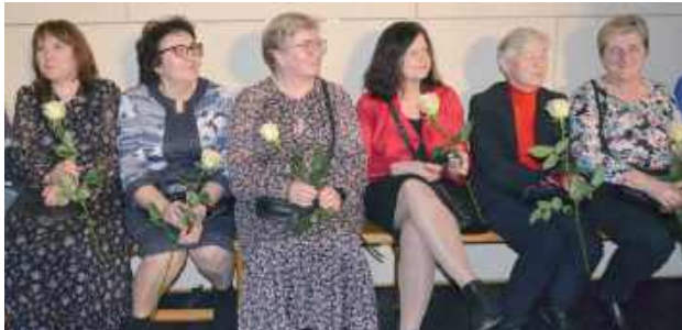
Wszystkie panie otrzymały kwiaty