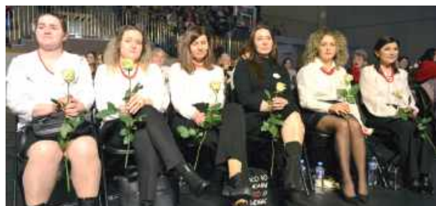
W wydarzeniu udział wzięły Koła Gospodyń Wiejskich z Ziemi Biłgorajskiej