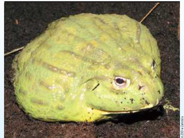
Nowy lokator zamojskiego ZOO to sporych rozmiarów żaba z Afryki

To nie jest pomyłka. Na zdjęciu byk. Żaba byk, czyli buczek południowoafrykański znany również jako żaba olbrzymia.