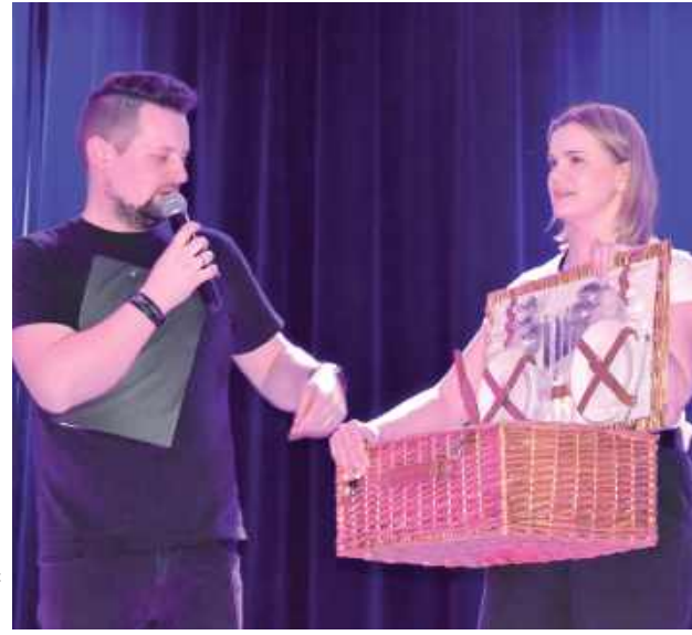
Podczas imprezy odbywały się liczne licytacje