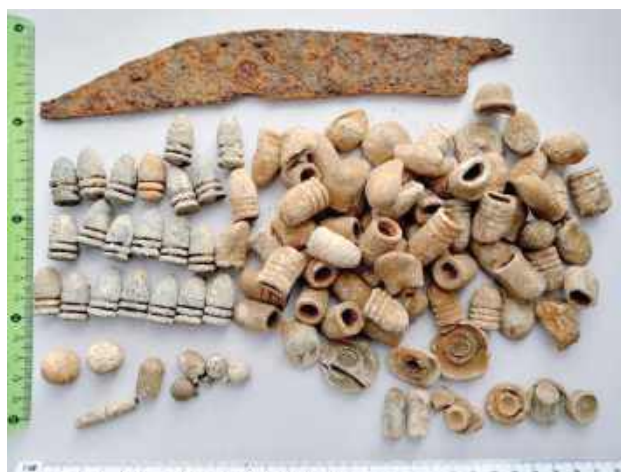
Podczas styczniowych poszukiwań na terenie Lasów Państwowych Nadleśnictwa Józefów w Długim Kącie, natrafili na skupisko 77 ołowianych pocisków i kul, rozrzuconych na powierzchni kilku arów w warstwie humusu leśnego

Podczas styczniowych poszukiwań na terenie Lasów Państwowych Nadleśnictwa Józefów w Długim Kącie, natrafili na skupisko 77 ołowianych pocisków i kul, rozrzu-