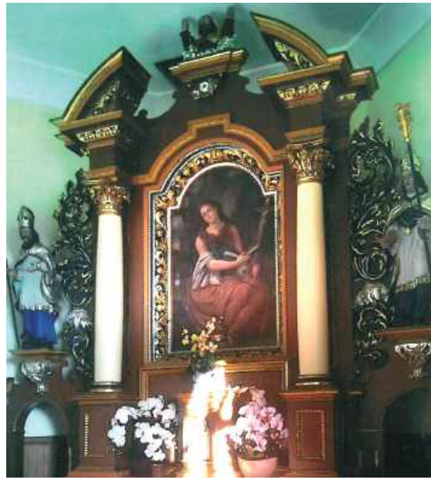
W 1743 r. kongregacja zakonna dokonała wpisu ówczesnej wiejskiej parafii w Puszczy Solskiej, będącej miejscem objawień, na listę sanktuariów jako miejsc z cudownym obrazem słynącym łaskami

16 września 1939 r. zabudowania kościelne zajmują Niemcy, walczą tu Armia Kraków, o czym przypomina tablica kamienna w świątyni. 28 września 1939 r. do Puszczy Solskiej wkraczają Sowietci na mocy paktu z Niemcami, IV rozbiór Polski. 4 października znowu wracają Niemcy, lokalizując przy klasztorze koszary wojskowe, a w klasztorze uruchamiają kino. W lipcu 1943 r. na placu kościelnym Niemcy organizują punkt zborny Polaków okolicznych miejscowości, aby następnie ich wywieźć do niemieckich obozów zagłady. Upamiętnia to obelisk kamienny z napisem na placu kościelnym, który wykonał w 2010 r. SKUMPN. W 1944 r. znowu wchodzi nowy okupant