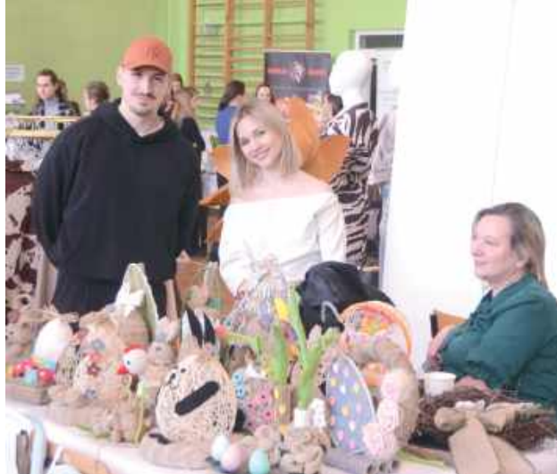
Piękne stoisko z rękodziełem