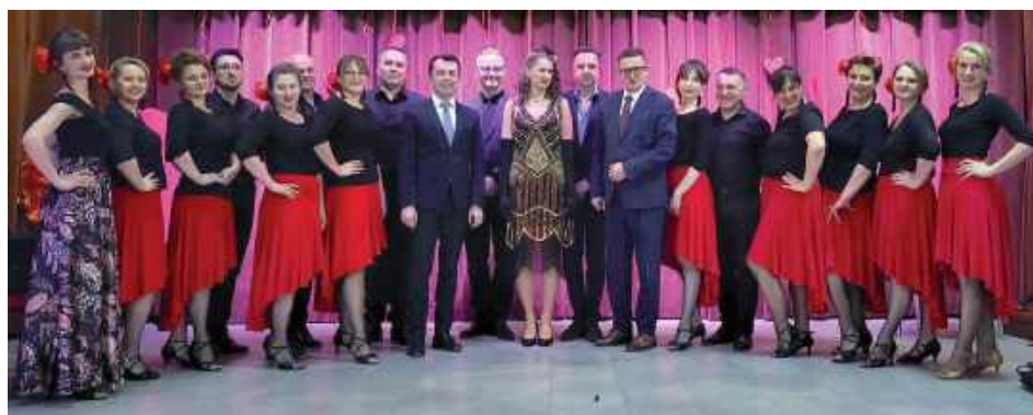
Pamiętkowe zdjęcie z Dnia Kobiet 2025 we Frampolu