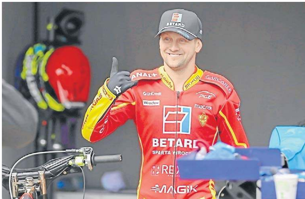
Artiom Łaguta w latach 2023-2025 był najskuteczniejszym żużlowcem Betard Sparty. Na początku sezonu 2026 potwierdza status lidera wrocławskiej drużyny

Łaguta w ubiegłym roku zajął trzecie miejsce na liście najskuteczniejszych żużlowców PGE Ekstraligi (osiągnął średnią 2,236 na bieg). W sezonie 2026 spisuje się jeszcze lepiej, legitymując się średnią 2,500 (wyższą ma jedynie Bartosz Zmarzlik z Orlen Oil Motoru Lublin).