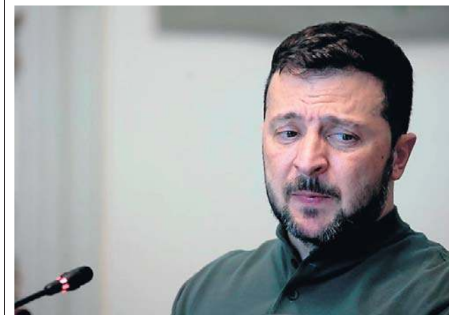
Prezydent Zełenski zaproponował podzielenie się doświadczeniem w walce z dronami

Ukraiński przywódca odwiedził w ciągu ostatnich dwóch miesięcy kilka państw Bliskiego Wschodu, w tym dwukrotnie Arabię Saudyjską, Zjednoczone Emiraty Arabskie, Katar czy Syrię. Zełenski informował wcześniej, że Ukraina rozpoczęła współpracę z państwami tej części świata, dzieląc się z nimi doświadczeniem w walce z irańskimi dronami. PAP