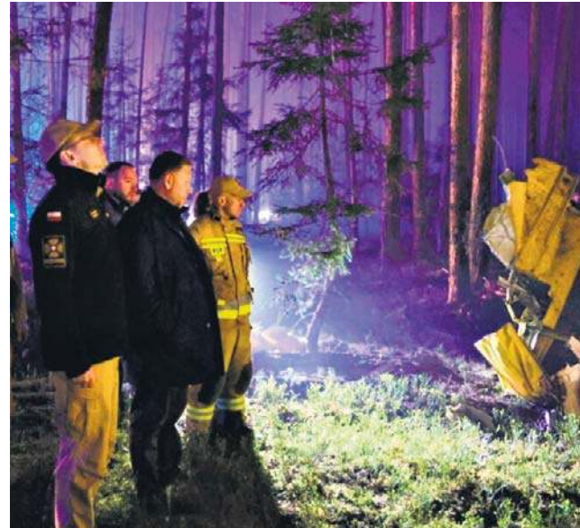
Podczas akcji gaśniczej w biłgorajskich lasach zginął pilot sterujący Dromaderem

W związku ze śmiercią pilota leśnicy, służby i przedstawiciele rządu, samorządów, premier i prezydent złożyli wyrazy współczucia rodzinie i najbliższym zmarłego.