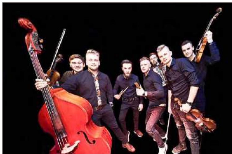
Grupa z Łącka wystąpi około godziny dwudziestej.