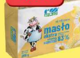
Masło wiejskie 200g Rolmlec