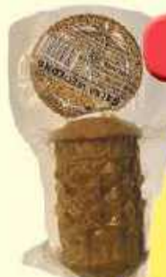
Mała gałka wędzona 180g Balsar