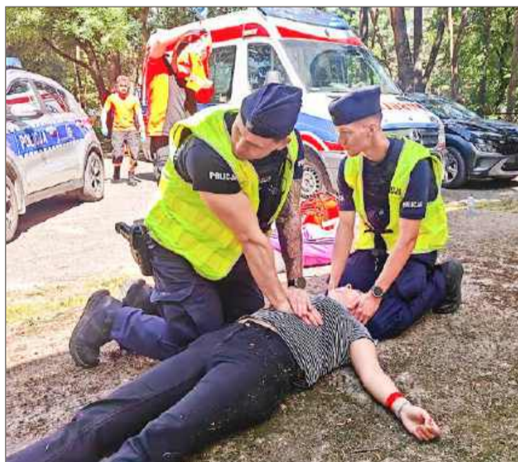
W akcji uczestniczyło kilkunastu pozorantów.

- Takie działania są potrzebne, aby sprawdzić, jak ta współpraca wygląda w sytuacjach kryzysowych