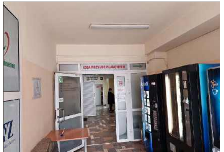
Na dodatkowe usługi po aneksie w szpitalu w Dębicy nie ma co liczyć.