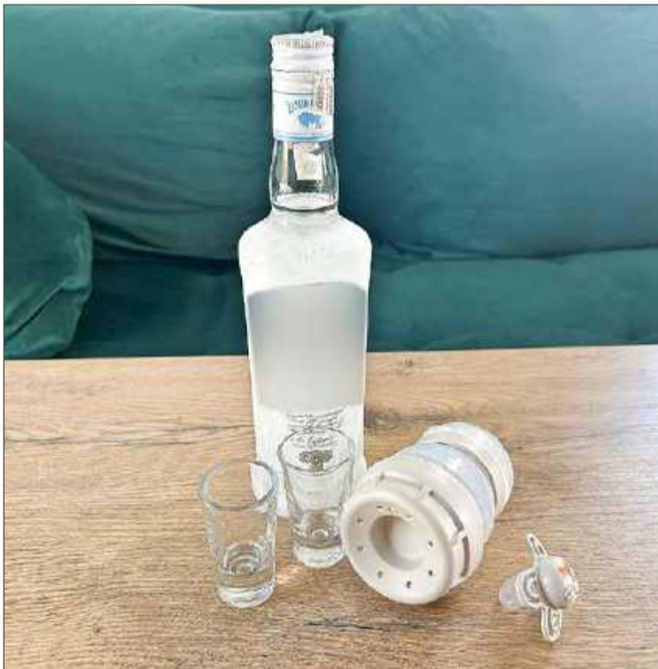
Zamiast opiekować się dzieckiem, matka piła przez dwa dni.

Drugiego dnia pobytu pary w hotelu, obsługa została poinformowana, że zakłóca spokój innym gościom hotelu. Z ich pokoju dochodziły odgłosy głośnej imprezy. Na miejsce wezwana została policja. Funkcjonariusze zastali wstrząsający widok.