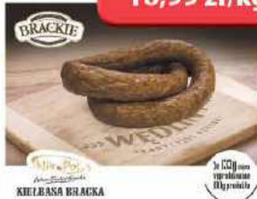
Kiełbasa Bracka Nik Pol