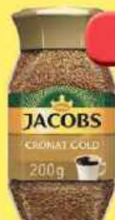
Kawa Jacobs Cronat Gold 200g