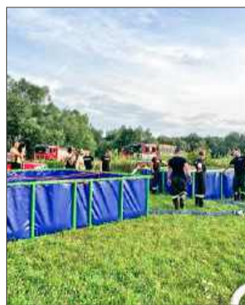
Strażacy doskonalili umiejętności.