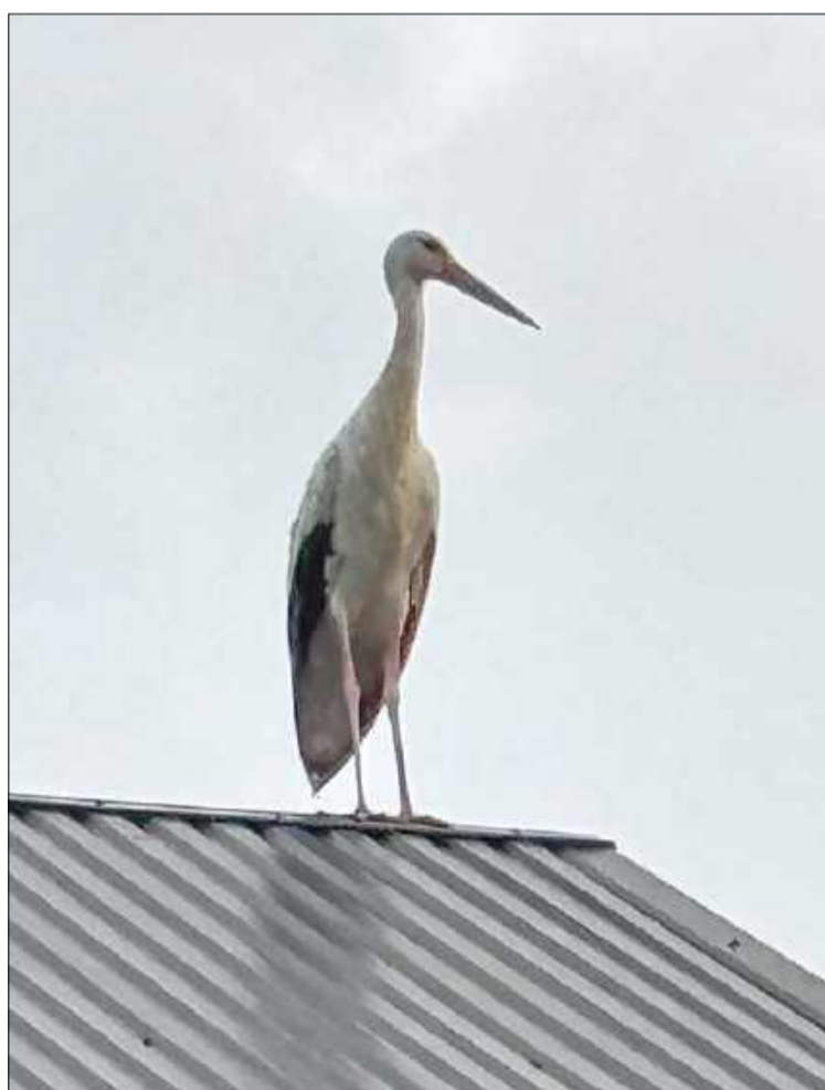
Kogo by tu obdarować?