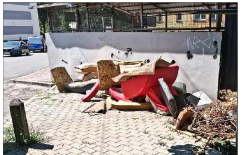
Pozostałości po dzikim lokatorze mają zniknąć w tym tygodniu.

Jak mówi Łukasz Paluch również te obawy powinny niebawem zniknąć, a wiata będzie zamknięta.