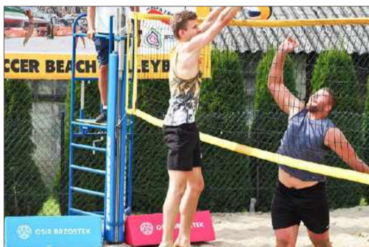
Takich pojedynków na siatce w tych zawodach nie brakowało.