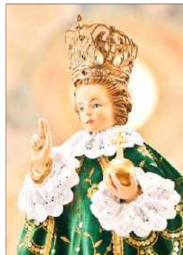
Jodłowskie Dzieciątka Jezus.