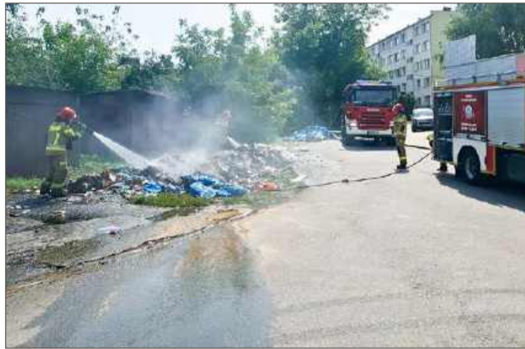
Ustalenie sprawcy tego pożaru jest praktycznie niemożliwe.