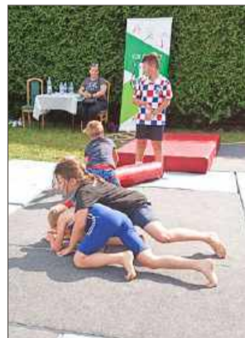
Czy zapaśnicy Wisłoki będą mieć lepsze warunki do trenowania?

Jak udało nam się nieoficjalnie dowiedzieć, to nie jedyne plany