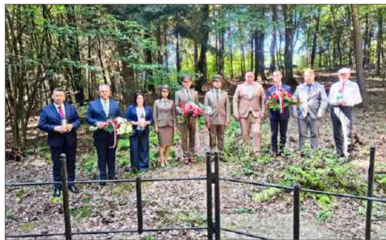
Samorządowcy oraz przedstawiciele Lasów Państwowych ustalili, że będą się tam spotykać co roku 12 sierpnia o godz. 11.

Spędzono ich wtedy na rynek w Jodłowej. Zdolnych do poruszenia się o własnych siłach pognało około 2 km do lasu, a chorych i starców zawieziono tam furmankami. Dzięki pomocy mieszkańców Jodłowej uratowało się łącznie