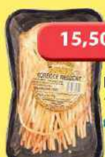
Korboce wędzone 190g Balsar