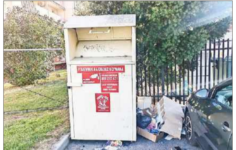
Tych kontenerów nie będzie wkrótce w mieście. Ani w całej Polsce.

Czy w Dębicy też się takie pojawią? Na razie na pewno nie, bo jak dotąd nie pojawiła się taka konieczność. Ale jeśli do Ratusza docierają będą informacje o stertach ubrań w śmietnikach, zakup pojemni-