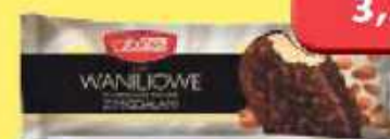
Lody waniliowe z migdałami 100 g Spółem