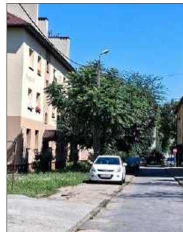
Mieszkańcy w końcu doczekają się obiecanych remontów.

Dodaje, że wszystkie roboty będą prowadzone w uzgodnieniu z prezesem Administracji Dómów Mieszkalnych Łukaszem Paluchem, gdyż on najlepiej zna potrzeby poszczególnych współ-