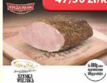
Szynka wiejska Nik Pol