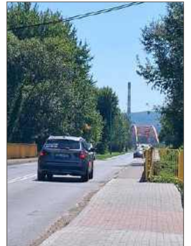
Most na Grabiniance będzie szerszy.

Ponad 3,5 mln zł kosztować będą roboty na drodze powiatowej w Straszęcinie.