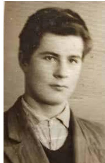
Zdjęcie z nowogardzkiej szkoły

ację i wybierał najbardziej bezpieczną. Uważał, że wybór musi być trafny. W przeciwnym razie jego skutki mogą być fatalne. Spokój ducha w czasach w których żyjemy, w tym ciągłym pośpiechu osiągał nie tylko poprzez kontakt z naturą. Już jako uczeń szkoły podstawowej posiadał małe radio przy użyciu którego słuchał Mszy Świętej nadawanej z Londynu. Zwykle czynił to na strychu, gdyż tam nikt mu nie przeszkadzał ani nie zakłócał. W późniejszym czasie słuchał niedzielnych Mszy Świętych z kościoła w Polsce. Czynił tak przez całe swoje długie życie, a żył osiemdziesiąt lat. Kierował się powiedzeniem naszej mamy – „Próżne wstawanie o północy bez bożej pomocy”. Uważam, że wciąż jest mało