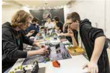
Sobota z Hobby

do rozmów, zdobycia autografu czy zrobienia pamiątkowego zdjęcia.