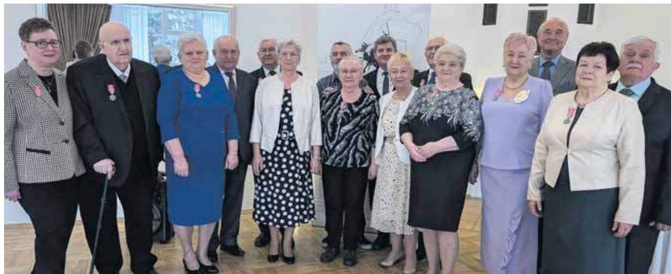
Złote pary z Miasteczka Śląskiego