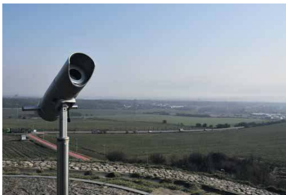
Wkrótce widok z Kopca Wyzwolenia może być całkiem inny