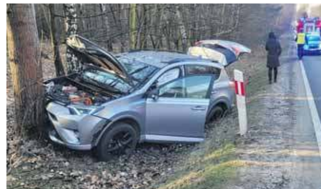
Mężczyzna źle się poczuł