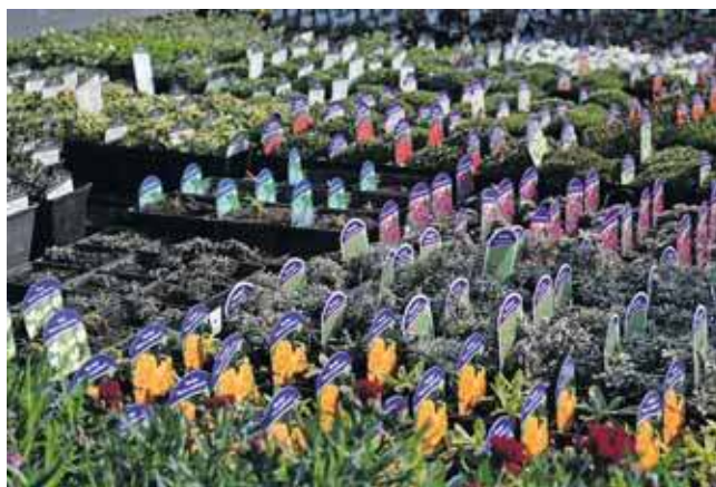
Już czas na zakupy