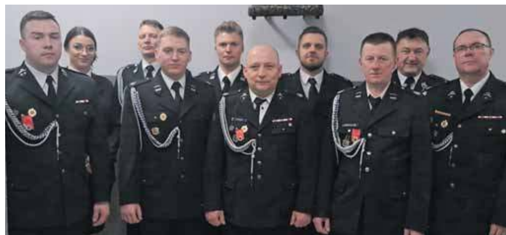
OSP w Nakle Śląskim miała walne zebranie sprawozdawczo-wyborcze

– Dziękujemy wszystkim druhom i druhnom za ich zaangażowanie w działalność na rzecz naszej OSP, gratulujemy wszystkim odznaczonym oraz życzymy wytrwałości i pomysłowości nowym władzom OSP – czytamy w mediach społecznościowych OSP w Nakle Śląskim. (ESP)