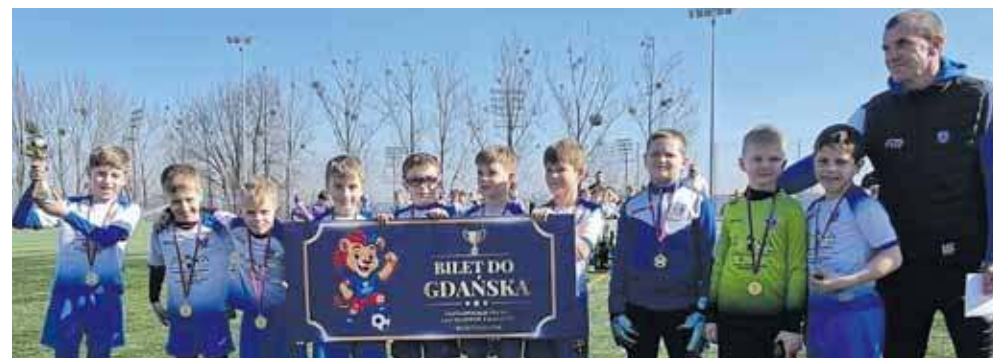
Zwycięstwo w lidze oznacza awans do ogólnopolskich finałów, które odbędą się między 18 a 21 czerwca w Gdańsku