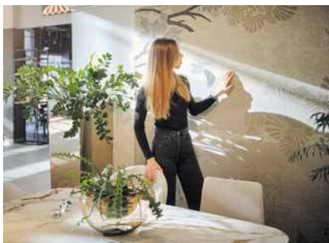
Od czego zacząć urządzenie mieszkania? Pytanie trzeba sobie zadać zanim pojawimy się w salonie meblowym

– To przestrzeń ma dopasować się do nas, a nie odwrotnie. Wielofunkcyjność staje się standardem, nie ekstrawagancją. Meble transformują się, strefy przenikają, a salon bywa jednocześnie miejscem pracy, relaksu i rodzinnych spotkań. Wysokiej klasy projektowanie opiera się dziś na elastyczności, w której wspierają ją takie elementy jak stoły z funkcją rozkładania, zabudowy modułowe, czy sprytne systemy