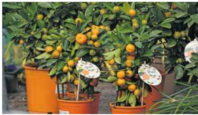
Nie zawsze sobie radzimy z uprawą roślin tropikalnych

Przykładem roślin do „zadań specjalnych” są kwitnące zimą ciemierniki, marmocowe derzenie czy aromatyczne oczary. Choć latem są mało