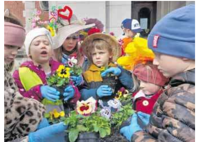
Sadzenie bratków w parku w Świerkłańcu

animacji i zabaw dla dzieci, uczniów szkół i przedszkolaków, którzy licznie przyszli na rynek. Były m.in. tańce, twister, tor przeszkód, bańki mydlane, o strażackim sprzęcie i pracy mówili drухowie i drухny z OSP Pniowiec.