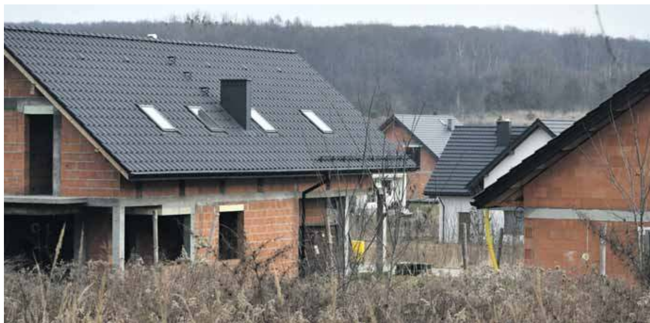
Radzionków, a szczególnie okolice Księżej Góry zabudowują się na potęgę. Tutaj chętnie wchodzi deweloperzy

Według danych udostępnionych przez Starostwo Powiatowe w Tarnowskich Górach w 2025 roku największą aktywność w zakresie budownictwa mieszkaniowego jednorodzinnego odnotowano w Tarnowskich Górach, najbardziej pożądane lokalizacje to: Stare Tarnowice, Opatowice, Repty Śląskie i Rybna. W mieście wydano 155 pozwoleń na budowę, a zrealizowano aż 224 budynki.