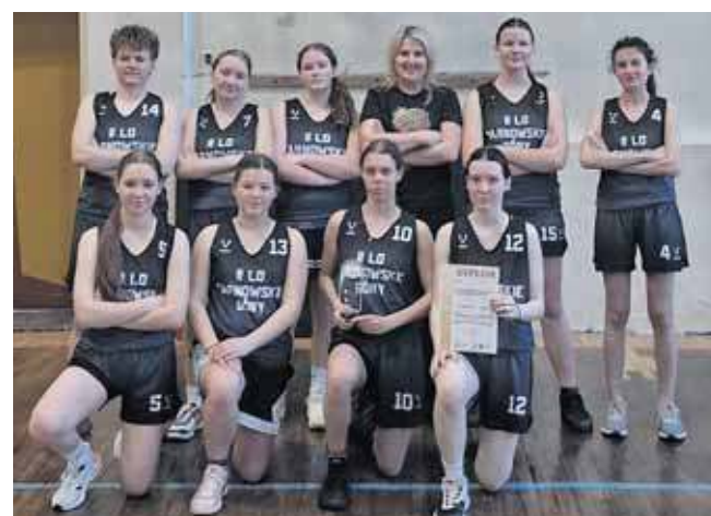
Koszykarki ze Staszica

Ich koledzy nie pozostali w tyle i także wygrali walkę o półfinał rozgrywek wojewódzkich. Zaczęło się jednak od zwycięstwa na etapie powiatowym. Staszic pokonał m.in. drużynę z Zespołu Szkół Chemiczno-Medyc-