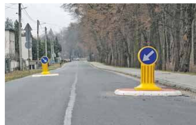
Na ul. Dzierżona i Powstańców w Nakle Śląskim pojawiły się szykany

– Bezpieczeństwo mieszkańców to dla nas priorytet. Rozumiem, że kwota może budzić pytania, dlatego warto doprecyzować, że nie chodzi o „postawienie kilku znaków”, ale o kompletne wykonanie dwóch szykan w dwóch lokalizacjach, wraz