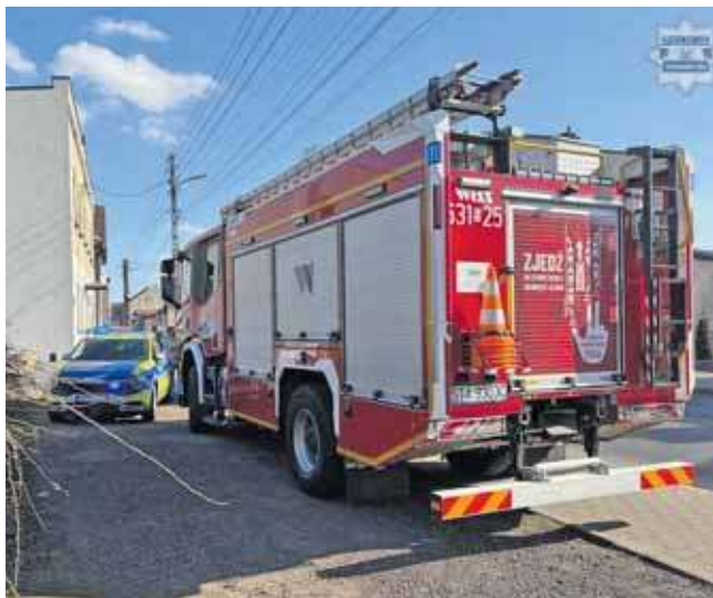
Do wybuchu doszło podczas wymiany butli z gazem

Jak informują strażacy z komendy PSP w Tarnow-