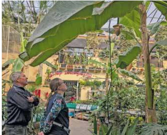
Polacy lubią rośliny egzotyczne. Nie brakuje ich w Ogrodzie Śląskim. Na zdjęciu nasi rozmówcy pod bananowcem

efektowne, to właśnie one wypełniają luki w kalendarzu. Jeśli zadamy o różnorod-