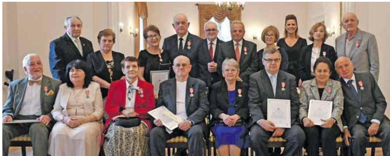
Osiem par z Tarnowskich Gór świętowało zacne rocznice ślubu

– To wzruszające spotkanie, pełne wspomnień. Dla nas to zaszczyt być dziś z wami. Pokazujecie historię codziennego budowania rodziny, pokonywania trudności i dzielenia się radością – mówiła kierow-