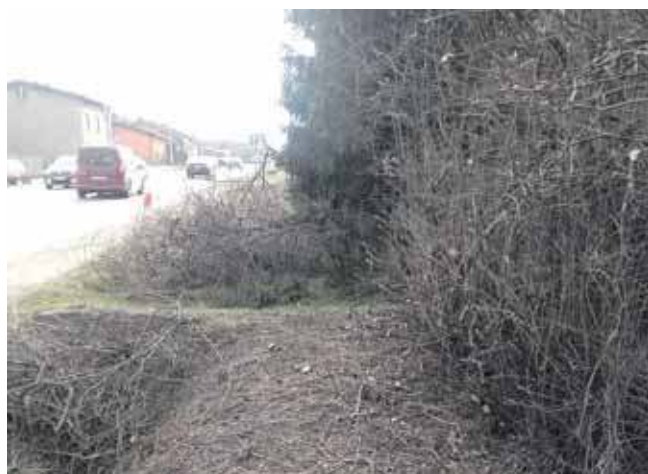
GDDKiA mówi o pielęgnacji, czytelniczka – o dewastacji

Mówi, że tak właśnie powinno być, skracanie, a nie