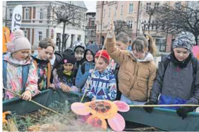
Na rynku w Tarnowskich Górach topiono marzanny