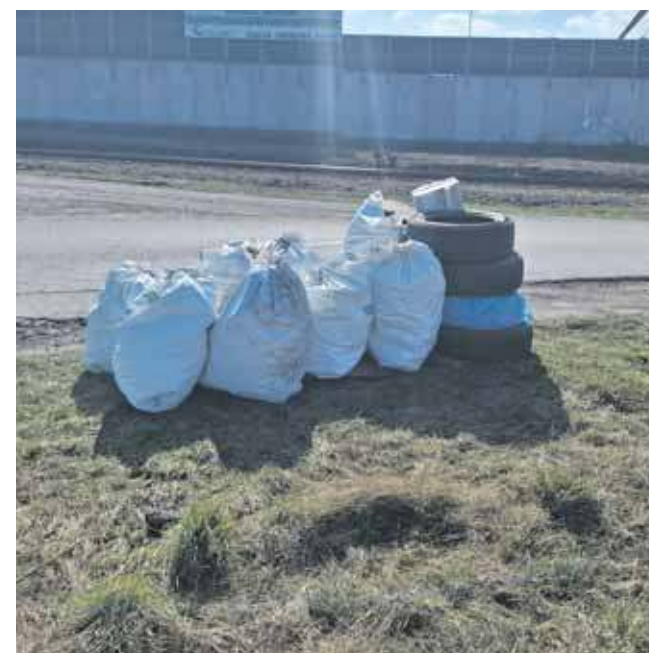
Przy ul. Kolejowej w Sowicach ktoś wyrzucił odpady. Jak tak można?