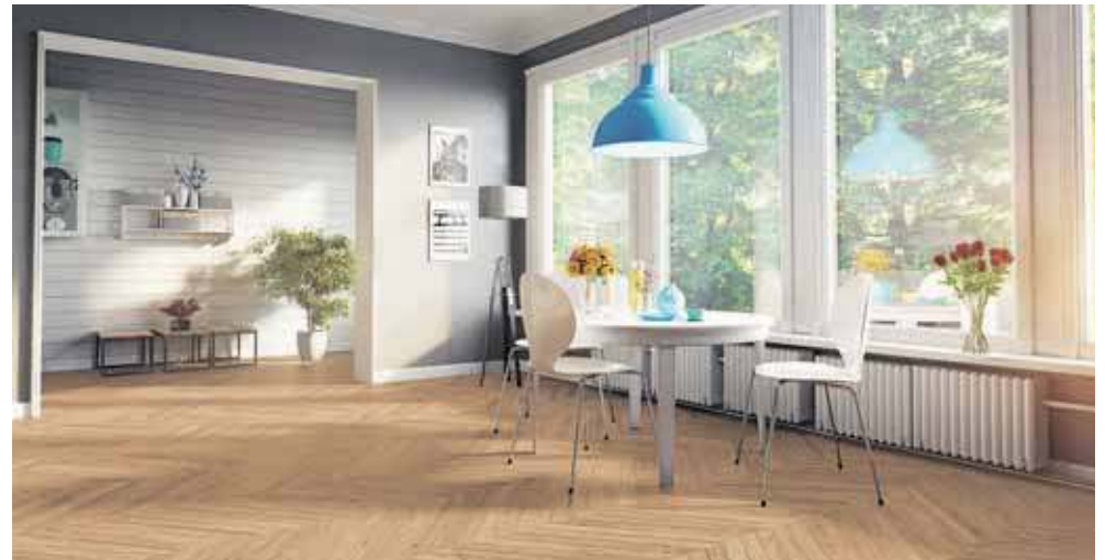
Drewniana podłoga w salonie daje możliwości ukształtowania stylu wnętrza od klasycznego aż do nowoczesnego

dużych powierzchniach podłóg, uwzględniając nawet np. sale sportowe. Taki sposób optycznie pomniejsza przestrzeń i tworzy ją bardziej przytulną. W małych i średnich pomieszczeniach lepiej skłaniać się do układania desek w powtarzalne i proste wzory jak „na przesuniętą cegielkę” lub „na jodełkę”. Taki wzór ułożony na podłodze będzie uniwersalny i nie będzie optycznie przeszkadzało, jeśli