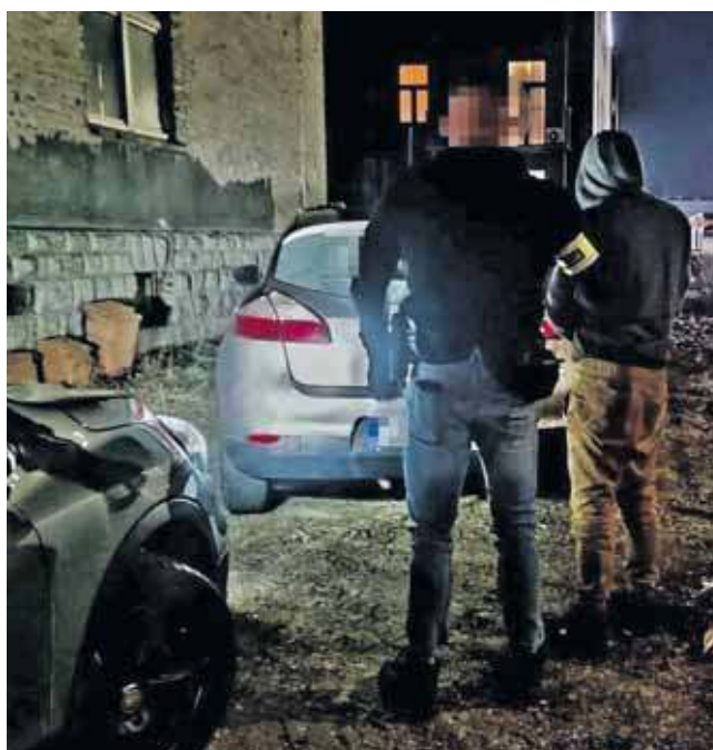
Policyjny narkotest wykazał, że kierowca znajduje się pod wpływem środków odurzających

Teraz sprawą zajmie się sąd. 34-letniemu taksówkarzowi grozi kara do 3 lat pozbawienia wolności. (MIR)