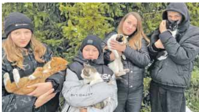
Można pomóc rodzinie z gminy Ożarówice