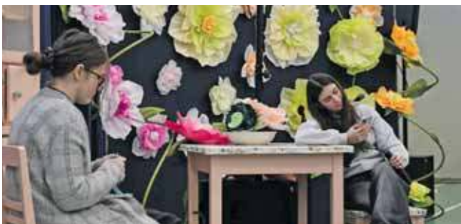
Smartfon jeszcze w rękach wnuczki, ale za moment przejmie go babcia