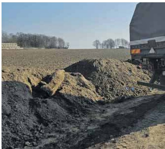
Bomba na budowie

Na miejsce skierowano mundurowych oraz policyjnego pirotechnika. Specjalista potwierdził obawy – zna-