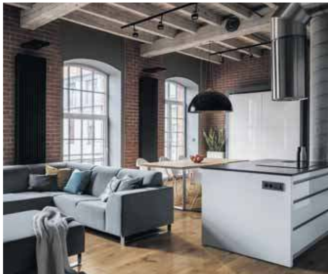
Drewno daje bardzo duże możliwości aranżacyjne

Poza niekwestionowanymi walorami estetycznymi i komfortem użytkowania, drewniane podłogi dają bar-