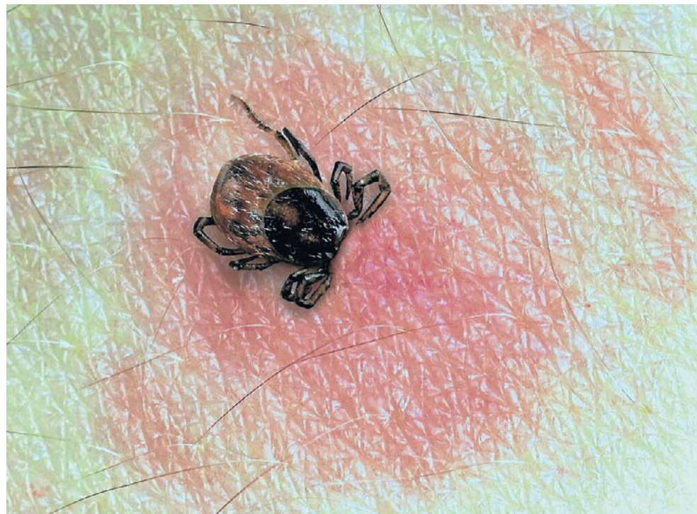
Obecnie największe skupiska kleszczy występują w środkowej i południowej Polsce

Co ważne - brak oznaczenia na mapie nie oznacza, że dane