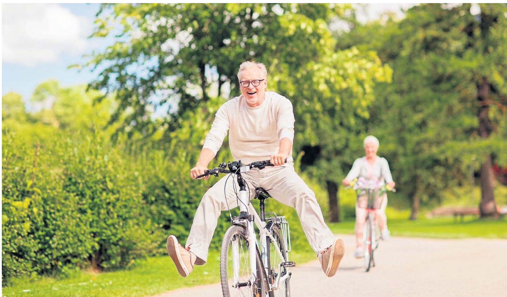
Jazda na rowerze to przyjemna forma spędzania wolnego czasu, środek transportu, ale też dobre ćwiczenie angażujące wiele mięśni i narządów

● Nie obciąża stawów - jazda na rowerze to umiarkowana dawka ruchu, która nie obciąża stawów w tak dużym stopniu jak chociażby bieganie czy fitness. Przejazdka rowerowa zmniejsza ryzyko urazów mięśniowo-szkieletowych. Dzięki temu rower jest wskazany dla kobiet w ciąży