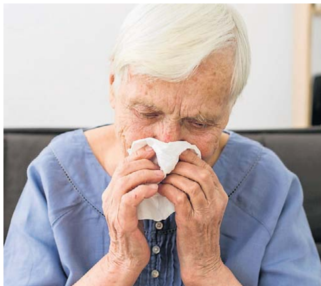
Seniorzy są narażeni na tzw. polisensytyzację – uczulenie na wiele różnych alergenów jednocześnie