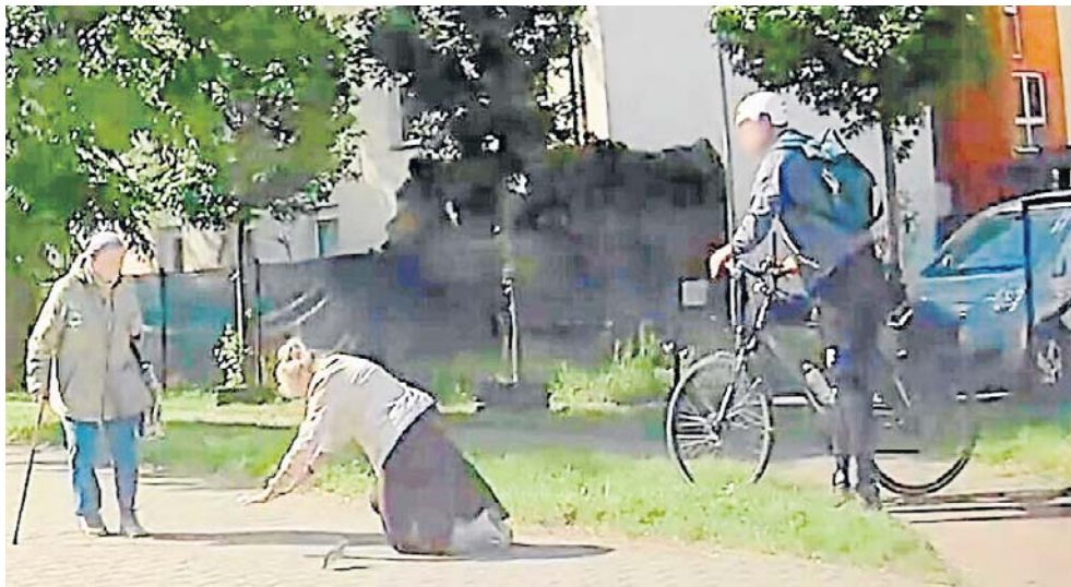
Agresywny rowerzysta z Wrocławia został zidentyfikowany m.in. dzięki nagraniu z samochodowego wideorejestratora na miejscu zdarzenia

Jak poinformowała podkom. Aleksandra Freus z Komendy Miejskiej Policji we Wrocławiu, funkcjonariusze