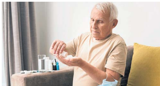
W przypadku leczenia alergii u osób starszych kluczowym elementem jest immunoterapia alergenowa (odczulanie)

Przyczyny tej zmiany mogą być związane z rosnącą liczbą czynników środowiskowych oraz urbanizacją, co skutkuje zanieczyszczeniem powietrza. Wysoko rozwinięte kraje oraz środowiska miejskie częściej odnotowują przypadki alergii. Wiąże się to z ilością toksyn i alergenów w powietrzu oraz wpływem zmian klimatycznych. Urbanizacja i długotrwała ekspozycja na alergeny mogą prowadzić do rozwoju alergii w późniejszym wieku. Ryzyko jest nie tylko dzie-