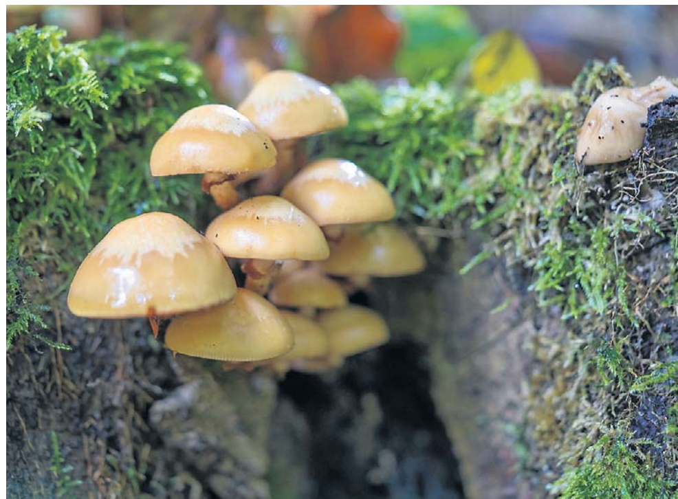
Łuskwiak zmienny to grzyb, który występuje w maju w polskich lasach. Mimo że wiele osób wciąż podchodzi do niego z dystansem, bardziej wprawieni zbieracze przekonują, że to prawdziwy rarytas

U młodych grzybów ma on wyraźny wypukły kształt, ale