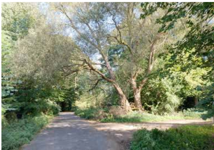
Drzewo stanowiące zagrożenie dla mieszkańców przy ul. Kościuszki cały czas czeka na wycinkę

W planie, jak wynika z załączoną do postępowania mapą, jest również wycięcie drzewa stanowiącego zagrożenie dla