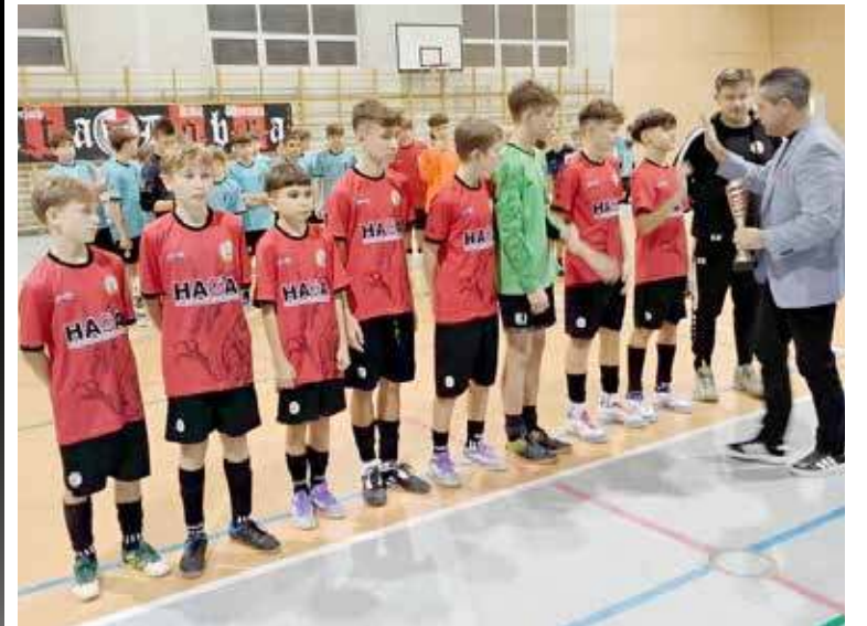
Gratulacje dla zespołu od burmistrza gminy Dobra