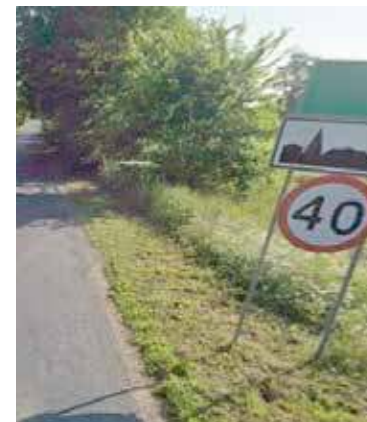
Kulice na inwestycję czekają już bardzo długo

Biorąc pod uwagę zapisy budżetu na 2026 rok, w gminie Nowogard skupiono się na edukacji i infrastrukturze szkolnej. Planowane wydatki majątkowe to: opracowanie dokumentacji technicznej na termomodernizację Zespołu Szkół nr 1 w Nowogardzie – 150 000 zł, opracowanie dokumentacji technicznej na termomodernizację Specjalnego Ośrodka Szkolno-Wychowawczego (SOSW) w Nowogardzie – 150 000 zł, czy też program „Nowe kwalifikacje” – kompleksowe wsparcie uczniów i nauczycieli szkół zawodowych