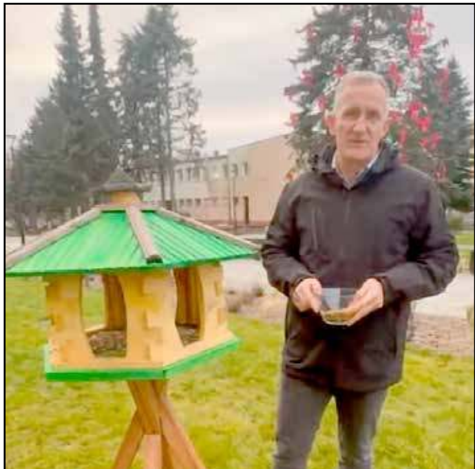
„Złote serce” przy karmniku

„dobroci” na pokaz (ze względu na takt i na szacunek dla „obdarowanych” nie będą przypominał wielu podobnych filmików) będą miały wartość nie złota, lecz pospolitego tombaku - i wydaje mi się, że jestem bardzo oględnym, używając tylko takiej subtelnej