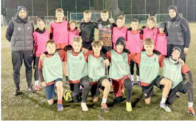
Zajęcia odbyły się na stadionie w Nowogardzie

- Nasi zawodnicy spisali się znakomicie i pokazali wysoki poziom zaangażowania oraz umiejętności. Jesteśmy z nich bardzo dumni! Podziękowania: