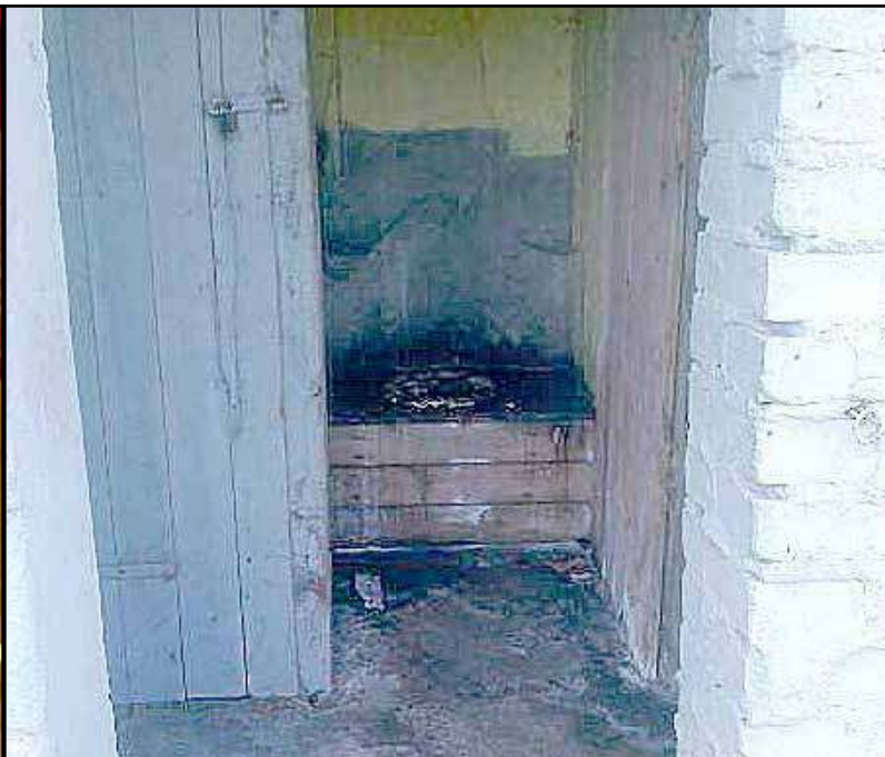
Tutaj zagląda tylko starsza Pani i wiatr, a nie Wiatr