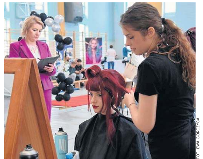
Uczniowie pokazali sztukę sztuki fryzjerskiej, umiejętność czesania fryzury dostosowanej do kształtu twarzy