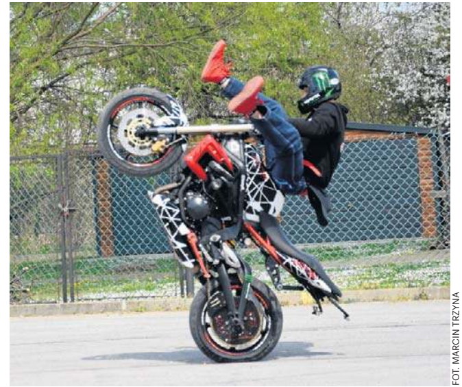
DYNÓW. XI Wiosna Motocyklowa w Dynowie. Tłumy, ryk silników i widowiskowe pokazy zachwyciły publiczność