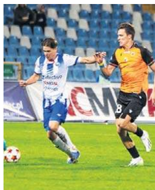
Chrobry po raz drugi w tym sezonie ograł Stal