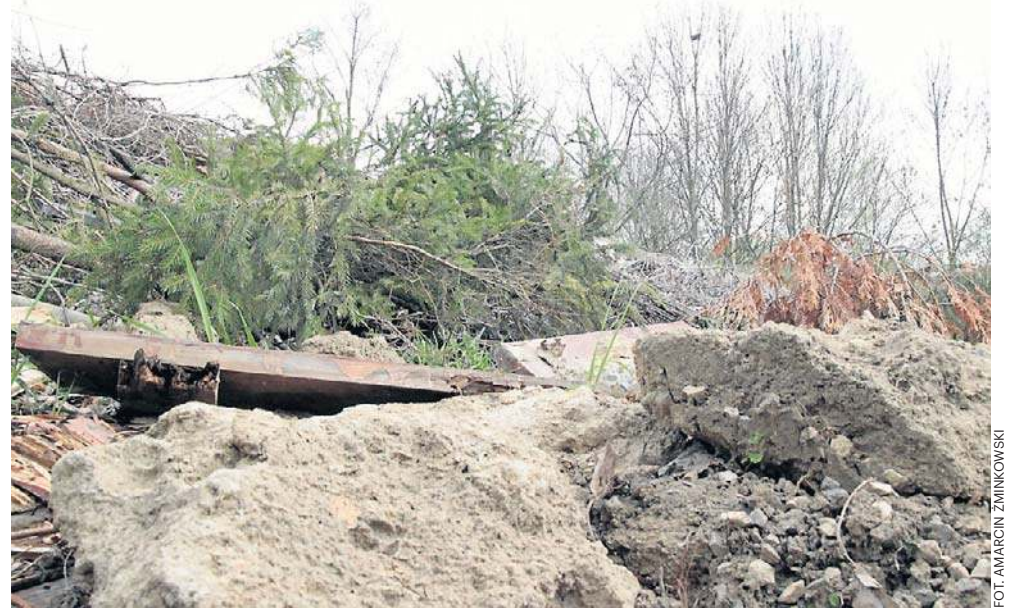
Ktoś na stosie gałęzi w pobliżu cmentarza Wilkowyja zrobił dzikie wysypisko śmieci. Na szczęście mieszkańcy szybko zareagowali i zawiadomili Nowiny

Na miejscu jest spora ilość odpadów zielonych i gałęzi. Jednak to nie one stanowią problem, ale porzucone w pobliżu odpady z gospodarstwa