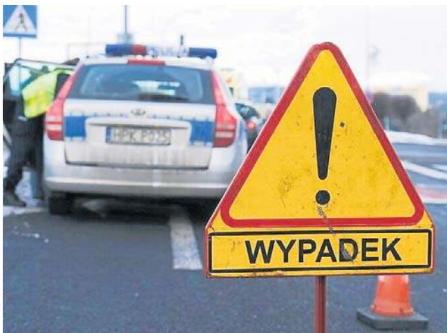
Do tragicznego zdarzenia doszło w Paszowej podczas wyprzedzania trzech rowerzystów.