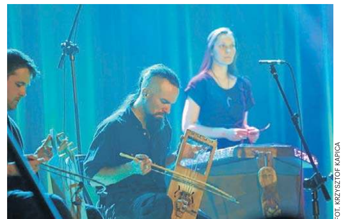
RZESZÓW. W ramach wydarzenia Etno-Wiosna w WDK zagrała grupa Daj Ognia