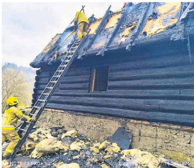
Pożar wybuchł rano rano w baczówce Jaworzec. Ogień objął część budynku w sąsiedztwie schroniska.

- To jednak prawda. Spłonęła „Betlejemka”. Dziękuję wszystkim służbom za pomoc: Straży Pożarnej, GOPR, Służbie Medycznej, Policji. Dziękuję za dziesiątki telefonów i SMS. Dziękuję. Przepraszam za nieodebrane telefony. Brak siły momentami. Brat już w baczówce, regeneruje się. Co ja? Ja siedząc pod gwiazdami szukałem sensu moich działań. Odpowiedzi na pytanie, czy mam jeszcze siły? Wróciłem do źródeł. Przespałem może dwie godziny dzisiejszej nocy - wyjaśnia w bardzo osobistym wpi-