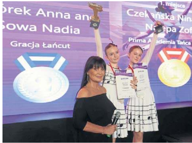
ŁAŃCUT. Iwona Pavlović, jurorka programu „Taniec z Gwiazdami”, poprowadziła ogólnopolski turniej tańca