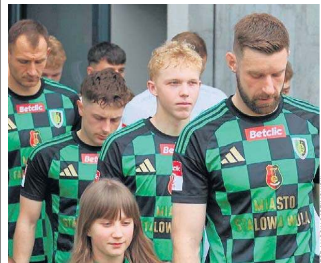
Zespół Stali Stalowa Wola szykuje się dla siebie nerwową końcówkę sezonu. Będzie walka o utrzymanie