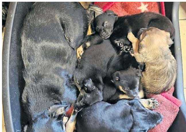
Psiaki urodziły się w koszmarnych warunkach, przebywają teraz w schronisku w Lesku i szukają domu

Numer konta Fundacji Wesoły Kundelek Dopisek: „Akcja” 37 8642 1012 2003 1218 5504 0001