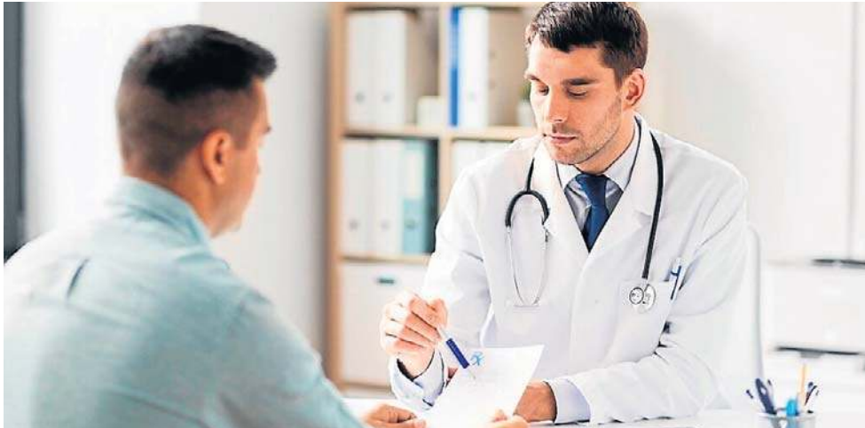
Nieleczona choroba kory nadnerczy kończy się śmiercią

Przewlekłe osłabienie, bóle brzucha, spadek masy ciała, brak apetytu, głód soli, mniejsza tolerancja na wysiłek fizyczny - objawy, które można przypisać wielu powszechnie występującym dolegliwo-