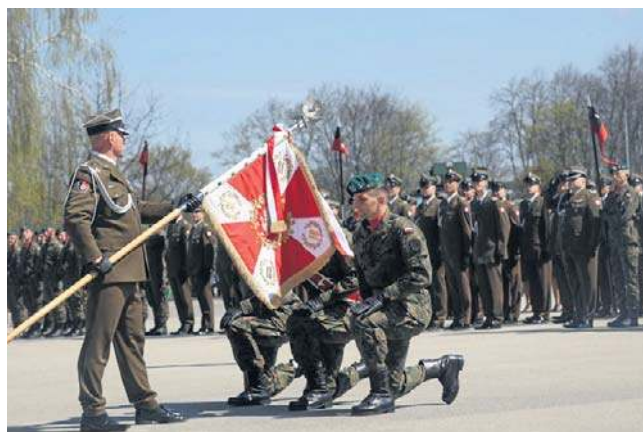
NISKO. Podczas uroczystego 18. Pułk Saperów otrzymał sztandar. Była msza, defilada i piknik dla najmłodszych