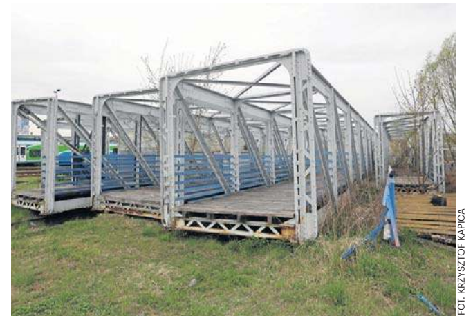
Rozmontowana dawna kładka z dworca PKP w Rzeszowie. Kiedyś była cudem techniki

Zdemontowane części kładki leżą na terenie dworca PKP Rzeszów Główny. Był pomysł, aby