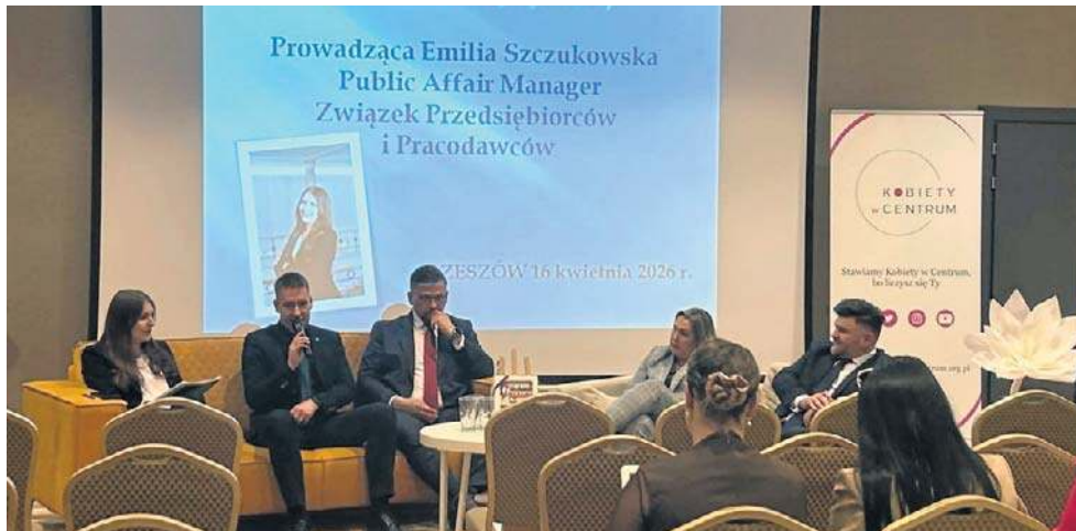
Uczestnicy podczas debaty „Mobilizacja społeczno-gospodarcza, a sukces obrony cywilnej” w Rzeszowie

- Musimy zachęcić przemysł, który będzie wzmacniał i gospodarkę w Polsce i w regionie. Biznes jest elastyczny. Jeśli przedsiębiorcy zobaczą,