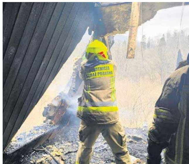
W działaniach gaśniczych brało udział łącznie osiem zastępów PSP i OSP.

- Jak otworzyłem laptopa, to po prostu byłem szokowany. Większości wiadomości nie odebrałem i nie odpisałem, bo nie jestem w stanie. Muszę pracować, bo mam dwa inne obiekty, w których normalnie toczy się praca. Nie możemy pozwolić sobie na za-