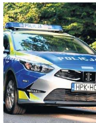
Policja ustaliła personalia niezjącego mężczyzny

Ciało mężczyzny dostrzegła jadąca samochodem kobieta.