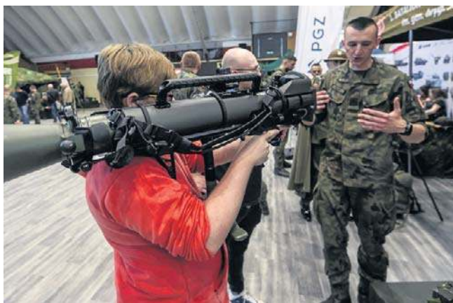
STAŁOWA WOLA. Wojskowe Targi Służby i Pracy. Można było zobaczyć najnowszy sprzęt i oferty pracy w wojsku