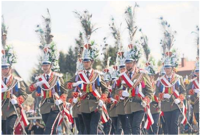
TRYŃCZA. XXI Ogólnopolska i XXXII Podkarpacka Parada Straży Wielkanocnych „Turki”