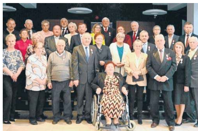
Uroczystość złotych godów odbyła się w Jasielskim Domu Kultury