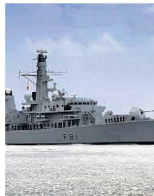
W akcji brał udział okręt HMS Sutherland

W trakcie trwającej sześć godzin operacji komandosi Królewskiej Piechoty Morskiej oraz specjalnie przeszkoleni funkcjonariusze organów ścigania z Narodowej Agencji ds. Zwalczania Przestępczości, przy wsparciu Sił Powietrznych, weszli na pokład tankowca Smyrtos.