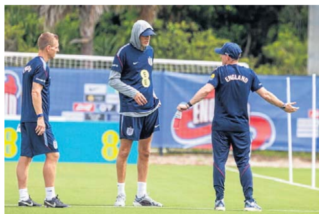
Reprezentację Anglii pod wodzą Thomasa Tuchela (w środku) odwiedzają w USA istne „plagi egipskie”

Makabryczną przygodę przeżyła reprezentacja Iranu przygotowująca się do meczów w USA w meksykańskiej bazie w Tijuanie. W pobliżu stadionu, gdzie trenują Persowie, policja odkryła w porzuconym SUV-ie rozkładające się ciało zapakowane w foliowy worek. Sprawcy morderstwa dotychczas nie namierzono. ©©