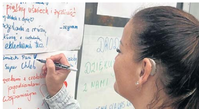
Klienci wypisali za czym będą najbardziej tęsknić

Po 41 latach działalności słynny „Precelek” zakończył swoją działalność. Piekarnia przy ul. Narutowicza jest już nieczynna. Do soboty działał tylko lokal na Pogodnie. Na kartkach przyklejonych na szybie klienci żegnają się z „Precelkiem” i swoimi ulubionymi wypiekami wpisując „będę tęsknić”. Jeden z klientów założył stronę internetową (ostatniprecelek.com) - tam każdy może wspominać.