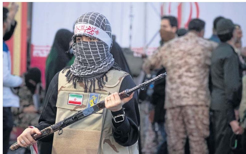
Reżim zmobilizował zwolenników do walki z krytykami republiki islamskiej. Reżim uderza wciąż w różne grupy, które uznaje za niebezpieczne

Iran Human Rights Group, organizacja z siedzibą w Norwegii, poinformowała 8 czerwca, że w tym roku co najmniej 40 więźniów, w tym 19 protestujących, zostało powieszonych na podstawie zarzutów o podłożu politycznym.