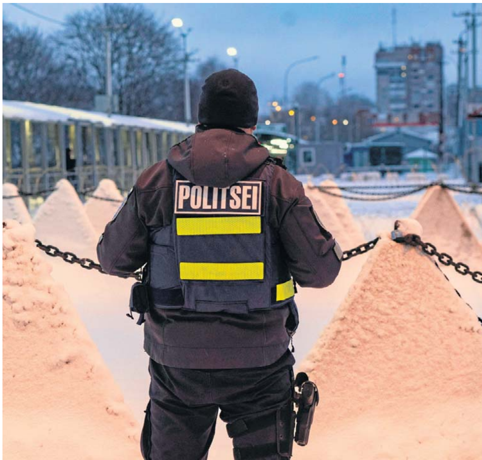
Tylko 162-metrowy most oddziela estońską Narwę od Rosji. Dziś stoją na nim zapory przeciwczołgowe i instalacje przeciwdronowe

Z trzech krajów bałtyckich najslabszym ogniwem wydaje się Łotwa, której „głównym problemem jest pewna kruchość, niewydolność państwa”. - Ryga jako centrum polityczne ma problemy z wdrażaniem podjętych decyzji, czy to dotyczy gospodarki czy społeczeństwa. Też wewnętrzny system polityczny Łotwy jest