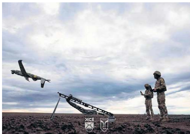
Ukraińcy przeprowadzili kolejne udane ataki dronowe na zakłady chemiczne i naftowe na terenie Rosji

W nocy z soboty na niedzielę wojska rosyjskie atakowały też Ukrainę. Według Sił Powietrznych tego kraju okupanci użyli watachach 98 dronów, z czego 91 zostało strąconych lub unieszkodliwionych środkami walki elektronicznej. Siedem bezzałogowców trafiło w cele w sześciu miejscach - przekazano w komunikacie. PAP