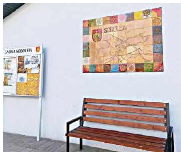
W realizację projektu zaangażowali się także pracownicy referatu komunalnego, którzy zajęli się montażem gotowych płytek

- Krok po kroku – od surowej gliny, przez formowanie, tłoczenie wzorów, aż po szkliwienie i wypał. To nie tylko praca artystyczna, ale także symbol wspólnoty. Każdy detal, każdy wzór i kolor to efekt