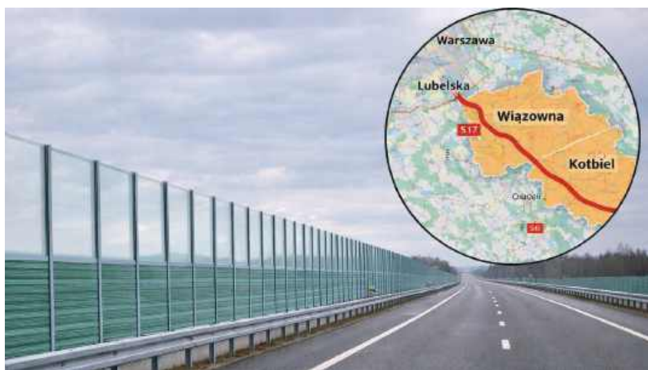
Dla mieszkańców terenów położonych wzdłuż trasy S17 oznacza to jedno – trzeba jeszcze poczekać

Przypomnijmy – 2 marca marszałek województwa mazowieckiego wydał decyzję zobowiązującą Generalnego Dyrektora Dróg Krajowych i Autostrad do ograniczenia oddziaływania akustycznego drogi ekspresowej S17. Chodzi o odcinek od węzła Lubelska (bez węzła) do początku obwodnicy Garwolina.