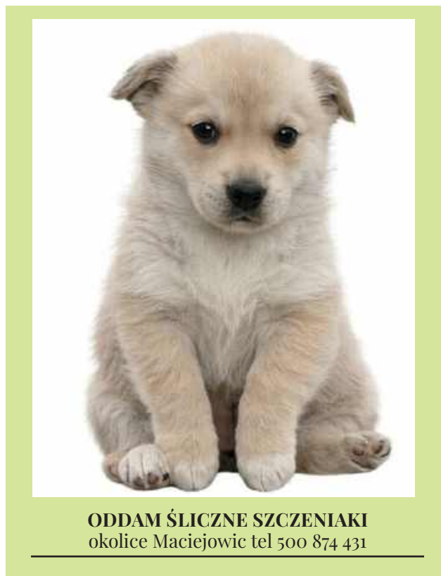
ODDAM ŚLICZNE SZCZENIAKI okolice Maciejowic tel 500 874 431

TUCZNIK w wadze 130 kg; cena 8,70/ kg; z możliwością uboju na miejscu; Sobolew; Tel. 504 637 577