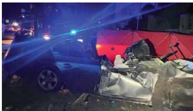
Tragedia wydarzyła się w miejscowości Trąbki w gminie Biskupice (powiat wielicki, woj. małopolskie)

W geście solidarności i pamięci o zmarłym druhowi, w środę o godzi-