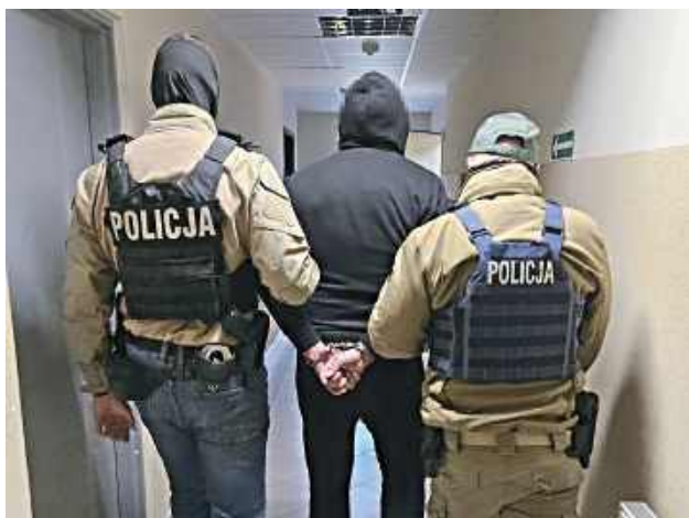
Mężczyzna, poszukiwany listem gończym, trafił już do zakładu karnego, gdzie odbędzie wieloletnią karę pozbawienia wolności

Do zatrzymania doszło w środę, 15 kwietnia, około godziny 9 rano. Policja przeprowadziła siłowe wejście do mieszkania,