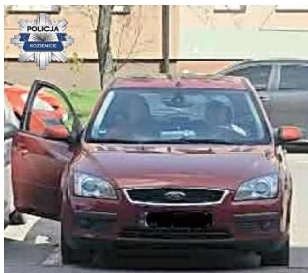
Policjant będący poza służbą wykazał się czujnością i zdecydowaną reakcją, zapobiegając potencjalnie niebezpiecznej sytuacji na drodze

Policjant natychmiast podjął interwencję. Wyjął kluczyki ze stacyjki, uniemożliwiając mężczyźnie dalszą jazdę, a następnie wezwał patrol Policji. Przybyli na miejsce funkcjonariusze prze-