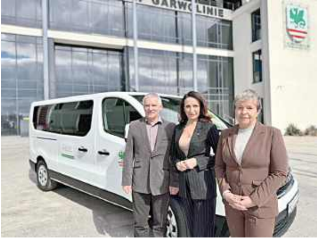
Do Specjalnego Ośrodka Szkolno-Wychowawczego w Przyłęku trafił nowoczesny samochód przystosowany do przewozu osób z niepełnosprawnościami

To inwestycja, która realnie wpłynie na codzienne funkcjonowanie podopiecznych. Do Specjalnego Ośrodka Szkolno-Wychowawczego w Przyłęku trafił nowoczesny samochód przystosowany do przewozu osób z niepełnosprawnościami.