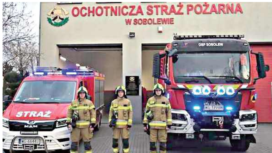
Strażacy z powiatu oddali hołd tragicznie zmarłemu druhowi