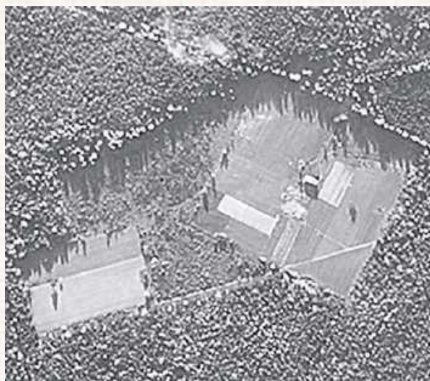
„Czerwony Krzyż” z lotu ptaka w 1944 roku

Oficer przyszedł na świat 5 sierpnia 1891 roku w Górkach w powiecie pińczowskim. Był synem Tadeusza i Emilii Lekszycy. Pobierał nauki w gimnazjum w Ostrogu na Wołyniu. Prowadził działalność patriotyczną w podziemnej organizacji „Konspiracja”. Studiował w Kijowie - na Uniwersytecie oraz