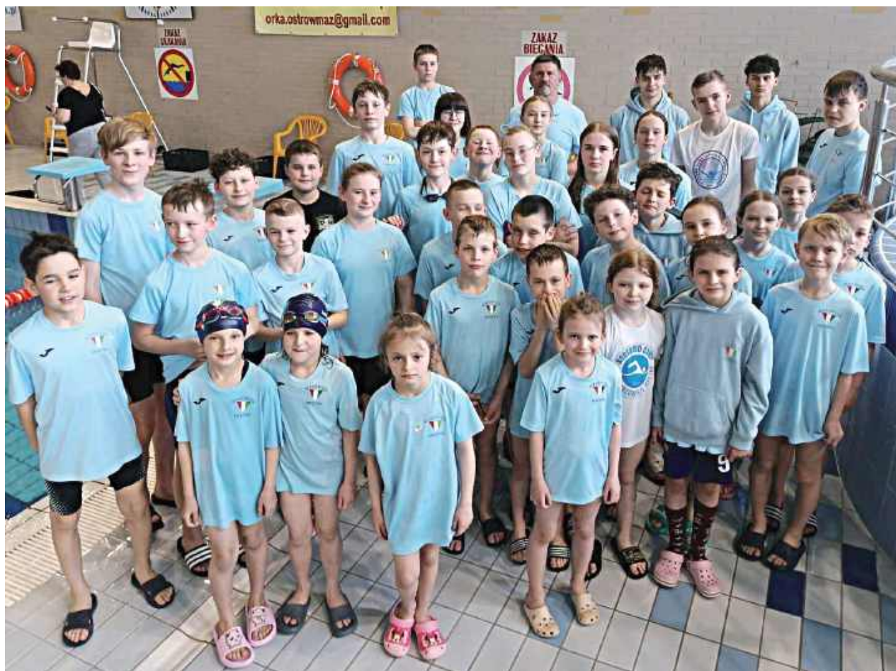
Ekipa Mazowska Miętne w Ostrowi Mazowieckiej. Popływali pięknie!

26. miejsce – 25 m styl dowolny 15. miejsce – 25 m styl grzbietowy