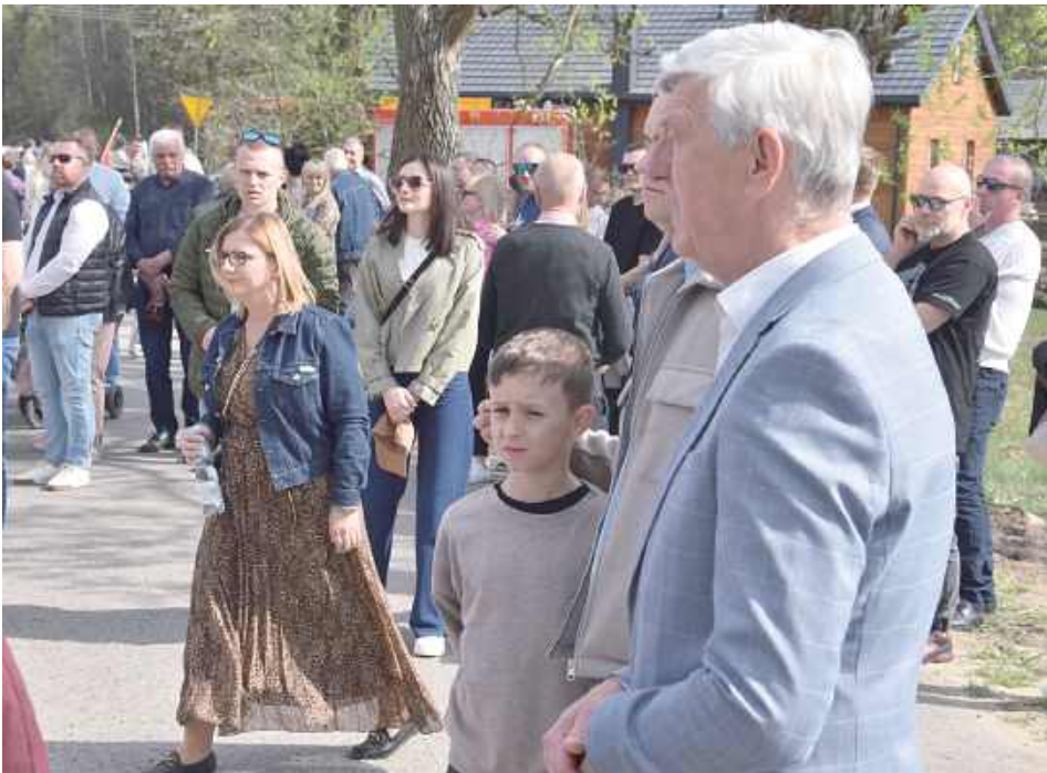
Na uroczystość licznie przybyli mieszkańcy Kalonki i okolicznych miejscowości gminy Pilawa