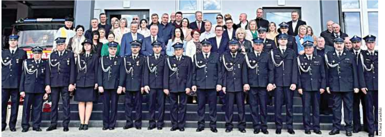
13 kwietnia w Korytnicy odbyło się uroczyste otwarcie wyremontowanej remizy Ochotniczej Straży Pożarnej

13 kwietnia w Korytnicy odbyło się uroczyste otwarcie wyremontowanej remizy Ochotniczej Straży Pożarnej. To ważna inwestycja, która ma znaczenie nie tylko dla samych strażaków, ale także dla całej lokalnej społeczności.