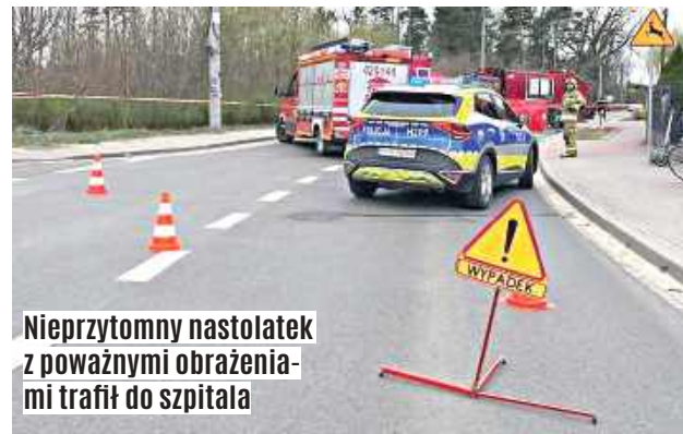
Nieprzytomny nastolatek z poważnymi obrażeniami trafił do szpitala

Niestety 17-latek bardzo ucierpiał w tym zdarzeniu