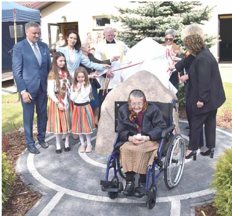
Centralnym punktem wydarzenia było odsłonięcie i poświęcenie kamienia pamięci

- Zdecydowaliśmy się rozpocząć te uroczystości od modlitwy, podziękować Panu Bogu za tych odważnych ludzi, którzy w różnych okresach historii tutaj na tych naszych ziemiach stawali w obronie tych największych wartości i te słowa „Bóg, honor i Ojczyzna” przyświecały im w codziennym życiu, działaniu. Złożyli wielką ofiarę ze swojego życia, aby i te wartości były przez nas szanowane, abyśmy nimi żyli. Dlatego jesteśmy tutaj, każdy przyszedł, aby przez swoją obecność, przez dar modlitwy oddać im cześć, chwałę i prosić Pana Boga, żeby wynagro-