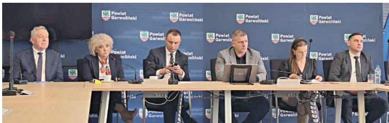
Kolejna próba rozwiązania sporu o miliony dla SP ZOZ w Garwolinie

W centrum konfliktu znajdują się projekty finansowane z Krajowego Planu Odbudowy. Ich łączna wartość przekracza 20 mln zł. Obejmują one m.in. rozwój kardiologii oraz cyfryzację szpitala – inwestycje, które