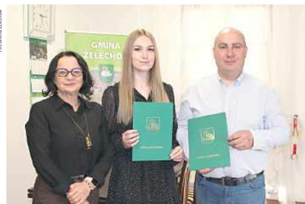
Stypendium to nie tylko forma wyróżnienia, ale także realne wsparcie dla młodych ludzi w dalszym rozwoju i realizacji ich edukacyjnych oraz sportowych celów