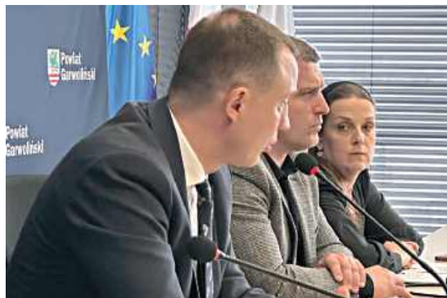
Parlamentarzysta wziął udział w posiedzeniu Komisji Zdrowia i Opieki Społecznej Rady Powiatu Garwolińskiego

Parlamentarzysta, który wziął udział w ostatnim posiedzeniu Komisji Zdrowia i Opieki Społecznej Rady Powiatu Garwolińskiego, po raz pierwszy tak wyraźnie zabrał głos w tej sprawie, wskazując, że konflikt zaczyna uderzać bezpośrednio w mieszkańców.