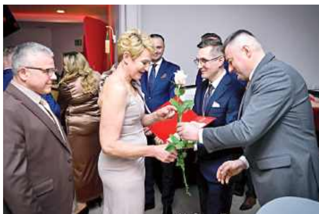
W tym roku gala miała szczególny, jubileuszowy charakter

W tym roku gala miała szczególny, jubileuszowy charakter. Podkreślano nie tylko wielkość dostaw, ale przede wszystkim jakość mleka trafiającego do spółdzielni. Łącznie wyróżniono aż 72 producentów, którzy łączą wysoką produkcję z bardzo dobrymi parametrami surowca.