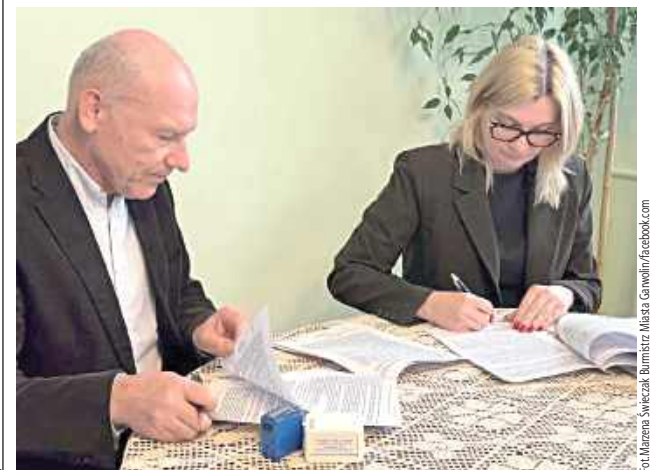
Wartość inwestycji wynosi 247 319,73 zł

To długo wyczekiwana inwestycja przez mieszkańców jednej z garwolińskich ulic. Jak poinformowała burmistrz Marzena Świeczak, podpisano umowę na budowę ul. Kolonia Henryków. Oznacza to, że po etapie przygotowań i uzgodnień inwestycja wchodzi w fazę realizacji.