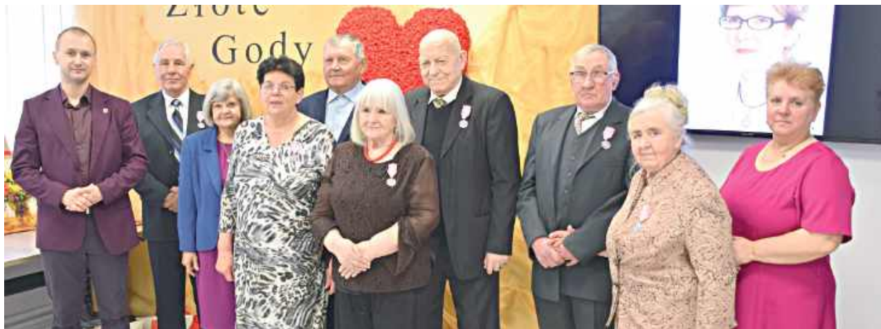
Wszystkim jubilatom składamy najserdeczniejsze życzenia – kolejnych lat przeżytych razem w zdrowiu, miłości i szczęściu!