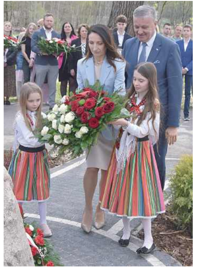
Jednym z najważniejszych momentów uroczystości było złożenie kwiatów przy odsłoniętym kamieniu