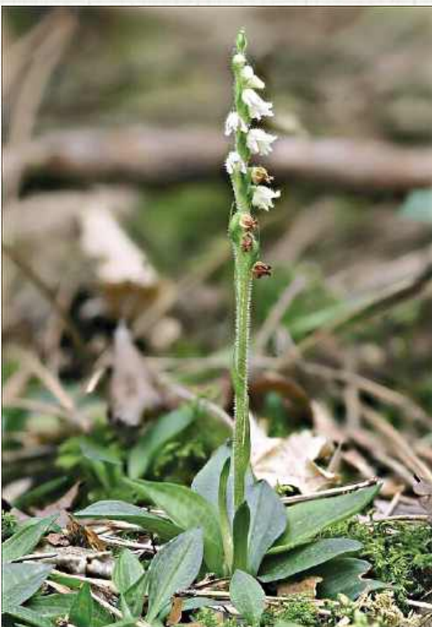
Rezerwat został powołany do życia w celu ochrony i zachowania stanowiska jednego z najrzadszych na niżu Polski gatunków storczyka, czyli tajeży jednostronnej

cujących na tym terenie. Krzyż stylizowany jest na dawny symbol, jakich było przed stuleciem w tym regionie wiele.