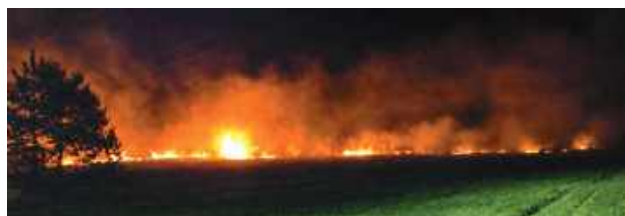
W poniedziałkowy wieczór, 13 kwietnia, doszło do pożaru nieużytków rolnych w miejscowości Żelazna (gmina Pilawa)

Zgłoszenie wpłynęło do Stowiska Kierowania Komendy Powiatowej Państwowej Straży Pożarnej w Garwolinie po godzinie 22. Na miejsce natychmiast skierowano zastępy straży pożarnej.