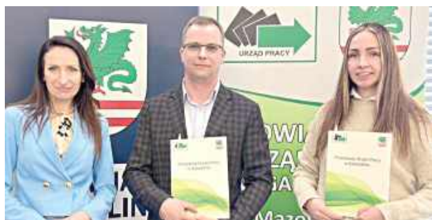
Powiat Garwoliński kontynuuje działania na rzecz aktywizacji zawodowej i rozwoju lokalnej przedsiębiorczości

W 2026 roku dzięki środkom z Europejskiego Funduszu Społecznego powstanie 40