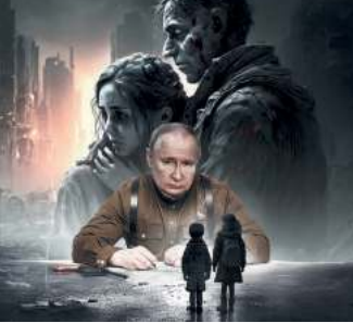
Skradzione dzieci Ukrainy. Wielka rusyfikacja młodych Ukraińców / 4