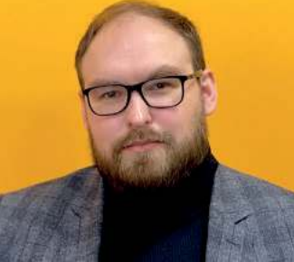
Najczarniejszy scenariusz dla Polski to utrzymanie się Putina w władzy / 12