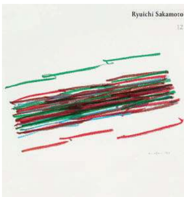
Ryuichi Sakamoto, „12”, Milan Records

W styczniu ukazał się ostatni, pożegnalny album Ryuichiego Sakamoto, krążek zatytułowany „12”. Płyta bardzo ciekawa, ale też na wskroś smutna. Kompozytor nagrywał ją w trakcie zmagania z nawrotem choroby nowotworowej, ze świadomością zbliżającej się śmierci.