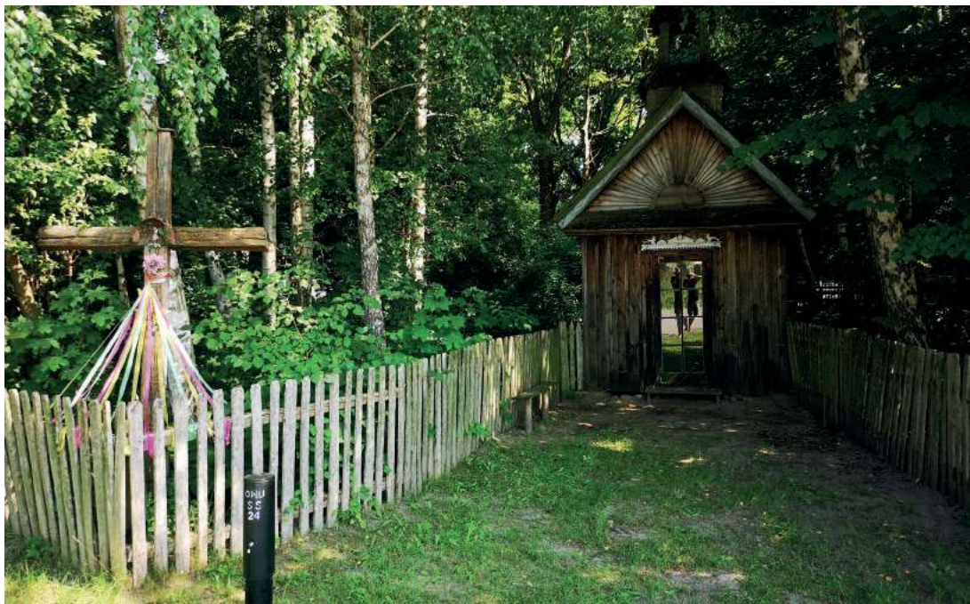
Tutejszą kapliczkę na skraju dróg wybudował już sam profesor

dziennie. Próżno doszukiwać się tu kilkudziesięcioosobowych grup czy wycieczek. Ludzie nadal nie wiedzą o tym miejscu. – To chata, w której swego czasu ukrywał się przed Rosjanami ks. Stanisław Brzóska, ostatni kapelan powstania styczniowego.