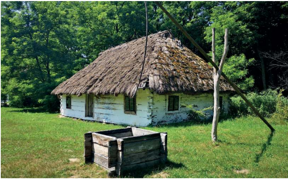
Jedna z dwóch zabytkowych wiejskich chat przypomina historię ks. Stanisława Brzóska, ostatniego kapelana powstania styczniowego.

przeprowadzenie kapitalnego remontu i renowacji skansenu. Obiekt pozostaje więc nietknięty. Jedynie co któryś rok zostaje pozbawiony kolejnej atrakcji.