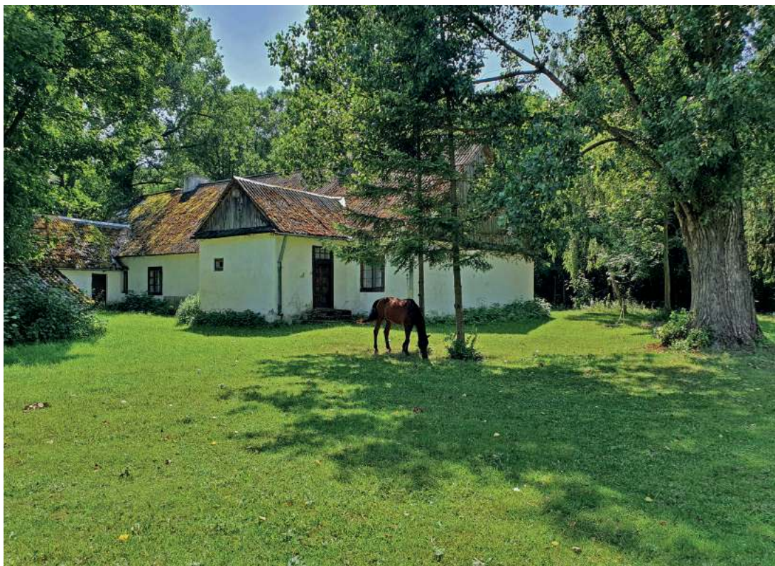
Kadr, na który nie trzeba długo czekać

K rajowa trasa numer dwa łącząca Warszawę z Terespołem. Odcinek między wiecznie zakorkowanym Kałuszynem a siedemdziesięciopięciotysięcznymi Siedlcami. W tych dniach bardzo rozkopany w związku z budowaną obok autostradą. Po zasypanej pochodzącym z pobliskiej budowy pyłem i piaskiem szosie co rusz ślamazarnie toczy się jakaś koparka bądź wywrotka. Wkoło słychać warkot wiertnicy. Huk przesypanywanego gruzu. Grzechot pracującej betoniarki. Pędzące do tej pory po pustawej dwupasmowej ekspresowce samochody tutaj muszą już zwolnić. A ich kierowcy uzbroić się w cierpliwość. Niektórzy natomiast uciekają w okoliczne odnogi. Czy będą w ten sposób szybciej u celu, to raczej wątpliwe. Ale to, że pojadą znacznie bardziej urokliwą trasą od tej dotychczas, jest oczywiste.