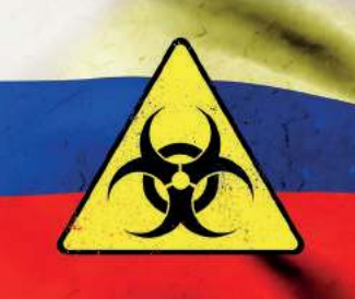
Bakterie i wirusy, Lenin i Putin. Program broni biologicznej... / 82