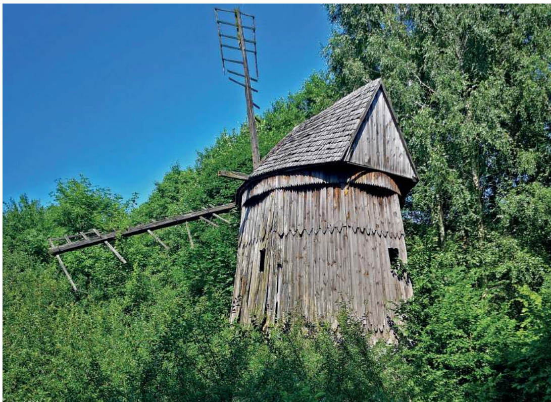
Zabytkowy wiatrak koźlak ocalał pomimo całej serii „przypadkowych uderzeń piorunem” w tej okolicy