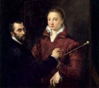
Pamięci talentu Sofonisby, mistrzyni portretów / 62