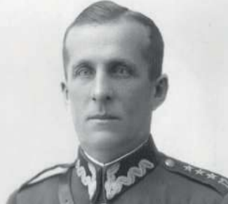
Bicie bolszewika ważniejsze od igrzysk olimpijskich / 26