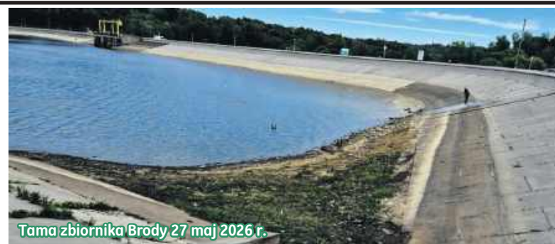
Tama zbiornika Brody 27 maj 2026 r.

- Chyba to dalszy etap remontu tawy, trzeci? Miejscowy Wójt informo- wał, że został zakończony II etap, ale o tym, że jest jeszcze chyba kolejny, już nie. Wspominał, również że woda wróci do normalnego stanu i tak też było