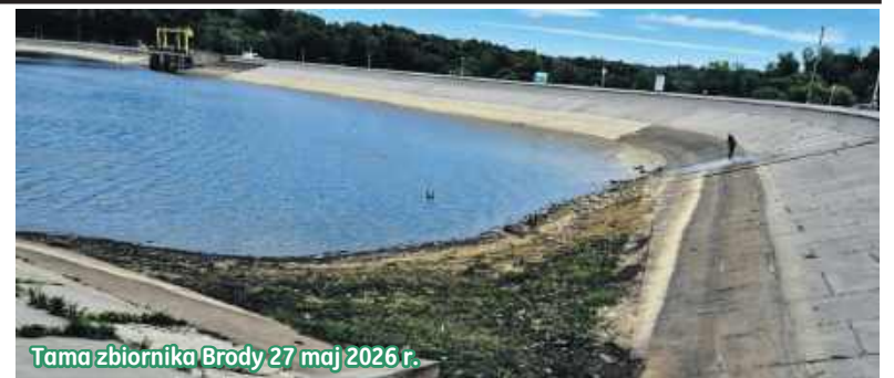
Tama zbiornika Brody 27 maj 2026 r.

- Chyba to dalszy etap remontu tawy, trzeci? Miejscowy Wójt informo- wał, że został zakończony II etap, ale o tym, że jest jeszcze chyba kolejny, już nie. Wspominał, również że woda wróci do normalnego stanu i tak też było