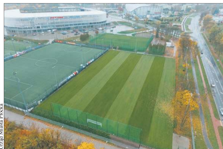
Nowe boiska treningowe przy stadionie Wisły Płock