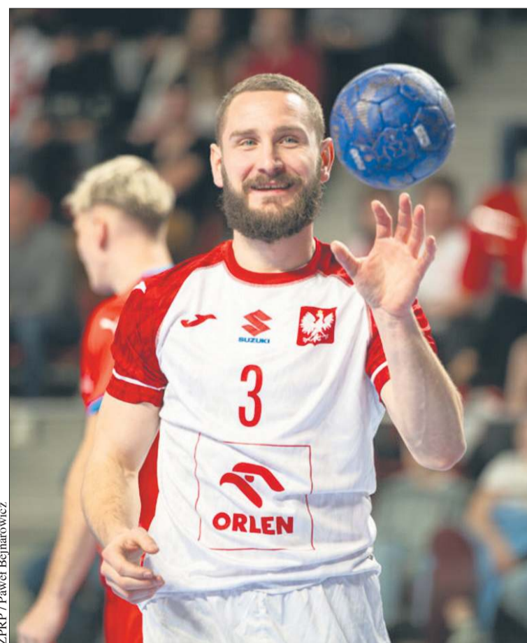
ZPRP / Paweł Bejnarowicz

Mecz odbył się w Pau i zakończył wyraźnym zwycięstwem gospodarzy, którzy pokonali rywali 38:28. W składzie Trójkolorowych nie zabrakło reprezentanta Nafciarzy – rozgrywającego Melvyna Richard-