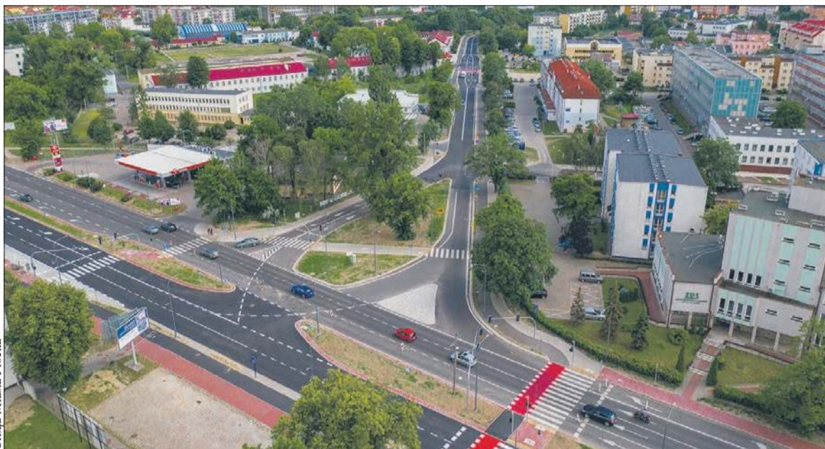
Na skrzyżowaniu przy starej Politechnice zostanie zmodernizowana sygnalizacja świetlna

Uwaga, kierowcy! Zostaną wprowadzone duże zmiany w pracy sygnalizacji świetlnej i organizacji ruchu w zespole skrzyżowań al. Kilińskiego z al. Jachowicza oraz al. Piłsudskiego z ulicą Dworcową i Otołińską.