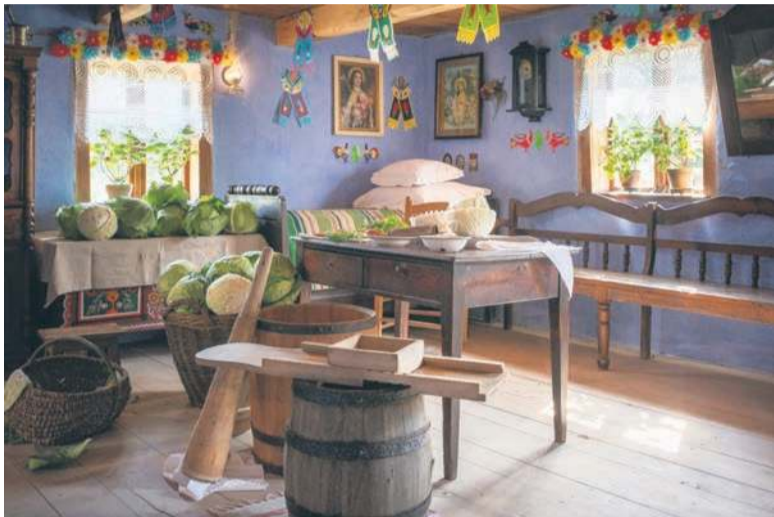
Muzeum Wsi Mazowieckiej w Sierpcu

Polska Organizacja Turystyczna doceniła w tym roku Mazowsze w dwóch kategoriach. Certyfikat POT zdobyły: Skansen w Sierpcu oraz warszawskie Muzeum Polskiej Wódki, a laureatem kategorii Turystyczne Odkrycie Roku zostało Muzeum Fabryka Czekolady E.Wedel. To historyczny sukces! Mazowieckie po raz pierwszy w historii zdobyło aż trzy Certyfikaty POT w jednym roku.