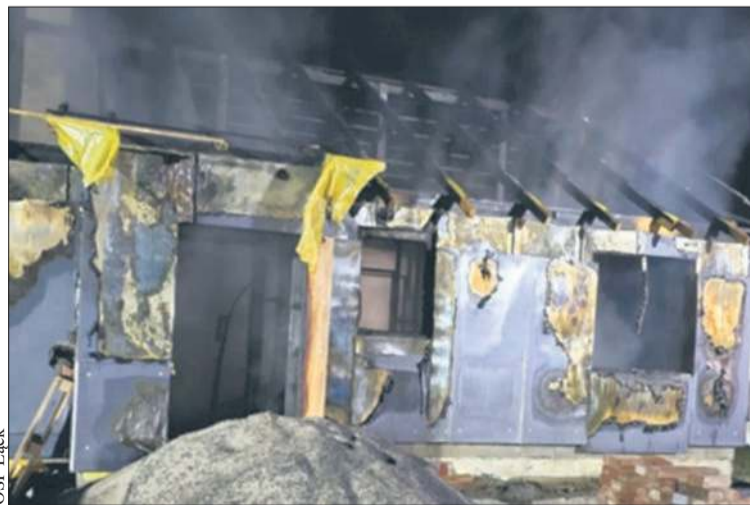
W pożarze dom spłonął doszczętnie

Pożar w Sendeniu Dużym (gm. Łąck) wybuchł w nocy z 1 na 2 listopada i doszczętnie strawił budynek, który już niedługo miał się stać bezpieczną przystanią. - Samotny tata i jego córeczka przez