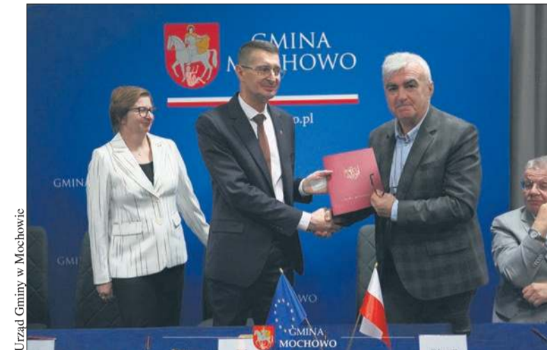
Urząd Gminy w Mochowie