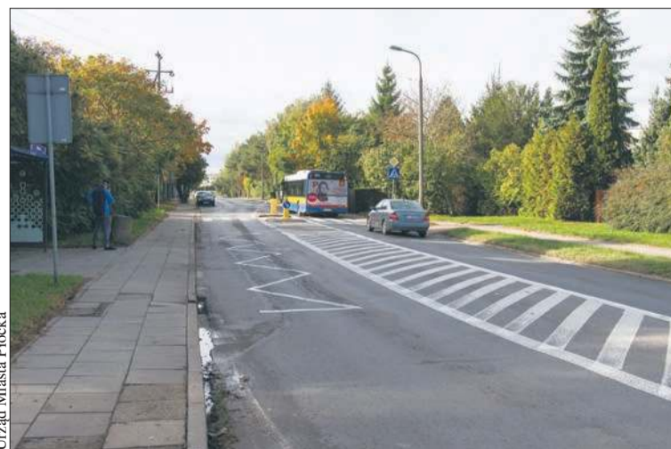
Urząd Miasta Płocka

W przyszłym roku czeka nas remont ulicy Medycznej