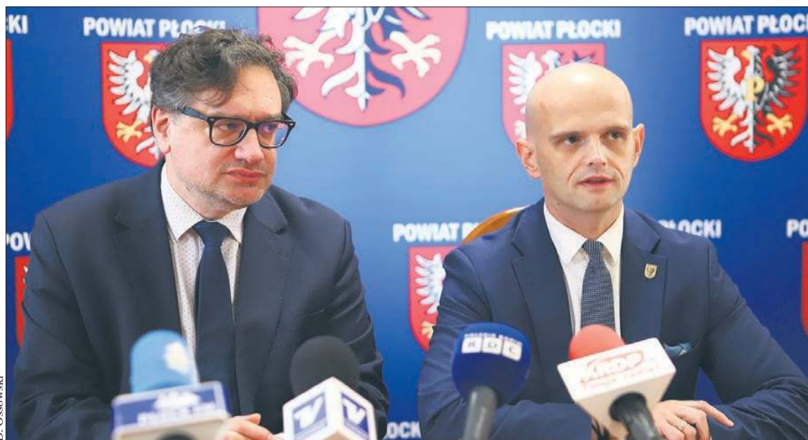
Prezes UODO Miroslaw Wróblewski oraz starosta płocki Sylwester Ziemkiewicz

Zaznaczył przy tym, że podczas pracy nad wdrażaniem nowych przepisów dotyczących lokalnego bezpieczeństwa władze powiatowe skupiają się na budowaniu społecznej odporności subregionu w wielu różnych wymiarach. - To obszar infrastrukturalny, ale też i takie, które obejmują kwestie szkoleniowe czy też budowę