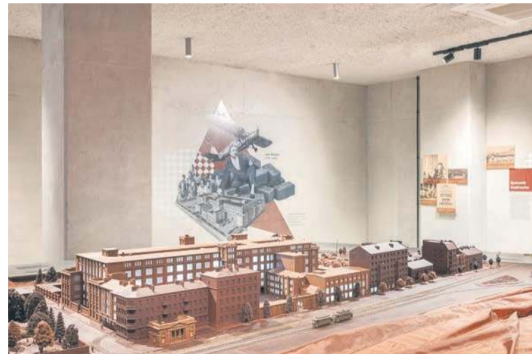
Muzeum Fabryka Czekolady E.Wedel w Warszawie