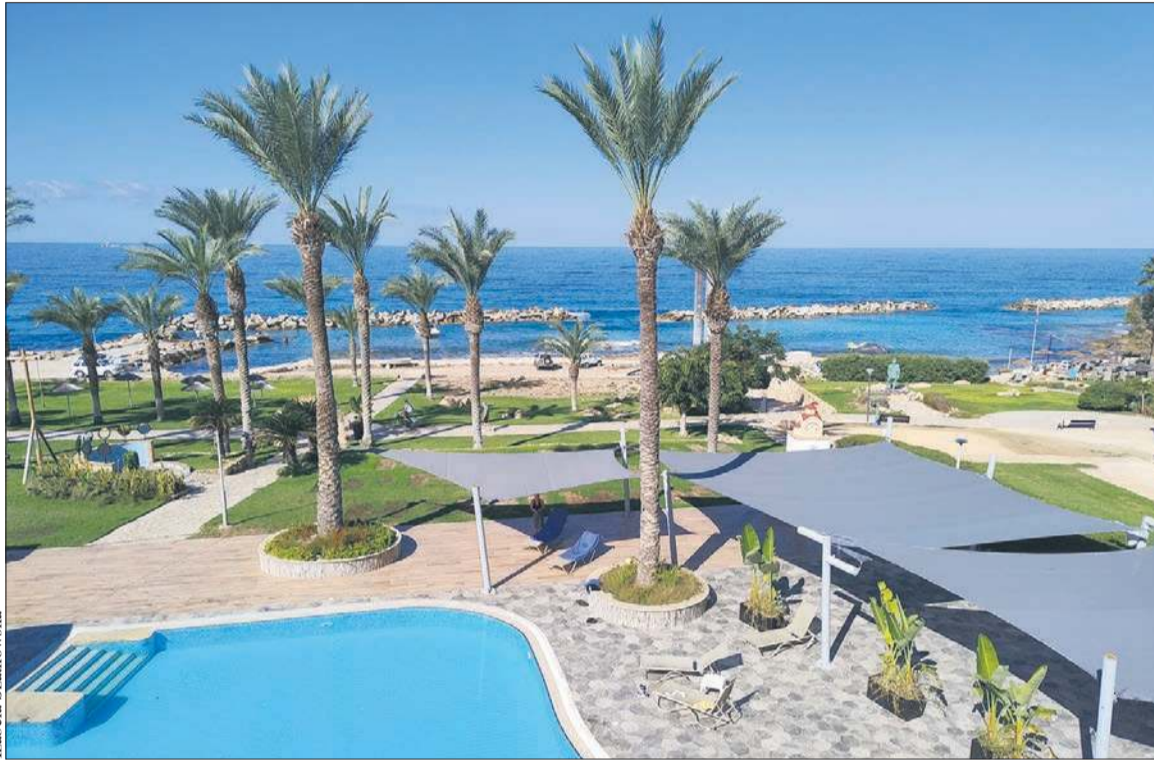
Widok z okna apartamentu w Chlorace (przedmieścia Pafos) na morze. Prawda, że urzeka błękitem?

Nie ma większego problemu z połączeniami lotniczymi z Polski. Jeśli wyjazd planujemy z którymkolwiek z biur podróży, to skorzystamy oczywiście