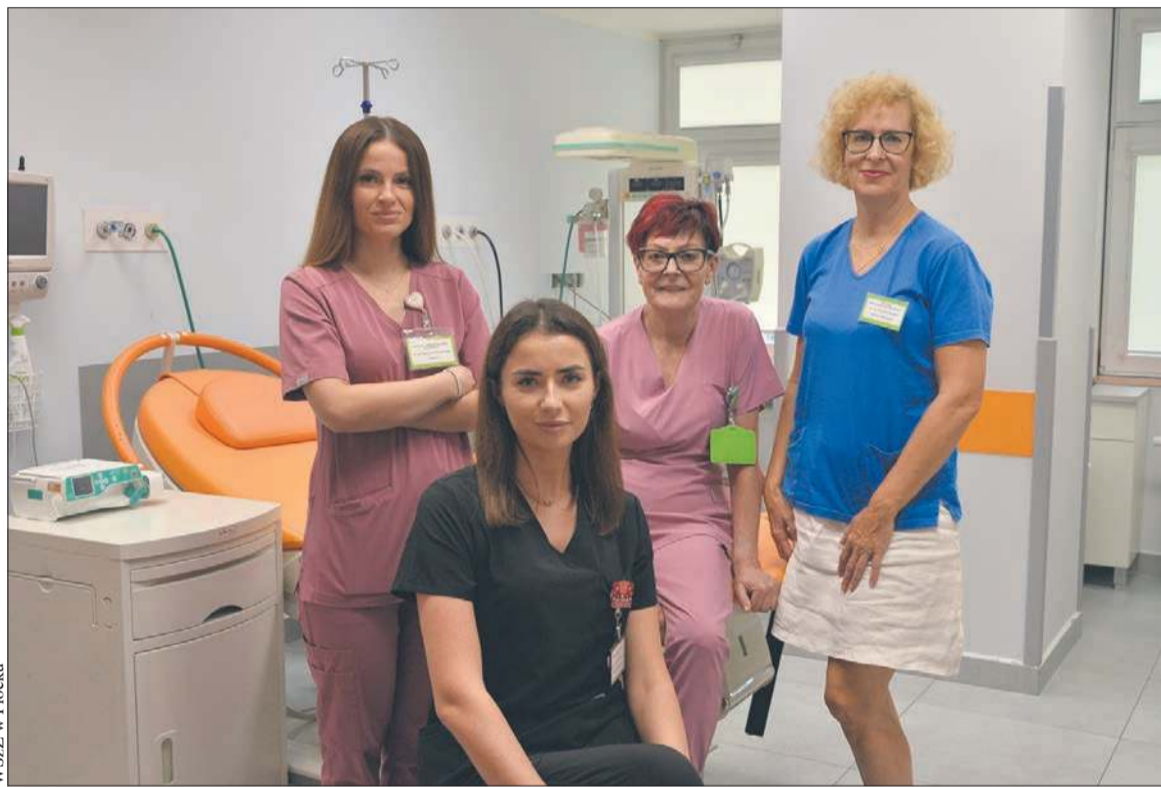
Zajęcia w szkole rodzenia prowadzą położne z Oddziału Ginekologiczno-Położniczego WSzZ w Płocku (na zdjęciu położne z części położniczej Oddziału)