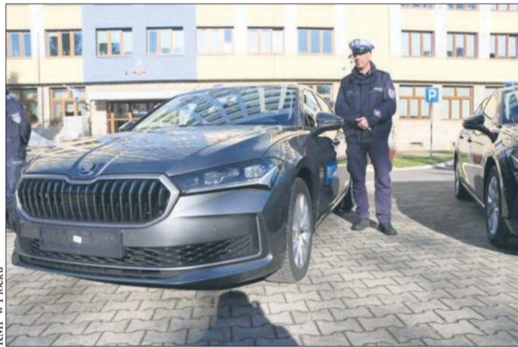
KMP w Płocku

Może się pojawić zarówno na drogach miasta, jak i powiatu. Nie będzie oznakowana, co może uspić czujność kierowców. W razie „namierzenia”