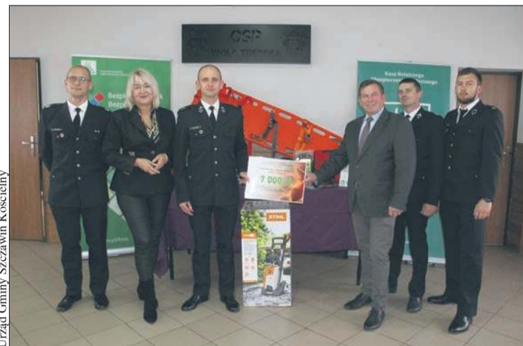
Urząd Gminy Szczawin Kościelny