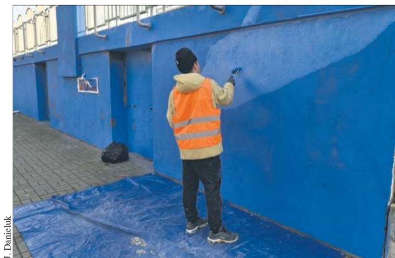
Na ogrodzeniu stadionu miejskiego powstaje mural prezentujący różne dyscypliny sportowe