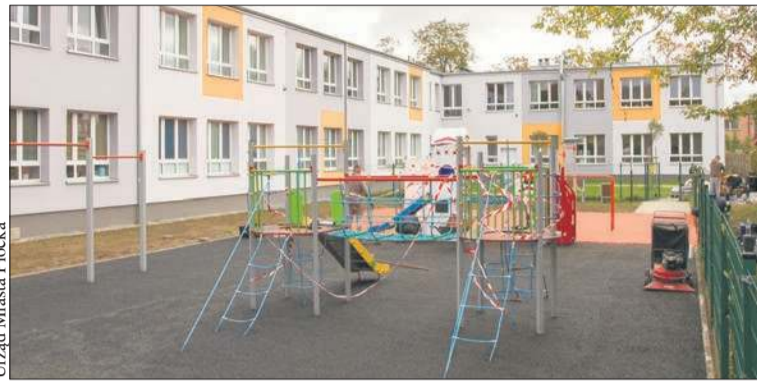
Plac zabaw przy Szkole Podstawowej nr 11

Co roku płocki samorząd modernizuje wysłużone oraz buduje nowe place zabaw. Wszystkie po to, aby były bezpieczne, nowoczesne i kreatywne. W ten sposób służą dobremu rozwojowi najmłodszych płocczan i zachęcają do aktywnego spędzania czasu z rówieśnikami.