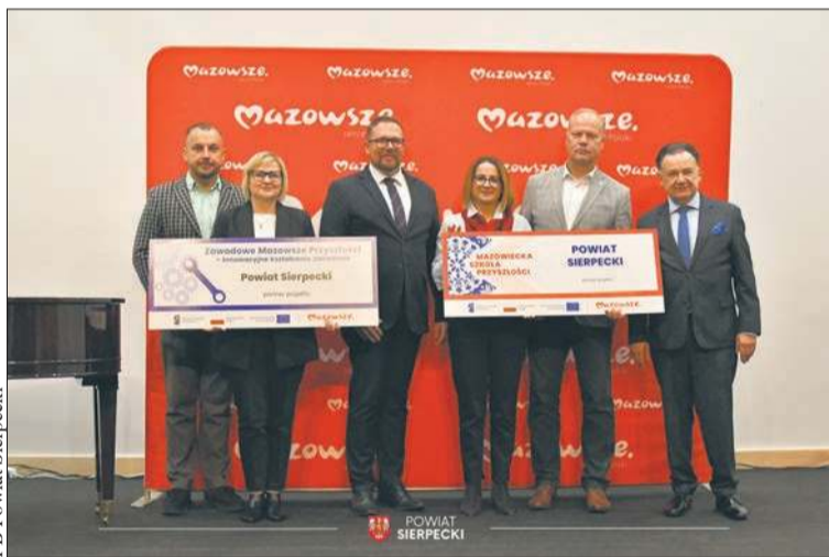
FB Powiat Sierpecki

Jednym ze 199 partnerów projektu „Mazowiecka Szkoła Przyszłości” jest również gmina Mochowo. Do projektu z terenu gminy zakwalifikowali się uczniowie i nauczyciele z dwóch szkół: Szkoły Podstawowej w Bożewie i Szkoły Podstawowej w Ligowie. W ramach projektu prze-