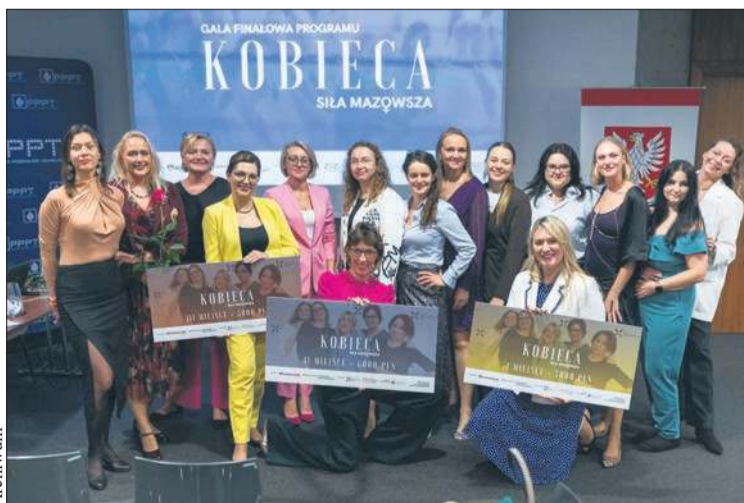
Uczestniczki programu Kobieca Siła Mazowska