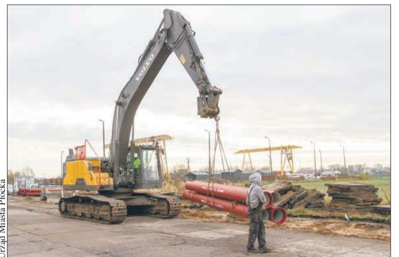
Urząd Miasta Płocka

W ramach tej inwestycji drogowcy zlecą jeszcze jedno zadanie. Chodzi o odcinek ul. Boryszewskiej, który znajduje się między skrzyżowaniem z ul. Żytną a jarem Rosicy i przecina-