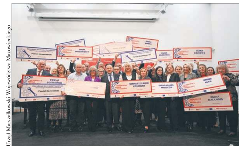
Urząd Marszałkowski Województwa Mazowieckiego W regionie płockim, w programach „Mazowiecka szkoła przyszłości” i „Zawodowe Mazowsze Przyszłości” uczestniczy ponad 70 szkół

Partnerami programów są jednostki samorządu terytorialnego, które do udziału w projektach zgłosiły w sumie ponad 500 szkół. Z projektu skorzysta ponad 75,5 tys. uczniów. Szkoły otrzymują nowoczesny sprzęt, dostęp do warsztatów i wycieczek edukacyjnych, a nauczyciele – szkolenia. – Chcemy stworzyć naszym uczniom odpowiednie warunki do nauki. Dlatego wyposażymy pracownie