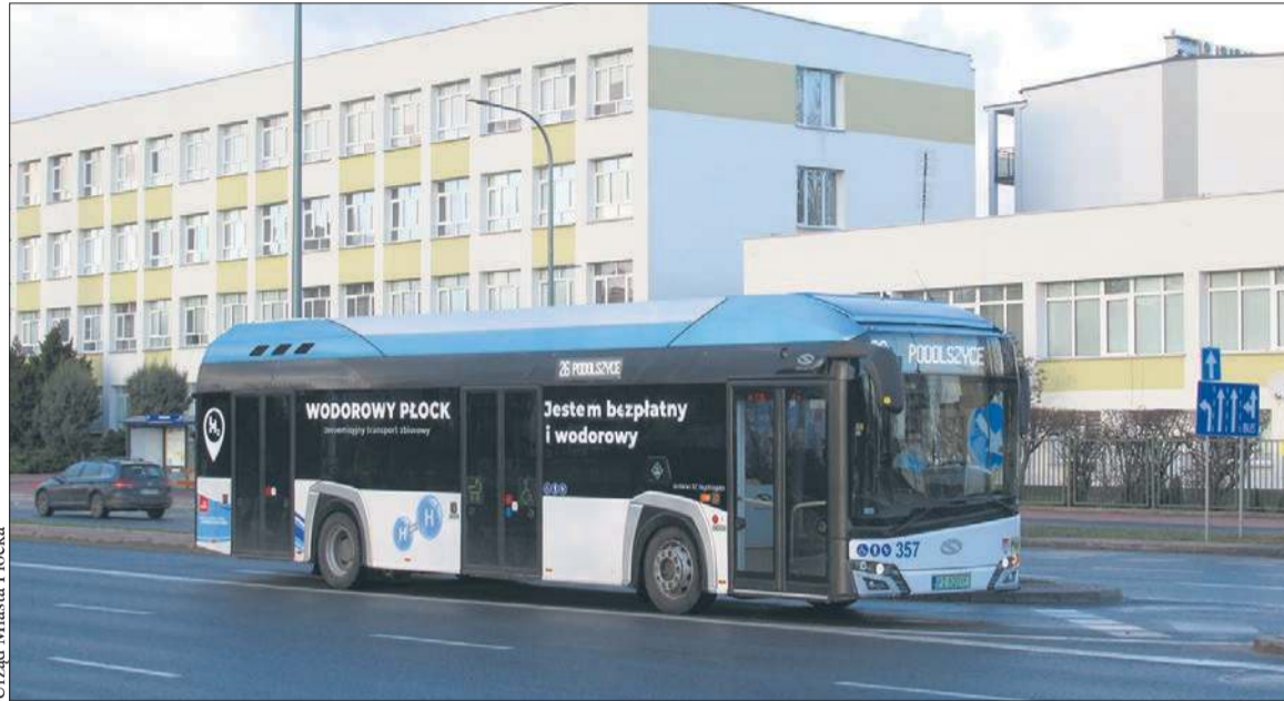
Urząd Miasta Płocka

– Jako samorząd podejmujemy różnorodne działania, które będą miały wpływ na poprawę jakości powietrza. Jednym z nich jest zakup zeroemisyjnego taboru dla komunikacji zbiorowej. W czerwcu tego roku podpisaliśmy umowę z wybra-