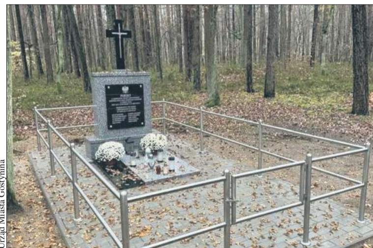
Urząd Miasta Gostynina

Miejsce pamięci w Drzewcach przeszło renowację