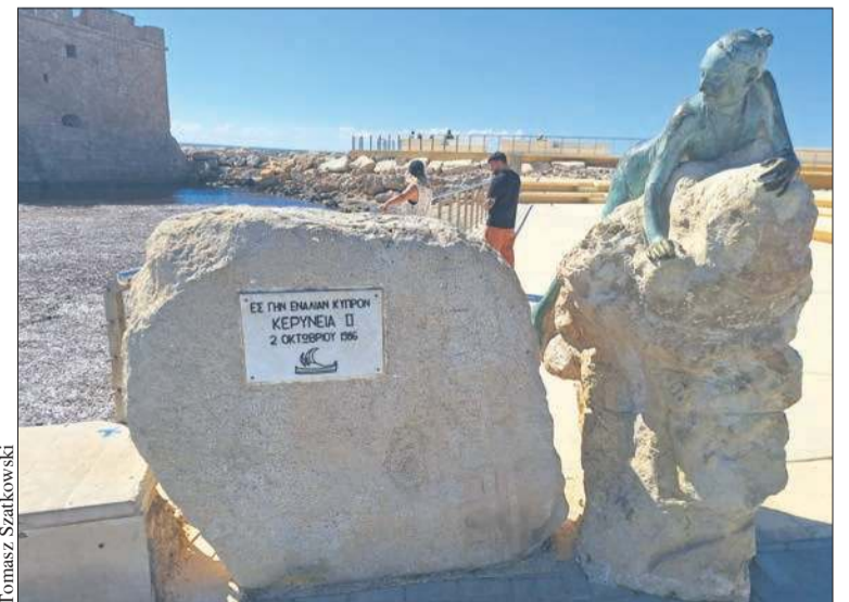
Cypr to oczywiście kult Afrodyty. Miejsca z nią związane znajdziecie wszędzie. Ten pomnik usytuowany jest tuż obok zamku w Pafos - średniowiecznej fortecy przy porcie

Nie zawadzi dodać parę praktycznych informacji. Dojazd z Pafos samochodem: około 1,5 – 2,5 godz. przez malownicze góry Troodos. Klasztor