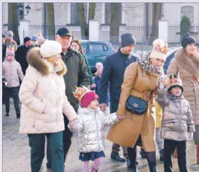
W orszaku pełnym kolorów i tradycji.