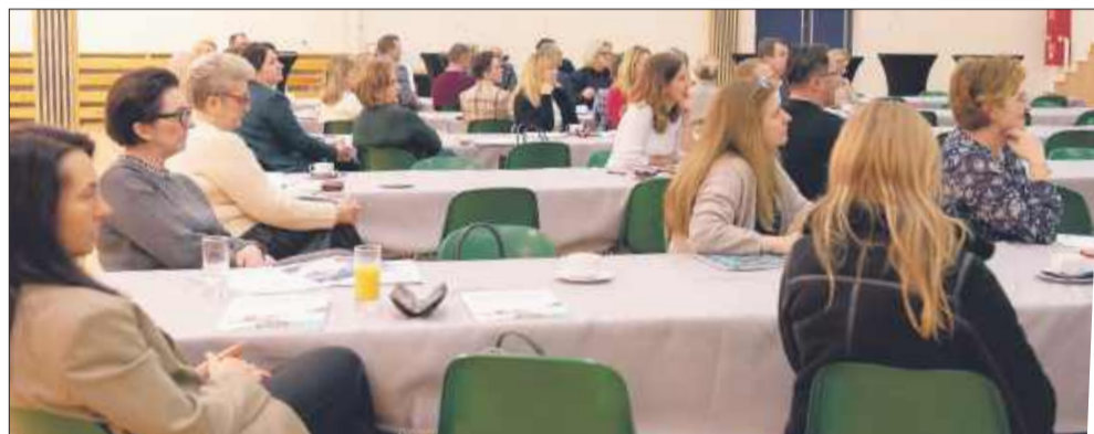
Zespół Szkół Technicznych w Mielcu był gospodarzem wojewódzkiej konferencji.

W bieżącym roku szkolnym ZST w Mielcu ma zaszczyt pełnić funkcję Regionalnego Punktu Informacyjnego Fundacji Rozwoju Systemu Edukacji-Narodowej Agencji Programu Erasmus+.