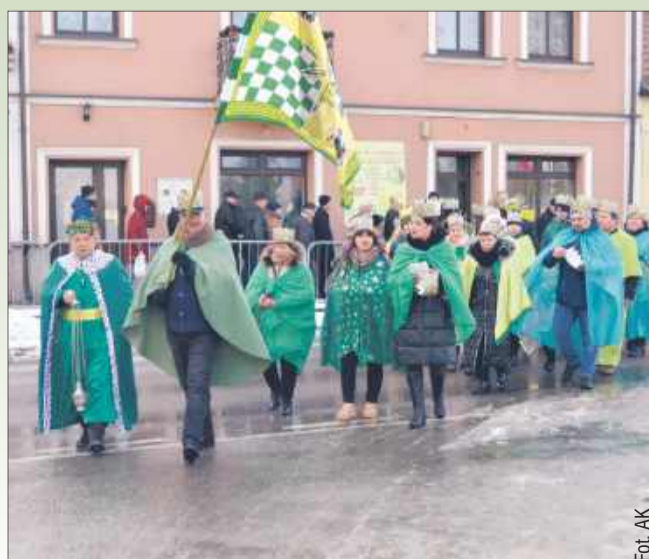
Korony na głowach Mędrców, a wokół nich – uśmiechnięte twarze mieszkańców.