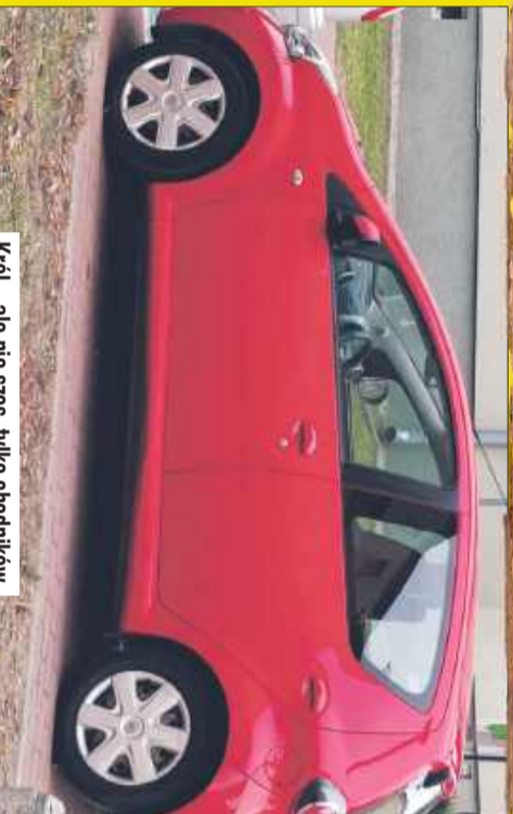
Król... ale nie szos, tylko chodników.