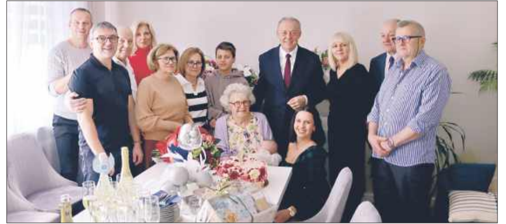
Obchody setnych urodzin to nie tylko święto Jubilatki, ale także wyjątkowe wydarzenie dla całej społeczności lokalnej.

Pamiętajmy, że skuteczna komunikacja pocztowa leży w interesie każdego mieszkańca. MW