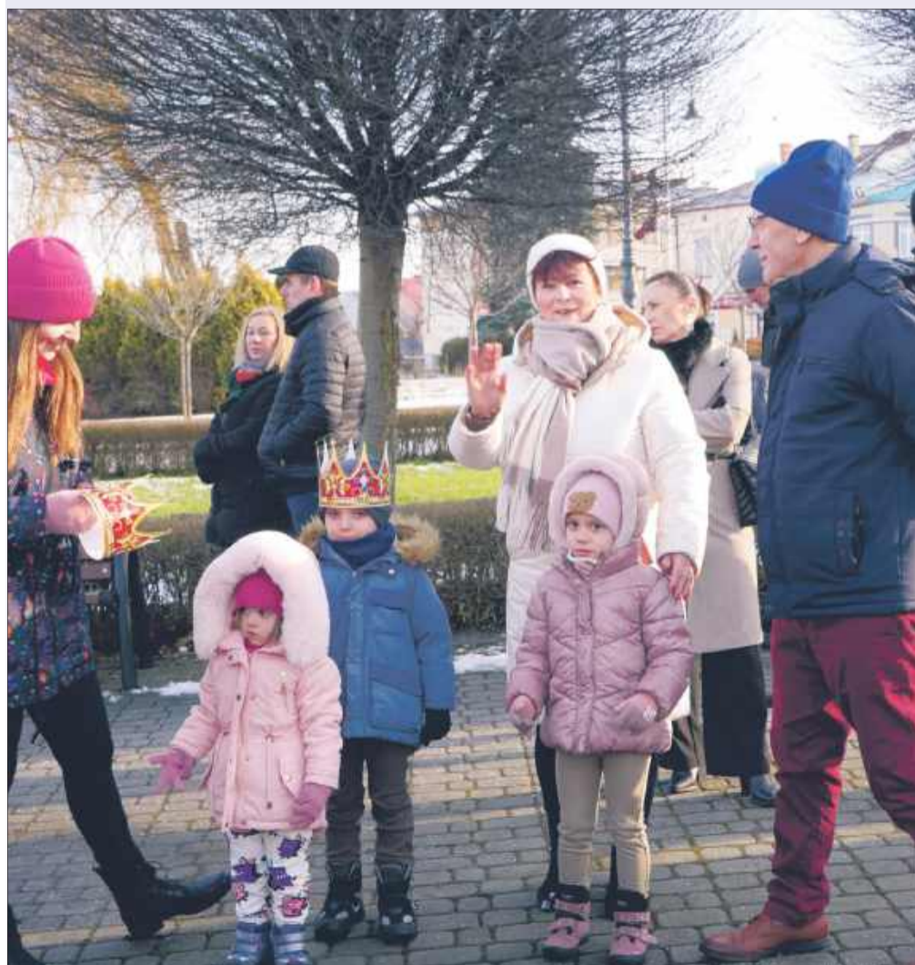
W orszaku Trzech Króli nie brakowało dziecięcej radości.