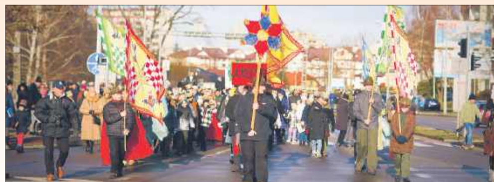
Orszak w pełnej krasie!