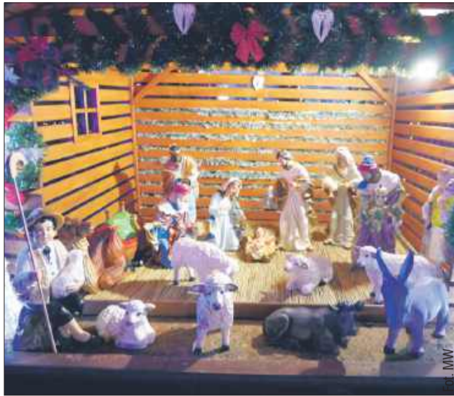
Punktem centralnym dekoracji jest szopka.