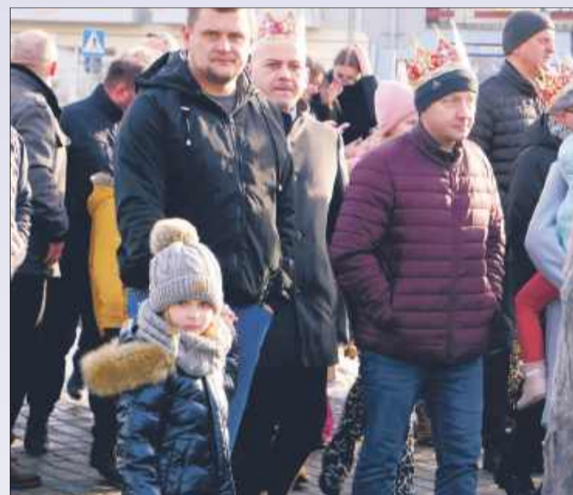
Orszak łączy nie tylko ludzi, ale i pokolenia.