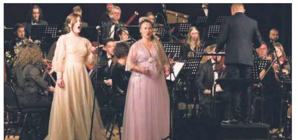
Mielecka Orkiestra Symfoniczna jak zawsze swoją muzyką zapewniła wyjątkowy wieczór.

Publiczność jak zwykle entuzjastycznie dziękowała za kolejny koncert mieleckiej orkiestry. mw