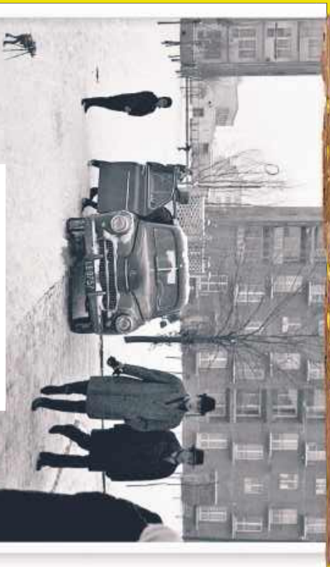
Za takimi zimami często wdychamy...