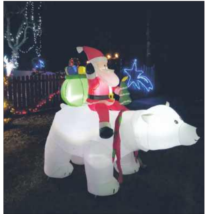
Święty Mikołaj w towarzystwie niedźwiedzia prosto z Bieguna Północnego.

Partynia co roku przyciąga uwagę mieszkańców i przejezdnych dzięki wyjątkowym świątecznym dekoracjom na jednej z posesji. Migoczące światelka, renifery z saniami, anioły i efektowna szopka – to wszystko sprawia, że dom wygląda jak żywcem wyjęty z baśni. Niestety, w drugi dzień świąt nie obyło się tam bez wypadku.