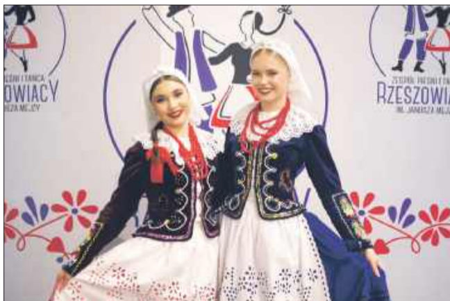
Koncert „Rzeszowiaczy wracają do hali” był wielkim wydarzeniem kulturalnym.