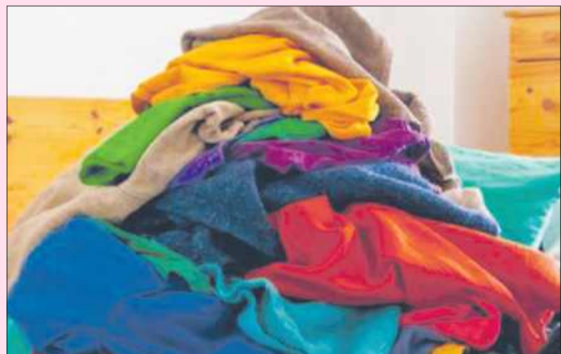
Starych, zużytych ubrań już nie wyrzucimy do kosza.

Wprowadzenie obowiązku segregacji tekstyliów to krok w stronę bardziej