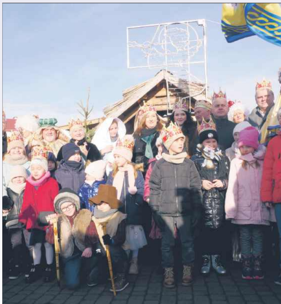
Pamiątkowe zdjęcie ze Świętą Rodziną i Trzema Królami.