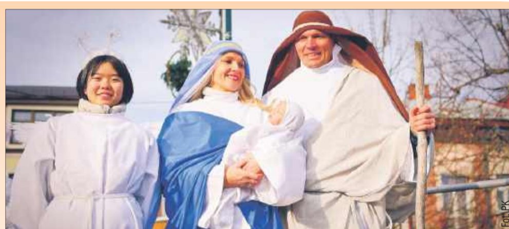
Święta Rodzina ze skrzydlatym posłańcem.