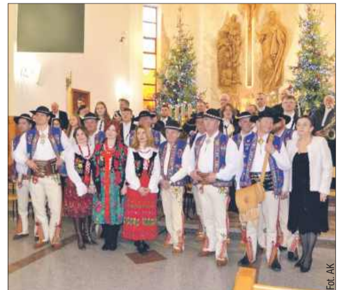
Wydarzenie było doskonałą okazją do wspólnego świętowania Bożego Narodzenia poprzez muzykę i śpiew.

Koncert w Rzochowie był nie tylko okazją do wspólnego śpiewu i celebracji Bożego Narodzenia, ale również przypomnieniem o wartości tradycji i wspólnoty. Dźwięki orkiestry i głosy flisaków pozostaną w pamięci uczestników na długo. AK