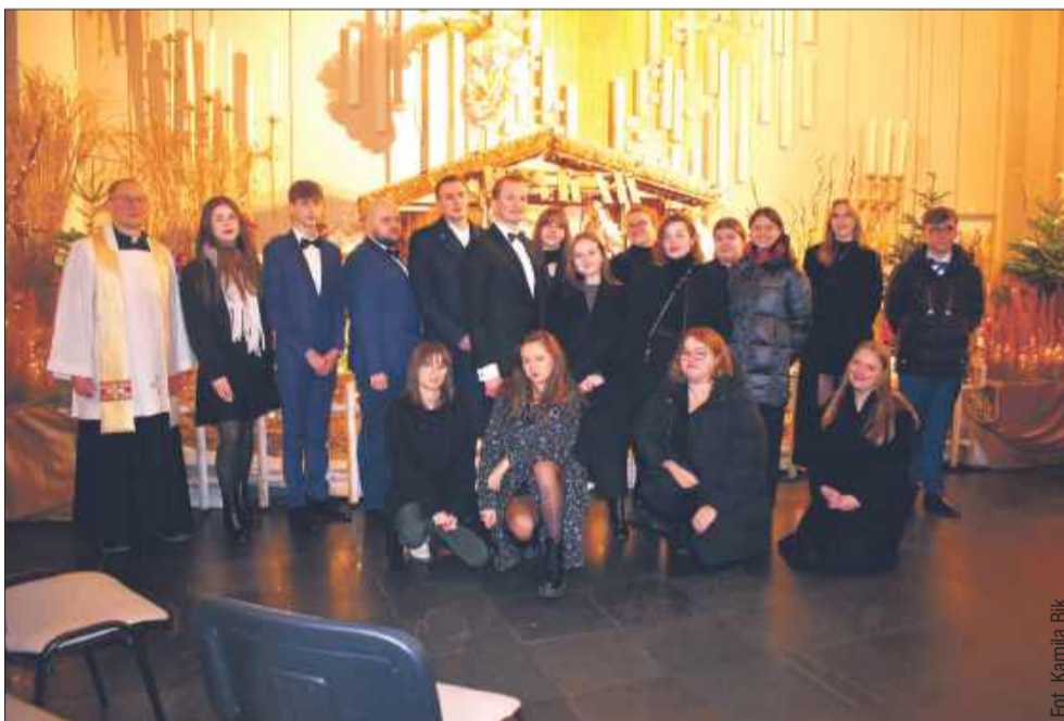
Grupowe zdjęcie po pasterce.

– To piękny opis wydarzeń w niebie, który skłania do głębszej refleksji w tym szczególnym czasie oczekiwania – dodał Hyjek.