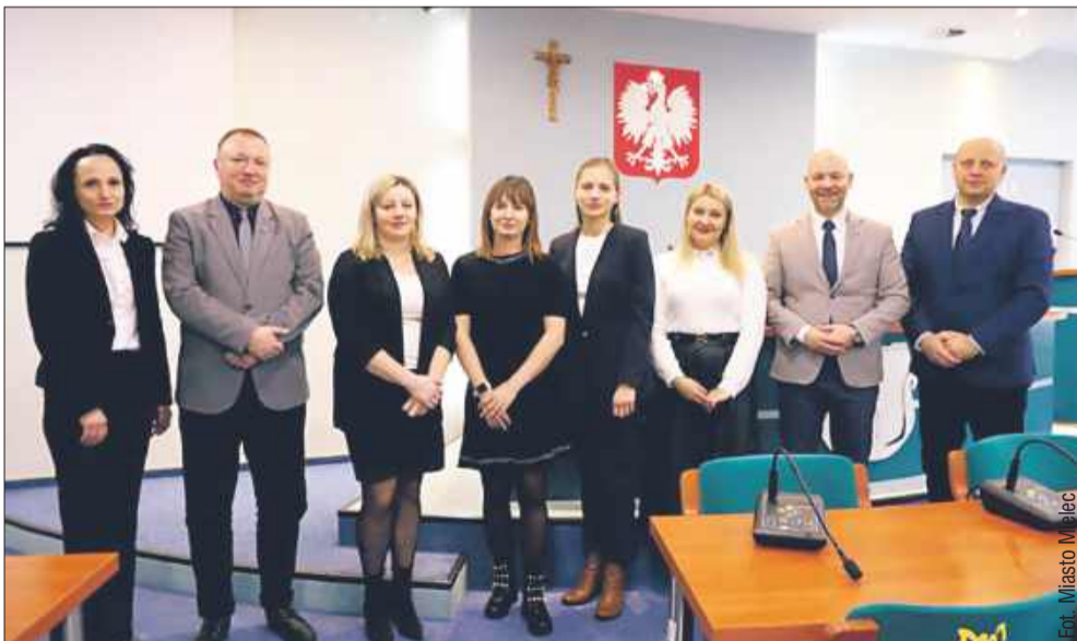
Serdecznie gratulujemy wszystkim wyróżnionym!

20 grudnia w Urzędzie Miejskim w Mielcu odbyła się uroczystość wręczenia aktów nadania stopnia awansu zawodowego nauczyciela