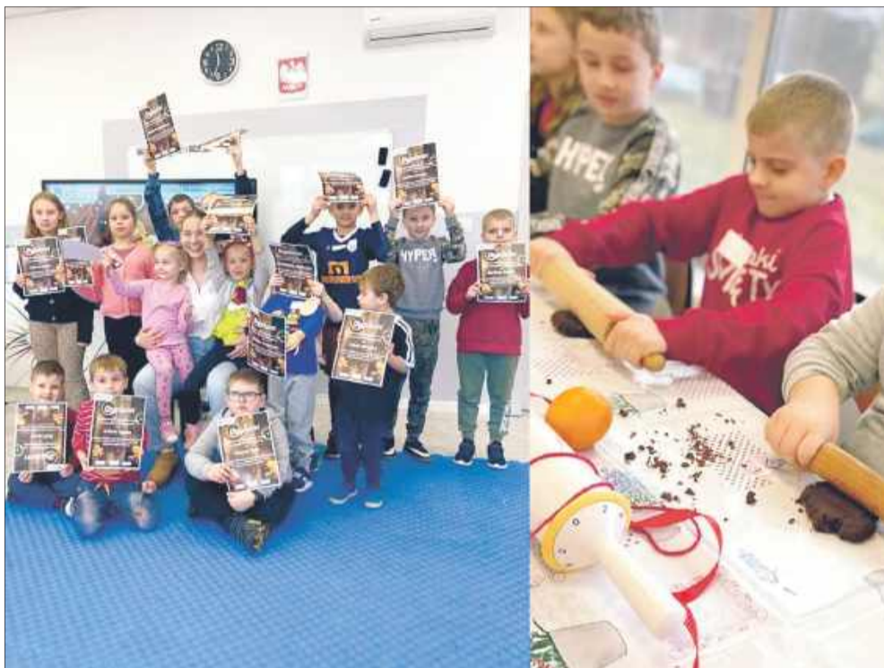
Mali uczestnicy warsztatów własnoręcznie przygotowali zdrowe pierniczki.

Tuż przed świętami Akademia Twórczego Rozwoju Bystrzak w Mielcu zaprosiła najmłodszych mieszkańców miasta do wspólnego celebrowania zbliżających się świąt.