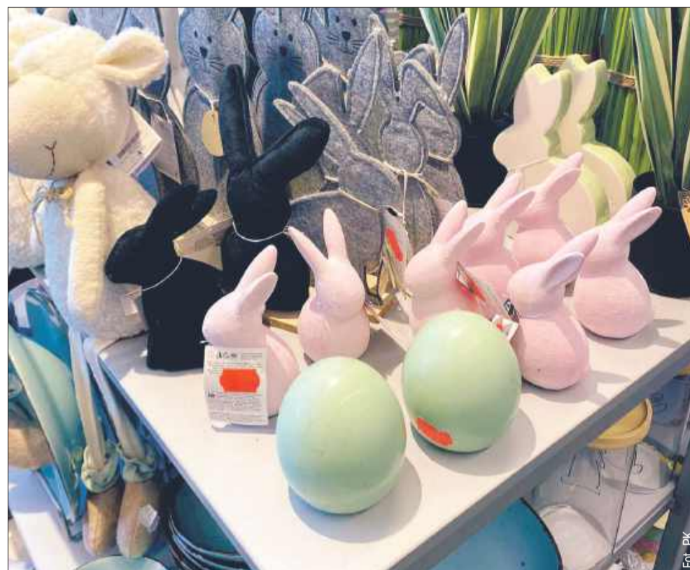
Czy warto przyspieszać czas?