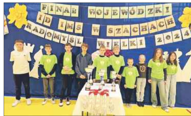
Oto nasze młode talenty szachowe.