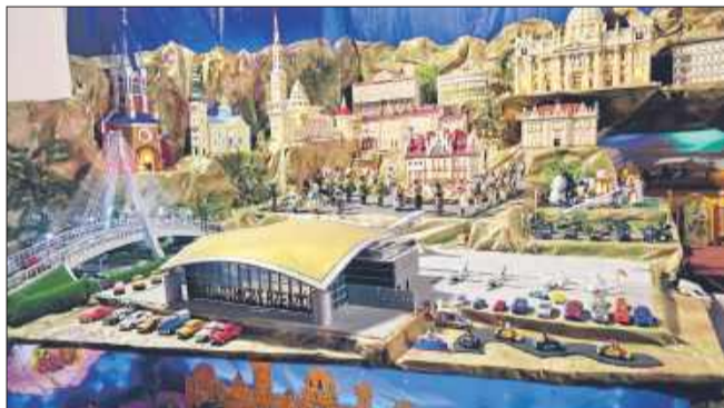
Gigantyczna szopka w Kielanówce zachwyca ruchomymi elementami.

Tradycja budowania szopki w kościele św. Urszuli Ledóchowskiej w Kielanówce koło Rzeszowa stała się integralną częścią świąt na Podkarpaciu. Początkowo skromna dekoracja przekształciła się w imponującą instalację, uznawaną za największą ruchomą szopkę w regionie.