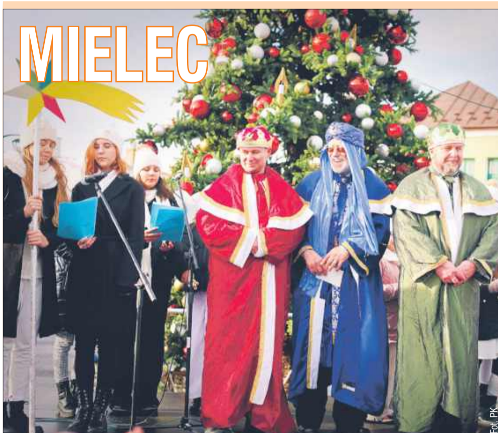
Radosny tłum na ulicach – Orszak Trzech Króli łączy pokolenia w świątecznym świętowaniu.

Nie pozostaje nic innego, jak z niecierpliwością oczekiwać przyszłorocznych orszaków, które z pewnością będą równie piękne i wyjątkowe. Redakcja