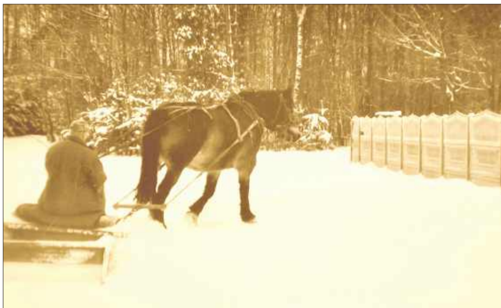
Dziś sprzęt do odśnieżania mamy trochę lepszy.