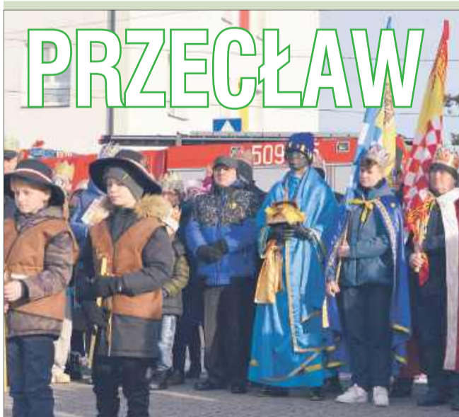
Mali pastuszkowie w Orszaku Trzech Króli.