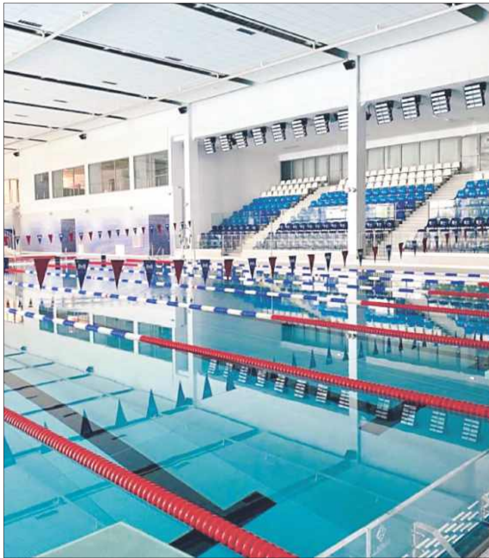
12-letnia dziewczynka została znaleziona na dnie dużej niecki basenowej w stanie bez oznak życia.

Przesłuchano także cały personel basenu, ratowników oraz kobietę, która jako pierwsza zauważyła ciało dziewczynki pod wodą i zawiadomiła obsługę. W śledztwie uczestniczą