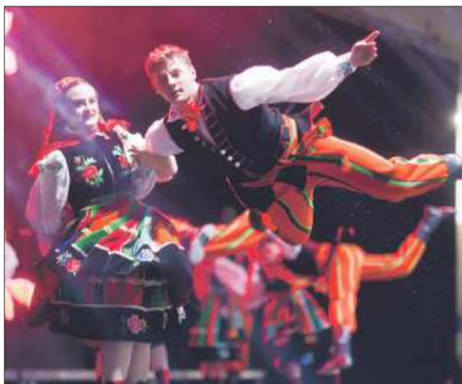
Publiczność mogła podziwiać bogactwo polskiego folkloru.

Podczas przerwy uczestnicy mogli obejrzyć wystawę zdjęć oraz film dokumentujący ponad 70-letnią historię zespołu. Występy „Rzeszowiaczków” nie tylko przywołały wspomnienia, ale także udowodniły, że tradycja polskiego folkloru wciąż ma się świetnie. Wielu widzów, w tym byłych członków zespołu, nie