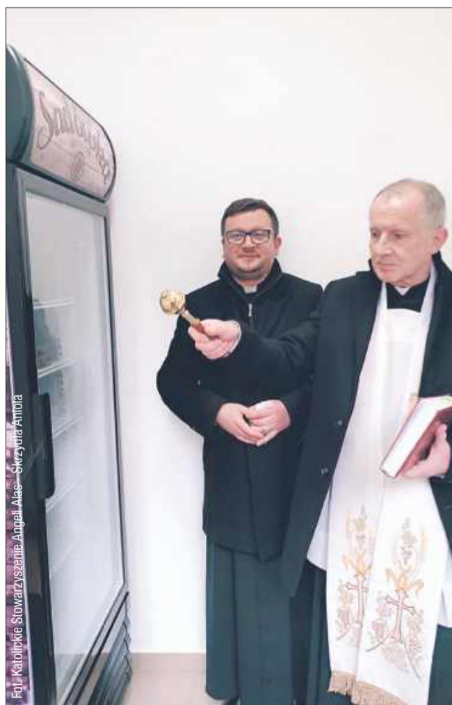
Pomysłodawcą i głównym organizatorem jadłodzielni jest Katolickie Stowarzyszenie Anieli Alas – Skrzydła Anioła.

Jadłodzielnia czynna jest codziennie od godziny 6:00 do