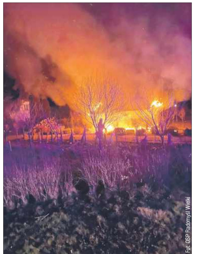
Cała szopka była objęta ogniem.

W nocy z 24 na 25 grudnia, gdy większość mieszkańców spędzała czas w gronie rodziny, strażacy zostali wezwani do akcji gaśniczej. O godzinie 3:53 służby ratownicze zostały zadysponowane dwoma zastępami do pożaru wiaty z ozdobami świątecznymi.