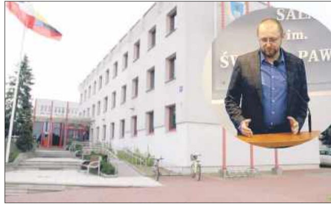
Zmiana na stanowisku skarbnika miasta Mielca to ważny moment w funkcjonowaniu magistratu.