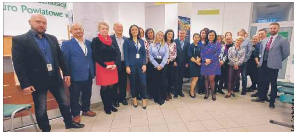
Mieleckie Biuro Powiatowe ARiMR.

Dzięki 30-letniej działalności ARiMR polska wieś przeszła ogromne zmiany. Środki przekazane beneficjentom umożliwiły modernizację gospodarstw, rozwój przetwórstwa i poprawę jakości życia na terenach wiejskich. Jubileusz Agencji to doskonała okazja, by podkreślić jej znaczenie w rozwoju rolnictwa oraz zrównoważonego rozwoju obszarów wiejskich w Polsce. MW