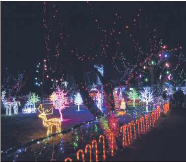
Każde drzewo, każda gałązka opleciona jest światłkami.