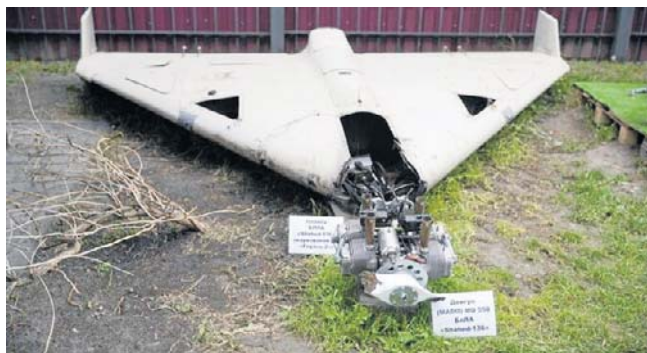
Turyści boją się incydentów z dronami

- Jak tylko dochodzi do jakiegось incydentu przy wschodniej granicy, turyści od razu anulują pobyt i mówią wprost, że chodzi o drony - powiedziała właścicielka pensjonatu hotelowego w Bołowsku (łot. Balvi), położonego kilka kilometrów od granicy z Rosją. W maju ub. roku gospodyni miała zarezer-