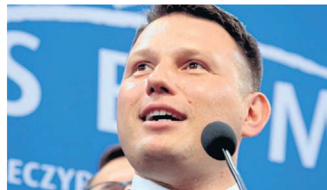
Sławomir Mentzen opublikował w serwisie X bezkompromisowy i niezwykle ostry wpis, uderzający w podstawowe założenia rządowego dokumentu

Podczas konferencji prasowej w Sejmie politycy Konfederacji – poseł Michał Wawer i rzecznik partii Wojciech Machulski – wezwali wszystkie ugrupowania do odwołania ze stanowiska Marty Cienkowskiej i zapowiedzieli rozpoczęcie zbiórki podpisów pod wnioskiem o wotum nieufności wobec minister kultury.