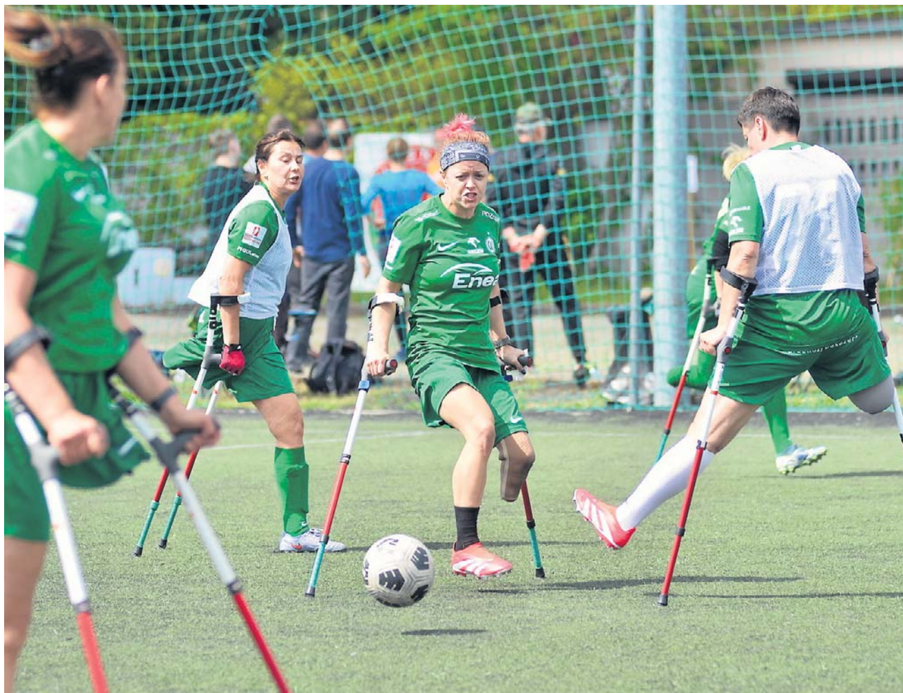
Amp futbol w Warcie Poznań rozwija się od 2019 roku. Klub prowadzi dziś zarówno męską, jak i kobiecą drużynę

- Tu jest większe zrozumienie. Kiedy nie ma się kończyny, ciało funkcjonuje nierówno. Jedna strona przejmuje więcej, druga jest słabsza. Dopiero przy treningach siłowych za-