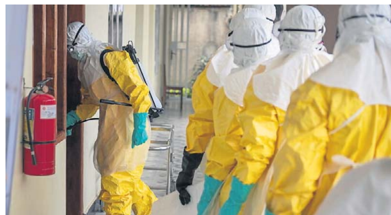
26 MAJA, AFRYKA. Zanotowano już ponad 200 ofiar śmiertelnych wirusa Ebola, która pojawił się w maju w Ugandzie i Demokratycznej Republice Konga. Wpłyne to na ruch turystyczny i na piłkarski Mundial