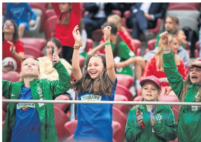
W dniach 1-3 czerwca nastąpi długo oczekiwany Finał Ogólnopolski Pucharu Tymbark. Zagrają 64 drużyny

Wreszcie w dniach od 1 do 3 czerwca nastąpi długo oczekiwany Finał Ogólnopolski. Do stolicy zjadą 64 najlepsze drużyny reprezentujące wszystkie województwa, aby dobrze się bawić, ale też zawalczyć o tytuł najlepszej w kraju. Wielki Finał XXVI