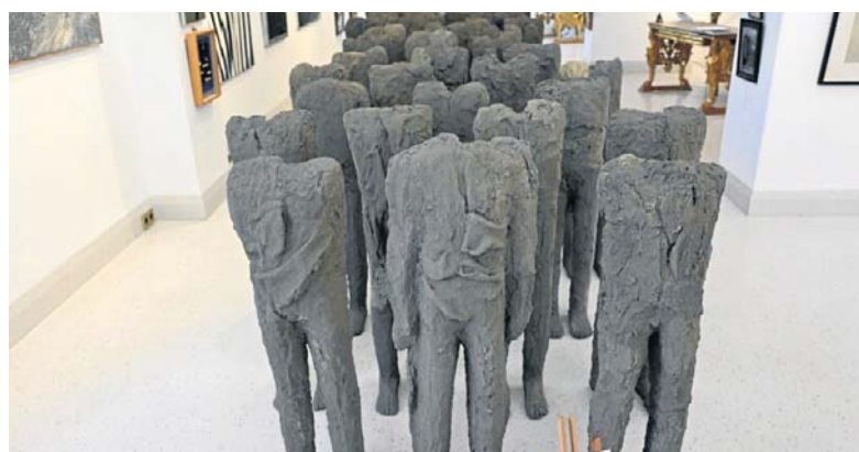
26 MAJA, WARSZAWA. To może być rekord. Na aukcję trafiła praca Magdaleny Abakanowicz „Bambini”. Składa się z 83 figur dzieci, a jej wartość szacuje się na 14-18 mln zł. Obecny rekord to 6,89 mln zł