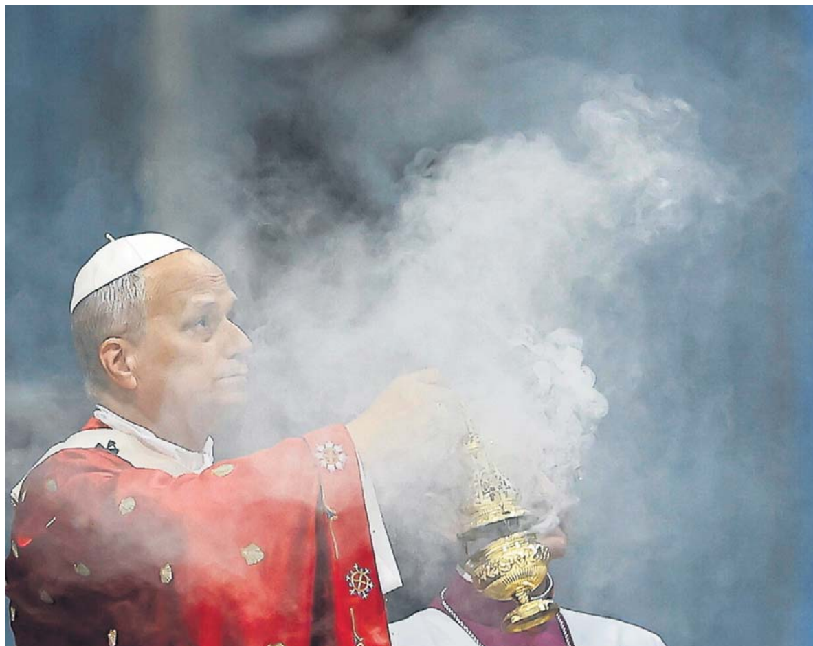
25 MAJA, WATYKAN. Leon XIV opublikował swoją pierwszą encyklikę. Dokument nosi nazwę „Magnifica humanitas” i jest w dużej mierze poświęcony sztucznej inteligencji. Papież podkreślił w niej, że nowa wirtualna rzeczywistość powinna być dostępna po równo dla wszystkich - nie tylko dla najbogatszych