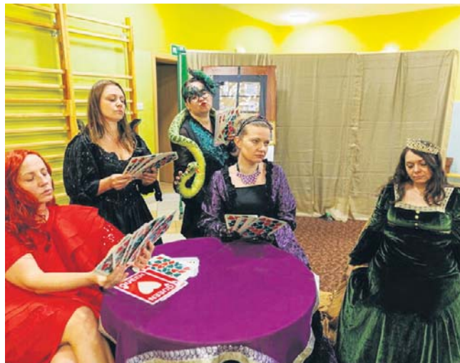
Teatr Rodziców połączył ludzi bardzo różnych profesji, którzy na scenie czują się jak ryby w wodzie

- Najstarsza córka grała w poprzednich spektaklach i to kilkakrotnie. W tym roku już nie gra, natomiast na scenie jest ze mną środkowa córka, która