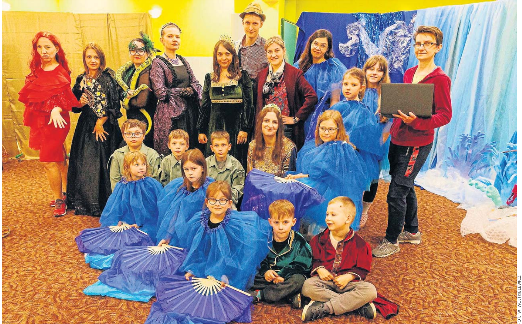
Spektakl rodzice wystawiają razem ze swoimi dziećmi, ale też z absolwentami przedszkola i ich rodzinami