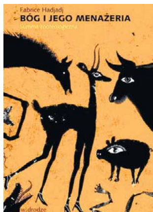
Fabrice Hadjadj, „Bóg i jego menażeria. Summa zooteologiczna”, wyd. W drodze, Poznań 2026, cena 49,90 zł