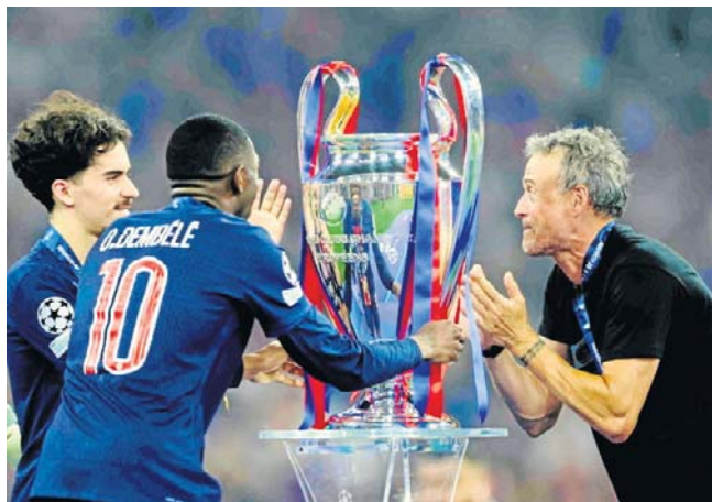
Vitinha, Ousmane Dembele i trener Luis Enrique zamierzają obronić zeszłoroczne trofeum Ligi Mistrzów