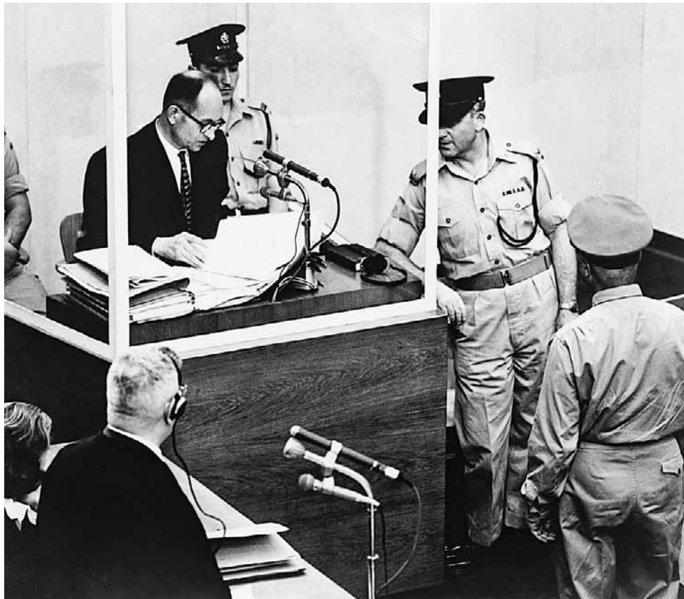
Na procesie było obecnych 700 dziennikarzy z całego świata. Wielu publicystów uznało proces za zbyt zbiurokratyzowany i niepokazujący całego zła Eichmanna