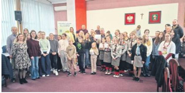
4 listopada w sali konferencyjnej Urzędu Miasta Tomaszów Lubelski podsumowano tegoroczną kwestę na rzecz ratowania żołnierskich grobów i miejsc pamięci.