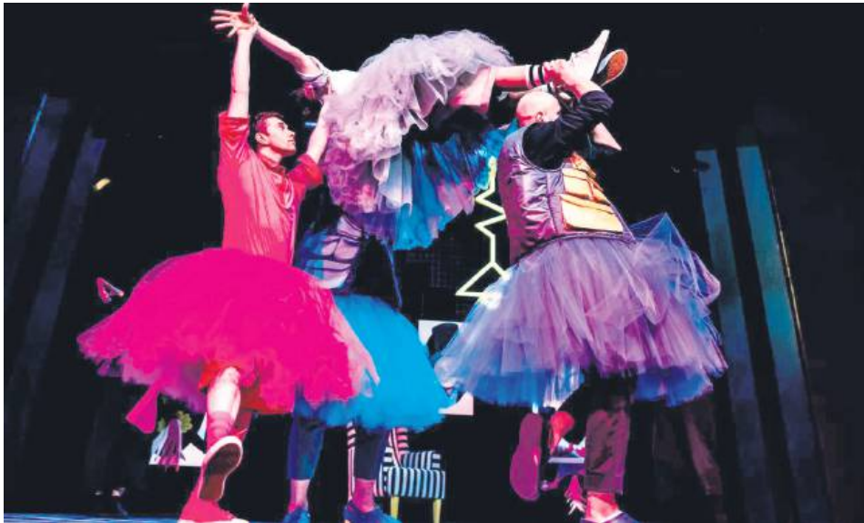
Spektakl „Mój cień jest różowy” Teatru Pinokio z Łodzi.