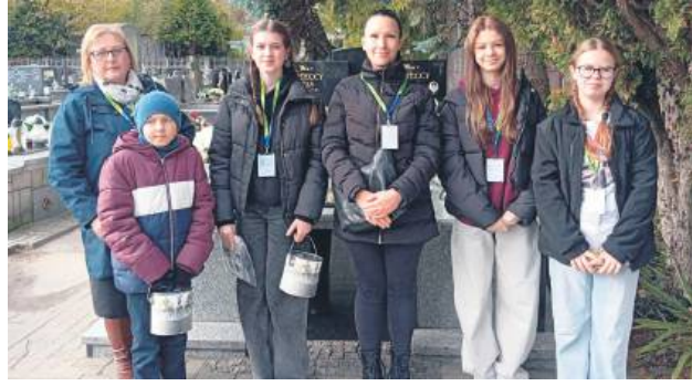
Około 180 wolontariuszy kwestowało w tym roku na tomaszowskich cmentarzach.

Do tej pory, dzięki ofiarności mieszkańców, udało się przywrócić godny wygląd wielu mogiłom oraz pomnikom