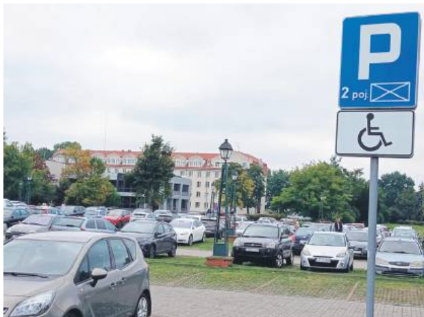
Na parkingu przy Lunecie opłaty mają być pobierane w sezonie turystycznym, a więc od 1 kwietnia do 30 września.