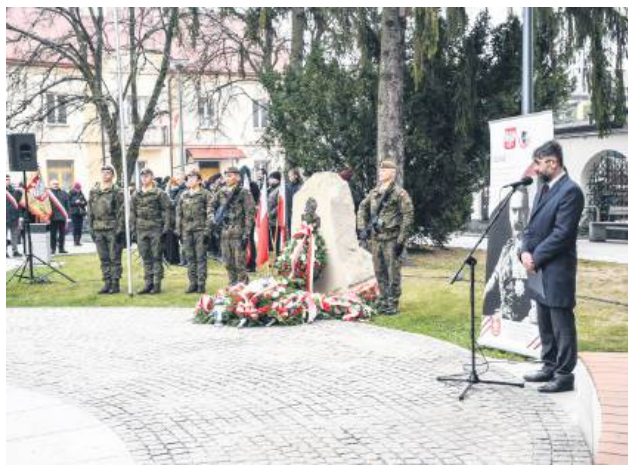
Skwer przy zbiegu głównych ulic w mieście ma swoją nazwę.

Z inicjatywą nadania nazwy wystąpiła Rada Osiedla Śródmieście, działając w imieniu mieszkańców. Wniosek został złożony 26 września br. i uzasadniony znaczeniem historycznym oraz symbolicznym tego miejsca. Jak podkreślono, proponowana nazwa ma nawiązywać do Narodowego Święta Niepodległości obchodzonego 11 listopada, które upamiętnia odzyskanie przez Polskę wolności w 1918 roku po 123 latach zaborów.