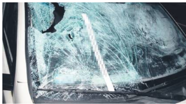
W Łabuńkach Pierwszych na drodze krajowej numer 17 kierujący fiatem podczas wymijania innego pojazdu potrafił mężczyźną.