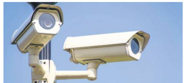
W Biłgoraju powstanie system monitoringu.

W ramach inwestycji powstanie 18 nowych punktów kamerowych, a na terenie miasta zostanie zainstalowanych 100 kamer wysokiej rozdzielczości. Obraz z urządzeń trafi do nowo powstałego Centrum Monitoringu Wizyjnego przy ul. Kościuszki 6. Montaż kamer został poprzedzony audytem bezpieczeństwa oraz konsultacjami z Komendą