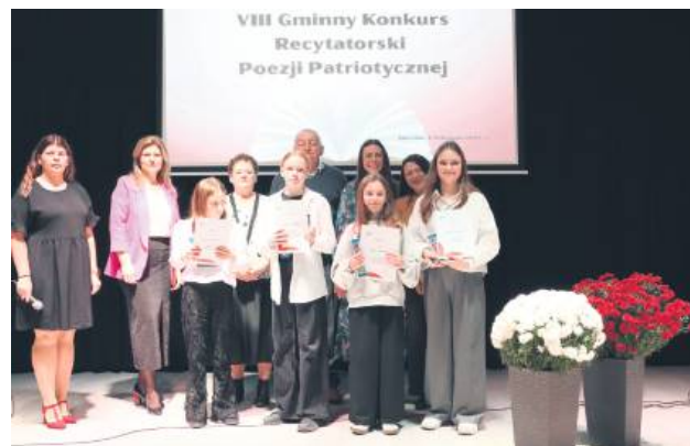
Laureaci VIII Gminnego Konkursu Recytatorskiego Poezji Patriotycznej.

Wszyscy zaprezentowali wysoki poziom artystyczny, wielu zaimponowało jurorom swoją wrażliwością i dojrzałością interpretacyjną. Nie wszyscy mo-