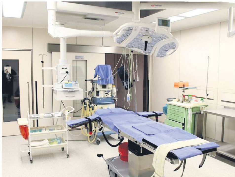
Sala do cięć cesarskich.

W ubiegłym roku, w całorocznym podsumowaniu ankiety „Rodzić po ludzku”, Oddział Położniczy w Szpitalu Powiatowym w Hrubieszowie drugi raz z rzędu znalazł się wśród dziesięciu najlepszych porodówek w całej Polsce,