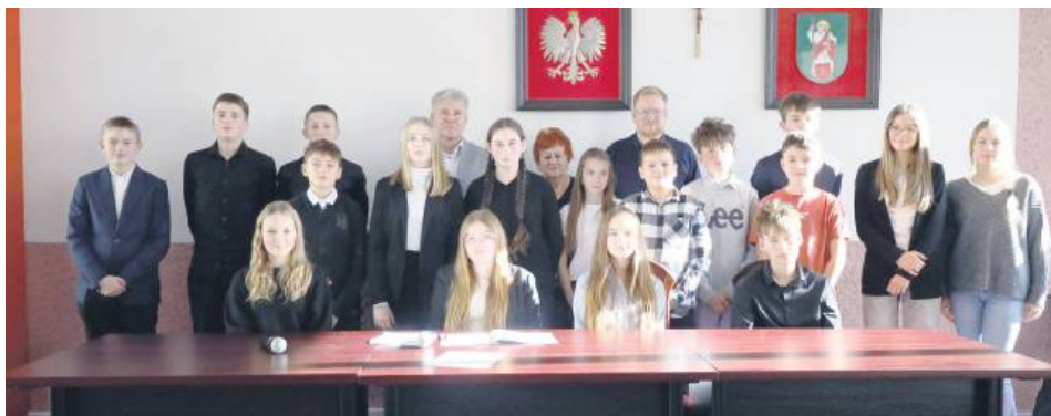
Młodzieżowa Rada Miasta w Tomaszowie Lubelskim VIII kadencji.