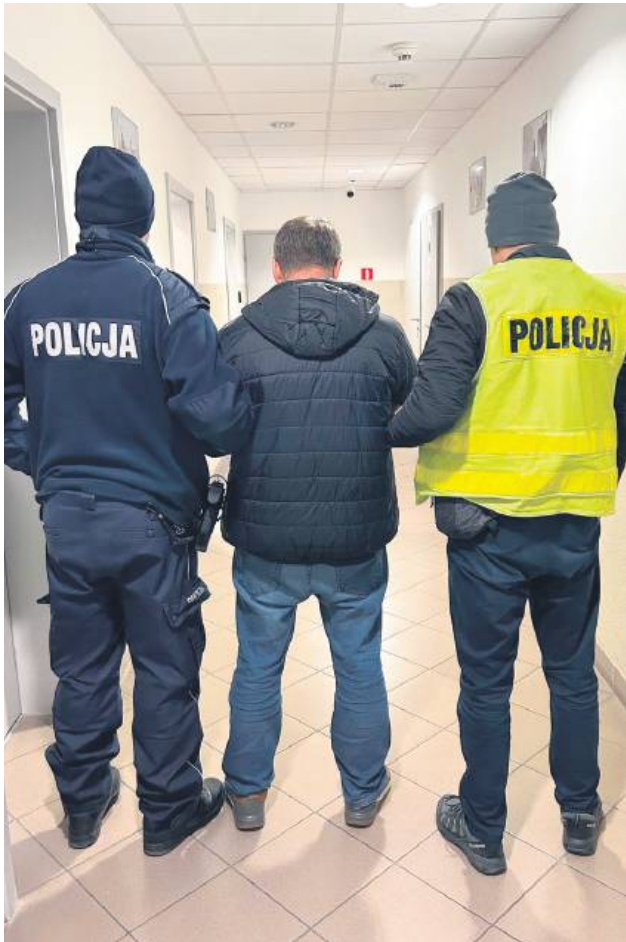
Za kilka kradzieży w supermarkecie w Dołhobyczowie 55-latek został deportowany na Ukrainę z 5-letnim zakazem wjazdu do Polski oraz do państw strefy Schengen.

– Policjanci z posterunku policji otrzymali zgłoszenie o kradzieży produktów spożywczych o łącznej wartości 3 tys. zł. Na miejscu funkcjonariusze ustalili, że sprawcą kradzieży jest 55-letni obywatel Ukrainy. Jak się okazało, mężczyzna działając w krótkich odstępach czasu, przy wykorzystaniu tej samej sposobności, w tym