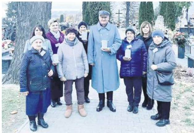
Na cmentarzu kwestowali m.in. burmistrz i seniorki.

Po krótkiej przerwie, w tym roku 1 i 2 listopada na tyszowieckim cmentarzu znów odbyła się kwesta. Organizatorami zbiórki byli burmistrz Tyszowiec oraz Stowarzyszenie Rozwoju Ziemi Tyszowieckiej. Jak podkreślają inicjatorzy akcji,