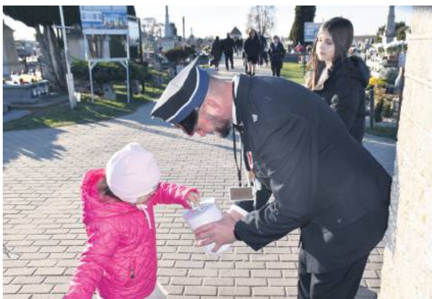
W Łukowej kwestowano już po raz 24.

Już od 24 lat w gminie Łukowa działa Społeczny Komitet Opieki nad Cmentarzami, powstały z inicjatywy mieszkańców, którzy wzorowali się na szlachetnej działalności Jerzego Waldorfa – twórcy idei kwest na warszawskich Powązkach. Celem Komitetu jest społeczna opieka nad zabytkami cmentarnymi: ich konserwacja,