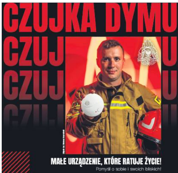
Czujka dymu wykrywa zagrożenie już w pierwszych sekundach pożaru i daje czas na bezpieczną ewakuację.

trujący gaz, niewyczuwalny przez ludzkie zmysły. Ani go nie usły-