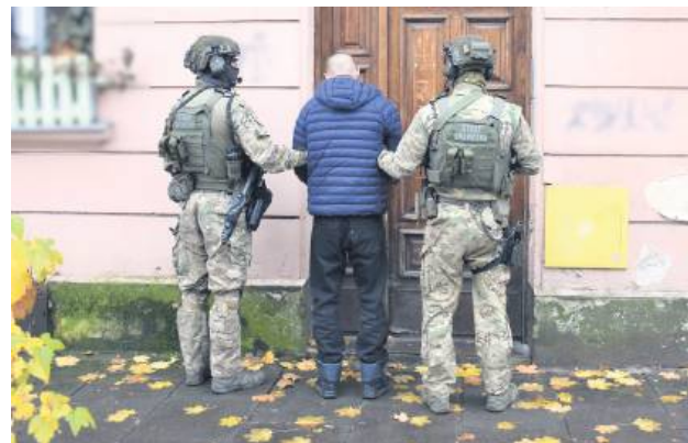
29-letni Ukrainiec organizował przerzut przez „zieloną granicę” tym, którzy mu za to zapłacili. Za to został deportowany z Polski.

– Funkcjonariusze z Placówki Straży Granicznej w Do-