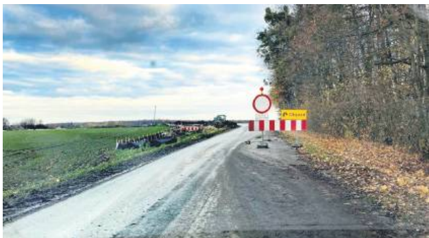
Od 12 listopada zakaz ruchu nie będzie dotyczył mieszkańców gmin Łabunie i Komarów-Osada oraz pojazdów służb ratunkowych i transportu zbiorowego.

O zmianę wnioskował wójt gm. Łabunie Mariusz Kukielka jeszcze przed wpro-