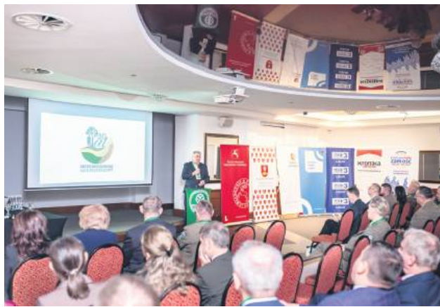
Konferencja odbyła się w dniach 28-29 października.