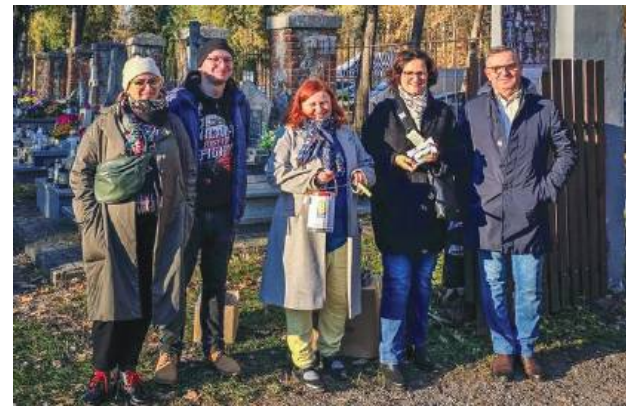
W Zwierzyńcu zbierano pieniądze we Wszystkich Świętych i Dzień Zaduszny.

ul. Peowiaków kwestowało 1 listopada blisko 100 osób, w tym samorządowcy, politycy, przedstawiciele oświaty, instytucji kultury, sportu, harcerze, a także przedsiębiorcy oraz dziennikarze. Po podliczeniu wszystkich pieniędzy okazało się, że do puszek trafiło 28 655,88 zł, czyli nieco mniej niż w poprzednich dwóch latach, kiedy udawało się zbierać ponad 30 tys. zł. Przypomnijmy, że zbiórkę zorganizował po raz 19. Społeczny Komitet Odnowy Cmentarza Parafialnego. Dzięki dotychczasowym akcjom udało się odnowić ponad 40 nagrobków, przywracając im dawny wygląd.