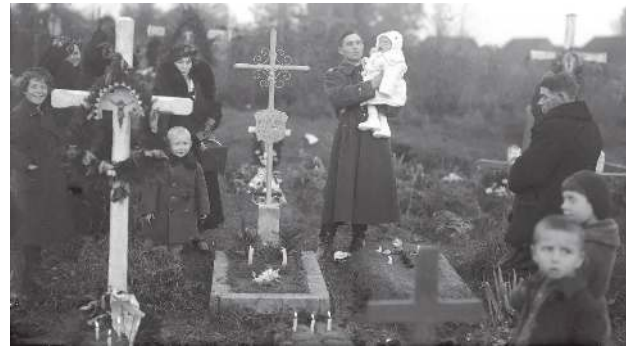
Obchody dnia Wszystkich Świętych na cmentarzu w Garwolinie w 1935 roku.

Trumny zbijano z sosnowych desek, niekiedy nawet drewnianymi gwoździami, by „zmarły mógł się z sądu Bożego wyostać”. Do środka wkładano różaniec, obrazek, czasem tabakierkę lub laskę. Gdy umierała panna, ubierano