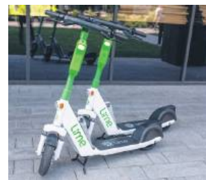
Hulajnogi Lime pojawiły się w Zamościu w 2022 r.

Hulajnogi Lime są dostępne w Warszawie i okolicach, Poznaniu, Wrocławiu, Krakowie, Łodzi oraz Zamościu. Firma będzie monitorowała warunki atmosferyczne i w zależności od nich oraz zapotrzebowania na usługę strefa będzie mogła