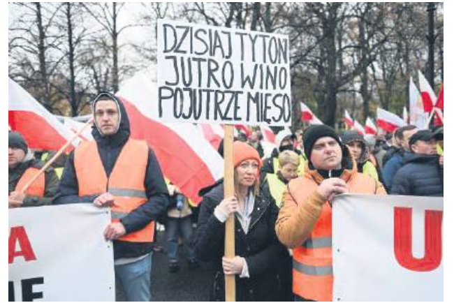
Symbolicznym gestem było wręczenie beli tytoniu owiniętej w czarny kir – znaku żałoby po przyszłości polskiej wsi i rodzimej produkcji.

– Rząd musi stanąć w obronie rolników. Mówimy NIE dla