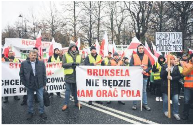
Podczas manifestacji plantatorzy przekazali premierowi petycję, w której domagają się odrzucenia niekorzystnych pomysłów WHO i KE oraz aktywnej obrony interesów polskich rolników.