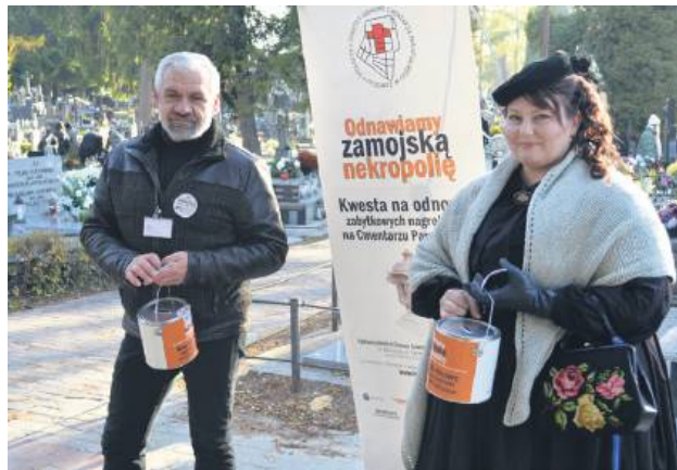
Kwesta w Zamościu.