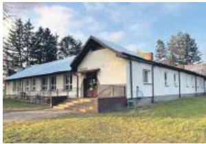
Regionalne Centrum Edukacji Ekologicznej – „Skarb Czarnoziemu” powstanie w budynku po dawnej podstawówce w Ślipczu (Gmina Hrubieszów).

Hrubieszów coraz bardziej intensywnie przymierza się do realizacji wielopłaszczyznowego projektu partnerskiego pn. „Rezylienty Hrubieszów”