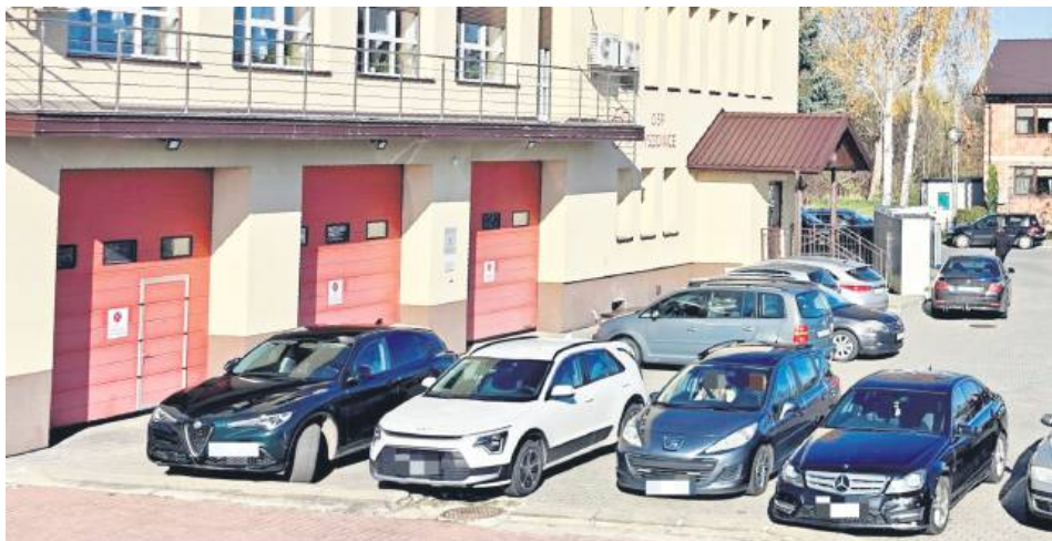
Tyszowce, 1 listopada. Strażacy zablokowani przez kierowców.

Fakt, czy kierowcy byli mieszkańcami, czy przyjezdnymi, nie ma w tym przypadku znaczenia, ponieważ każdy powinien wiedzieć, gdzie nie wolno parkować.