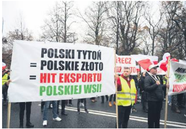
Plantatorzy sprzeciwiają się planom Światowej Organizacji Zdrowia (WHO) oraz Komisji Europejskiej.