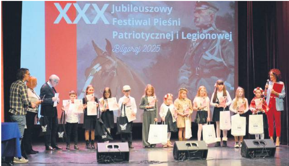
Najlepsi wokaliści otrzymali nagrody i wyróżnienia.