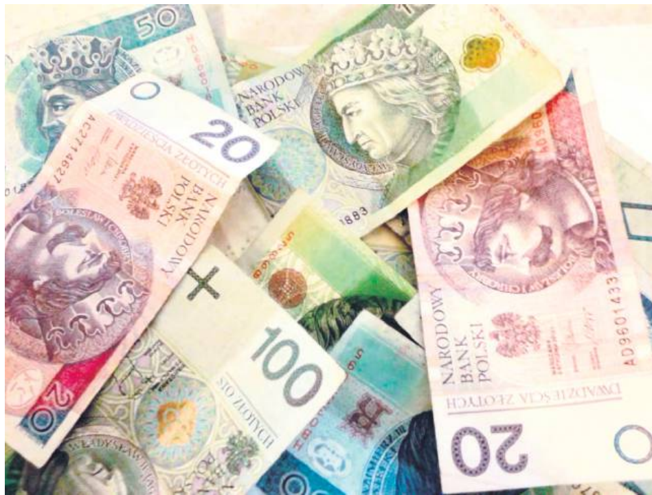
Dzięki podwyżce stawek do budżetu trafi około 2,5 mln zł.

Janusz Wójcik mówił wprost, że podniesienie podatku to zła decyzja w trudnym czasie. – Po raz pierwszy od kilkunastu lat podatki podniesiono w maju 2023 roku. Miasto wcześniej rozwijało się dynamicznie bez