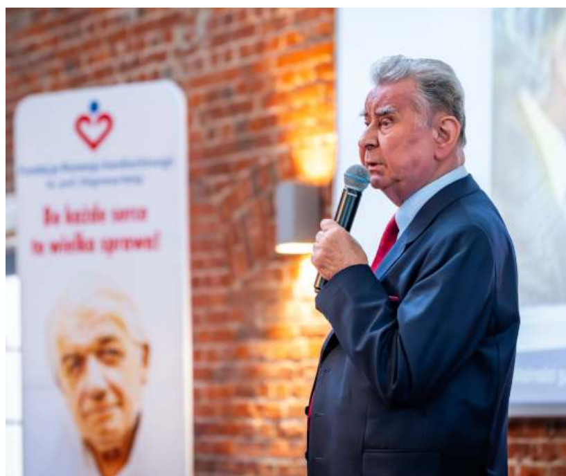
Fot. Paweł Janicki(2)