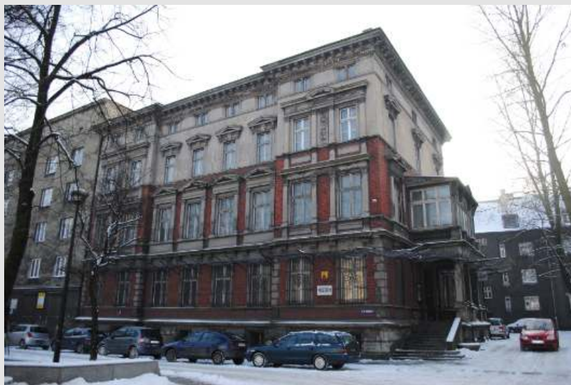
Fot. Muzeum Miejskie w Zabrzu(2)

W tym czasie muzeum było wielodziałowe i tak też ostatecznie wyglądać miała organizowana ekspozycja. Przystąpiono również do sprzątania sal wystawowych i podstawowego remontu kamienicy, który gwarantowałby bezpieczeństwo ludzi i zbiorów. Zadania te wymagały dużego nakładu pracy i nie małego zaangażowania muzealników.