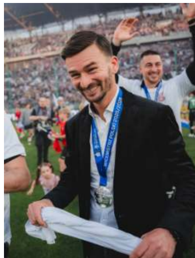
Fot. Górnik Zabrze (7)

Zdobycie wicemistrzostwa Polski oznacza, że Górnik zagra w eliminacjach Ligi Mistrzów. Z kim przyjdzie mu się zmierzyć, dowiemy się po zaplanowanym na 17 czerwca loso-