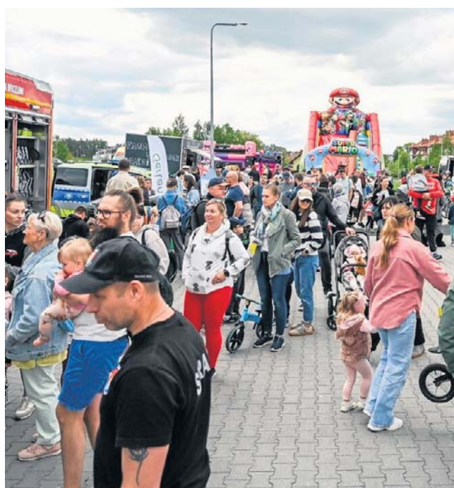
Młodzi uczestnicy zawodów i ich rodziny nie narzekali na nudę. Każdy mógł tu znaleźć coś dla siebie

- Z przyjemnością uczestniczymy w takich zawodach. Mamy też nadzieję, że to nie są