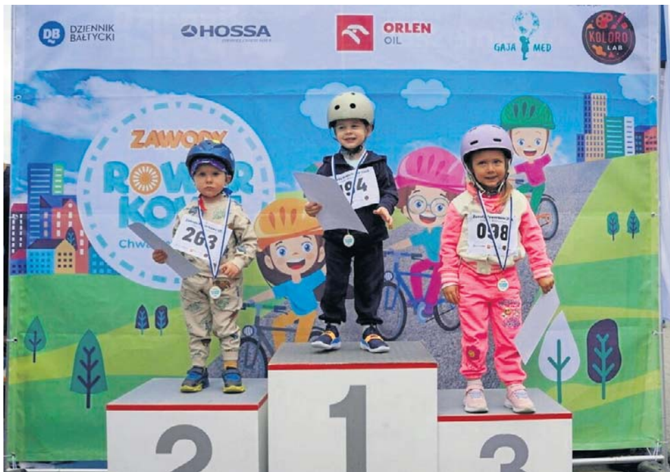
Pierwsze sportowe osiągnięcia, pierwsze dyplomy i medale...