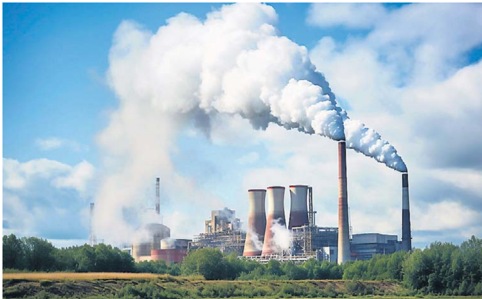
System ciepłowniczy w Polsce wymaga ogromnych nakładów inwestycyjnych

Jak wskazuje, pierwsze wdrożenia mogą pojawić się szybciej, niż zakłada część rynku. - Jeden z takich projektów ma być odpalony do końca tej dekady w Helsinkach. Więc to nie jest coś bardzo odległego na zasadzie to może 2040 czy 50? Nie, to pod koniec tej dekady ma być