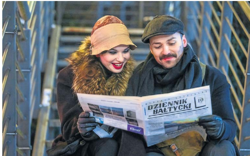
W tym roku wydaliśmy m.in. dodatek na setne urodziny Gdyni

Mariusz Leśniewski mariusz.lesniewski@polskapress.pl