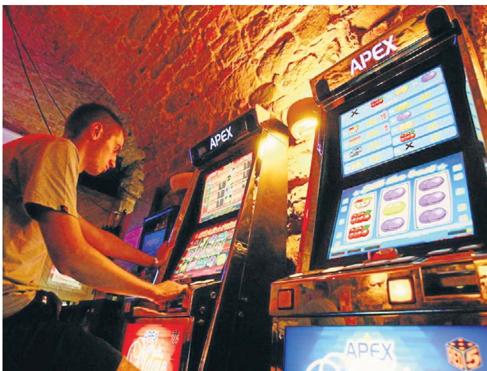
Ekspert alarmuje, że do nielegalnych operatorów hazardowych trafia nawet 15 miliardów złotych rocznie

– Skala zjawiska jest dziś wręcz porażająca. W Polsce funkcjonuje jedno legalne kasyno online, a obok niego działają tysiące nielegalnych stron dostępnych praktycznie bez żadnych ograniczeń. Co roku korzystają z nich miliony użytkowników, w tym również bardzo młodzi ludzie i nastolatki. Problem nie sprowadza się wyłącznie do utraty pieniędzy.