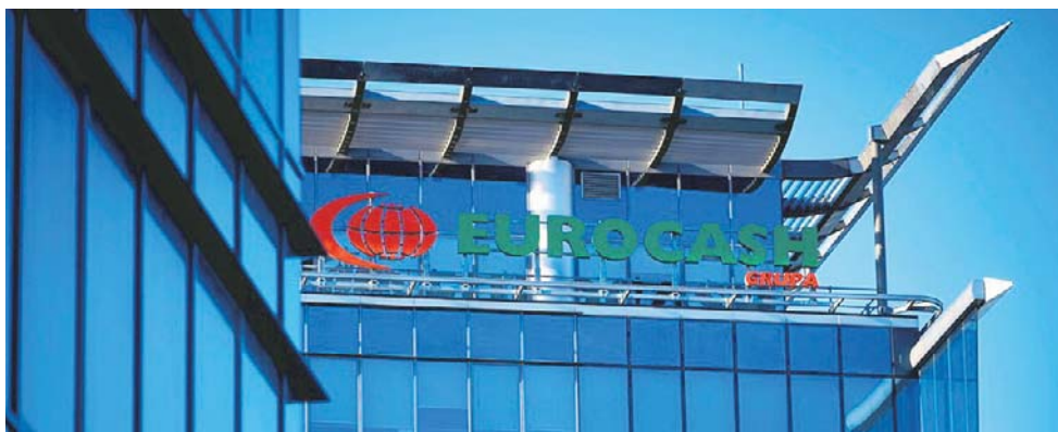
Eurocash zrzesza ponad 15 tys. placówek działających pod różnymi markami w tym: Delikatesy Centrum

– Wyniki pierwszego kwartału potwierdzają, że obrany przez nas kierunek strategiczny jest właściwy. Choć sprzedaż Grupy spadła, było to w części świadomym efektem porządkowania portfela klientów niezależnych i koncentracji na bardziej rentownym, zintegrowanym modelu biznesowym. Jednocześnie utrzymaliśmy stabilną sprzedaż do klientów franczyzowych, którzy stanowią fundament naszej strategicznej przyszłości. Dzięki zdecydowa-