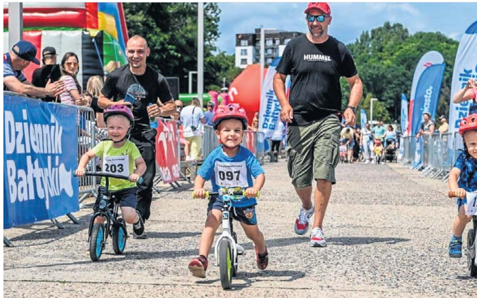
„Dziennik Bałtycki” jest organizatorem wielu imprez, m.in. zawodów rowerkowych