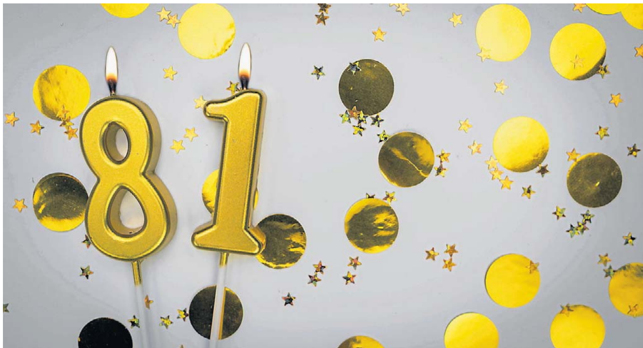
81. urodziny to okazja do świętowania, ale też refleksji o przyszłości, o tym, czego nam najbardziej dziś i jutro potrzeba

- Podarowałabym mieszkańcom tego unikalnego regionu na kolejne 81 lat absolutne bezpieczeństwo wodne i stabilność hydrologiczną. Żuław to rolnicze serce Polski, a ich największym skarbem są najżyźniejsze gleby - mady. Mój dar to systemowa gwarancja spokoju: najnowocześniejsza na świecie infrastruktura polderowa i stacje pomp, które działają w pełnej harmonii z naturą. Przez naj-