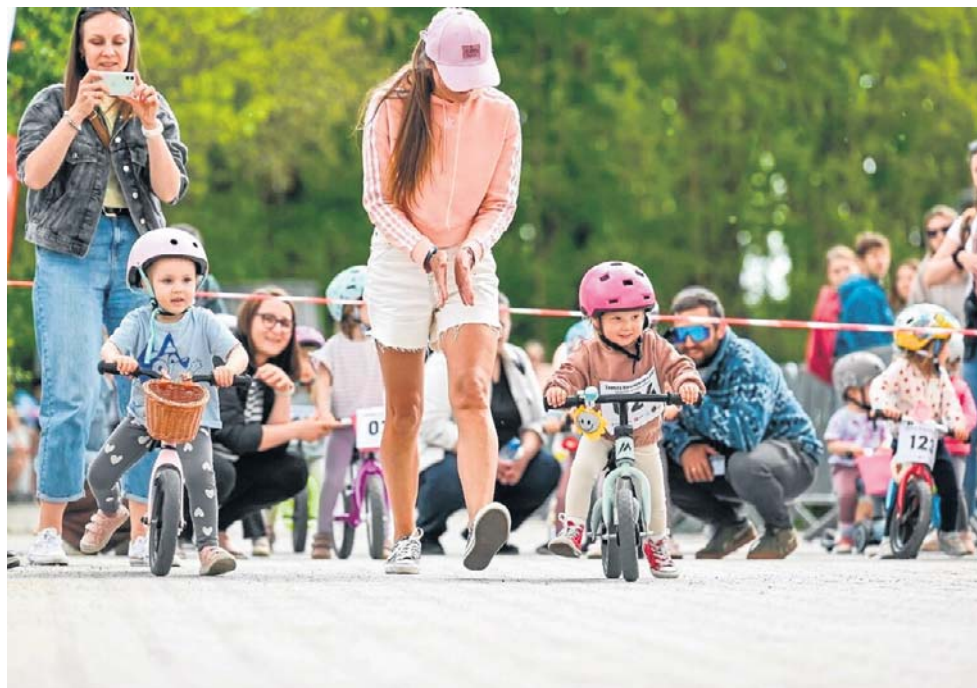
Na starcie potrzebna było koncentracja i... wsparcie mamy albo taty