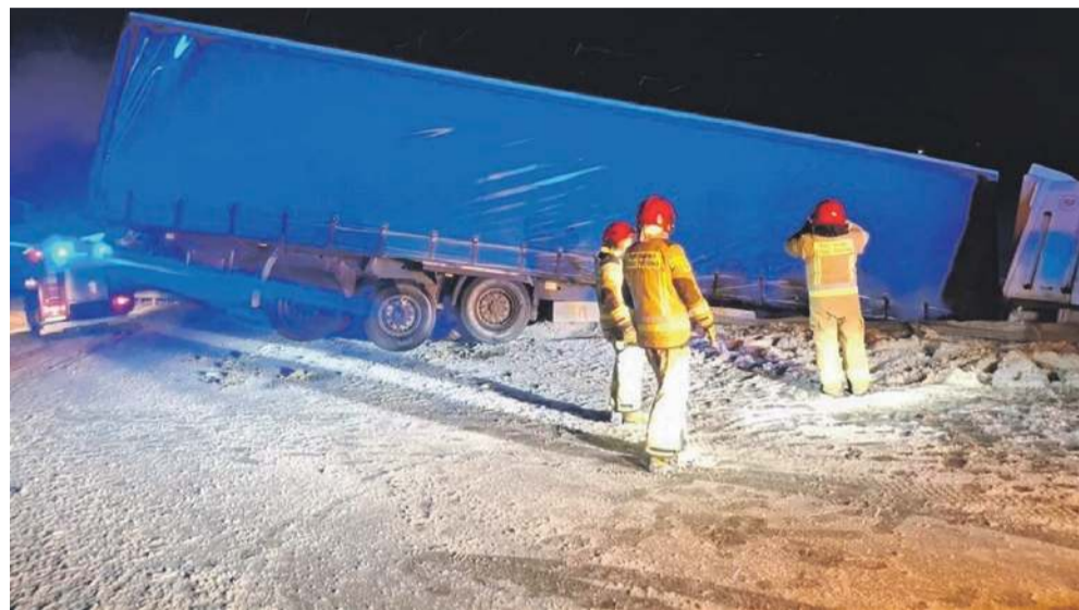
fol. Raporty Drogowe A1