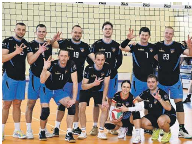
Drużyna Players VOLLEY TEAM - zdobywca III miejsca. Jeden z najbarwniejszych zespołów IV sezonu

char oraz medale. Za pierwsze trzy miejsca dodatkowo drużyny otrzymały vouchery na: 2000 zł, 1500 zł oraz 1000 zł.