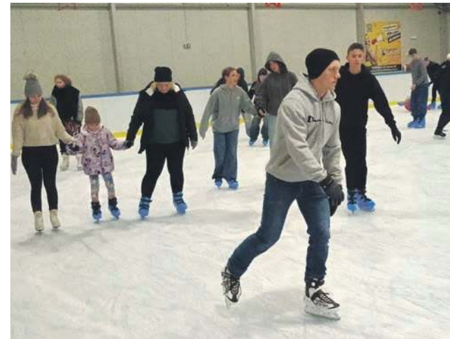
Chrzanowskie lodowisko było oblegane zwłaszcza w weekendy

- Ten sezon był zdecydowanie lepszy od poprzedniego (2023/2024), gdy odwiedziło nas ponad 46 tysięcy osób. Złożyło się na to kilka czynników, m.in. rosnąca popularność naszego obiektu oraz warunki atmosferyczne. Tej zimy lodowisko nie działało też w Jaworznie, więc mieliśmy większą liczbę korzystających z tego miasta. Z drugiej strony otwarto też lodowisko w Olkuszu, co jednak nie wpłynęło znacząco