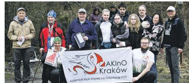
Uczestnicy przed pierwszym startem

Na trasie marszu znajdowało się kilkadziesiąt punktów, oznaczonych lampionami płaskimi z kredką, z których zespoły musiały wybrać kilkanaście poprawnych (zaznaczo-