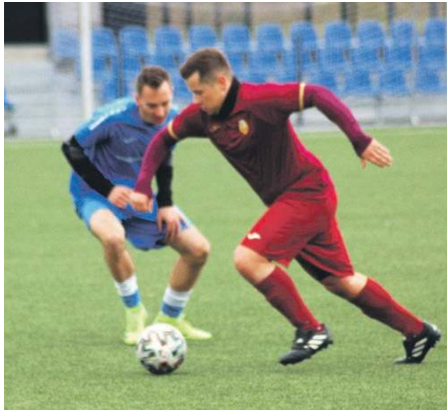
W ataku gracz Rozkochowa. Więcej zdjęć i wideo z tego meczu znajdziesz na przelom.pl