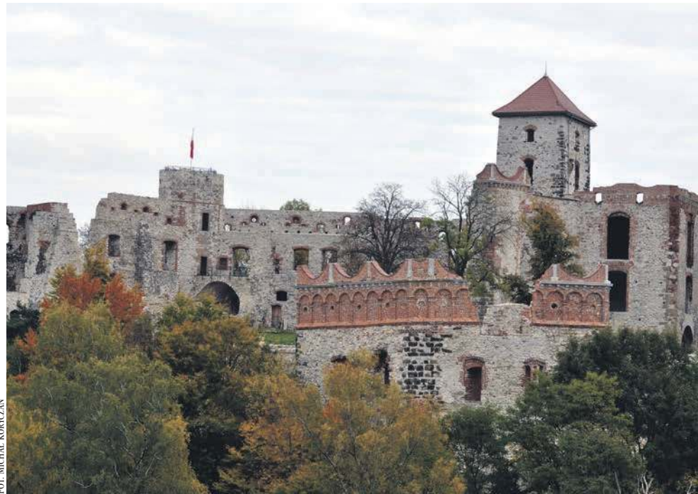
Zamek Tenczyn w Rudnie

urozmaicenie trasy turystycznej na zamku Tenczyn.