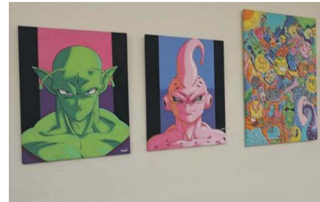
Takie i inne obrazy zdolnego mieszkańca Pogorzyc można zobaczyć na jego debiutanckiej wystawie

- Właściwie te zdolności ma naturalne. Miał tylko kilka lekcji z jednym artystą. Od ferii zimowych przychodzi na zajęcia do PMDK. Pod moim okiem już się więcej nie nauczy i potrzebuje profesjonalnego nauczyciela. Liczę, że w tej placówce