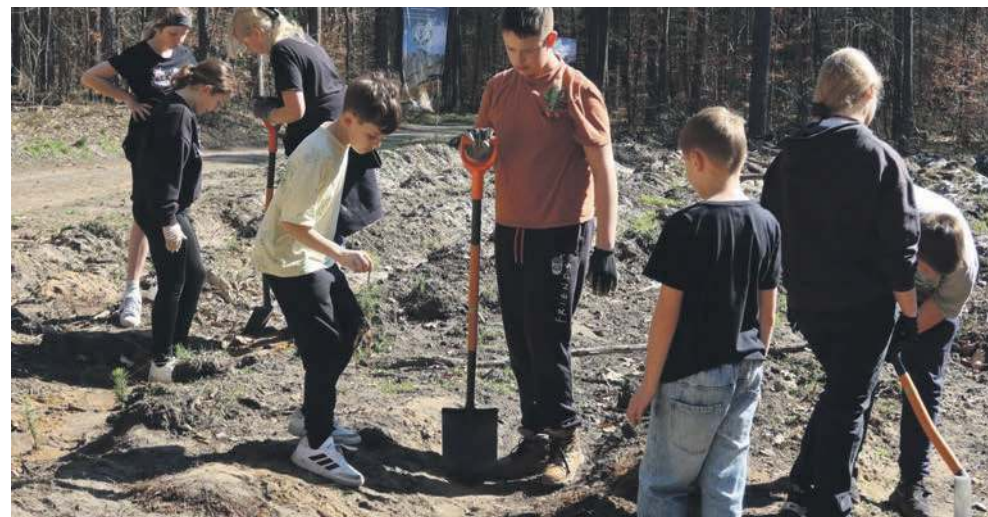
Sadzenie odbyło się przy pięknej, wiosennej pogodzie

- To sadzenie jest częścią ogólnopolskiej akcji „Las na nowe stulecie”. Bardzo nam zależy, by w te działania