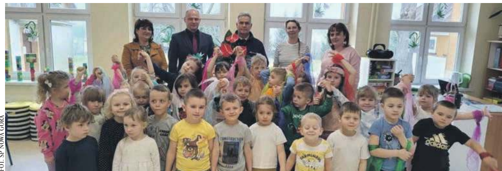
Zadowolone przedszkolaki z Nowej Góry w zmodernizowanych wnętrzach