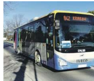
Autobus Małopolskich Linii Dowozowych relacji Chrzanów - Kraków

Pierwszy kurs autobusu linii A42 z Krakowa do Trzebinii docierał bowiem kilkana-