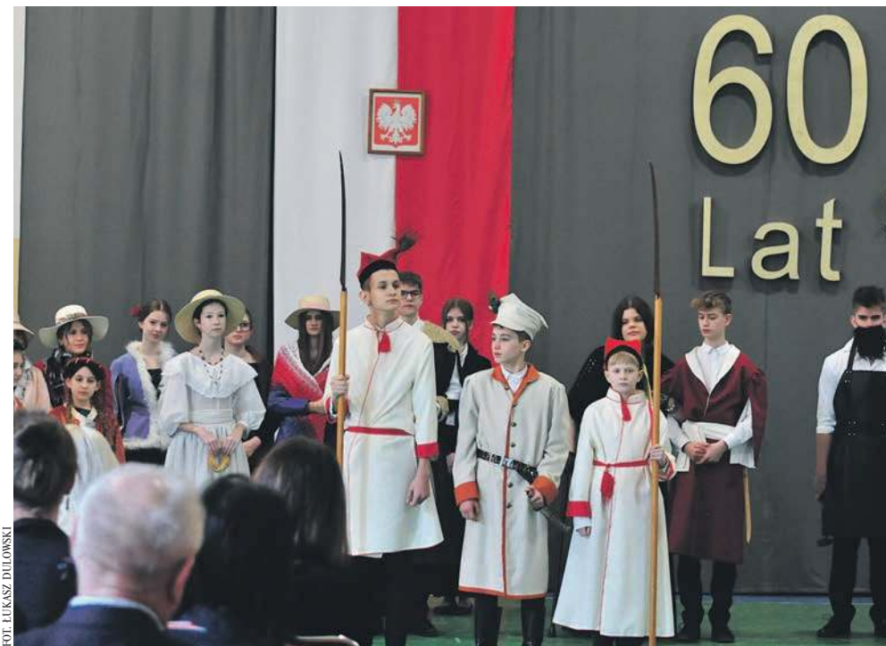
Inscenizacja scen z Powstania Kościuszkowskiego w SP w Regulicach

- Przy rozbudowie szkoły w Regulicach nie planujemy schronów ze względu na kosz-