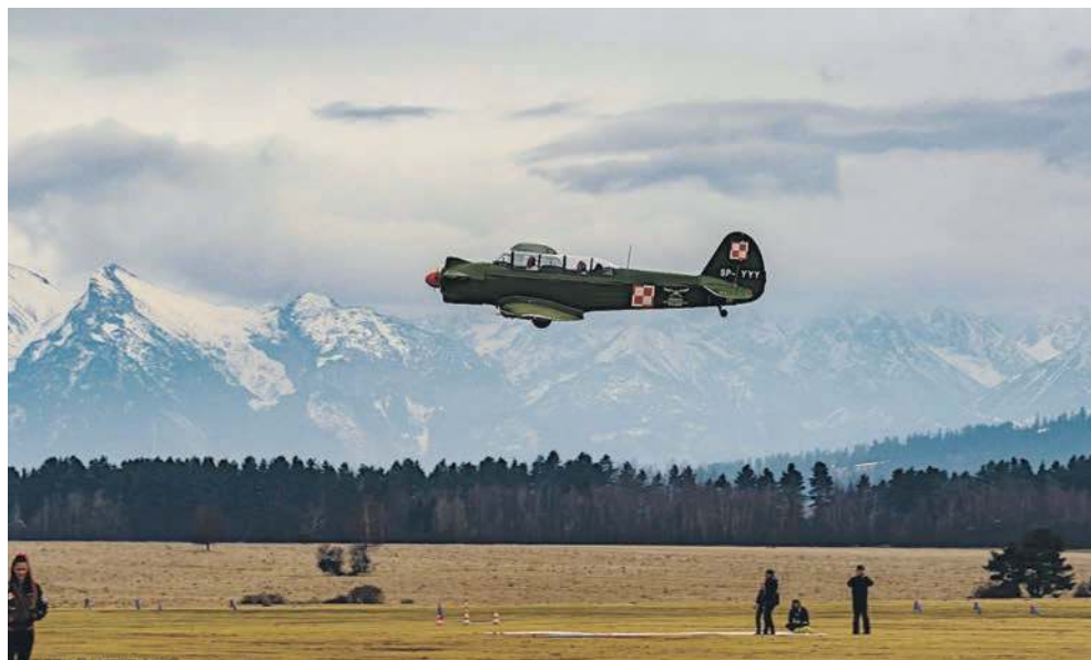
JAK-18 na lotnisku w Nowym Targu