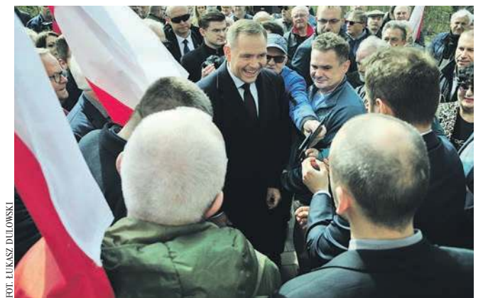
Alwernię odwiedził Karol Nawrocki, jeden z kandydatów na urząd Prezydenta RP

- Konferencja jest też o bezpieczeństwie cywilnym państwa polskiego, którego nie uda się zbudować bez patronatu przyszłego prezydenta RP nad ochotniczymi strażami pożarnymi i Państwową Strażą Pożarną. Ta sieć OSP to nie tylko dziedzictwo kulturowe, ale także realna, codzienna, ciężka praca strażaków ochotników dla naszego wspólnego bezpieczeństwa - podkreślił Nawrocki. - Wydawało się normalne, że rząd zjednoczonej prawicy wspierał rozwój ochotniczych stra-