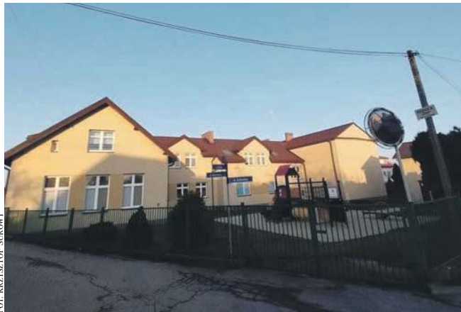
Rozbudowa szkoły w Ostrężnicy to jedno z planowanych zadań gminy

Drugi wniosek to znacznie większe zadanie. Chodzi o dofinansowanie w wysokości 1,1 mln zł na modernizację boiska treningowego GKS Świt Krzeszowice. Całkowita kwota potrzebna na to zadanie wynosi 3,8 mln zł. Burmistrz chce także złożyć wniosek o dofinansowanie tego zadania do Mini-Materiał Informacyjny - KWC