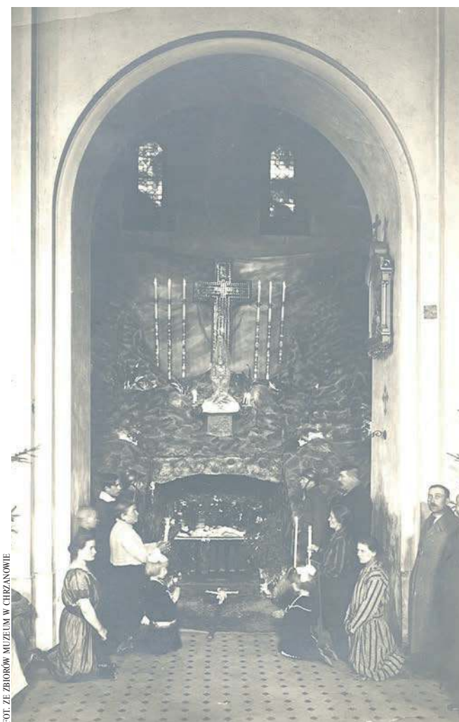
Grób Pański w kościele św. Mikołaja w Chrzanowie