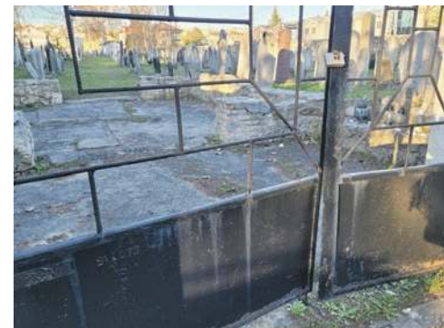
Brama i ogrodzenie trzebińskiego kirkutu proszą o interwencję

Trzebiński cmentarz żydowski przy ul. Słowackiego to jeden z nielicznych zabytków w mieście. Niszczeje. Jego kamienny mur ratowany jest drewnianymi stemplami, a żelazna brama