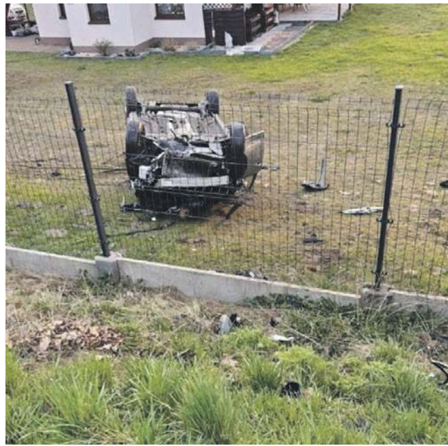
Kierowca opla dachował przy ul. Sobieskiego w Płazie

Odpowiedź przed sądem rodzinnym za prowadzenie samochodu w stanie nietrzeź-