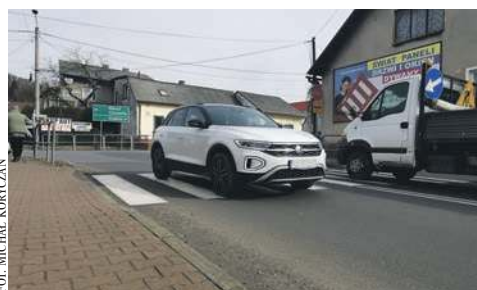
Przejście dla pieszych na ul. Zakopiańskiej w Babicach

- W tym miejscu wielokrotnie dochodziło do potrąceń pieszych. Nie ma co zresztą daleko szukać. W tym roku pojazd jadący od strony Alwerni, skręcał w ulicę Zakopiańską i potrącił pieszego. Kierowca nie był w stanie go zauważyć, bo pieszy wszedł na pasy zza busa wyjeżdżającego z ulicy Zakopiańskiej. Na szczęście w tym przypadku wszystko zakończyło się na potłuczeniach i siniakach. W każdym razie przejście dla pieszych należałoby przesunąć o przynajmniej