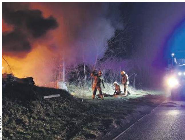
(E) Pożar w Zalasiu

To nie jedyna akcja strażaków OSP Zalas w tym dniu. W ubiegły czwartek doszło również do pożaru traw w rejonie oczyszczalni ścieków. Do pożaru traw doszło też w ubiegły poniedziałek przy ul. Bukowej.