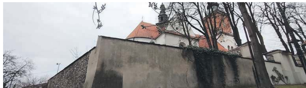
Może w tym roku uda się w końcu wyremontować mur klasztorny w Alwerni

XVII-wieczny klasztor bernardynów jest najcenniejszym obiektem sakralnym w gminie Alwernia i całym powiecie chrzanowskim. 55-metrowa wieża dzwonnica została dobu-