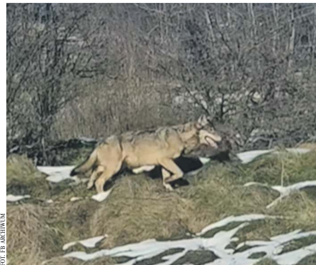
(ES) Wilk widziany w Zalasiu

Mówi, że ich liczba z roku na rok rośnie nie tylko w okolicy Zalasia, Rudna czy innych miejscowości. Rośnie w całej Polsce. Kiedy natkniemy się na wilka, radzi nie wykonywać gwałtownych ruchów. Lepiej spokojnie stanąć i powoli odejść.