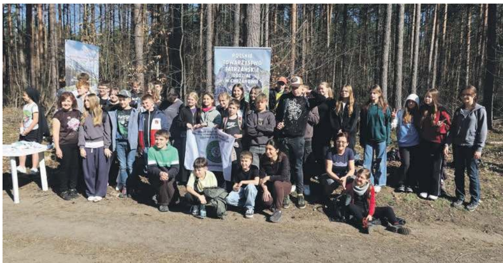
Uczestnicy akcji. Więcej zdjęć i wideo można obejrzeć na przelom.pl

Członkowie szkolnych kół PTT posadzili 600 sosen w lesie w Chrzanowie w pobliżu kamienia wyznaczającego środek powiatu. Akcja odbyła się pod patronatem „Przełomu”.