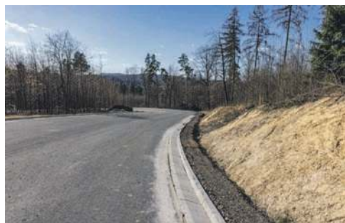
Nowa nawierzchnia na serpentynach na trasie Alwernia - Grojec