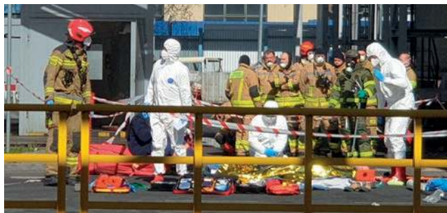
Ćwiczenia Wspólny Patrol-25 w rafinerii Orlen Południe S.A w Trzebini

Taktyczno - specjalne ćwiczenie Wspólny Patrol-25 zorganizował wojewoda małopolski wraz z podległymi mu służbami. Jeden z epizodów - atak terrorystyczny z użyciem improwizowanego ładunku wybuchowego zawierającego materiał promieniotwórczy (tzw. „brudna bomba”) - rozegrał się w rafinerii.