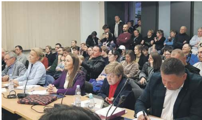
Na sesji pojawiła się spora grupa mieszkańców. Na www.przelom.pl publikujemy wideo z emocjonalnej dyskusji

li więc do tematu na nadzwyczajnej sesji. W planie obrad był jeden merytoryczny punkt - uchylene uchwały w sprawie zapobiegania tworzenia w gminie ośrodków dla nielegalnych imigrantów. Przed nadzwyczajną sesją odbyło się posiedzenie komisji skarg, wniosków i petycji. Trójka radnych z komisji zaopiniowała negatywnie uchwałę o uchyleniu uchwały o imigrantach. Propozycja burmistrza zawiązała więc na włosku. Słyszając stanowisko komisji, poprosił on o przerwę, a po wznowieniu posiedzenia - zdjęcie z porządku obrad wprowadzonego przez siebie projektu kasującego stanowisko dotyczące ośrodków dla imigrantów. Po kilkudziesięciu minutach sesja zakończyła się niczym.